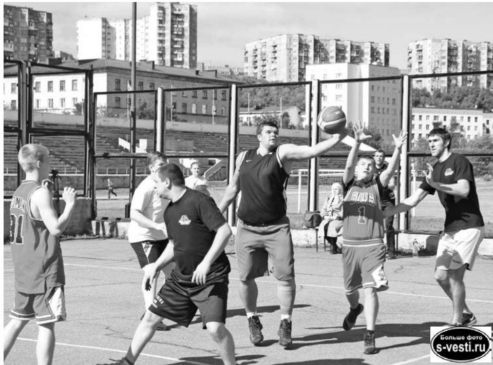
Игре все возрасты покорны, особенно, если погода хорошая.

В тот же день на том же стадионе состоялся IV чемпионат Мурманской области по пляжному волейболу.