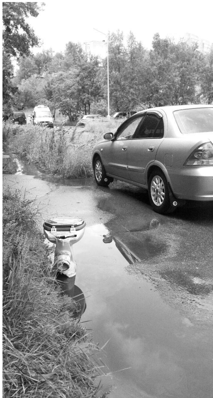
Максим Токарский: «Парковка экстрас класса! Ул.Сивко, 1А».

Минимальный размер фотографии - 800x600 пикселей. Принимаются только авторские снимки. Пояснительные