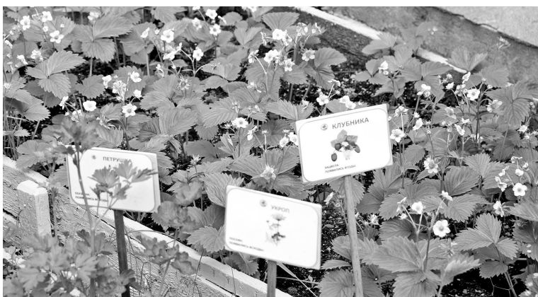
Больше фото s-vesti.ru