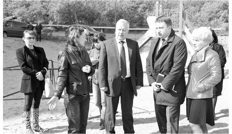
Городские власти ремонт детской площадки на Сизова обещали не затягивать — уж слишком короткое северное лето.

Вывоз разуконплектованных автомобилей во время городского рейда стал летней тради-