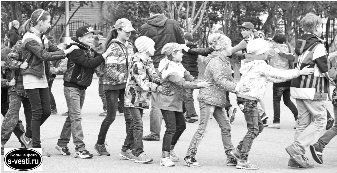
Больше фото s-vesti.ru