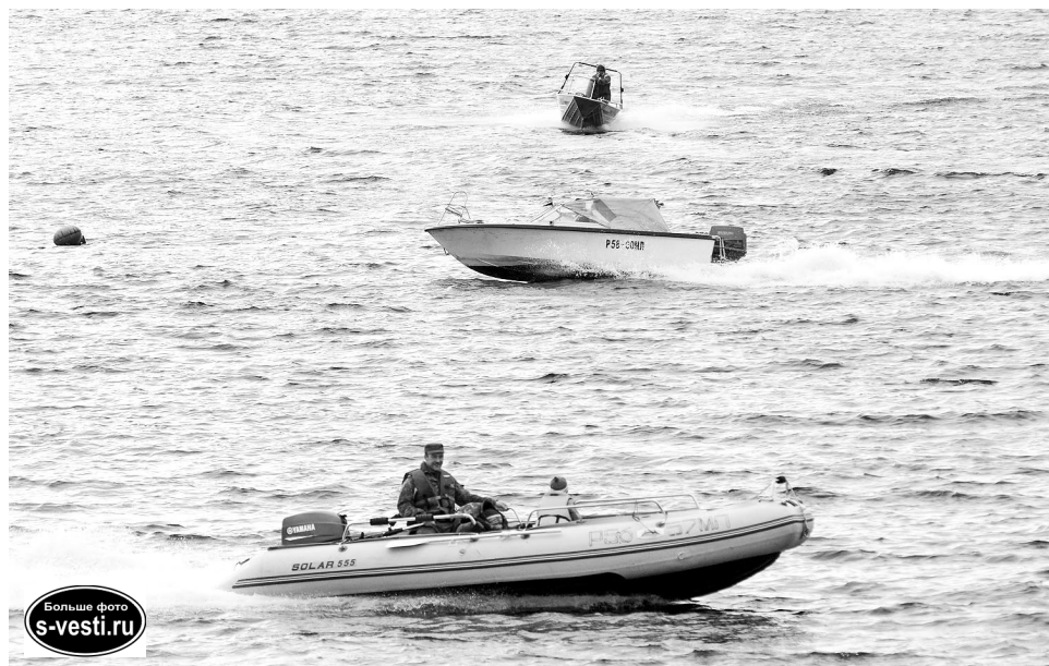
Покорители морской стихии.