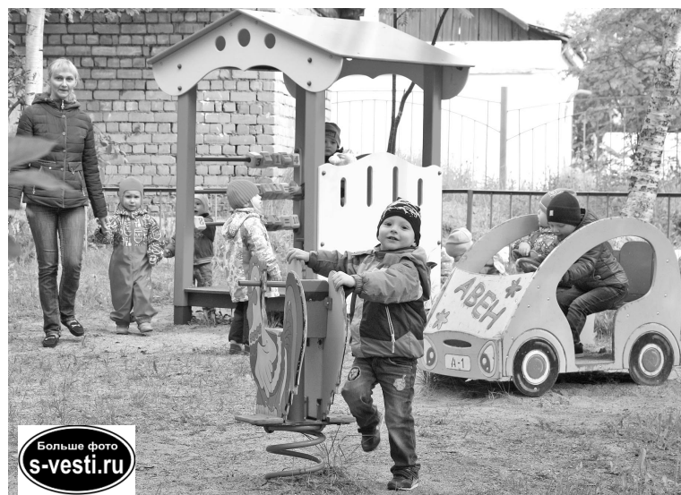
Маленькие гости из группы «Теремок» (д/с №30) быстро освоились в «Сказке».