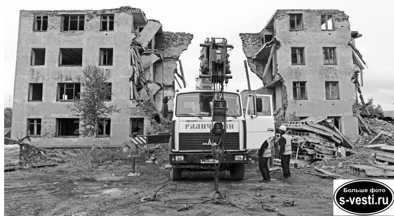
Снос домов стал возможен благодаря специальной экологической программе и совместному финансированию из областного и местного бюджетов.