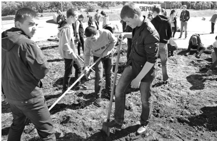
Ребята из трудовой бригады СШ №12 не только оформили клумбы, но и убрали территорию вокруг «Алеши».