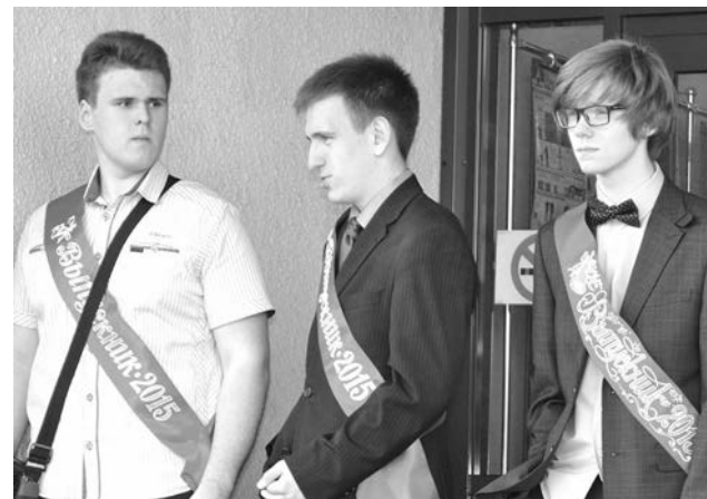
На пороге взрослой жизни...