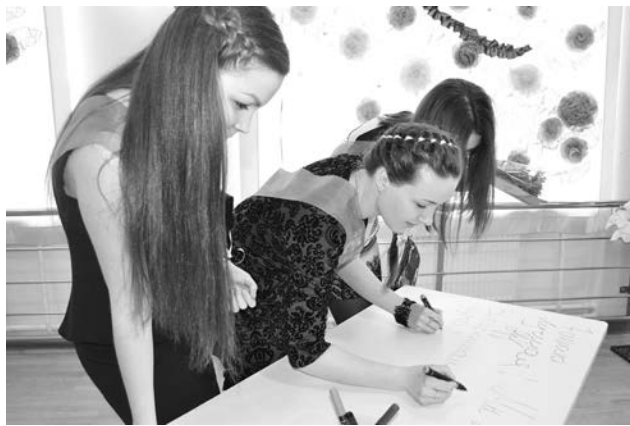
Рисовать на партах запрещалось все 11 лет, а на выпускном - приветствовалось!

Еще ребятам предложили написать пожелания городу и сверстникам прямо на партах, выставленных для этого в фойе ДК. Неожиданностью для виновников торжества стало приглашение в антракте на площадь перед ДК, где они смогли, загадав сокровенное, повязать на деревья ленточки - для будущего исполнения. А вот желание заядлых меломанов и фанатов урбан-соул (душевной городской музыки) было исполнено в тот же вечер: для выпуск-