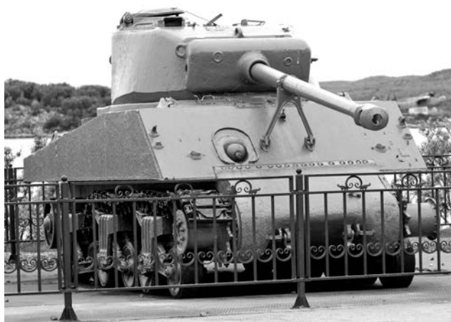
Пролежав 69 лет на дне Баренцева моря, «Шерман» снова в строю... мемориальном.