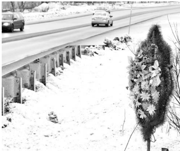
Венок на дороге: память об ушедших близких или модный ритуал?

Сооружение подобных знаков на тех же дорогах действительно отвлекает водителей от управления автомобилями, – пояснил