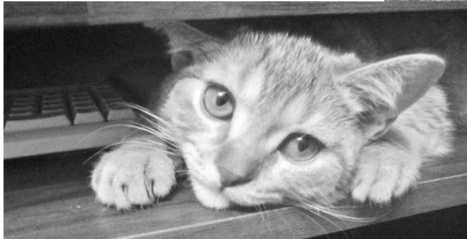
Дарья Романова: «Наш кот Хакслер, или просто Хакс, любит куриную печень и шалить по ночам».