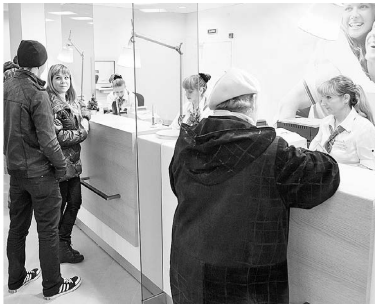
Непосредственное общение с оператором у клиентов Сбербанка по-прежнему в приоритете.