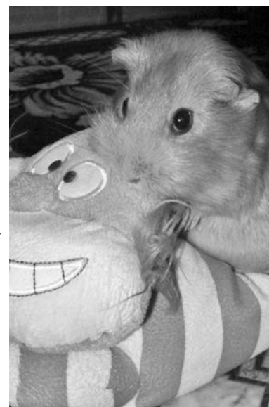
Морская свинка Муша Ульяны Горпинич - настоящая фотомодель: позирует с удовольствием.