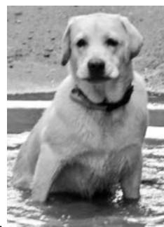
Ольга Радченко: «Это Гуф. Он очень любит купаться, и не важно, что это лужа».