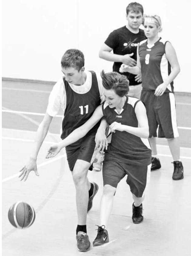
Команда «Юность» вырвала победу у девушек буквально на последних минутах.

морскими командами открыли две игры. В первой команда ДЮСШ-4 (победитель прошлогоднего турнира) уверенно обыграла «Юность» с разгромным счетом 72:24. Вторая игра получилась похожей: «Спасатель» не дал «Сборной города» ни единого шанса. Счет игры - 96:35.