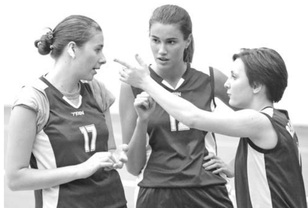
Сборной женщин не хватило запасных игроков - под конец игры команда выдохлась.