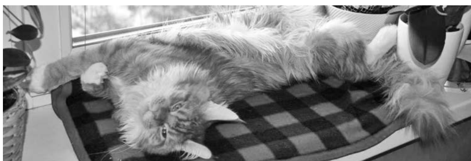
Людмила Лаврухина: «Марсик - главный цветочек на подоконнике».