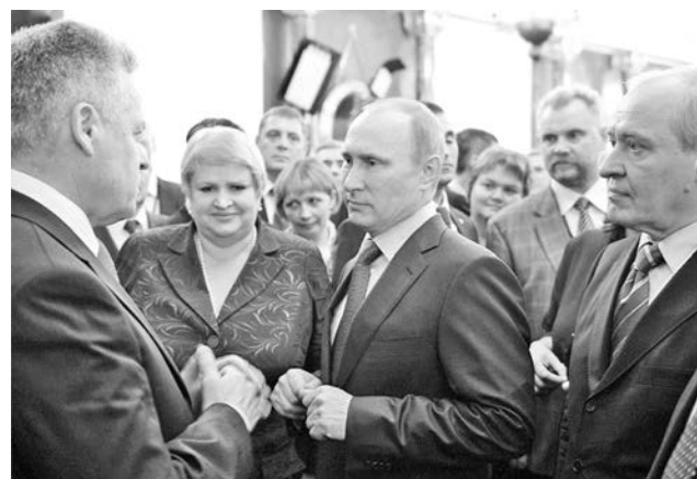
Президент РФ Владимир Путин в Суздаль приехать не смог, но пригласил делегатов в Кремль на обстоятельный разговор.