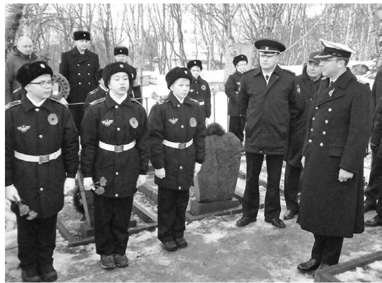
Юные североморцы удивили британских дипломатов военной выправкой и хорошим английским.