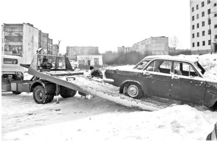
Во время выездной проверки в Малое Сафоново прошла «юбилейная» - тридцатая - эвакуация автохлама.