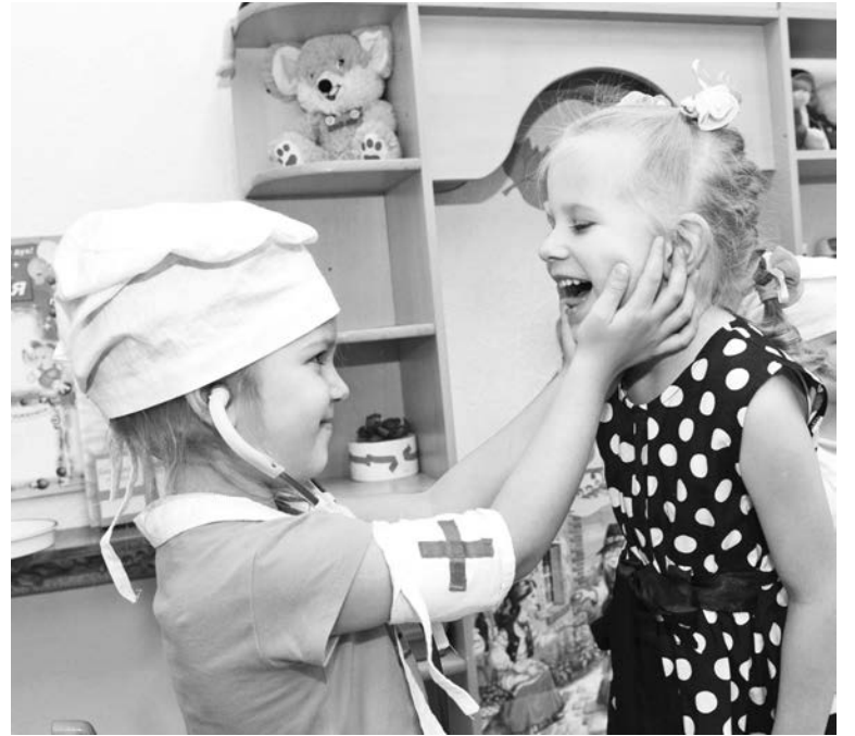
В д/с №31 в больницу играют со знанием дела: оздоровительным процедурам здесь уделяют особое внимание.