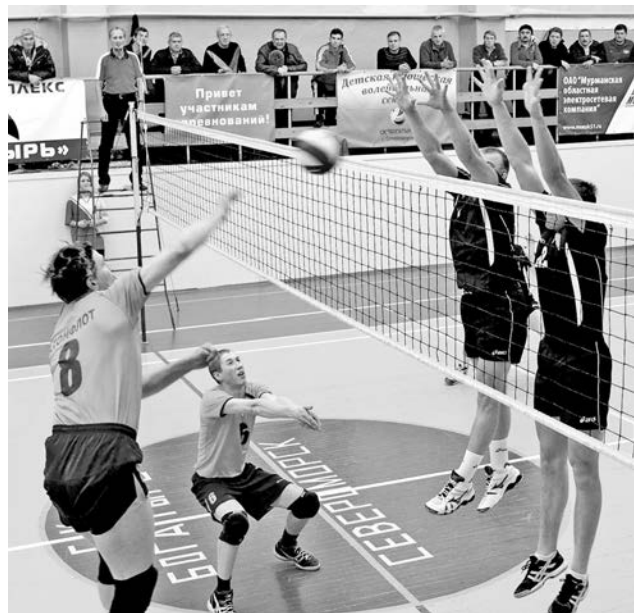
Североморцы были хороши и в защите, и в нападении.

В воскресенье прошла игра 1/4 финала Кубка Мурманской области по волейболу между командами Североморска и Мурманска.