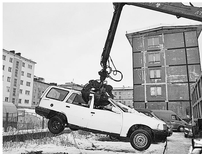
Во дворе домов №2 и 4 по ул.Сгибнева освободелось парковочное место - в действии муниципальная программа утилизации автохлама.