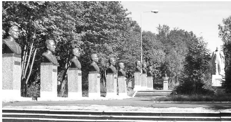
45 лет - не шутка! И Аллее Славы нужна реставрация.