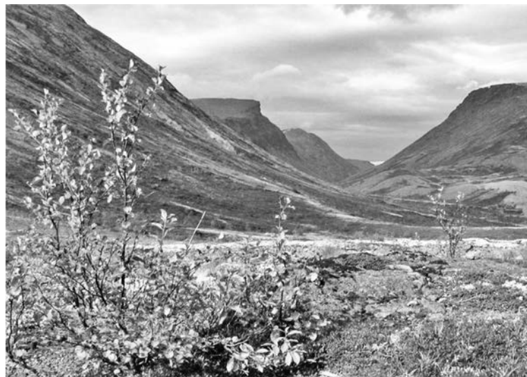
К сожалению, черно-белая фотография не передает ярких красок, которыми изобилуют Хибинские горы, – придется поверить нам на слово.

Спуск в долину с перевала казался бесконечным. Только преодолев его, мы вышли из