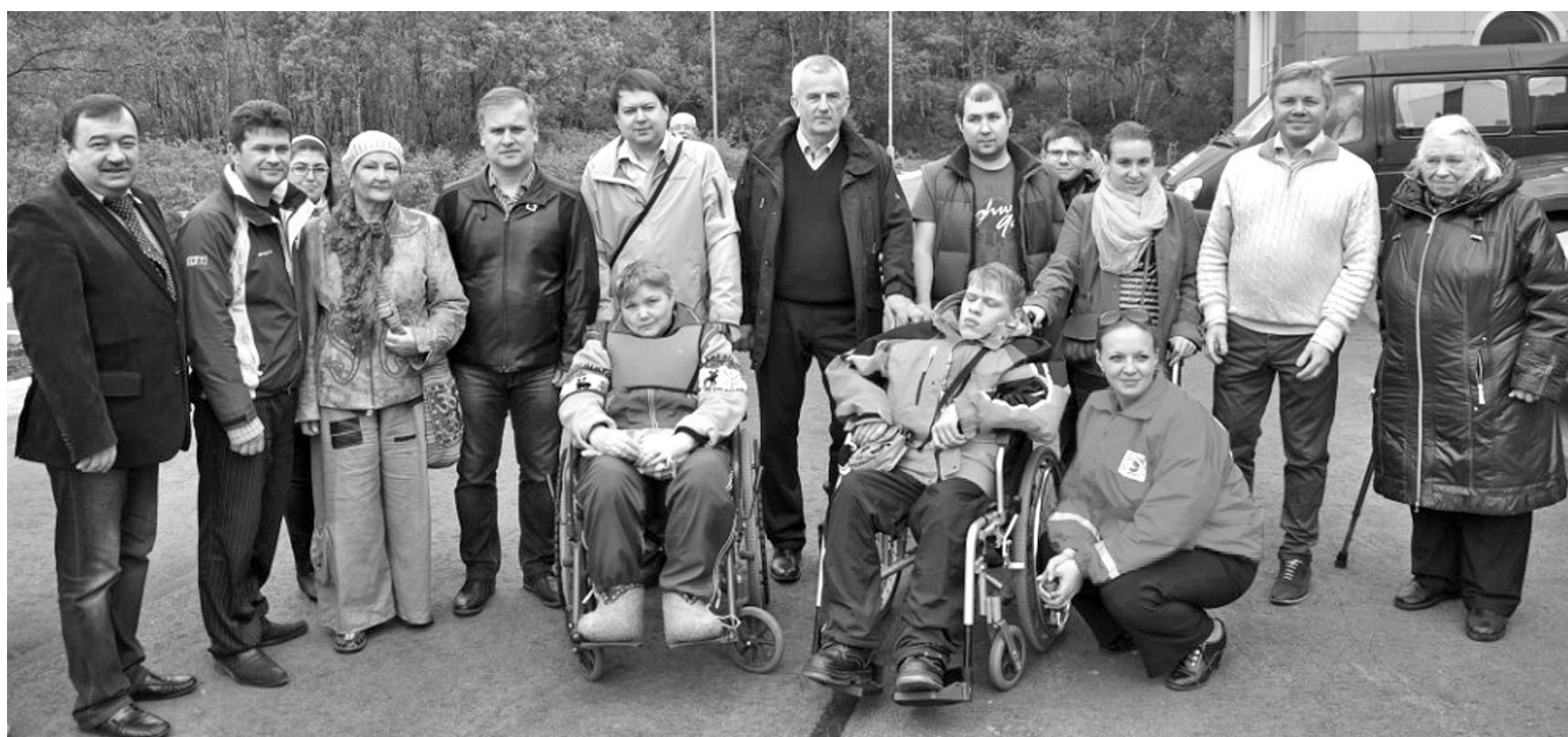
Каждая поездка для участников проекта «Люди на колясках» сулит встречу с друзьями и приятные знакомства.