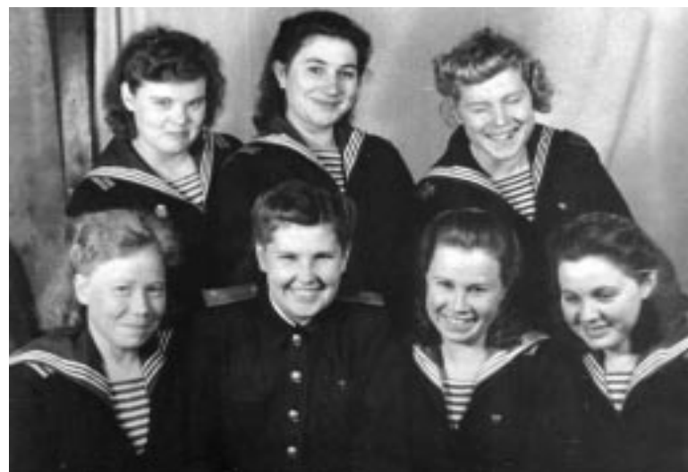
Служивницы Златы из школы сержантского состава. Даже война не могла стереть улыбки с лиц девчонок.

Елена ЯКУНИНА.