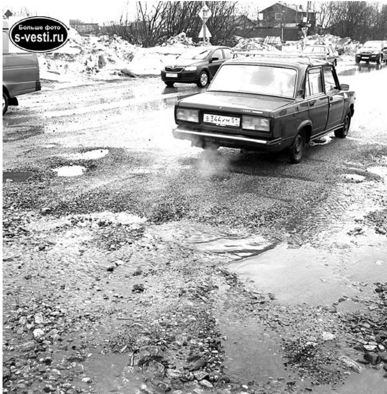
На этом участке дороги (ул. Мурманское шоссе) вместе со снегом сошел и асфальт.

— Этот участок находится в черте города, и мы не можем ждать, пока кто-то возьмется за ремонт. Находите общий язык с обслуживающей организацией, добивайтесь ответа, — обратился к руководителям Комитета по развитию городского хозяйства и ГЦ ЖКХ глава ЗАТО. — Не последует реакции — будем решать вопрос через губернатора, Министерство обороны. А пока прошу «Автодорсервис» взять участок на контроль, регулярно подсыпая щебень, который в качестве помощи городу готов вы-