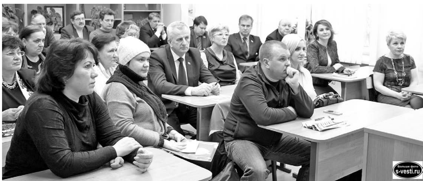
Первая встреча оказалась не очень многолюдной, но достаточно продолжительной.

глашены жители ул.Сафонова, 1-17, Сивко, Душенова, 7/8-13, Кирова, Гаджиева, 10, 12, 14. Свои вопросы пришедшие адресовали в первую очередь своим депутатам. А проблем, которые волнуют горожан, достаточно: качество горячего водоснабжения, отлов бродячих собак, непосильные счета за электричество, самовольное распоряжение предпринимателями придомовой территорией, проставление общедомовых приборов учета тепла, строительство муниципального физкультурно-оздоровительного центра, благоустройство городского парка и При-