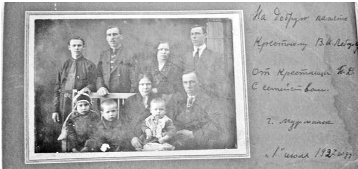
Одна из самых старых и ценных семейных фотографий. 1927 год.