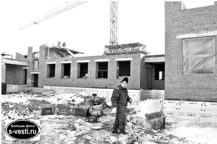
Совсем скоро у строящегося детского сада появится второй этаж.