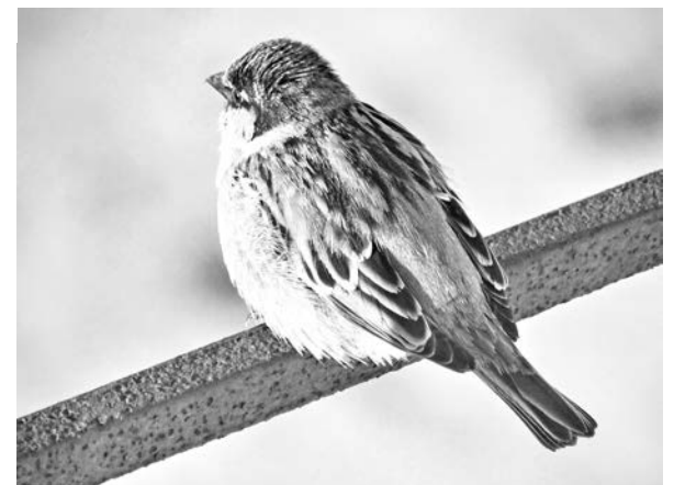
Весенние снимки Сергея Дерябина.