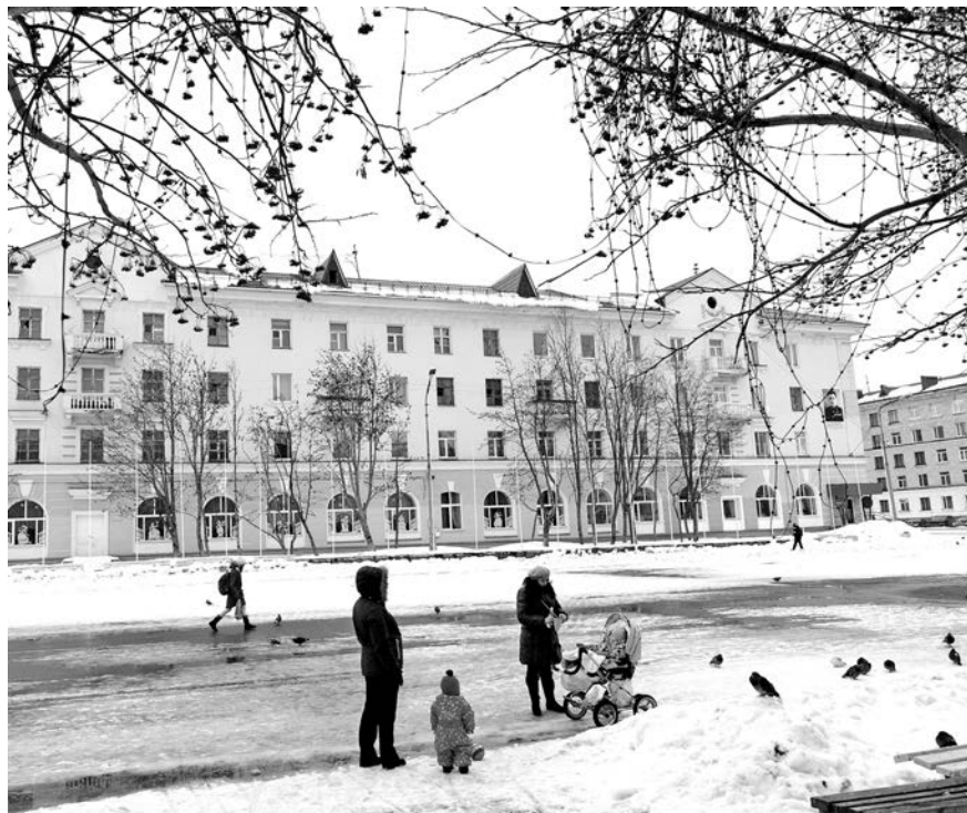
Любимое место прогулок североморцев - ул.Сафонова.