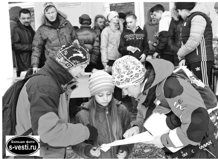
Инструктаж перед выходом на маршрут.