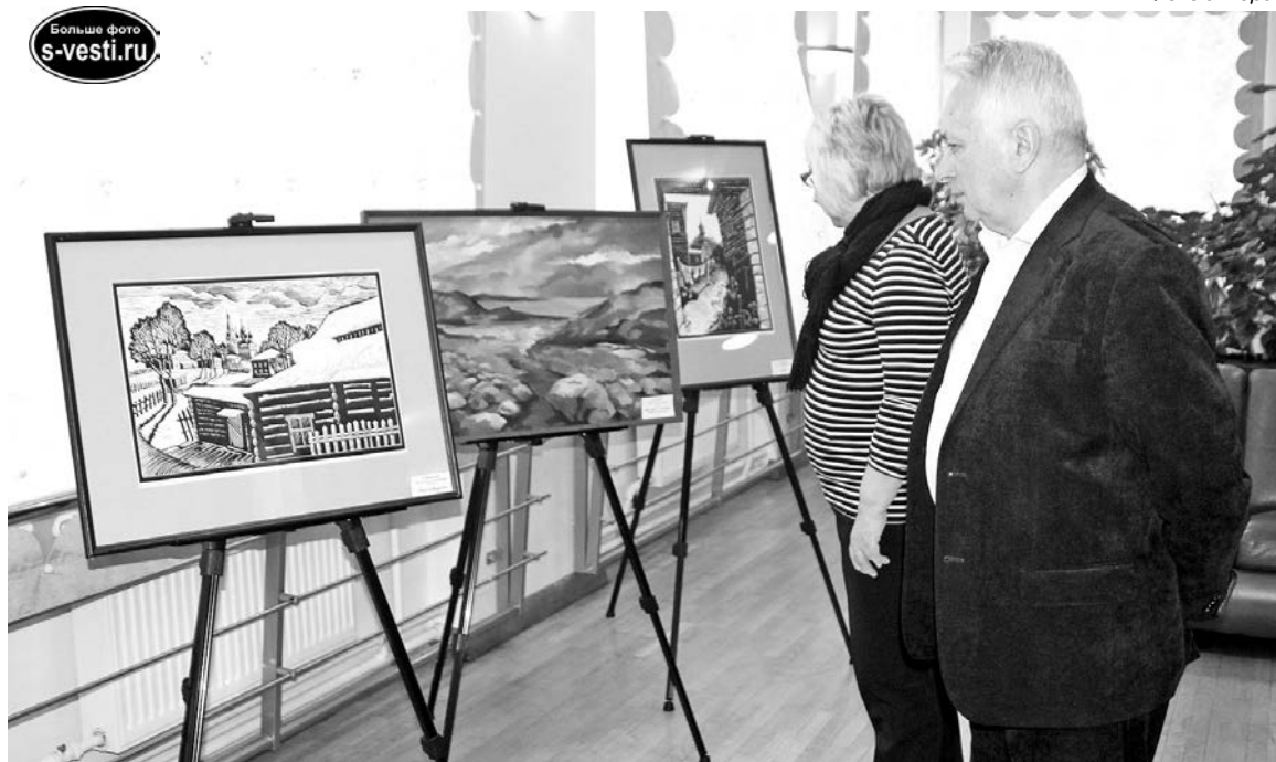
Перед началом гала-концерта зрители с удовольствием рассматривали работы лауреатов номинации «Художественное творчество».