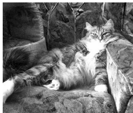
Мария Громова: «Наверное, понятно, кто в доме главный?.. На фото мисс Муся».