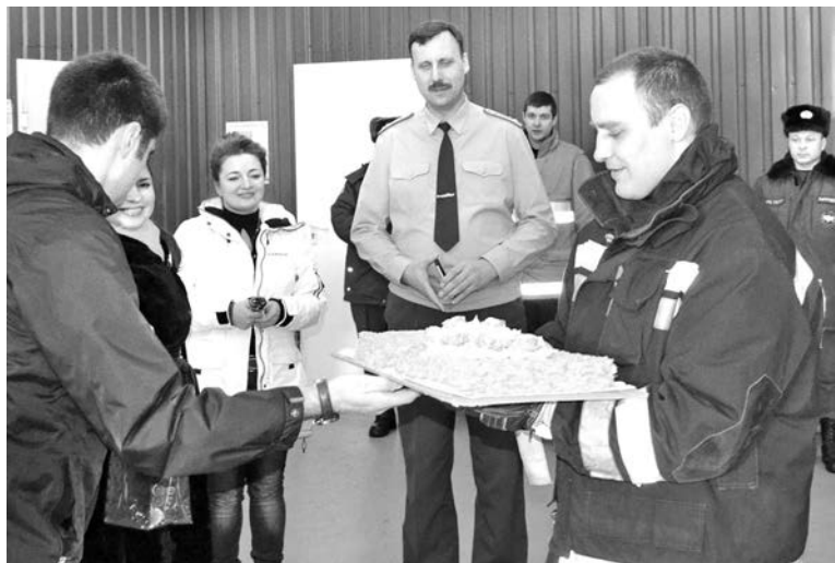
Как известно, в уставах сладкие поощрения не значатся. Тем приятнее был для спасателей этот сюрприз от чистого сердца.

Ирина КУЗЬМИНА.