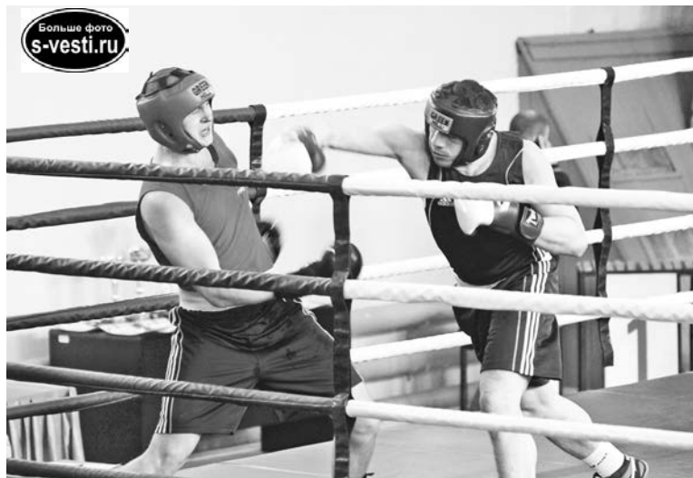
Большинство боксеров работали жестко, и немало боев чемпионата завершилось досрочно.