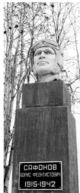
Авторы бюста Б.Ф.Сафонова - скульптор Э.И.Китайчук и архитектор А.А.Шашков.