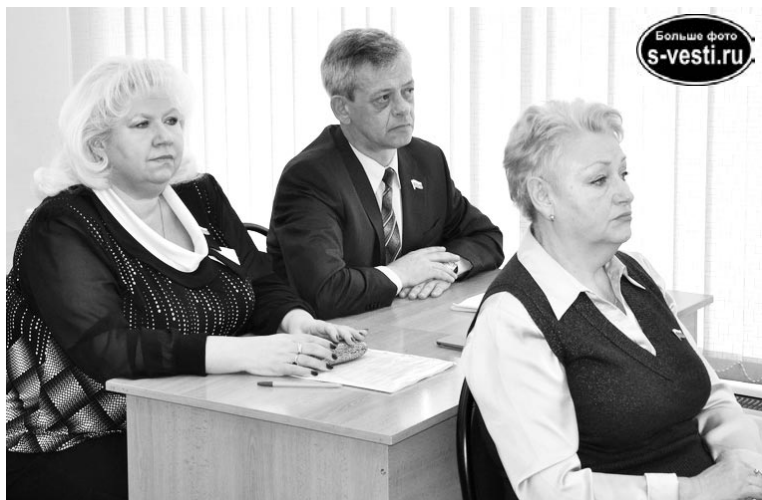
На сентябрьских выборах количество депутатов горсовета увеличится до 25 человек.