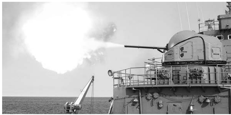
Проведение артиллерийской стрельбы.