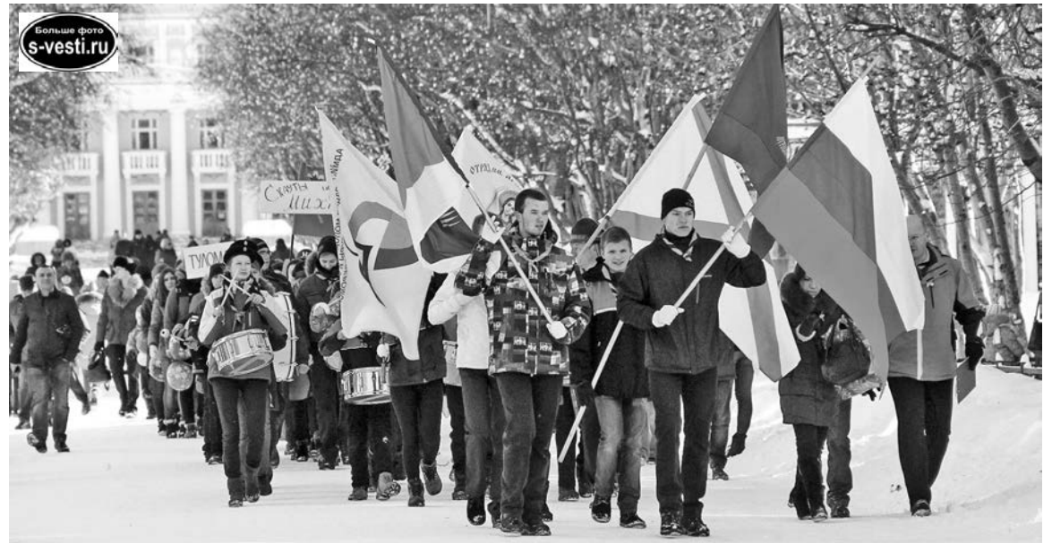
10-летие скаутского отряда им.Архангела Михаила из Росляково праздновалось с размахом.

Анастасия ЧЕРНИКОВА.