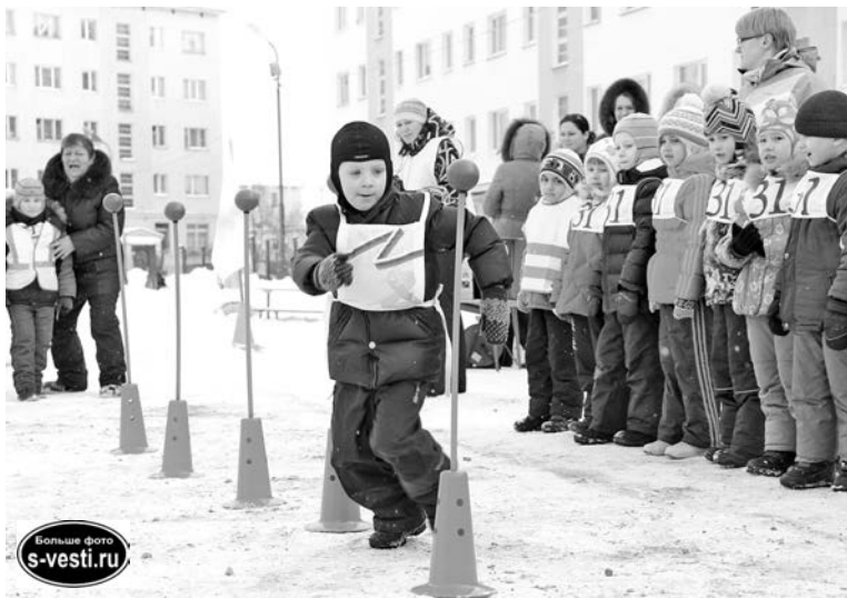
К спортивным соревнованиям юные олимпийцы отнеслись по-взрослому серьезно.

– Главная цель соревнований – сформировать у детей любовь к спорту, привычку здорового образа жизни. Наша задача сделать так, чтобы все прошло весело, интересно, чтобы спартакиада стала для ребят праздником. А ее результаты – это уже информация к размышлению их наставникам, – рассказала одна из организаторов