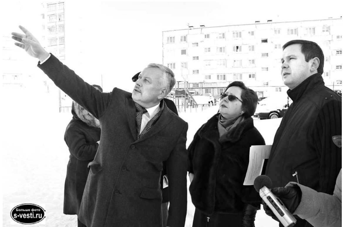
Когда контроль не для галочки, недобросовестным подрядчикам покоя не будет.