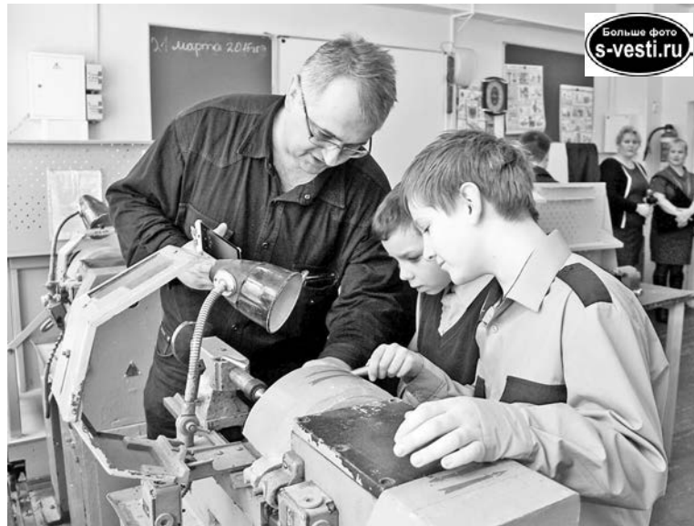
В кабинете технологии родители и дети с интересом изучали трудовое оборудование.

Обязательные предметы в дополнительном компоненте – граждановедение, основы правового культуры и светской этики. Каждый класс проходит основы военной подготовки. В кадетском корпусе расширенная программа по физической культуре, включая специализацию: лыжная подготовка или футбол. К слову, те, кто показывает хорошие результаты в лыжном спорте,