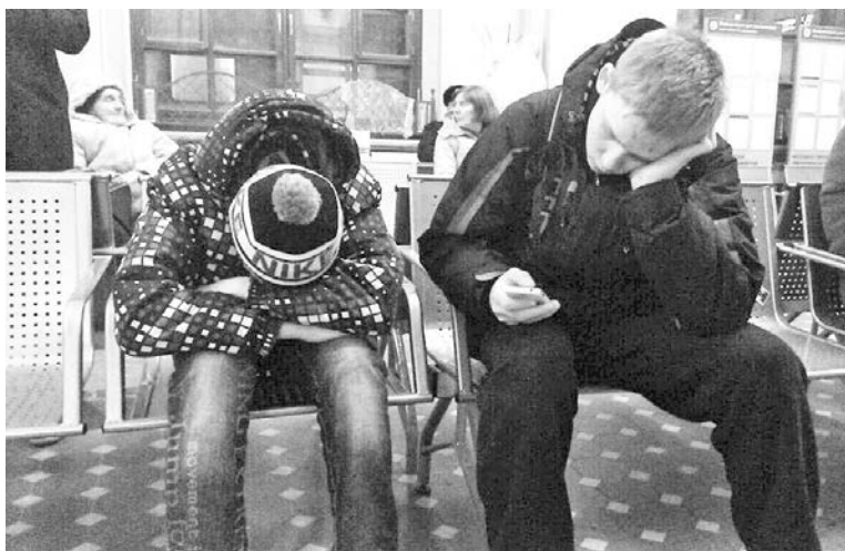
Тверской вокзал: все по инструкции!