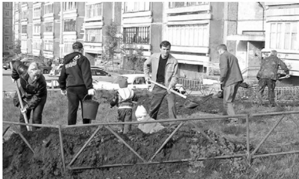
Дружный субботник жителей ул. Корабельной прошлогодней весной.

Записала Иванна МИКИТЕНКО.