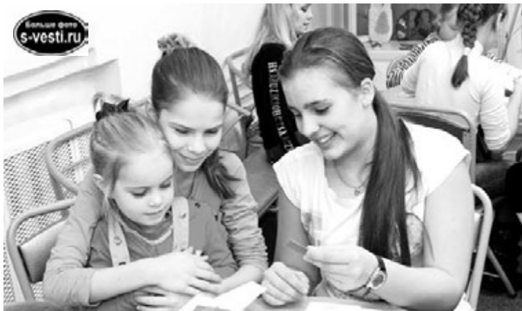
На выставке гости могли и работы посмотреть, и попробовать самим что-нибудь изготовить.

тили внимание на магическую энергию, исходящую от кошки, - и это отразилось во многих языческих культурах и религиях народов мира. Скажем, в том же Древнем Египте, Древнем Китае или в Японии, где сегодня в городе Хитосиме есть даже храм Кошек. Этих животных знали и любили в Древнем Риме, их почитали викинги.