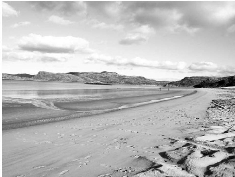
Маящая красота Старой Териберки.

Еще год назад в этой бухте казалось, что жизнь замерла здесь давно, и постепенно северный ветер выдувает всех жителей из поселка. В этом году мы привезли сюда мою пожилую маму из Украины - вдохнуть холодного воздуха Ледовитого океана - и с удивлением обнаружили на пляже Териберской бухты стройку. Здесь, в Старой Териберке, начали строительство турбазы. Даже часов-