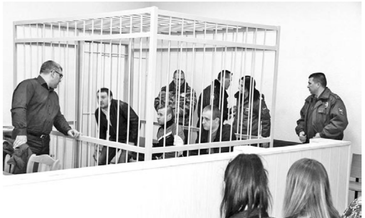
Преступная группа вымогателей в ожидании приговора.