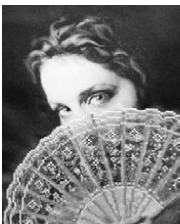
«Дама с веером» (бисер).