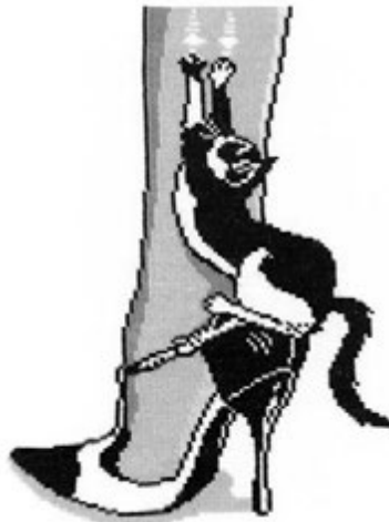
«Массаж для хозяйки» (вышивка), Елена Медведева.