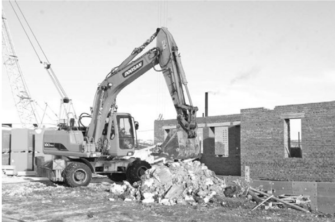
Детсад на улице Кирова примет 220 ребят.