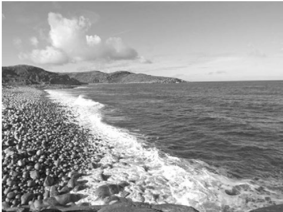
Прогулка по каменным пляжам запомнится надолго.

Кто хочет побывать на краю Земли? Самая доступная для нас возможность - посетить поселок Териберка на побережье Баренцева моря, а значит, и Ледовитого океана.