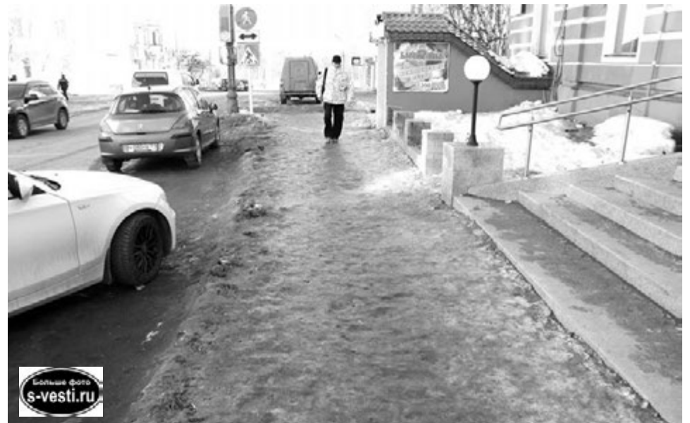
Тротуар вдоль дома по ул. Сафонова, 10 должны были бы посыпать песком и предприниматели (в здании и банк, и бар-магазин), и «Автодорсервис». Но... этого не сделал никто.

Иванна МИКИТЕНКО.