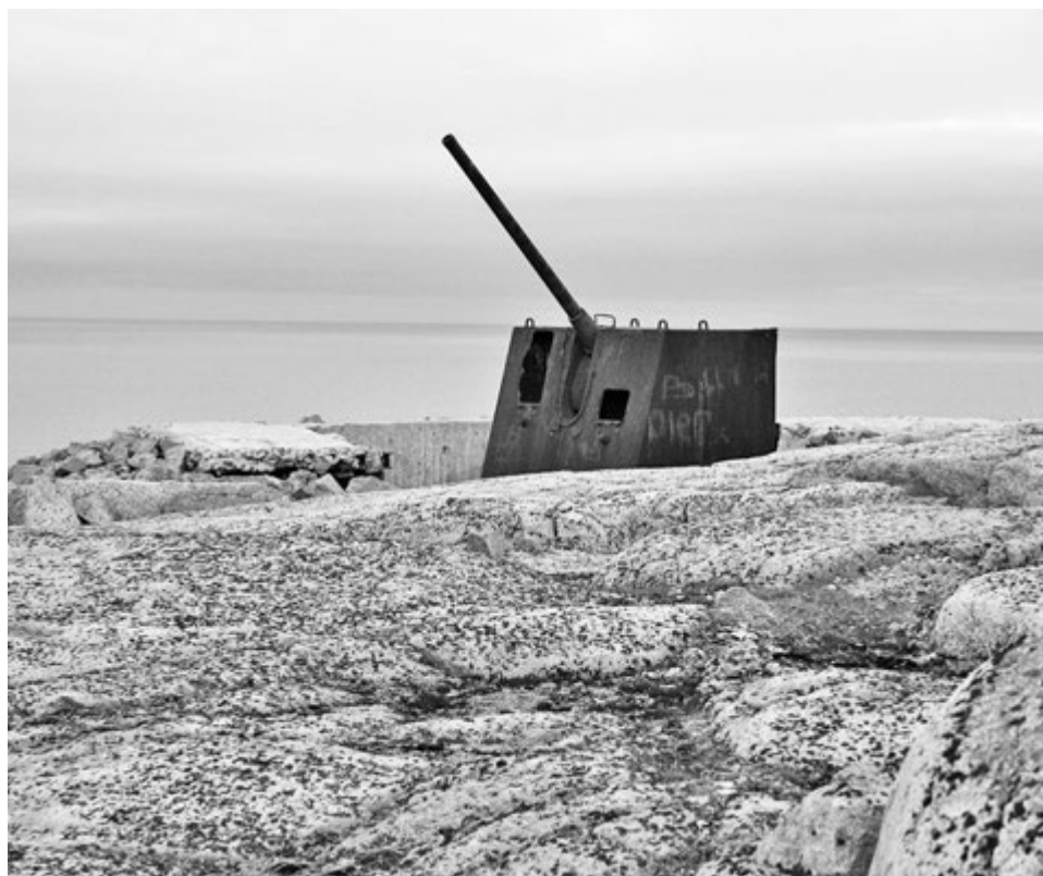
На страже Заполярья.