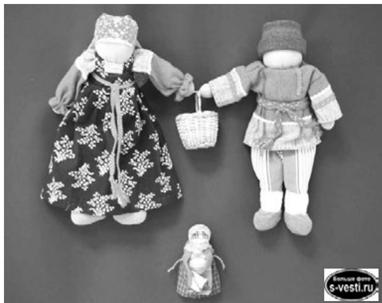
Лоскутные куклы раньше были в каждом крестьянском доме. Сейчас их увидишь только на выставке.