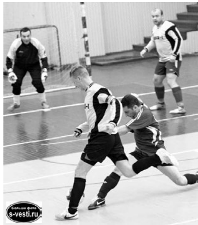
В атаке - «ДЮСШ-1».

Спор футболистов «Труда» и «ДЮСШ-1» вышел не