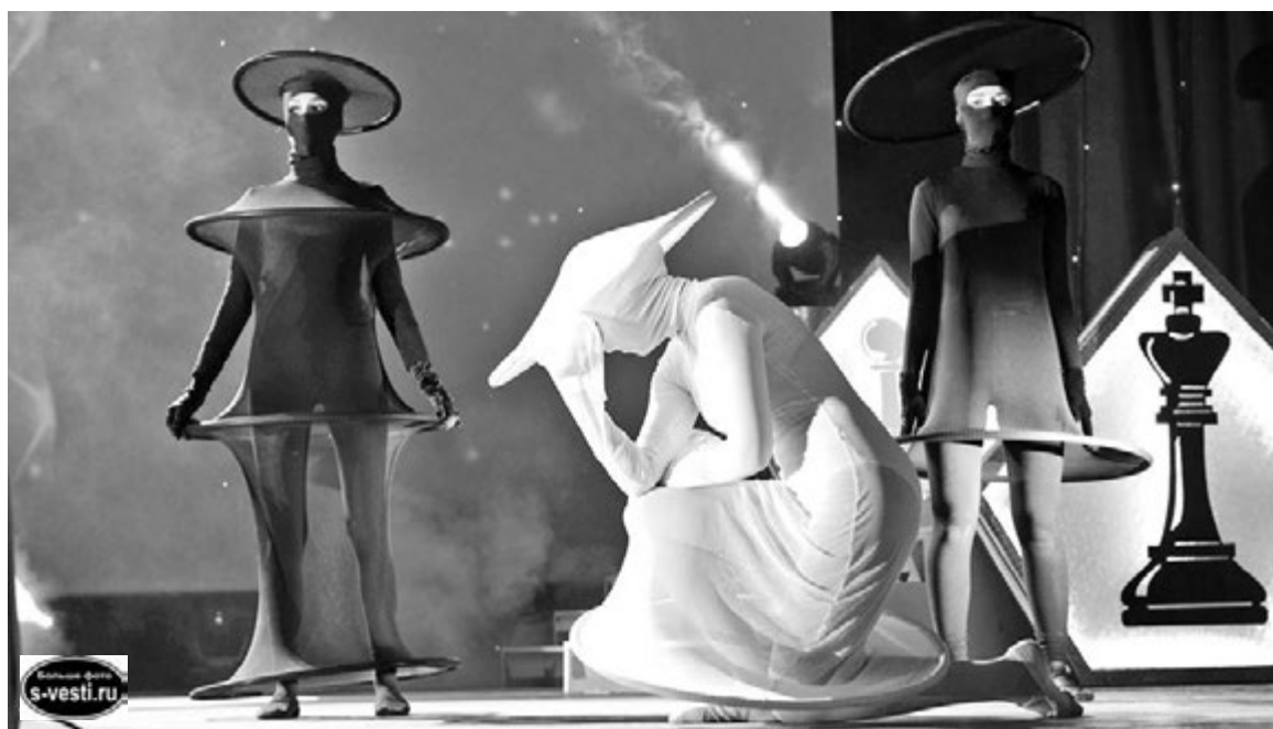
К организации церемонии награждения предпринимателей коллектив ДК «Строитель» всегда подходит творчески.