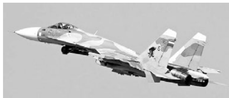
Истребитель корабельного базирования Су-33.

душные силы. Они защищают наше Отечество с воздуха. На вооружении ВВС находятся разведывательные самолеты, бомбардировщики, штурмовики, истребители, а также вертолеты. Служба в ВВС горит о высокой доблести и