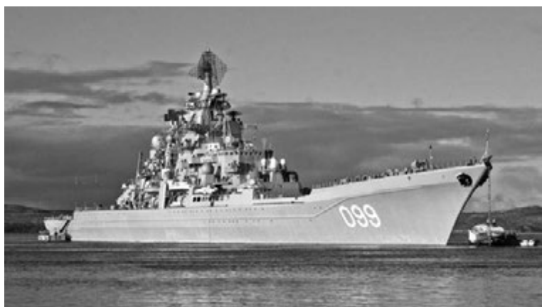
«Петр Великий» - самый большой действующий неавианесущий ударный боевой корабль в мире.

Самый тяжелый бомбардировщик - отечественный Ту-160 (на Западе его именуют «Блэкджек»). У него четыре реактивных двигателя, а взлетная масса при полной загрузке - 275 тонн. При длине 54,1 м и размахе крыльев 55,7 м он развивает скорость 2000 км/ч.