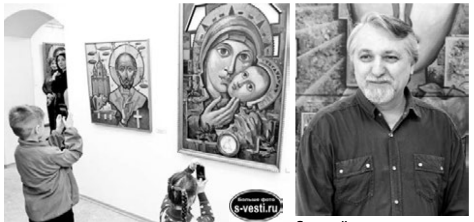
При всей своеобразности картин выставка получилась светлой - дети не дадут соврать.