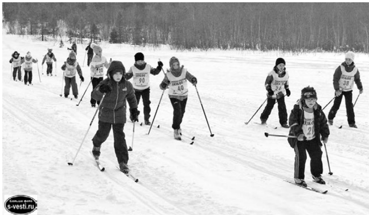
Тренировки перед стартом: в движении вся трасса.