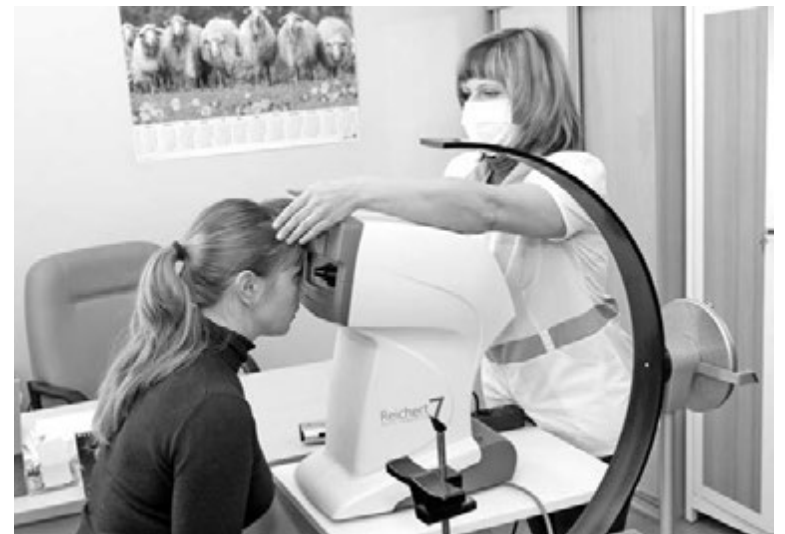
Первые пациенты уже оценили оперативность и безболезненность обследования на пневмотонометре.