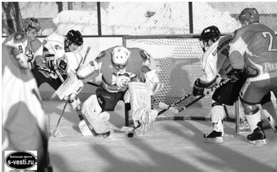
В решающей игре острых моментов у ворот было немало.