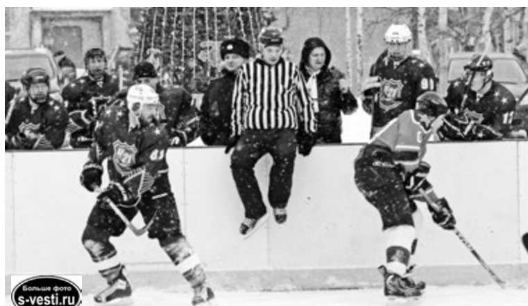
Осторожность - полезное качество для судьи, когда борьба за шайбу идет на каждом метре площадки.

А вот финальный матч за первое место между командами «Альбатрос» (Кольская флотилия разнородных сил) и «Спутник»