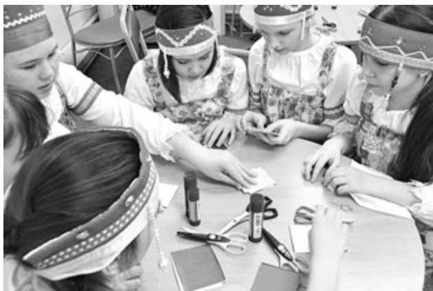
Мастер-класс по изготовлению саамских сувениров особенно заинтересовал детей.

Понятно, что символом нашего города не случайно стала важенка, и Международный день саамов - праздник для патриотов флотской столицы не чуждый. На фольклорном празднике «Здравствуй, солнце!», который состоялся 7 февраля и был посвящен Дню саамов, о наиболее ярких хранителях национальной