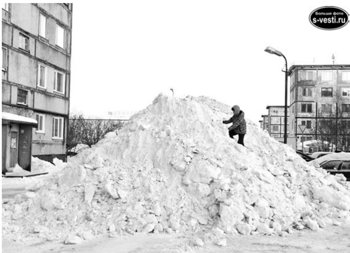
Снежные горы во дворах радуют только детей, взрослые с ужасом ждут весны.