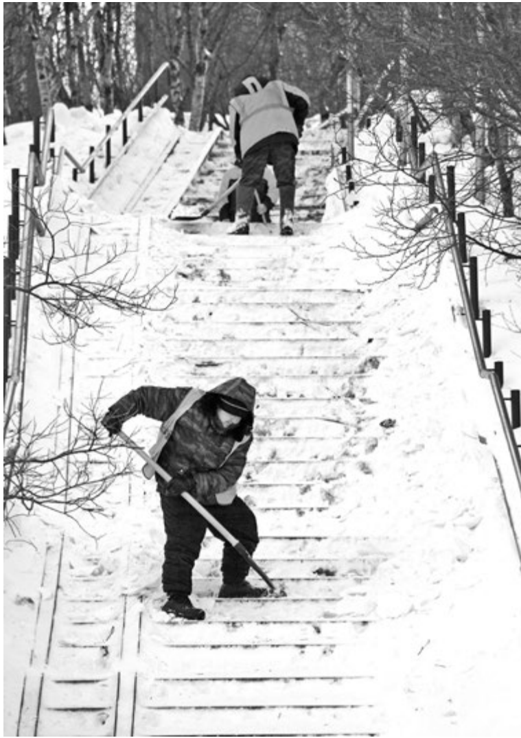
Трап от ул.Полярной к ул.Сафонова в одиночку не осилишь - работают в шесть рук.

До проведения запроса предложений (16 февраля), по итогам которого определится новый подрядчик, ГЦ ЖКХ заключил договор с прежним подрядчиком – ООО «АДС» – на уборку снега. Для справки: согласно ФЗ №44 «О контрактной системе в сфере