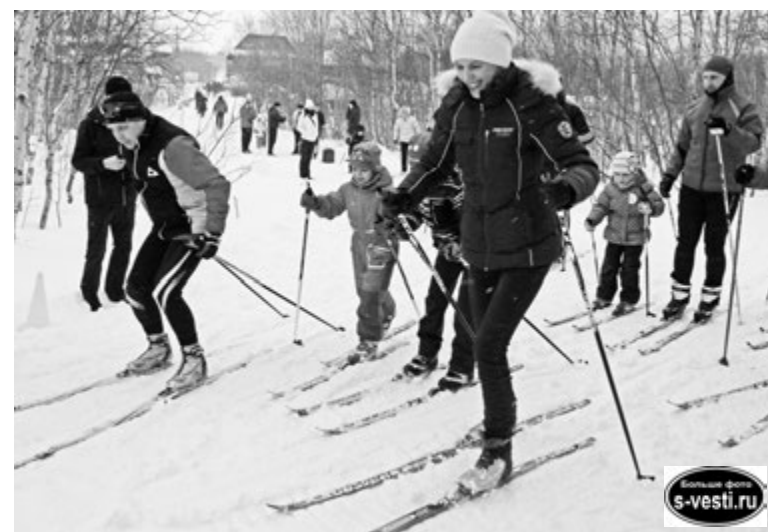
Любовь к лыжам: с детства - и на всю жизнь!