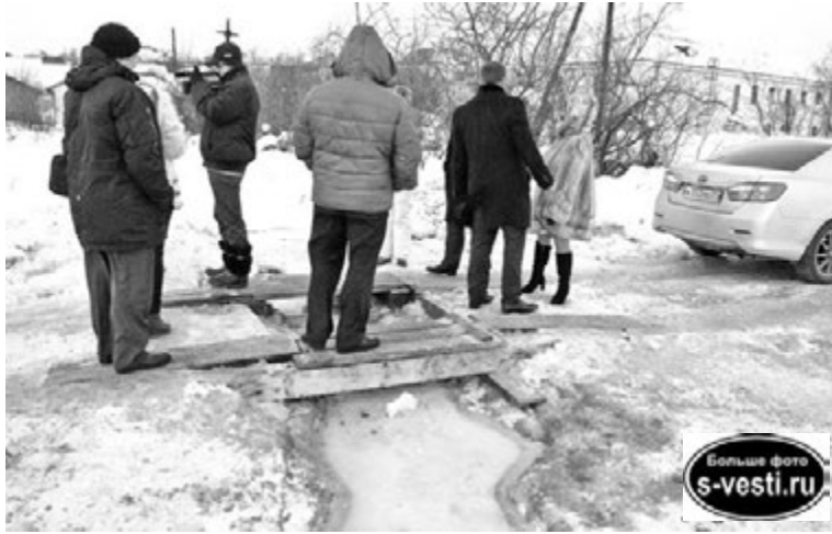
Чтобы не завязнуть в ручье, автомобилисты перекинули через него мостки.