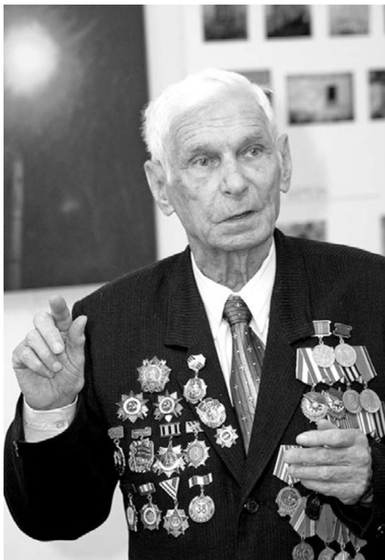
Советский солдат вынес тяжкие испытания, но никогда не станет жаловаться - не та закваска!

Говорят, что в среднем в годы войны пехотинец поднимался в атаку три раза. А дальше был либо убит, либо ранен. Страшная статистика. Алексей Иванович рассказал, что однажды после боя увидел идущего раненого солдата. Спросил у него, из какой части. Оказалось, из батальона, в котором он служил полтора года назад. Начал спрашивать о знакомых сослуживцах, а