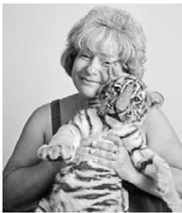
Тигренок из парка львов «Тайган».

Далее маршрут лежал к широко известному грязевому вулкану Азовское Пекло, расположенному неподалеку от поселка Кучугуры. Миновав этот населенный пункт, направились вдоль побережья по проселочной дороге. И, наконец, вот оно, Пекло. Небольшое грязевое озеро располагается в кратере вулкана. К слову, у древних эллинов такие природные образования почитались как дороги в ад.