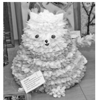
Валерия Ярина, «Котфей» (лепестки искусственных цветов).