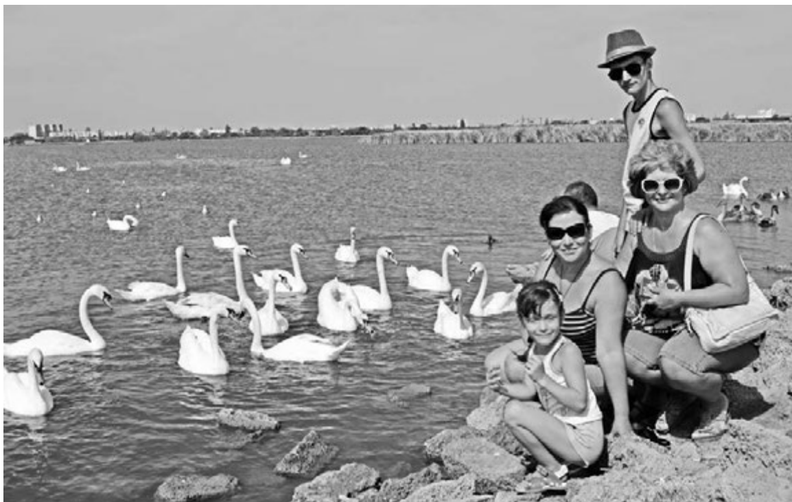
Лебеди на озере Сасык-сиваш по дороге в Евпаторию.