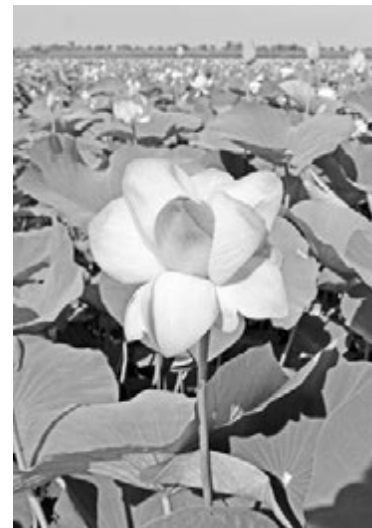
Царство лотосов в Ахтанизовском лимане.