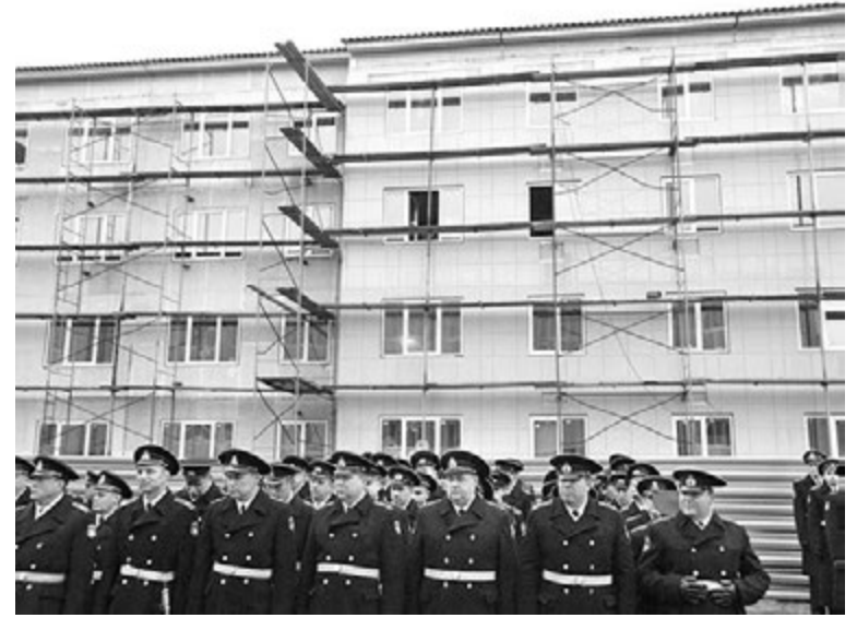
На новый объект по-прежнему требуются рабочие строительных специальностей.

Проектная организация совместно с руководством компании