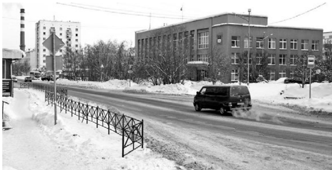
Обращаем внимание: пешеходный переход на ул.Ломоносова, расположенный сразу за поворотом с ул.Душенова, в целях безопасности убрали.