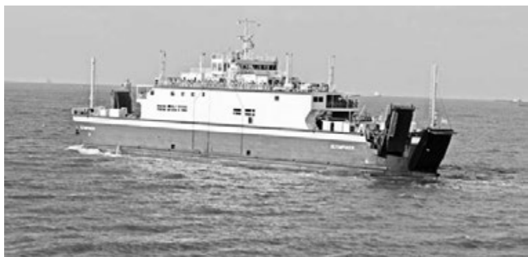
Паром «Олимпиада» курсирует между портами Крым и Кавказ.