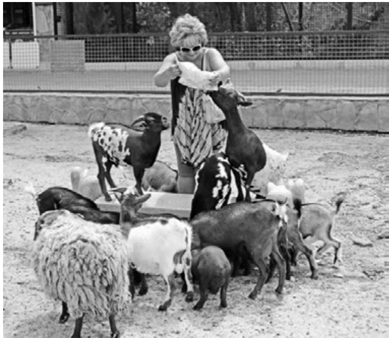
В Бабушкин дворик нужно приходиться обязательно с угощением для животных.

Как же все оказалось красиво: весь лиман был покрыт широкими, чуть ли не в полметра величиной листьями, над которыми устремлялись вверх цветки в 10-15 сантиметров каждый!