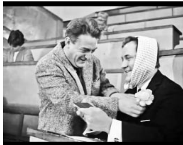
Для кого-то экзамен — всегда праздник, но чаще — серьезная проверка.

И вот сижу в аудитории, что-то чиркаю на листочке, вспоминая, что скрывает первый вопрос билета, и решаю какую-то задачу. Время на подготовку истекло, пора явить результат своих трудов, пусть и скромный. На беду, преподаватель решила убедиться в глубине данных ею знаний, посему выстрелила в меня первым дополнительным вопросом. Мозг, измученный недельной экономической диетой, стал медленно перерабатывать информацию и, едва начав поиск нужной информации, был атакован вторым дополнительным