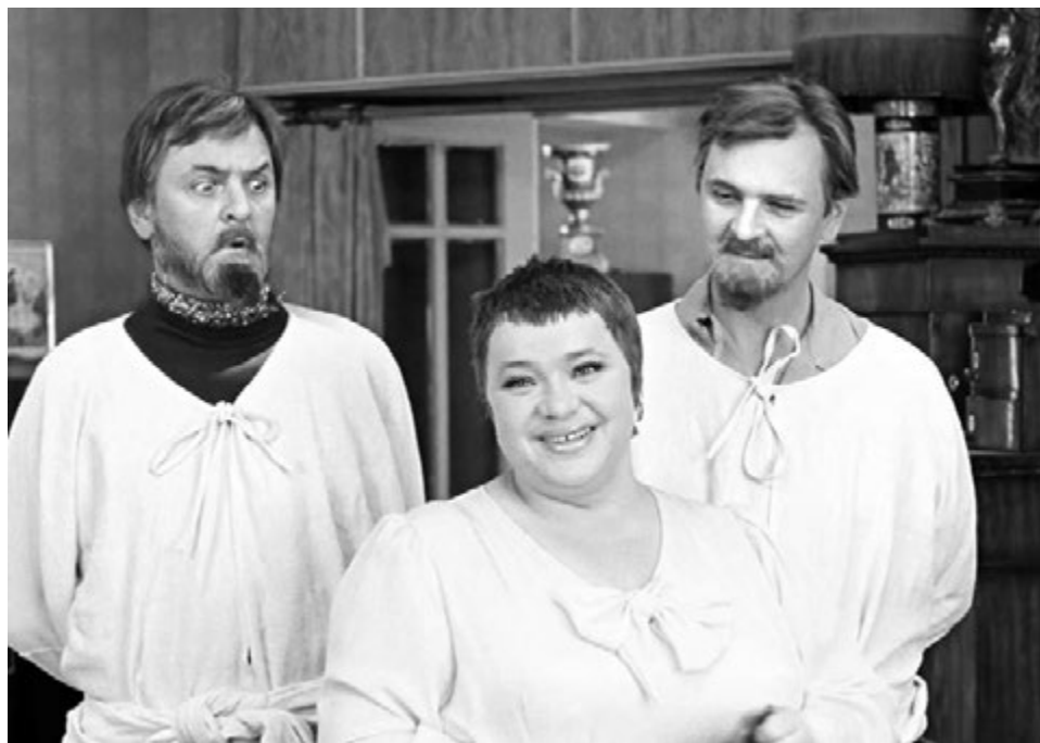
Сумасшествие веселит только в комедии, в реальной жизни совсем не до смеха.