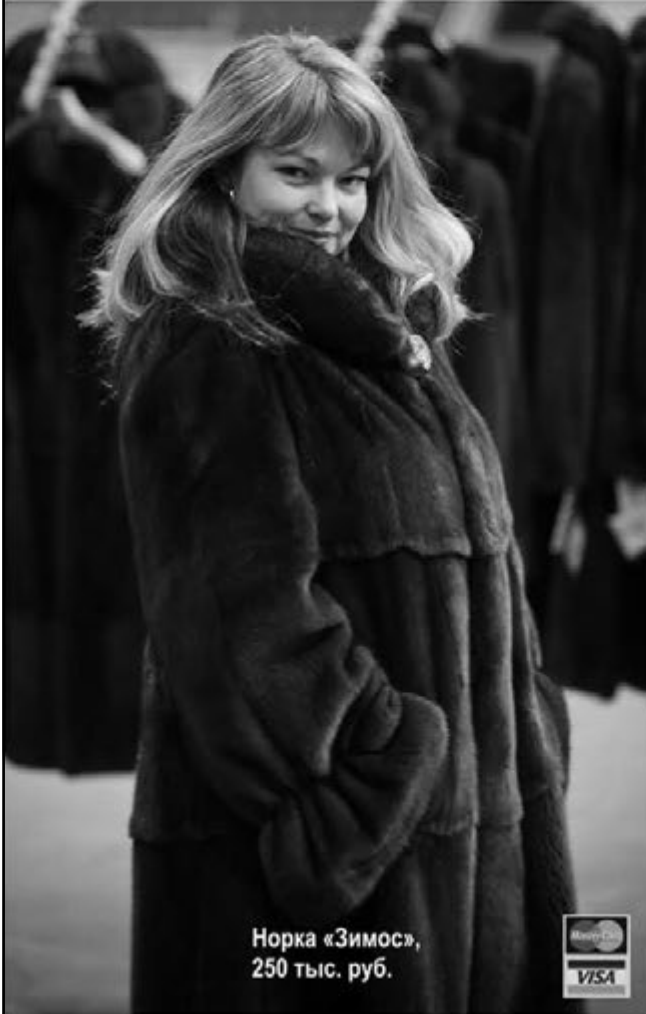
Норка «Зимос», 250 тыс. руб.

Почему норковую шубу надо покупать сейчас и именно на Новоторжской ярмарке