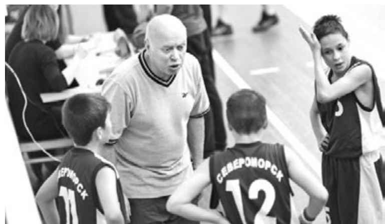
Минутный тайм-аут на разговор с тренером...