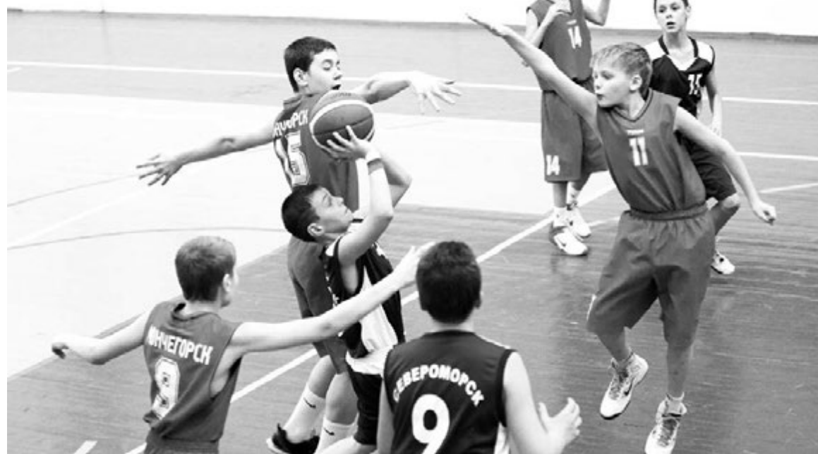
... и команда снова рвется в бой за победу!