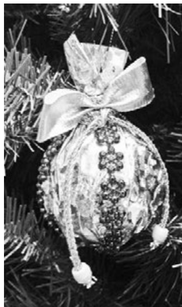
Ёлочный шар Карины Тазиповой (8 лет).