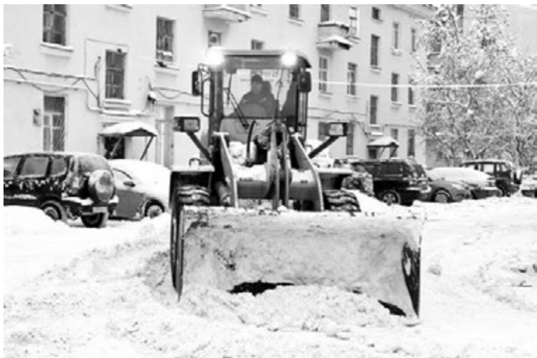
На просьбы убрать личный транспорт со двора, увы, откликаются далеко не все автомобилисты.

- ответил Роман Анофриев. По поручению глав график работ по очистке дворов был составлен в тот же день, и уже к вечеру на домах североморцев появились объявления с просьбой освободить территорию от личного автотранспорта. Ежедневный контроль за процессом очистки города от снега поручили замести-