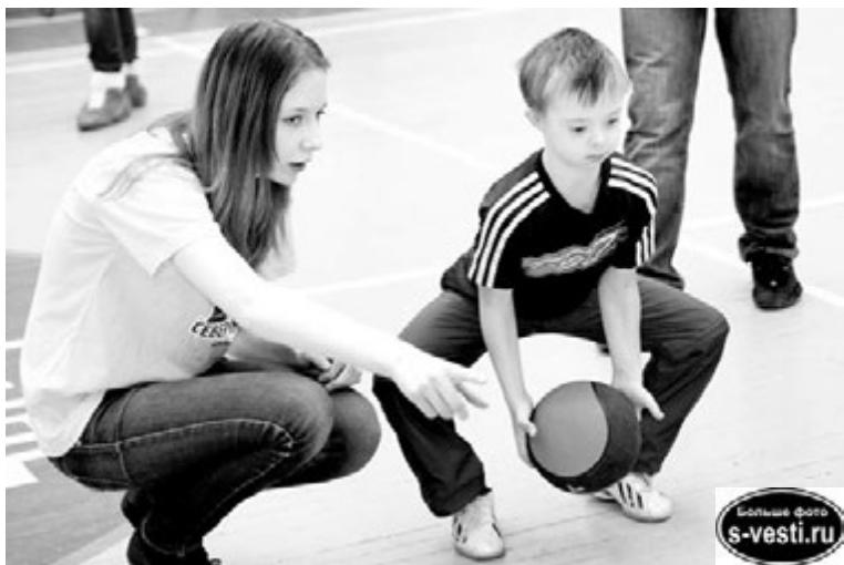
Ребята из городской волонтерской группы поддерживали участников фестиваля во всех начинаниях.

Анастасия ЧЕРНИКОВА.