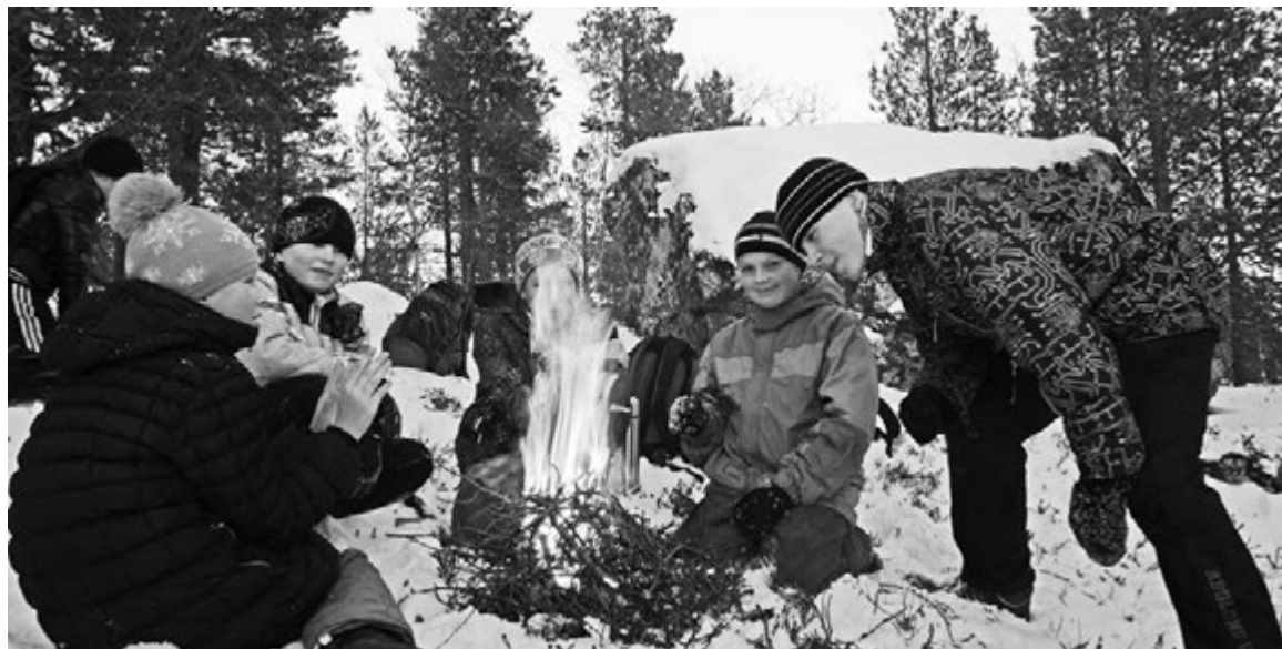
Какой поход без дружных посиделок у костра...