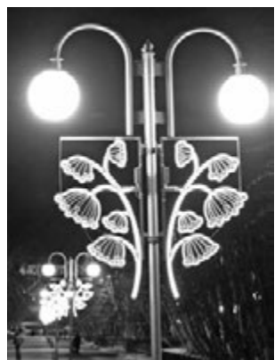
Рябиновые гроздья на ул.Сафонова.

На главной улице ЗАТО на торшерах уличного освещения красуются ветви рябин. А в районе домов №2-3, 4-5, 6-7, 8-9, 10-11 появились светодиодные подвесы с таким же узором. Деревья на ул.Сафонова (от Приморской площади до ул.Ломоносова) в этом году будут оформлены световыми шарами, а на участке от дома №1 до пересечения с ул.Головки их кроны украсят «тающие сосульки». Преобразятся к Новому году и дома №26 и 27. Их фасады совсем скоро будут подсвечиваться. А еще на них появятся светодиодные конструкции «Андреевский флаг» и «Флаг Российской Федерации».