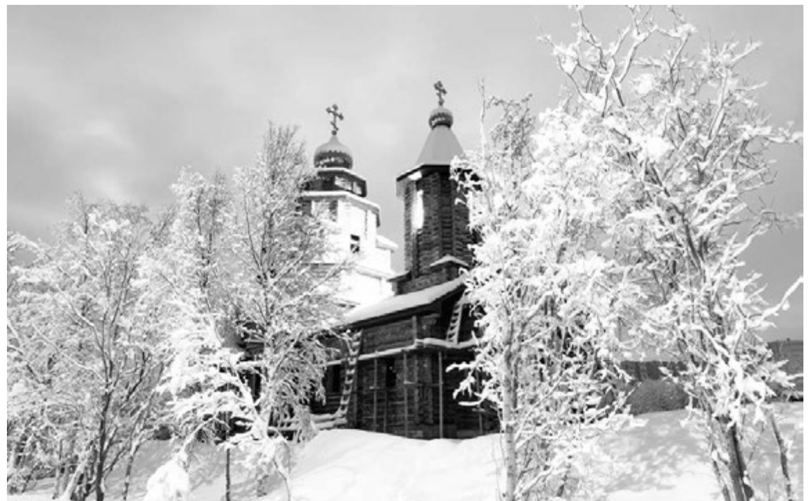
День, когда двери храма св. ап. Андрея Первозванного откроются для прихожан, станет еще одним праздником.