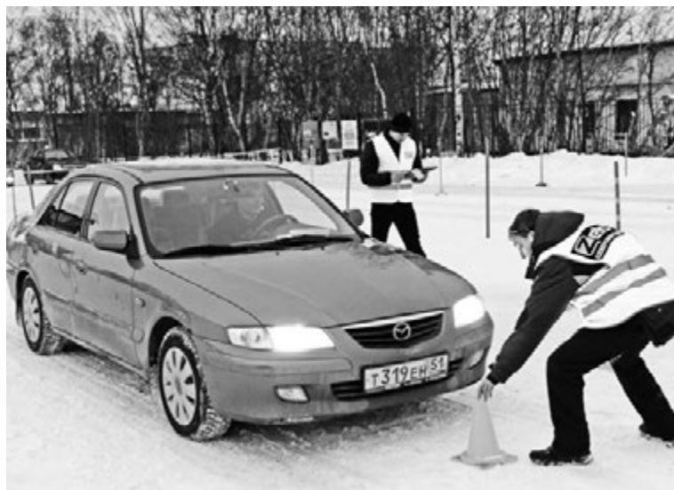
Строгое, но справедливое жюри внимательно следило за выполнением всех упражнений.

К участникам сообщества с радостью присоединились ученики Североморского межшкольного комбината, так что за звание лучшего в этот день рис-