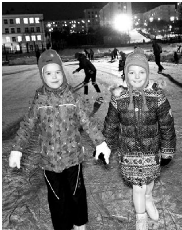
С друзьями на катке вдвойне веселей.