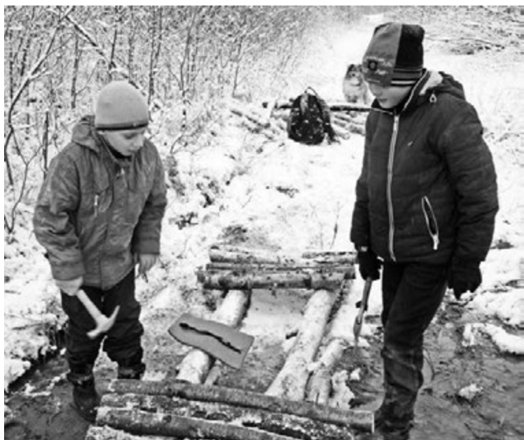
Спасибо, ребята, за мост!

Ирина КУЗЬМИНА.