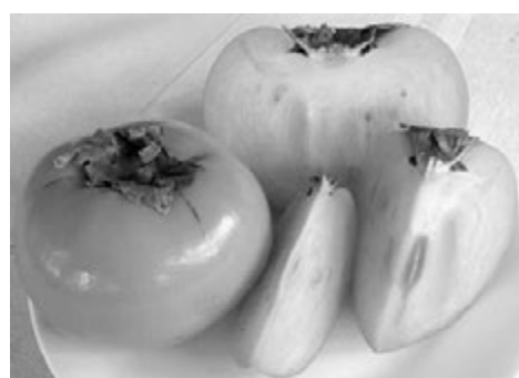
Хурма - от греческого «пища богов».

Хурма — зимняя ягода, но если вы хотите лакомиться ею круглый год, заморозьте или высушите ее. В замороженном виде (дольками или целиком) она хранится до 6 месяцев. Кстати, холод лишает хурму терпкости. А вот под действием высоких температур она наоборот становится более насыщенной. Поэтому хурму не рекомендуют варить. Сушить ее следует при температуре 40-45 градусов до потемнения. Обращаем внимание, что от обилия сахаров высушенные кусочки хурмы могут покрыться легким белым налетом, что на вкусовые качества не влияет. Такие сухофрукты можно есть вместо конфет, запивая чаем.