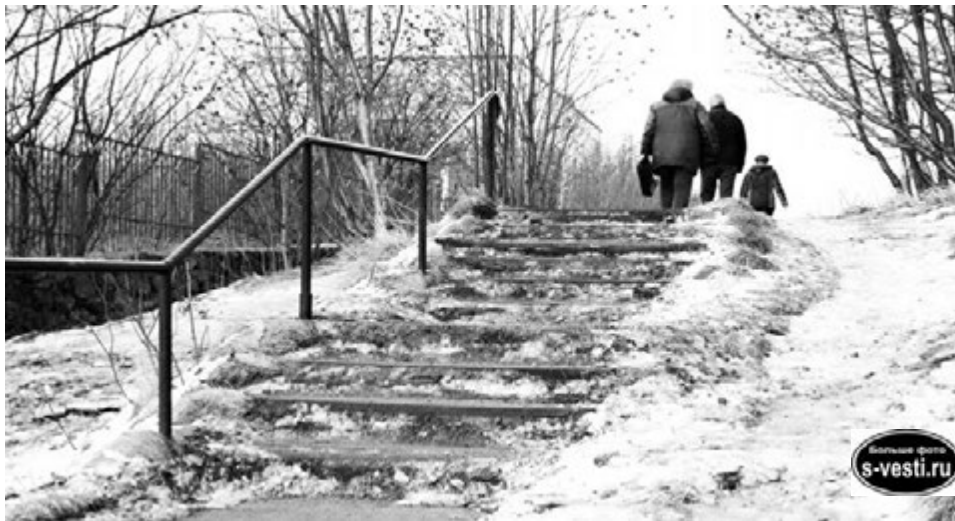
Этой лестнице на Комсомольской — особое внимание: слишком долго она считалась бесхозной.

На ул.Комсомольской сити-менеджер вместе с представителями комму-