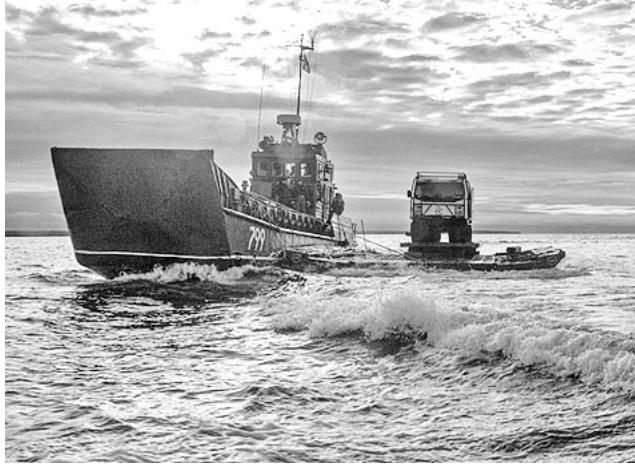
Корабли Северного флота готовы действовать во всех стратегически важных районах Мирового океана.

Отряд боевых кораблей во главе с тяжелым атомным ракетным крейсером «Петр Великий» уже прошел около 2000 миль. Из них более 400 - в сложной ледовой обстановке.