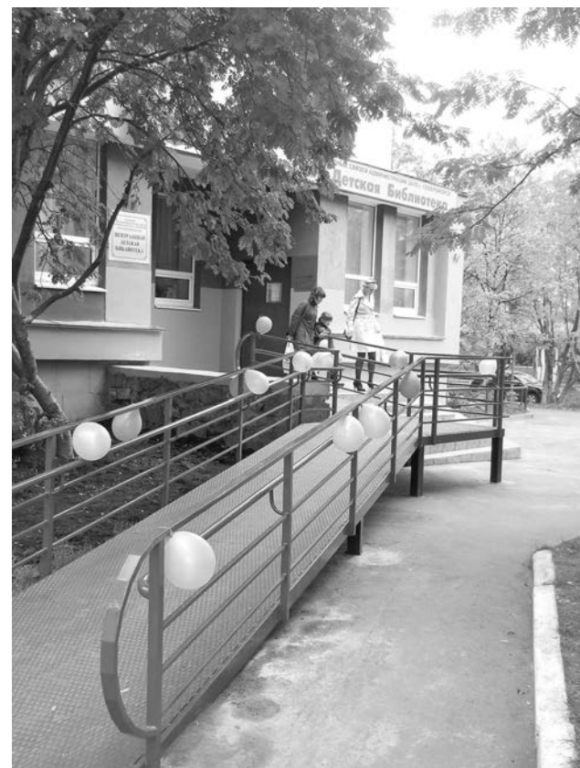
Пандус у библиотеки открыл двери в мир книг и детям с ограниченными возможностями.

В свою очередь специалисты детского реабилита-