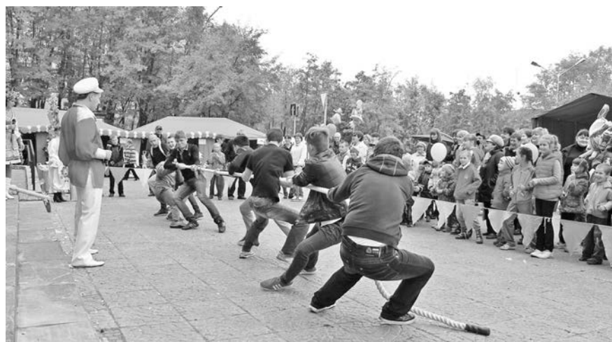
Организаторы ярмарки приготовили развлечения на любой вкус. Не обошлось народное гулянье и без перетягивания каната.

Зато на все сто порадовала ярмарка малышей. Сразу после открытия «Даров Осени» заработала детская площадка, где зазорные скоморохи устроили для ре-