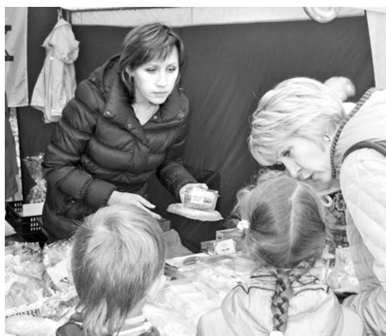
Нагулявшая аппетит детвора налетала на сдобу.