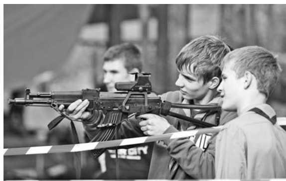
Днем в лагере царил дух соперничества, а по вечерам ребят объединяли песни под гитару у костра.

Елена ЗАХАРОВА.