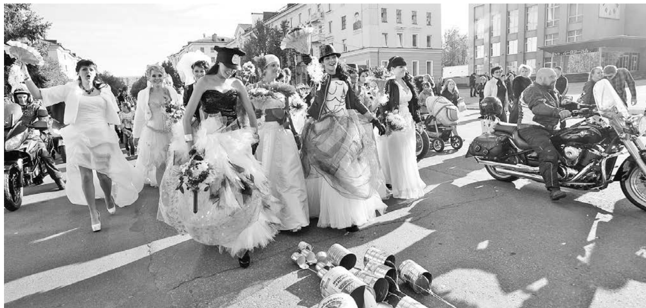
Шумная общегородская свадебная процессия прошла по улице Сафонова.

В этом году парад вызвал настоящий ажиотаж среди североморок. Если в первом принимали участие 18 девушек, вторым – 22, то на этот раз – 29. Заявок же поступило гораздо больше, так что организаторам пришлось отказать