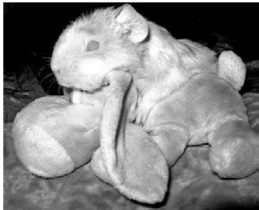
Мастер маскировки под детские игрушки.