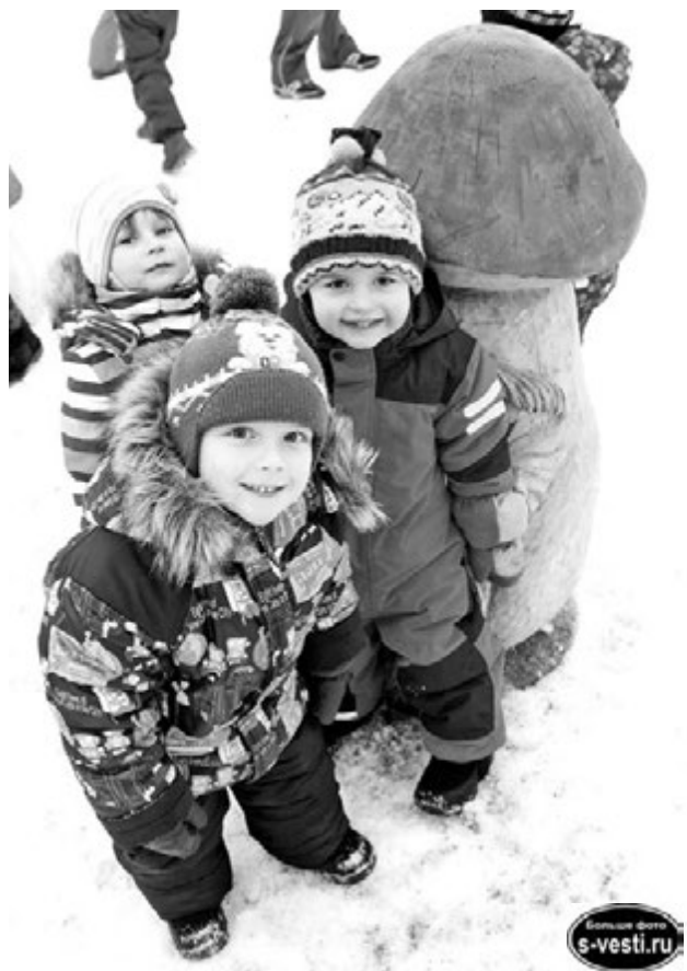
Сделать фото на память с новыми сказочными жителями городка были готовы все малыши.

Сказочный городок в поселке Сафоново пережил второе рождение.