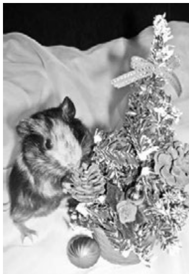
Новогоднее настроение чувствуют все.

Анастасия ЧЕРНИКОВА.