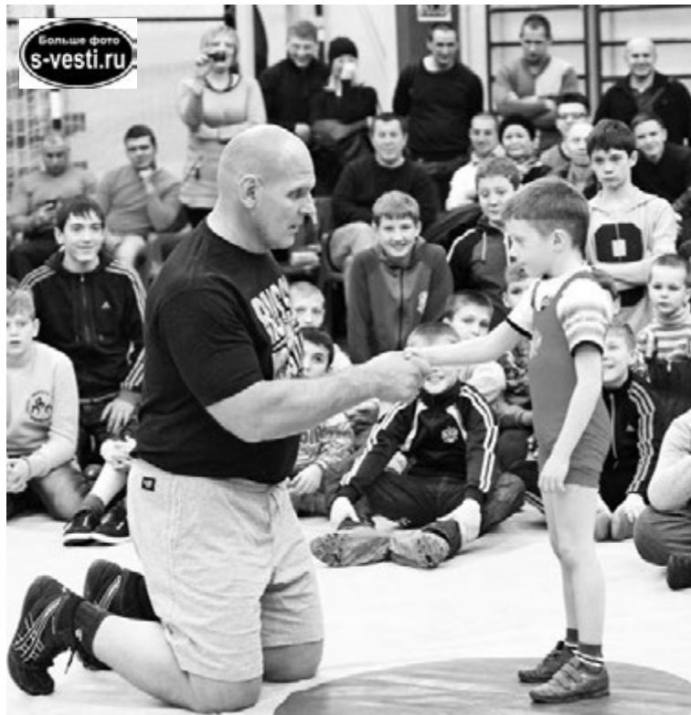
Пожать руку легенде мирового спорта Александру Карелину - бесценно.