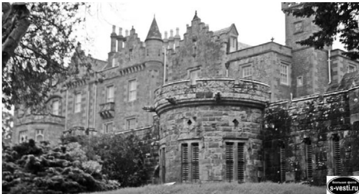
Замок Абботсфорд - родовое поместье сэра Вальтера Скотта.

Записала Иванны МИКИТЕНКО.