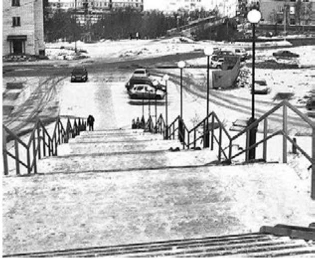
Внимание глав ЗАТО к трапу от храма к детской поликлинике понятно: он очень востребован. В полярную ночь без освещения здесь точно не обойтись.

Радует главное: сегодня, как убедились участники рейда, Светлана Бутенко может с помощью мамы выходить из дома на прогулку в любое время. А вот игры на свежем воздухе юных североморцев, живущих на ул.Комсомольской, поставили под вопрос некоторые взрослые, проживающие тут же. - По предложению жите-