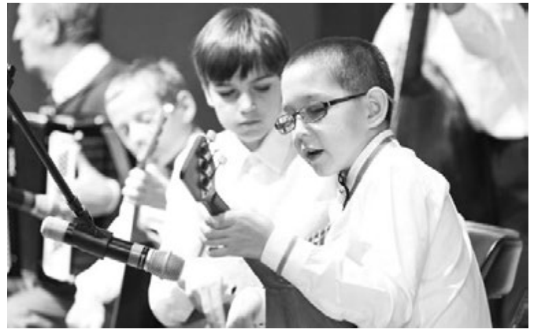
Ансамбль народных инструментов «Калинка» КШИ №3 г. Мурманска - постоянный участник фестиваля.