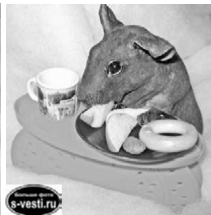
Болдуин (бесшерстная свинка) трапезничать изволит.