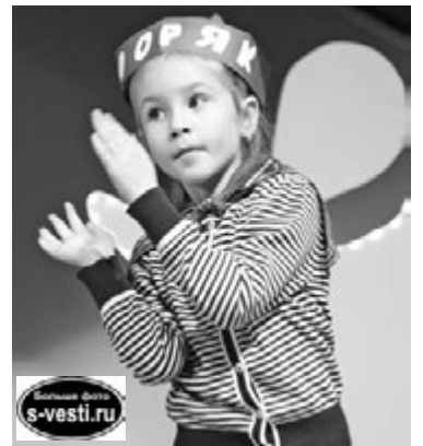
Участники «Синей птицы» как никто знают цену движениям.