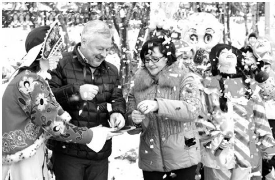
Праздничный салют из разноцветного конфетти стал ярким завершением официальной части.

Накануне юбилея поселка власти ЗАТО эту ситуацию решили исправить. Новых жителей городка - героев всеми любимых