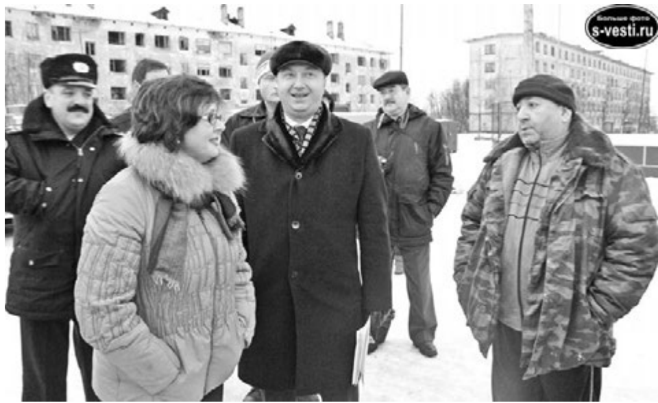
Городские власти открыты для диалога, но он должен строиться не на эмоциях, а на аргументах и фактах.