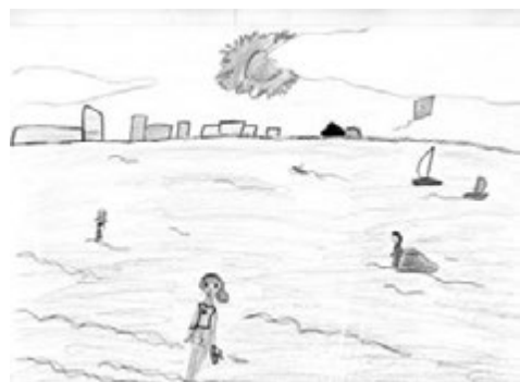
Ира Герасенко, 10 лет.