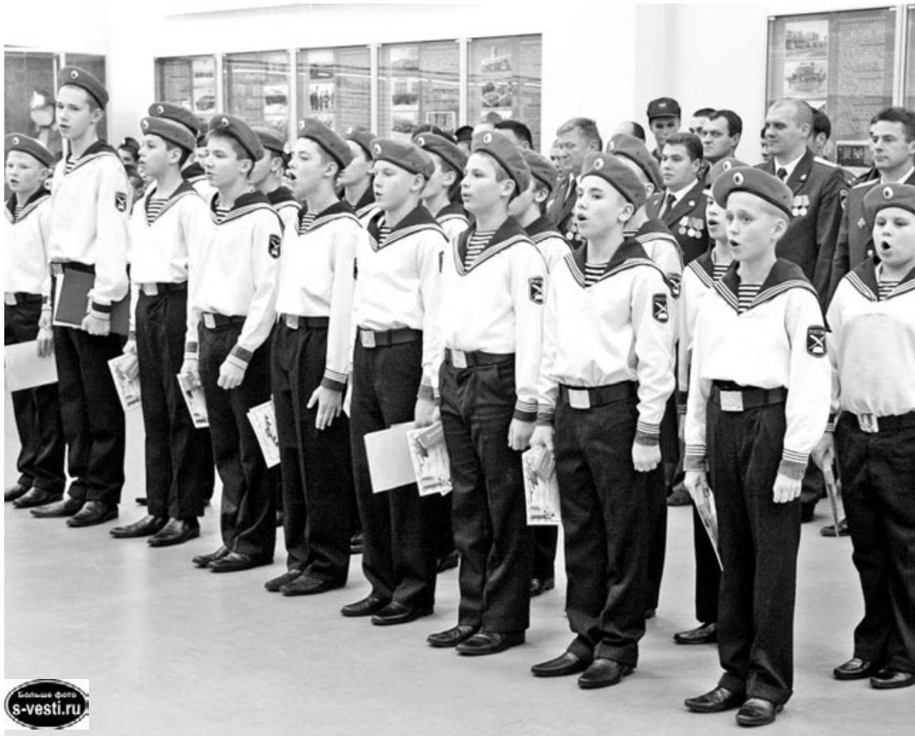
Без исполнения кадетского гимна не обходится ни одна церемония посвящения.