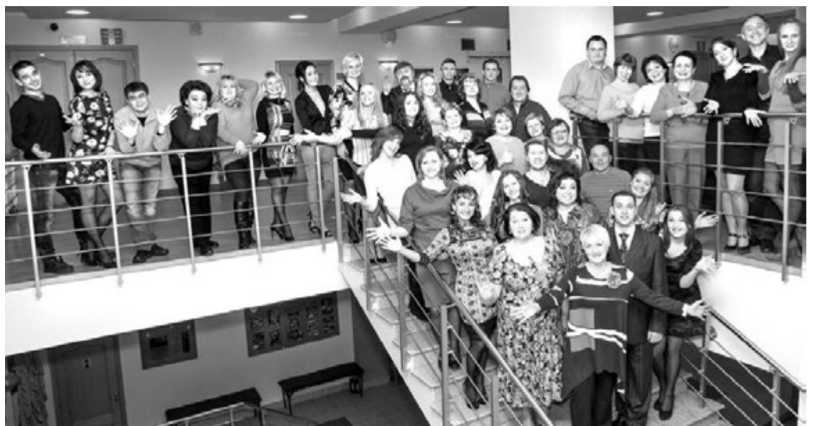
За 35 лет специалистами дворца проведено 5 930 культурно-массовых мероприятий для 2 миллионов зрителей.

Сегодня в стенах ДК трудятся 72 человека. Все они полны творческих сил, энергии и задумок, и каждый вносит свою лепту в общее дело. А еще, как и в любой семье, в творческой семье ДК есть свои особые традиции, которые работниками