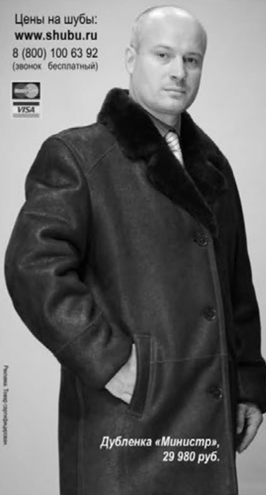
Дубленка «Министр», 29 980 руб.

Куда мужчинам идти за натуральными шубами и дубленками? Конечно, на Новоторжскую ярмарку в Мурманске в Ледовый дворец с 3 по 7 декабря.