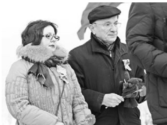
Глава администрации ЗАТО Ирина Норина и член Совета Федерации от Мурманской области Игорь Чернышенко возложили цветы к памятнику советским воинам.