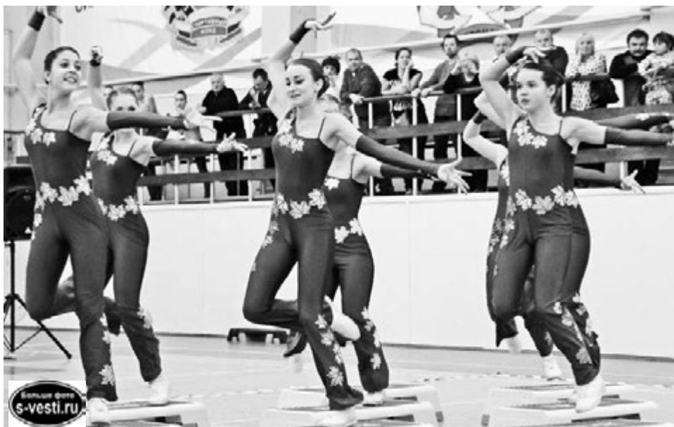
Зажигательные ритмы североморской команды «Венсон» никого не оставили равнодушным.

Первенство получилось весьма представительным. 32 команды, свыше 250