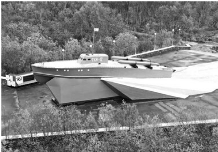
Памятник «ТКА-12», установленный 31 год назад, этим летом отремонтировали.

По информации Северноморского музейно-выставочного комплекса подготовила Ирина КУЗЬМИНА.