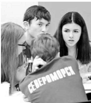
На Кубке губернатора наши знатоки сумели впечатлить даже Александра Друзя и продолжают успешно доказывать всем: знания - сила.

Анастасия ЧЕРНИКОВА.