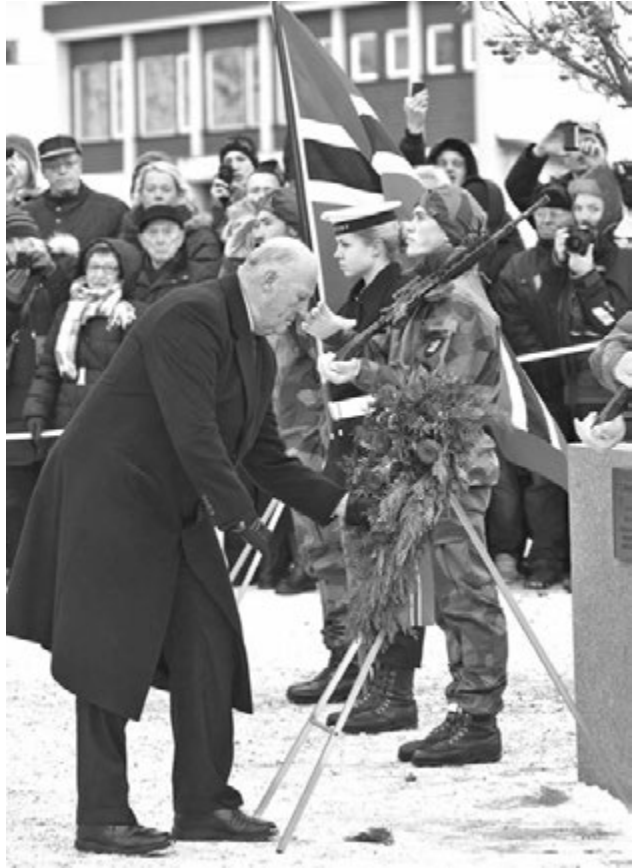
Король Норвегии Харальд V.

Делегация ЗАТО Североморск приняла участие в праздновании 70-летия освобождения Красной армией Северной Норвегии от немецко-фашистской оккупации