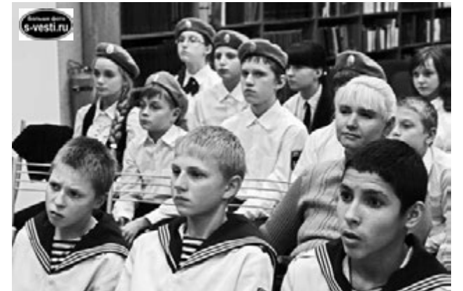
Кадеты заняли большинство мест в зале библиотеки.