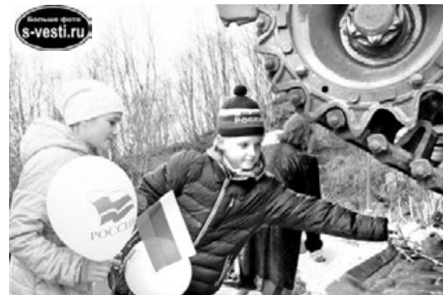
После митинга ученики школы №10 возложили к памятнику цветы.