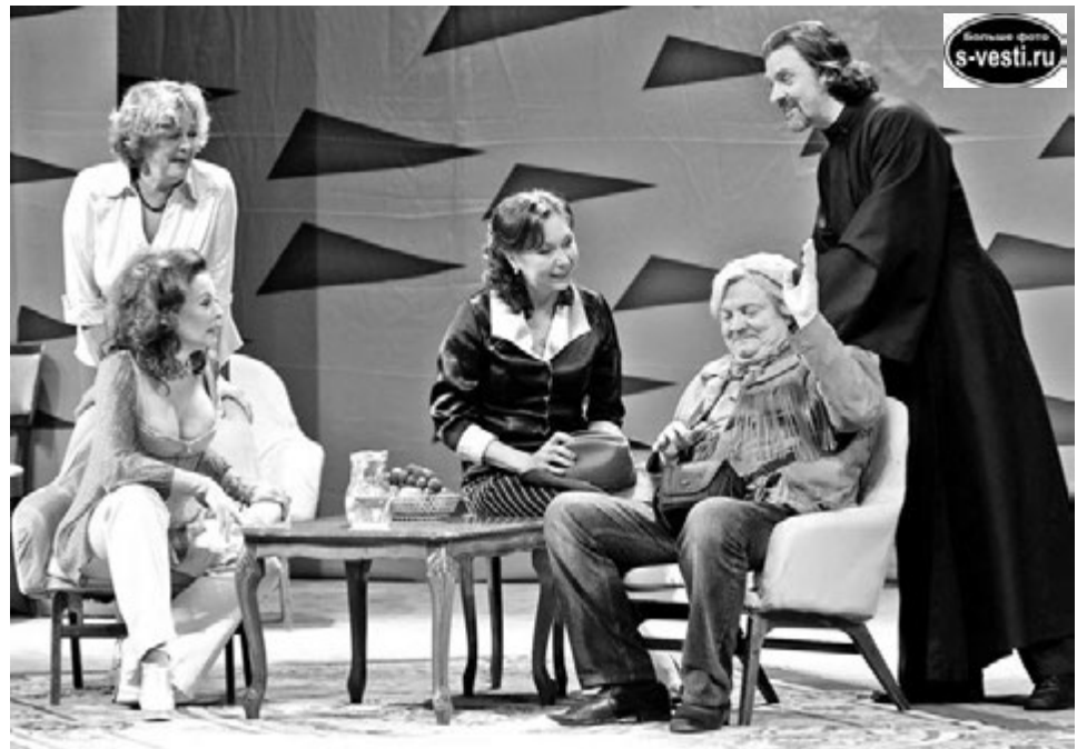
Сам Юрий Поляков считает постановку театра Российской армии одной из самых проникновенных интерпретаций его пьесы.

Восхитительная актерская игра, выдержанные декорации, интригующий сюжет. А впечатления зрителей от спектакля показали, что многие североморцы не имеют представления о театральном этикете и нормах приличия в целом. И речь не о внешнем виде даже. Телефонные разговоры, поедание шоколадок, перемещение по залу во время спектакля — это и проявление дурного воспи-