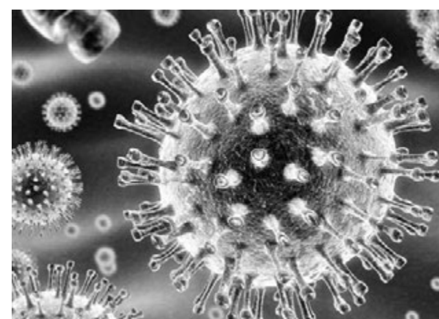
Такие красивые под микроскопом вирусы вызывают инфекции с неприятными симптомами.

Основные меры профилактики энтеровирусной инфекции и других кишечных инфекций легко выполнимы. Во-первых, возьмите за правило употреблять гарантированно безопасную воду и напитки. Это означает табу на лимонады и квас из бочек. Лучше доверять напиткам в фабричной упаковке и кипяченой воде. Во-вторых, следует тщательно мыть фрукты и овощи безопасной водой (питьевой или кипяченой). Сырые фрукты и овощи с нарушенной кожурой лучше не употреблять. В-третьих, старайтесь не допускать попадания воды в рот при купании в бассейнах и от-