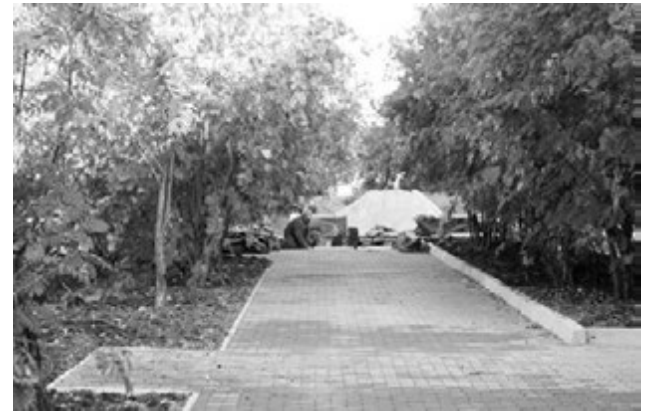
На следующей неделе в сквере на ул. Комсомольской установят фонари.