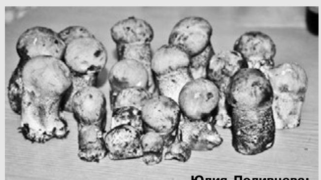
Юлия Поливцева: «Наши малыши».