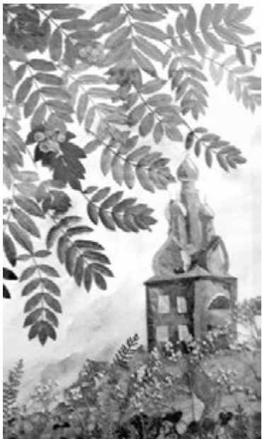
С.В.Полякова, «Святая Русь».

Флористика - древнее искусство, способное, словно по волшебству, перенести вас в сказочный мир живой природы, окружить