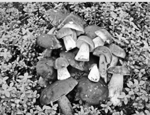
Лариса Карпова вместе с мужем Геннадием нашли в одном месте сразу 16 белых грибов.