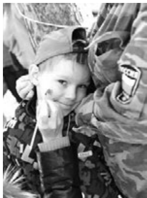
Аквагрим был очень популярен у ребят.

Проведение Лесных паралимпийских игр обеспечили представители молодежных общественных объединений: городская волонтерская группа, скаутский отряд им. Архангела Михаила, городское сообщество «ZELLO - Североморск дпс». Впервые участие в североморских «Приключениях...» приняли региональные общественные организации - Федерация ездового спорта Мурманск-