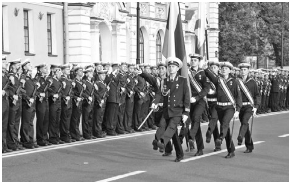
В строю - вчерашние мальчишки.

С важнейшим событием в жизни каждого мужчины первокурсников поздравил начальник ВМИ