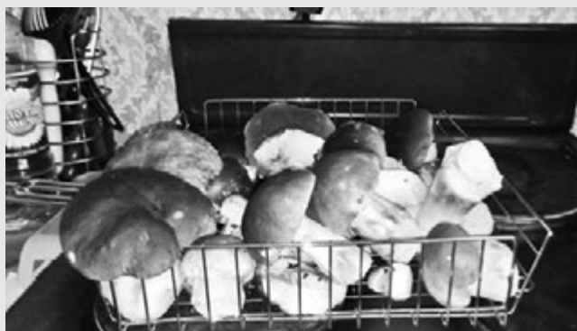
Наталья Аникина: «Вот это мы удачно по грибы сходили!»