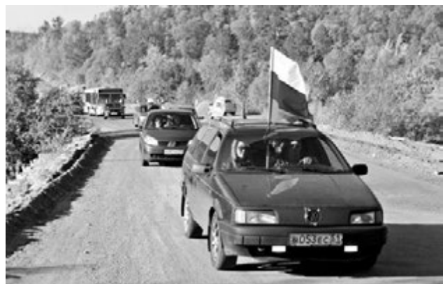
Члены городского сообщества «ZELLO - Североморск дпс» доставили участников игр к озеру Домашнему.