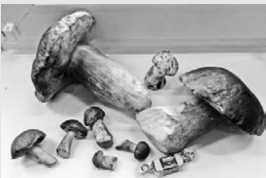
Татьяна Зайц: «Такие огромные боровики, что и конфетки не видно!»

Минимальный размер фотографии - 600x340.