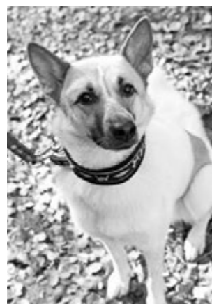
Лайка Дайна оказалась очень общительной.

Анастасия ЧЕРНИКОВА.