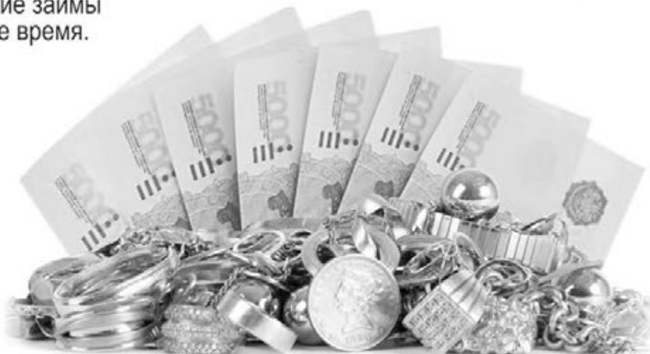
Схема работы ювелирного ломбарда "Клементина" проста: Вы приносите любое ювелирное изделие из золота, его оценивают и выдают Вам оговоренную сумму денег, заключив при этом с Вами договор залога. Через определённое время Вы выкупаете своё изделие из ломбарда, заплатив при этом процент за пользование кредитом.

Таким образом, человечество уже более 550 лет пользуется услугами ломбардов, и интерес к ним только растёт. Сейчас это один из самых удобных и надёжных способов получения денежной ссуды, особенно краткосрочной.