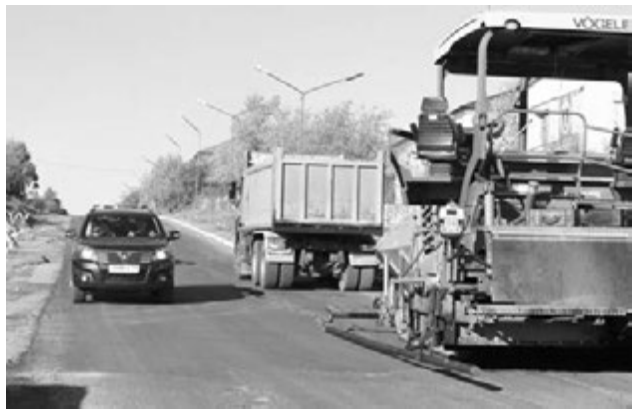
На обновленной дороге ул. Восточной наконец-то появится пешеходная дорожка.