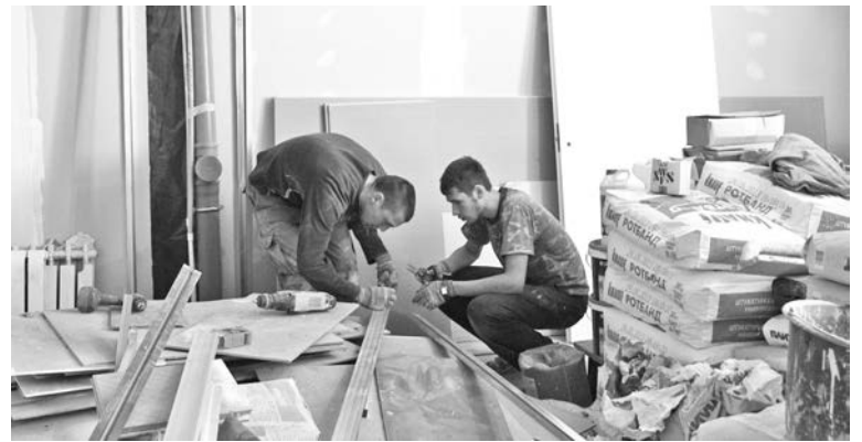
В ДЮСШ-4 осталось выполнить отделочные работы.

Мурманская фирма «Инстрой», уже приступившая к работе, меняет окна, проводку и стояки. Внешние стены – в лесах, крыльцо демонтировано. Фасад, кстати, будет утеплен, чего требуют санитарные нормы. А яркий персиковый цвет сделает район веселее. Что касается крыльца, то оно будет оборудовано пандусом для колясок. А вот на замену лифтов