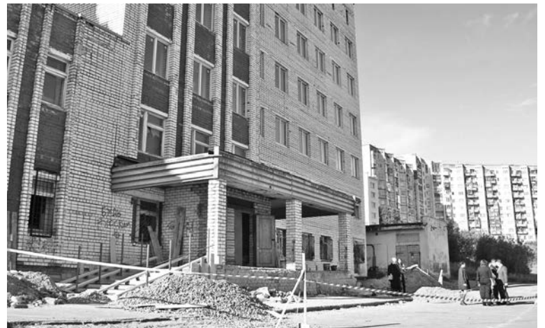
То, что ремонт в детской поликлинике продолжается, теперь видно невооруженным глазом.