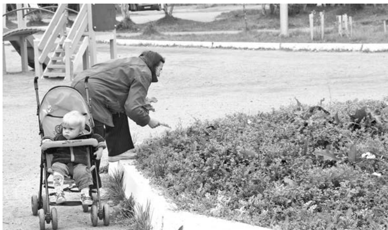
За клумбой в сквере на Советской никто не ухаживает. Жители занимаются прополкой самостоятельно.