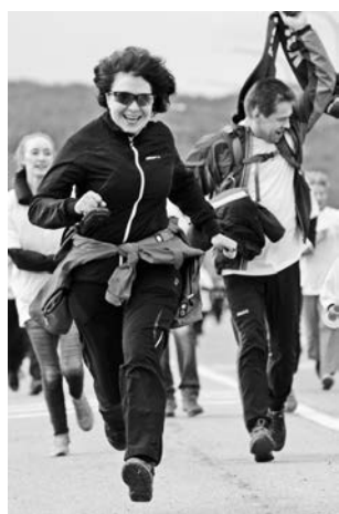
«Мурманская миля» объединила все поколения.