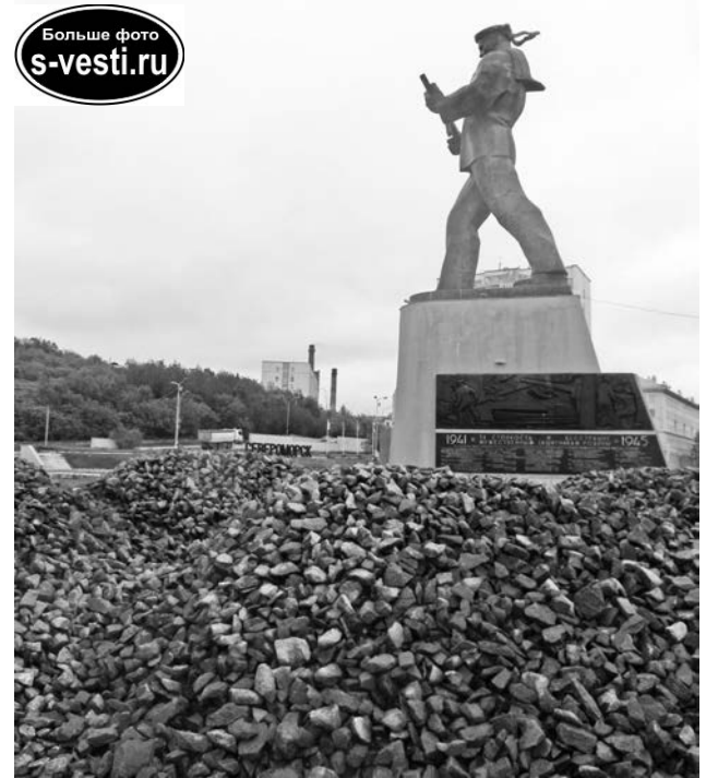
Всего 206 кубометров крупного щебня будет высыпано на береговую линию.