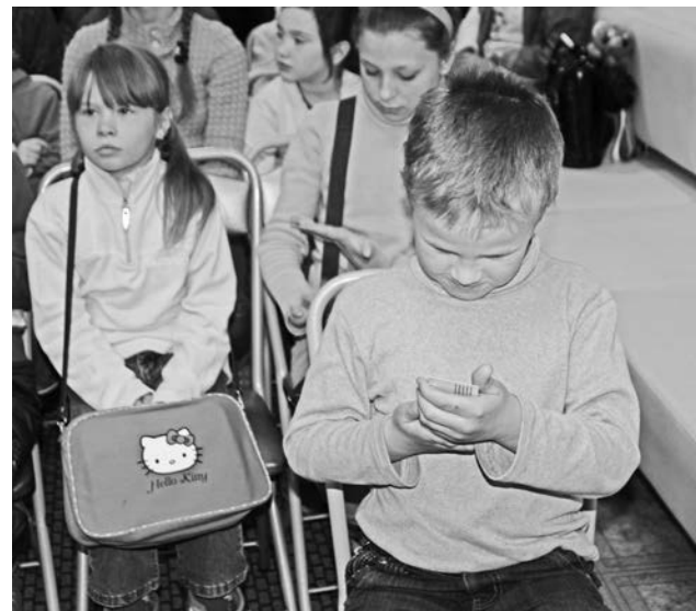
За время первой смены Североморский музей истории города и флота посетили 415 школьников.

Кто-то из детей отправился отдохнуть к морю по путевкам, кто-то уехал вместе с родителями в отпуск, но немало ребят осталось и в Североморске.