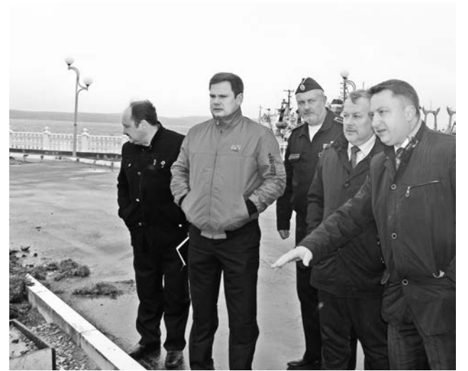
Бордюрный камень уложили раньше, чем стали завозить отсыпку для зеленой зоны. Теперь бордюры частично заменят.

Леся КЛАДЬКО и Наталья СТОЛЯРОВА.