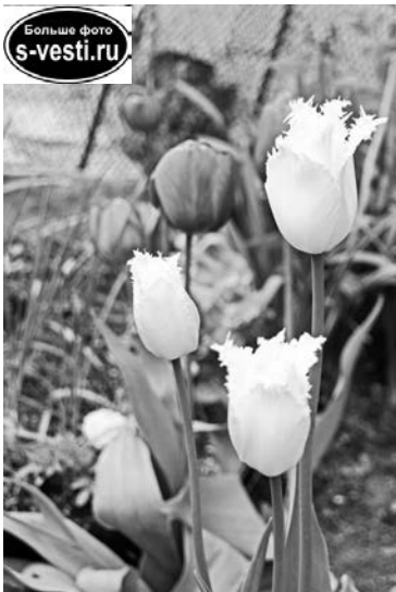
Тюльпаны Натальи Литус.