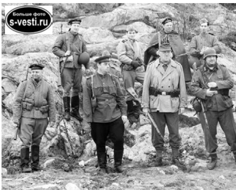
Члены клуба «Заполярный рубеж» обещали вернуться в Северноморск с новыми реконструкциями.

конференции и жителям флотской столицы стала военно-историческая реконструкция «Бой на хребте Муста-Тунтури».