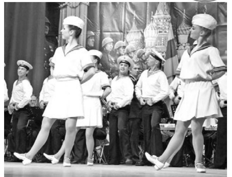
Флотские артисты настроены на победу. Родной зритель поддержал!

ни и пляски СФ народные и военные композиции, песни о флоте и море, романсы и классические номера, советские хиты и зарубежные шлягеры. 8 мая они словно слились в один разножанровый номер. Песенно-танцевальный марафон длился почти полтора часа без перерыва.