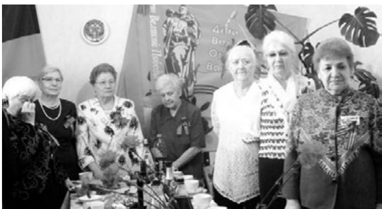
Североморские дети войны – как одна большая дружная семья.