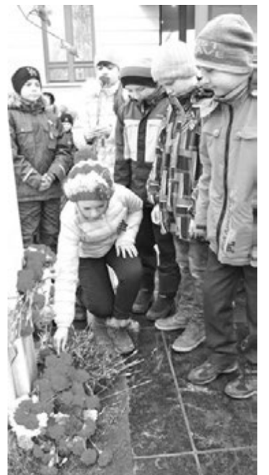
В каждом цветке – спасибо за подвиг!

Как отметил на митинге выпускник знаменитой Соловецкой школы юнг капитан 1 ранга