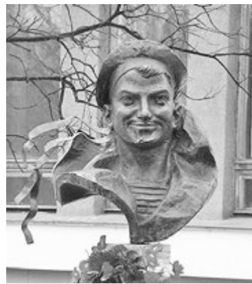
Бюст С.Ковалева был открыт в 1990 году.

ДДТ носит имя Саши Ковалева, и у его входа установлен бюст героического юнга. С самого утра воспитанники детского сада «Родничок» несли Вахту Памяти. Организатором этого уже традиционного для ЗАТО мероприятия выступает музей истории города и флота. А после полудня коллектив Дома детского твор-