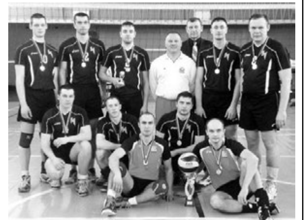
Незадолго до Кубка Победы наша волейбольная дружина завоевала Кубок Белого моря в Кандалаксе.

Иванна МИКИТЕНКО. Фото из архива команды.