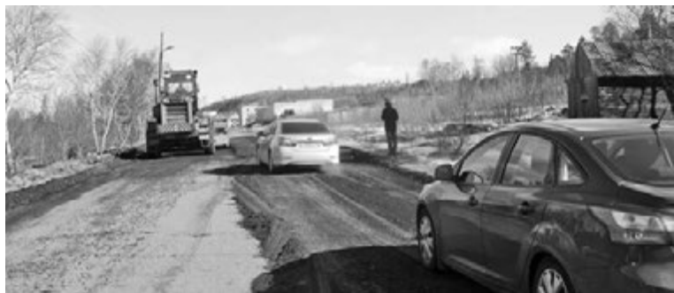
Решать проблему жителей п.Щукозеро начали еще во время рейда.