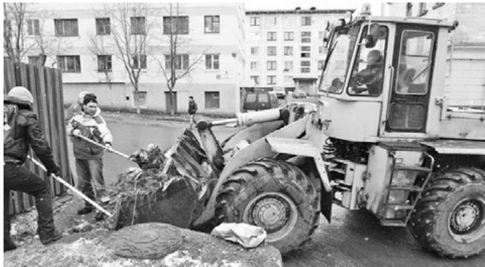
Там, где вручную убирать трудно, на помощь приходят автопогрузчики ООО «Автодорсервис».