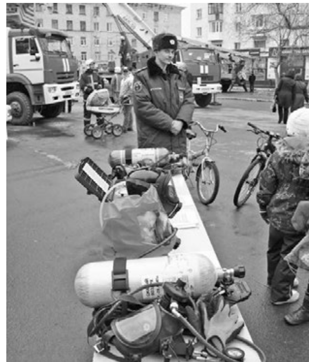
Традиционная выставка пожарной техники на площади Сафонова.

А самую необычную награду – почетную грамоту МЧС России и диплом за первое место в номинации «Танцевальный жанр» конкурса музыкального творчества пожарных и спасателей МЧС России «Мелодии чутких сердец – 2013»