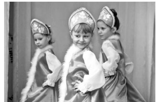
Дети поблагодарили взрослых за милосердие яркими выступлениями.

Как мы уже писали, за 14 лет ее существования не было года, чтобы Североморск не пополнил счет акции. Традиционно организатором сбора средств у нас выступает Управление образования. И 24 апреля в благотворительном марафоне приняли участие все школы и детские сады флотской столицы. К ним присоединились предприятия и организации города, подразделения Министерства обороны и частные лица. По инициативе участников городского учения в течение года будут отмечены специальным