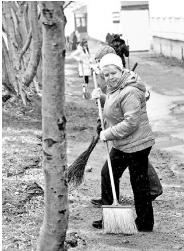
Уборка на газонах и в скверах поможет быстрее пробиться весенней зелени.