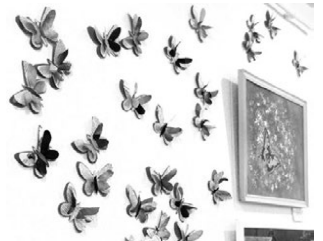
Коллективная работа участников мастер-класса «Летний вальс» (флористика).