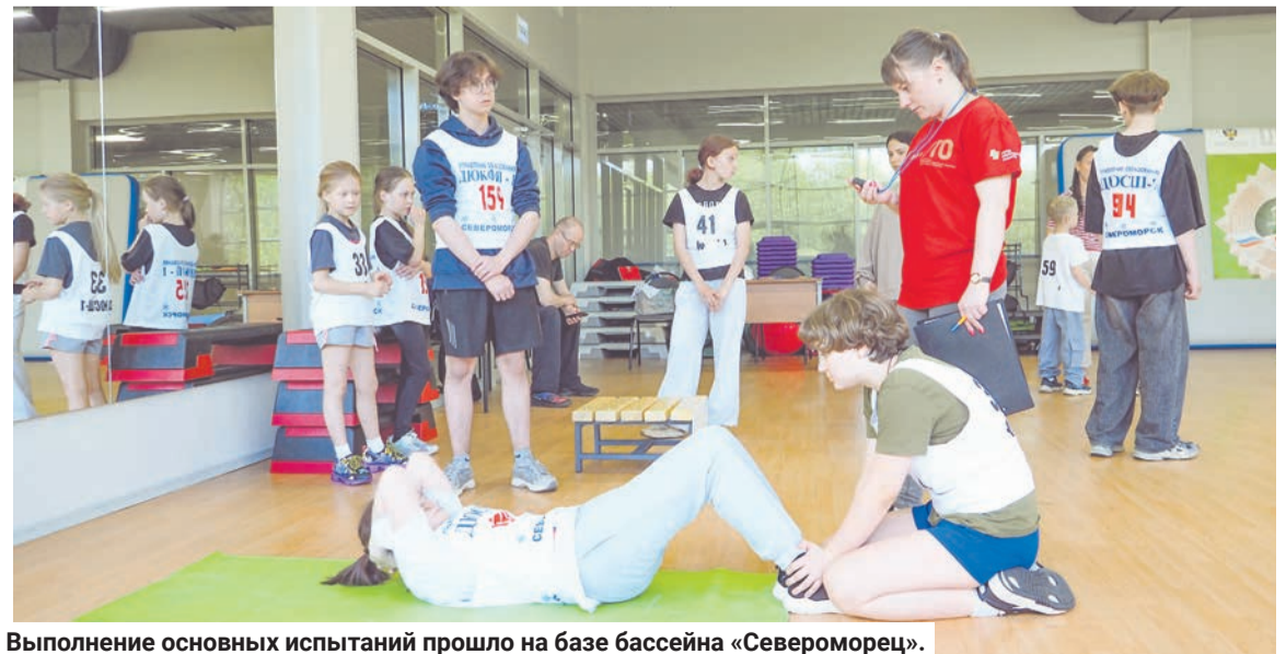
Выполнение основных испытаний прошло на базе бассейна «Североморец».