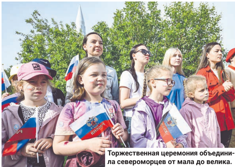
Торжественная церемония объединила североморцев от мала до велика.