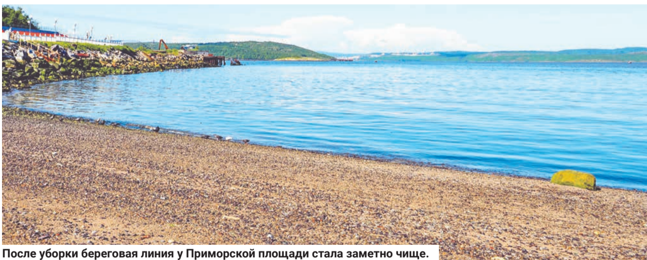
После уборки береговая линия у Приморской площади стала заметно чище.