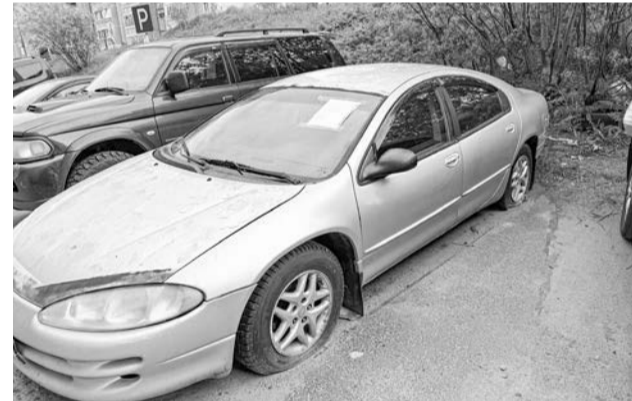
С торца д.3 по ул. Инженерная в г.Североморск выявлен автомобиль ВАЗ 21113, государственный регистрационный знак А656ВН51.