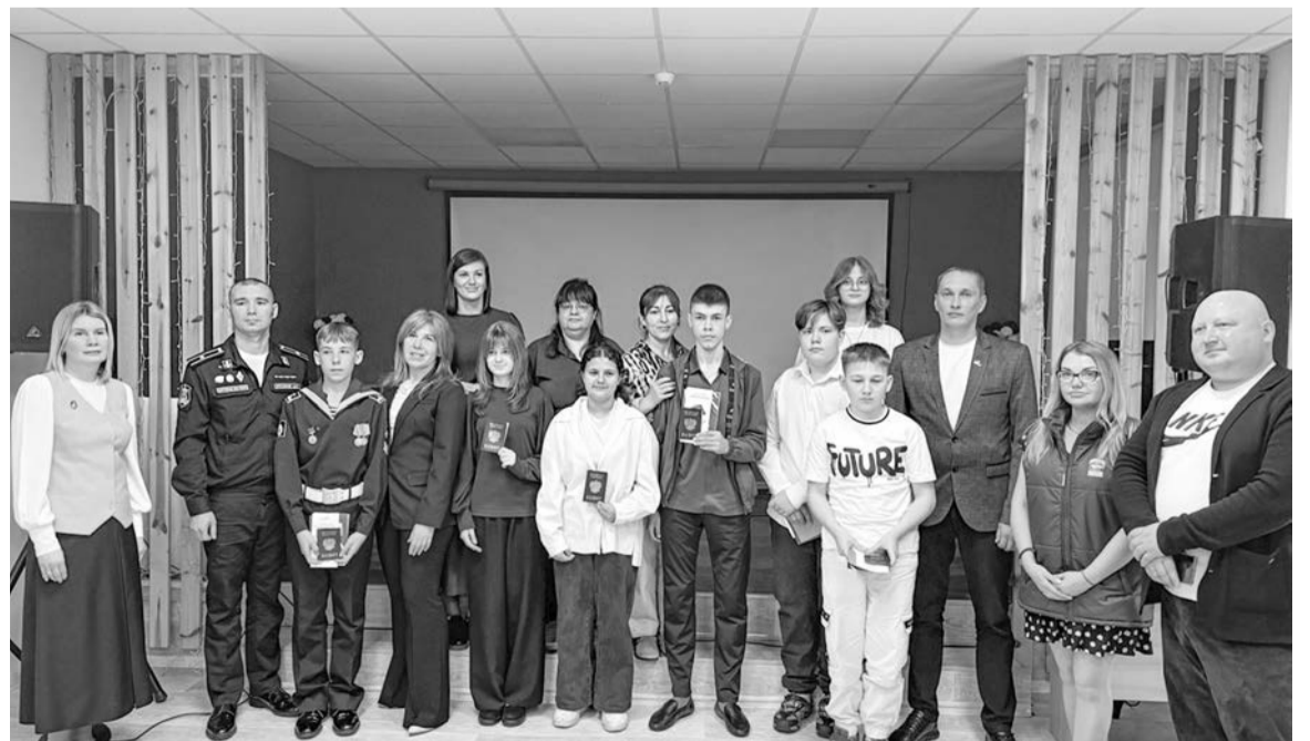
Коллективное фото — традиционный финал торжественной церемонии вручения паспортов.