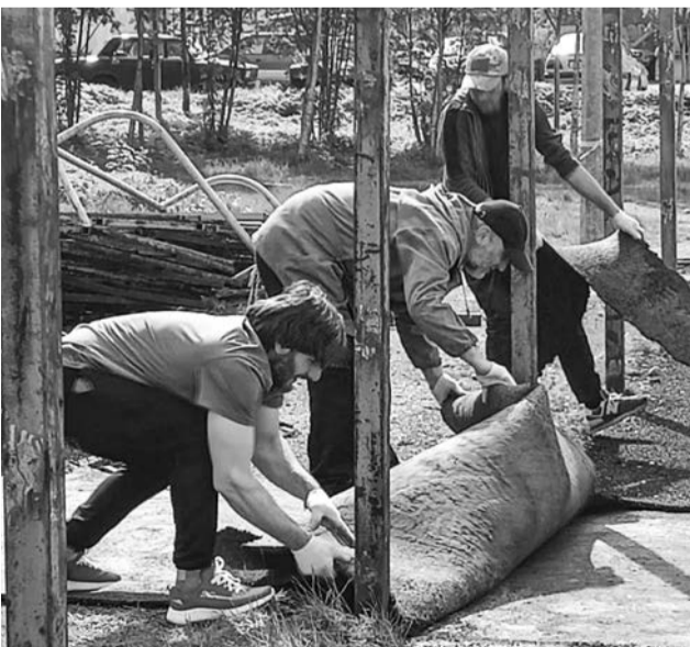
Демонтаж старого покрытия спортивной площадки на ул. Гвардейской.