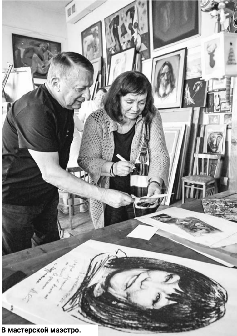
В мастерской маэстро.

совки, потом из различного этого материала выходили портреты моряков, подводников. Это уже исторические изображения, сейчас они хранятся в нашем музее.