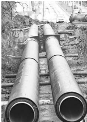
Реконструкция теплосетей идет полным ходом.