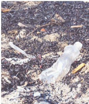
Пластиковые бутылки — распространенный вид «морского» мусора.