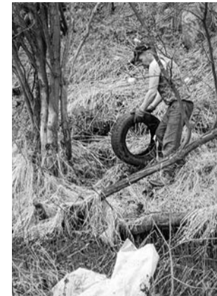
Неразграниченные территории приведены в порядок.

седании было уделено именно состоянию последнего. Это касается и дворов, и улично-дорожной сети. В микрорайоне много неубранного мусора, автохлама, выброшенных шин, уже разрослась требующая покоса трава, не видно дворников, как, впрочем, и механической уборки.