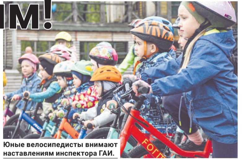
Юные велосипедисты внимают наставлениям инспектора ГАИ.

Игорь ГЛУЦКИЙ. Фото автора и из альбома «Беговеликов».