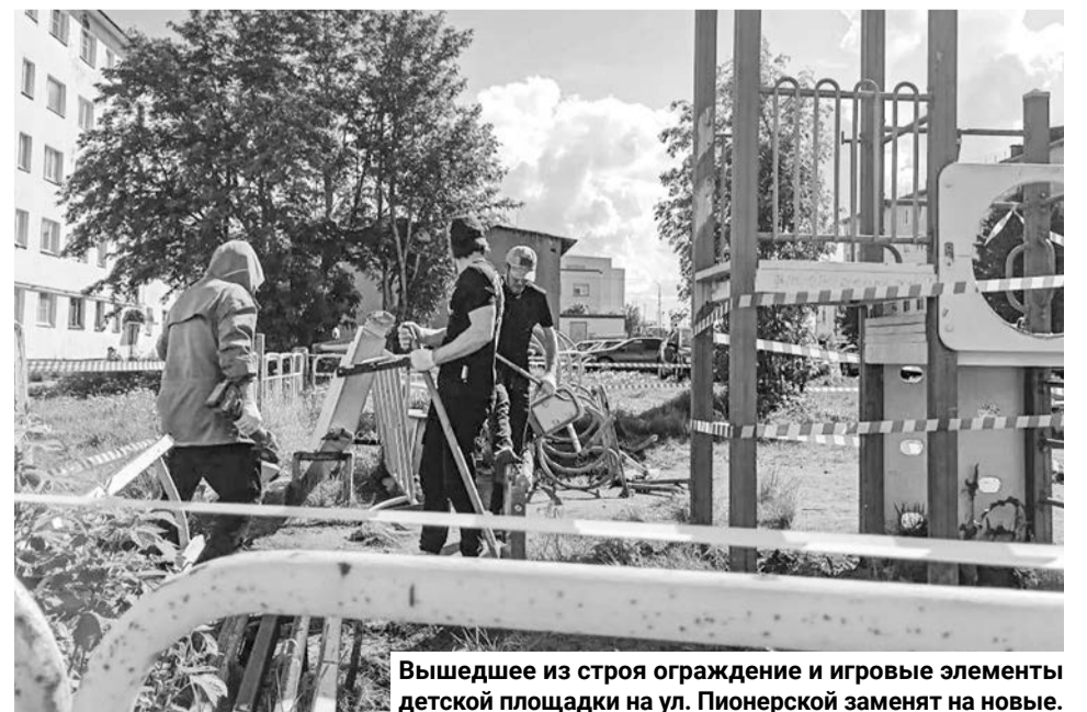
Вышедшее из строя ограждение и игровые элементы детской площадки на ул. Пионерской заменят на новые.