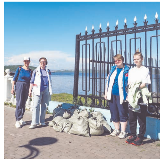
Североморцы потрудились на славу, собрав 11 мешков с мусором.

Учредитель: МБУ «Североморский информационно-аналитический центр». Главный редактор: С. И. Красильникова. Адрес редакции (издателя): 184606, г. Североморск, ул. Адмирала Сизова, 22. Тел.: 4-05-50 (главный редактор), 4-86-99 (корреспонденты).