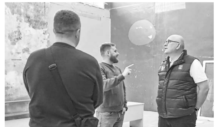
Возникающие вопросы обсуждаются на месте.