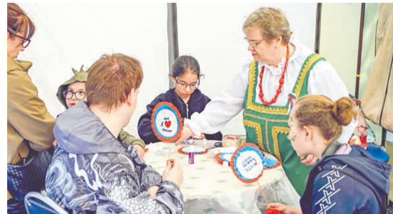
Клуб для людей с ОВЗ «Радуга» еще раз продемонстрировал, что для творчества нет границ.

На центральной аллее парка развернулась торговая ярмарка. Взрослые отоваривались сувенирной продукцией с северной тематикой, ароматным шашлыком и душистым медом. А у малышек большим спросом пользовались мыльные пузыри, шарики и вер-