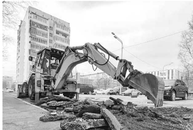
Ремонт дорог в ЗАТО ведется сразу по нескольким программам.