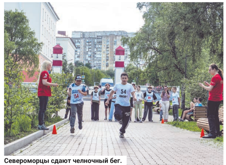
Североморцы сдают челночный бег.