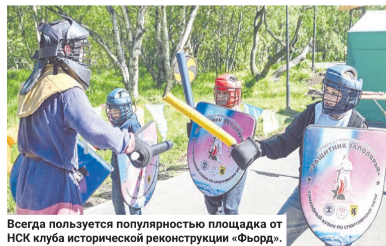
Всегда пользуется популярностью площадка от НСК клуба исторической реконструкции «Фьорд».

тушки. Отдых всей семьей популярен у североморцев.