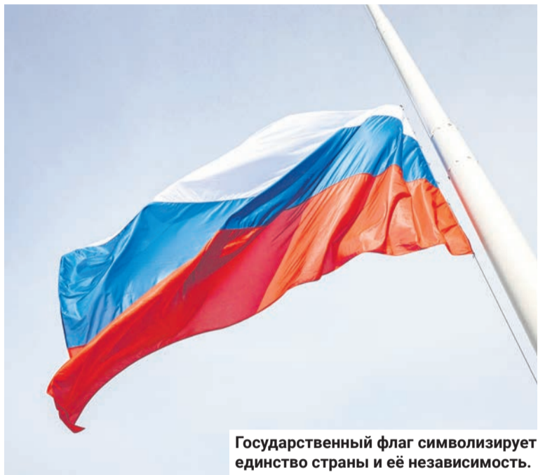
Государственный флаг символизирует единство страны и её независимость.