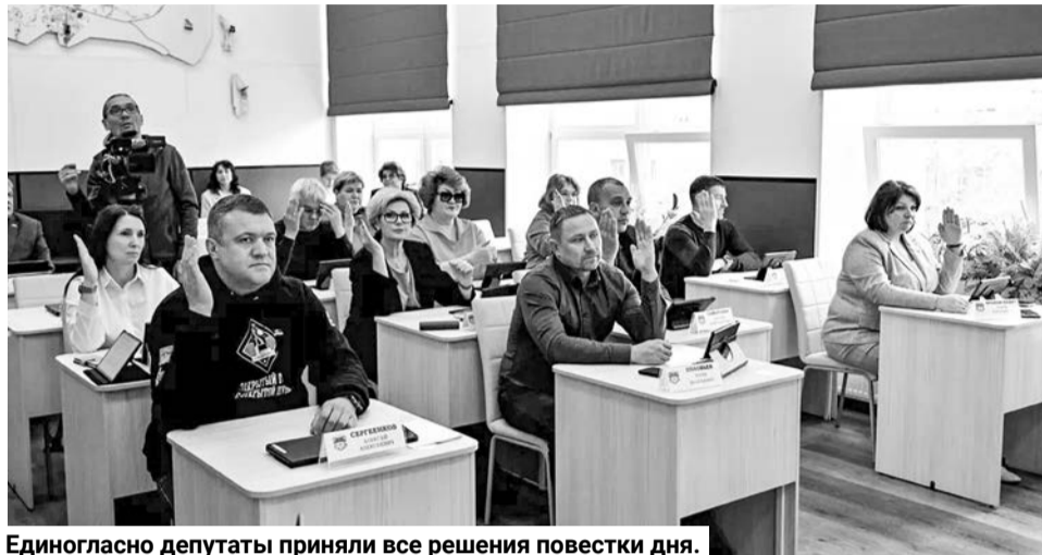
Единогласно депутаты приняли все решения повестки дня.