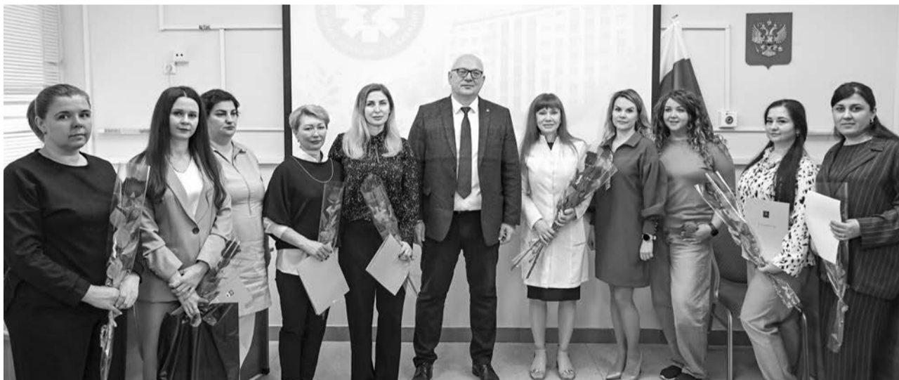
Медики — самая гуманная профессия. Жизненное кредо этих людей — готовность всегда прийти на помощь.