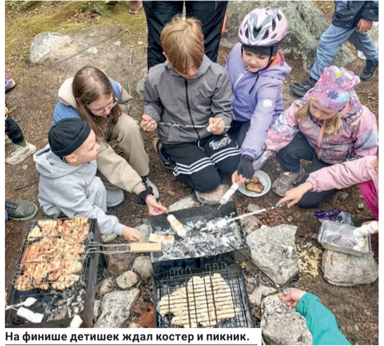
На финише детишек ждал костер и пикник.

11 июня в Североморске прошла сдача нормативов Всероссийского физкультурно-спортивного комплекса «Готов к труду и обороне».