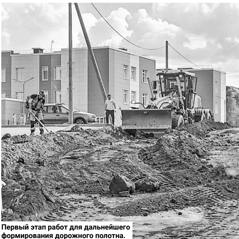
Первый этап работ для дальнейшего формирования дорожного полотна.

Детский сад, Североморский кадетский корпус, лыжня на Восточке... И крайне неудобные пути подъезда и подхода. Но в скором времени ситуация должна измениться.