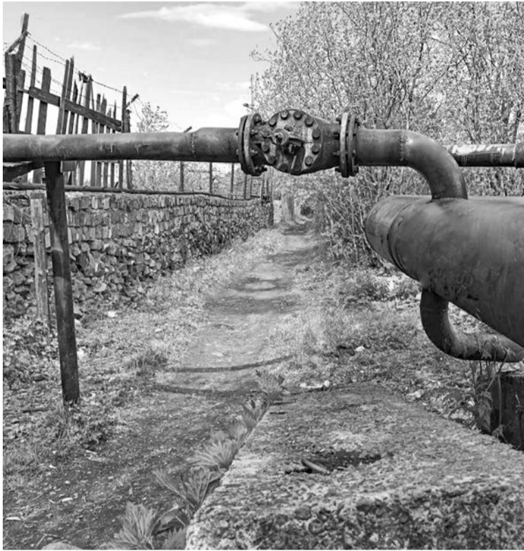
Те, кто пользуются этой тропинкой в Авиагородке, знают, как она выглядела раньше. Сейчас здесь чисто.

Неразграниченные территории — по большей части склоны, для уборки которых в этом году составлялись отдельные контракты (поскольку они фактически не принадлежат управляющим компаниям и не входят в улично-дорожную сеть), приведены в порядок. Мусора, который в некоторых местах копился годами, практически не осталось.