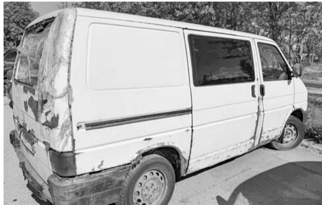
У д.4 по ул. Кирова в г.Североморск выявлен автомобиль Renault Megane, государственный регистрационный знак В334ЕН51.

При въезде в пгт.Сафоново г.Североморск выявлен автомобиль Volkswagen Transporter, государственный регистрационный знак У196КС51.