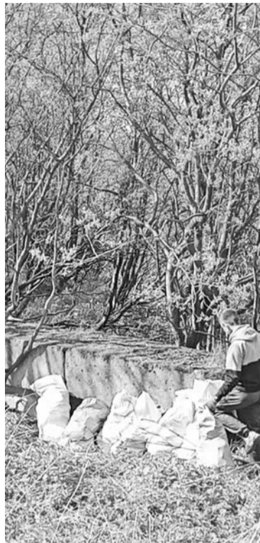
Это только малая часть мусора, собранного со склона на ул. Инженерная.

Еще в мае прошла уборка силами исполнителей, нанятых на временные общественно полезные работы, управляющими компаниями, жителями Североморска, сотрудниками учреждений и пред-