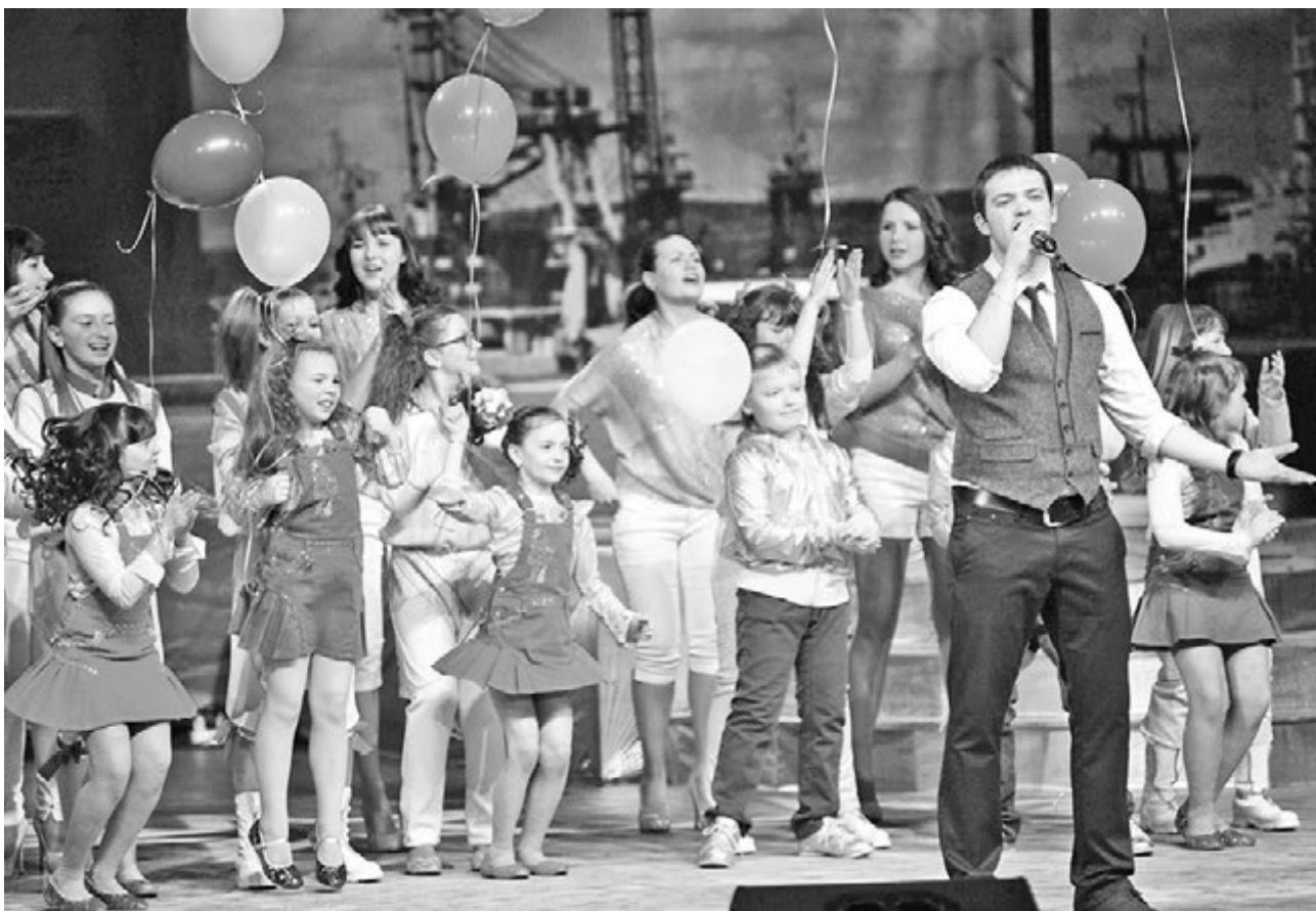
Североморский ансамбль эстрадной песни «Тоника» (ДК «Строитель») открывал и закрывал праздничный концерт.