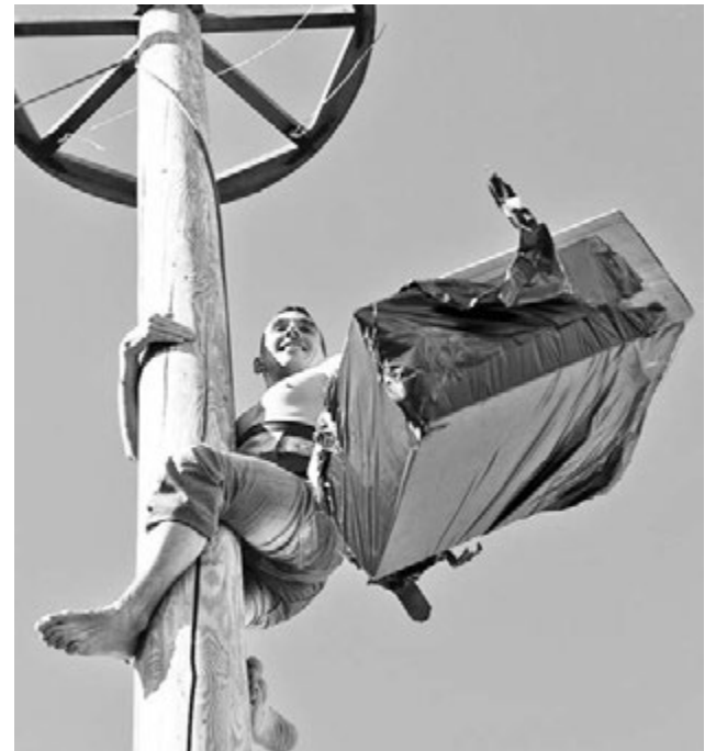
«Столбозады» добыли немало призов: скейт-борд, корзину фруктов, подарочные сертификаты...