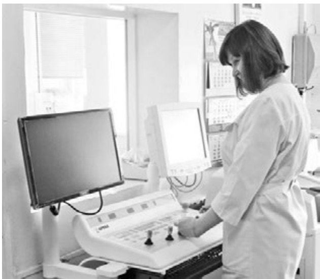
Скоро североморцы смогут оценить преимущества нового рентгена.

всем необходимым для спасения жизни: здесь есть даже аппарат для эхо-энцефалоскопии и ультразвукового обследования.