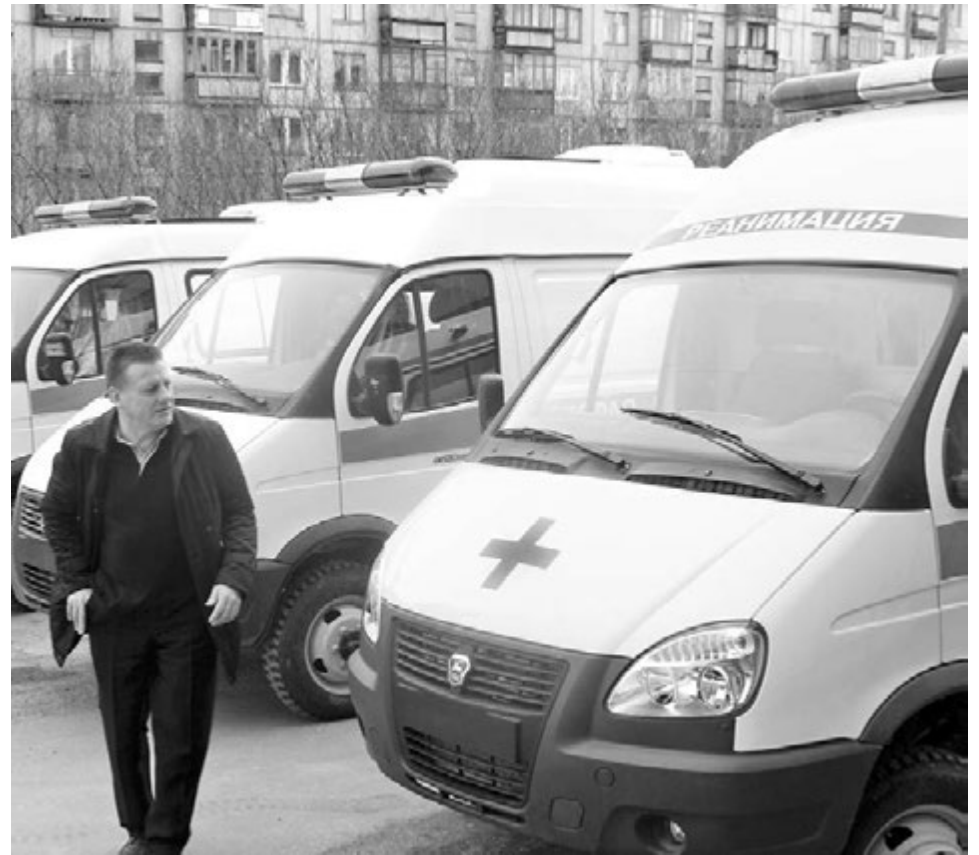
С такими автомобилями помощь придет в любой ситуации, в любую погоду.

Еще одна хорошая новость: на сегодня все старые автомобили «скорой помощи» в ЦРБ заменены. Четыре новых авто поступили в распоряжение больницы в конце прошлого года, сейчас к ним прибавилось еще три: две «скорые» и реанимобиль. Последний относится к классу «С» и оборудован