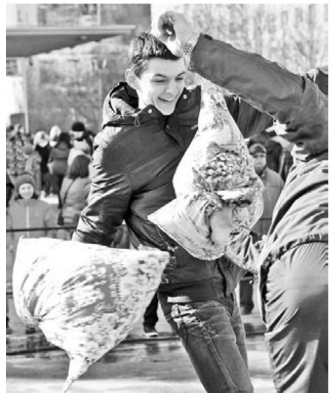
Подушечные бои - искусство ловких и хитрых: нужно и противника повергнуть, и самому не упасть.