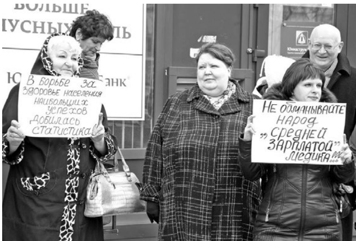
В пикете приняли участие как младший и средний медперсонал, так и врачи.