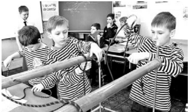
Лучше всех морские узлы вяжут кружковцы ДМЦ.

В воскресенье в Детском морском центре им. В. Пикуля прошли традиционные соревнования по прикладным видам спорта для школьников.