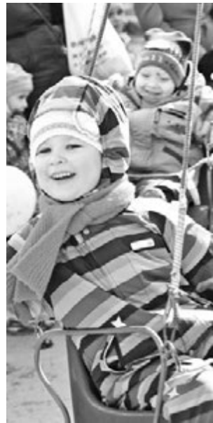
Если детям не скучно, то праздник удался!