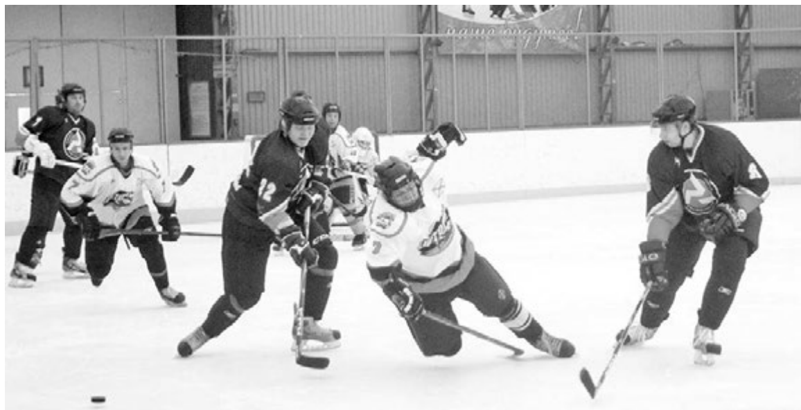
В каждом игровом эпизоде наши хоккеисты боролись до конца.