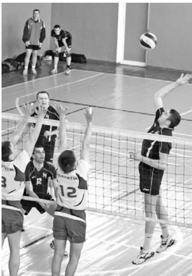
Апатитчане сильны, но наши сильнее!