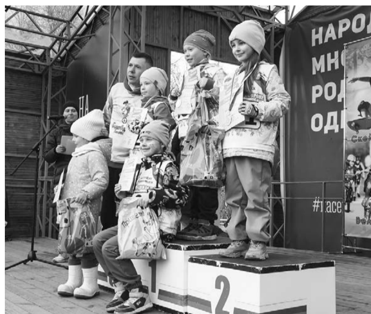
Участники, призеры и победители соревнований получили заслуженные награды.

тренеры клуба «Беговелики», они позволяют детям получить новый опыт, учат концентрироваться, справляться с эмоциями, формируют характер. Организаторы каждый раз стараются сделать «Высший пилотаж» ярким и запоминающимся. В этом им