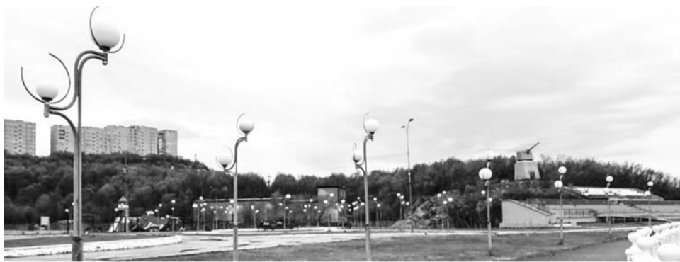
Полный комплект светильников на Приморской площади — явление редкое.

На минувшей неделе в ЗАТО Североморск работали сотрудники «Губернаторского контроля», которые занимаются мониторингом хода работ по программам благоустройства, реновации, а также реагированием на обращения жителей в социальных сетях. Североморцы привлекли внимание проверяющих к недобросовестной работе подрядных организаций, некачественной уборке мусора на общественных территориях и точечным поломкам на дворовых.