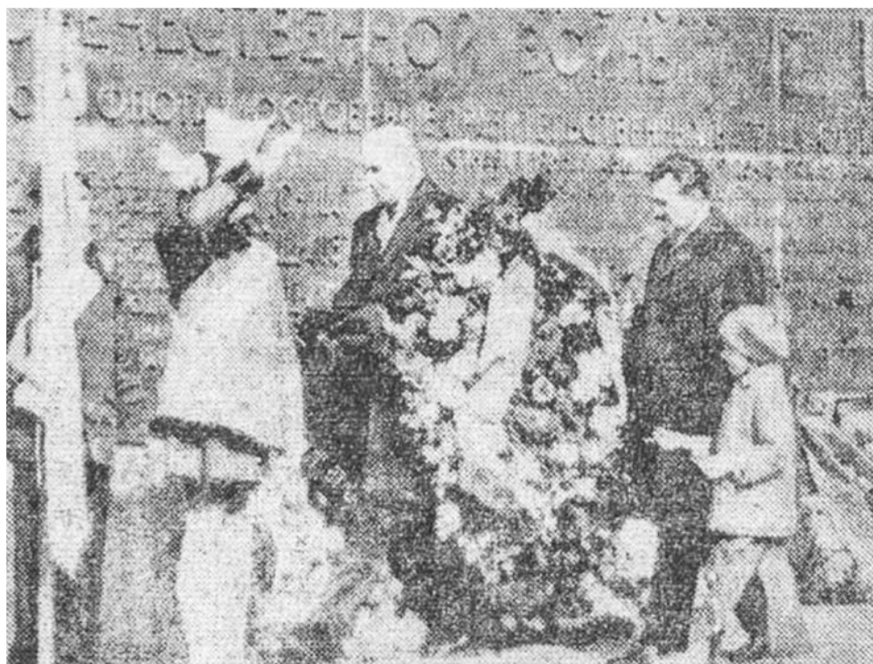
Возложение венков к памятнику североморцам — защитникам Заполярья.