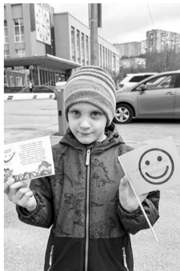
Североморцы, будьте внимательны — каникулы начинаются!

лям города о важности соблюдения ПДД, вручали памятки.