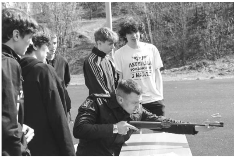
Шефы-военные учат школьников правильно наводить оружие на цель, чтобы стрелять более точно.

— Ежедневно в течение года в старшие классы приходят шефы-военнослужащие нашей учебной организации, проводят патри-