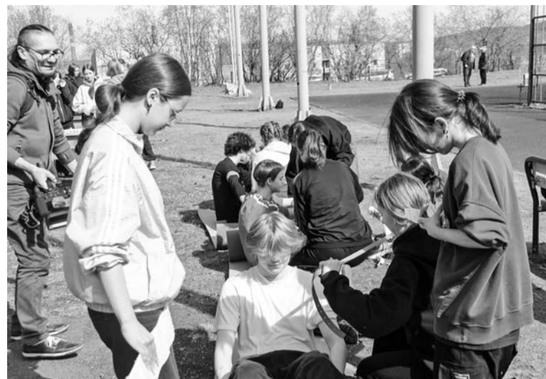
Первая медицинская помощь в полевых условиях.

— Всю неделю занимались подготовкой, изучали основы полевой