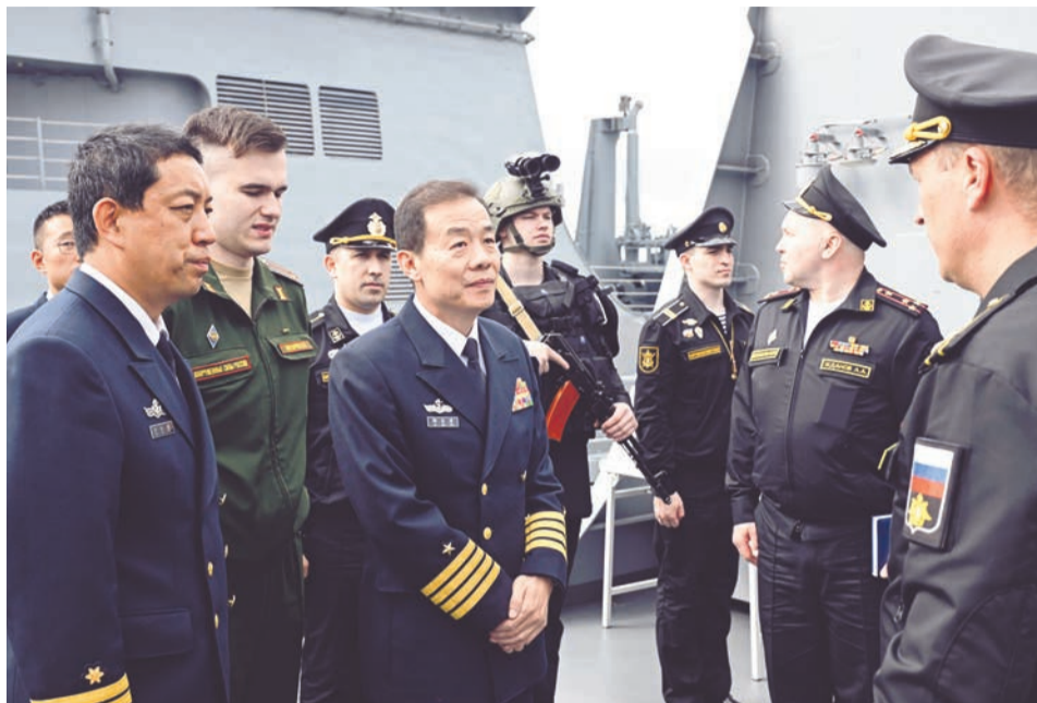
Научно-практические мероприятия в основном проходили на объектах Северного флота.