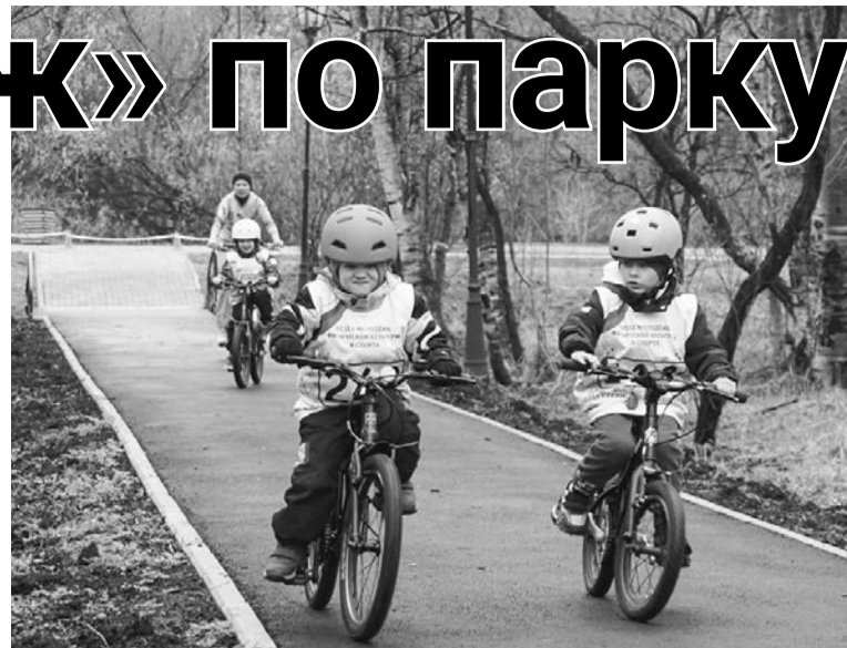
Гонщики проявляли характер и боролись за призовые места.

Не у всех всё получалось, но гонщики не сдавались и старались финишировать. В стартовом городке и на дистанции их поддерживали мамы и папы, бабушки и дедушки, братья и сестры, друзья. Громко болели, переживали, верили в своих чемпионов и гордились ими. Соревнования — важное событие в жизни каждого спортсмена. Как отмечают