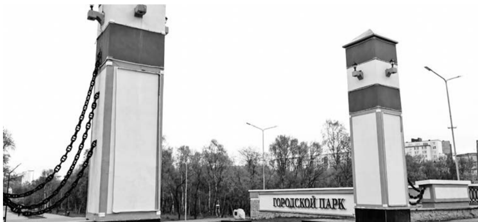
Входную группу городского парка ждет небольшой косметический ремонт.