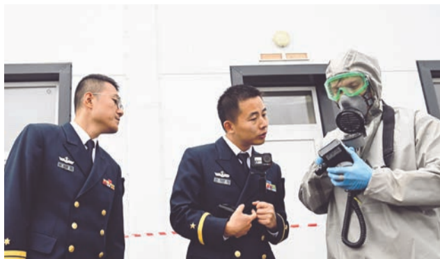
Сбор стал очередным этапом развития морской медицины как отдельного направления здравоохранения.

В Мурманске состоялся сбор руководящего состава медицинской службы Военно-морского флота (ВМФ) Российской Федерации — впервые с участием представителей Военно-морских сил Народно-освободительной армии Китая.