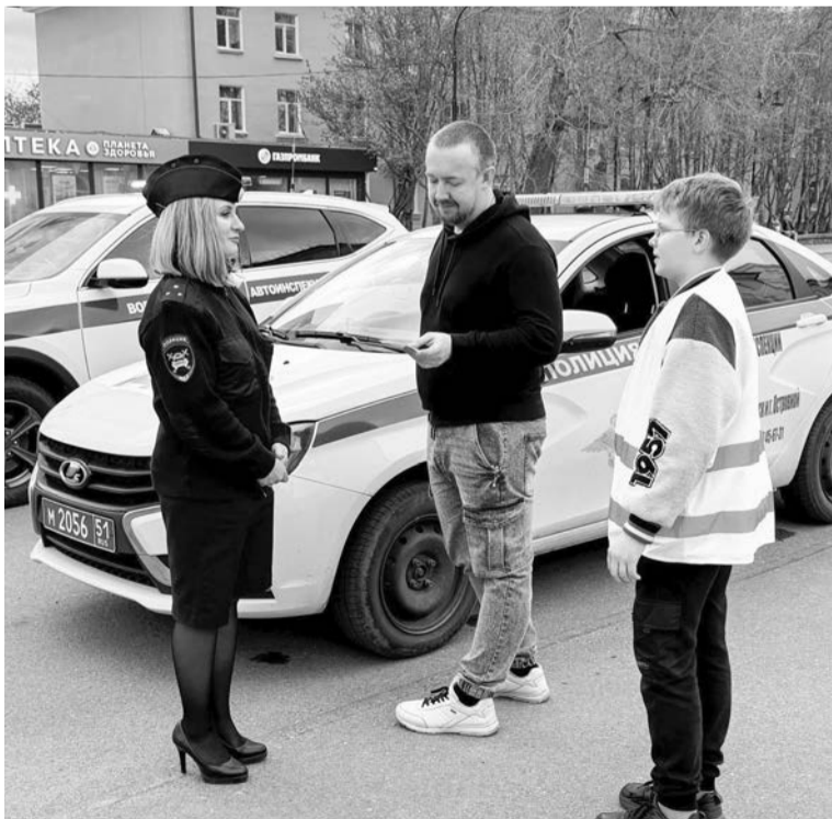
Участники акции призывали водителей быть особенно бдительными вблизи пешеходных переходов.

Вместе с сотрудниками ГАИ, ВАИ и педагогами ребята из отрядов ЮИД школы №12 и Центра профилактики ДДТТ напоминали жите-