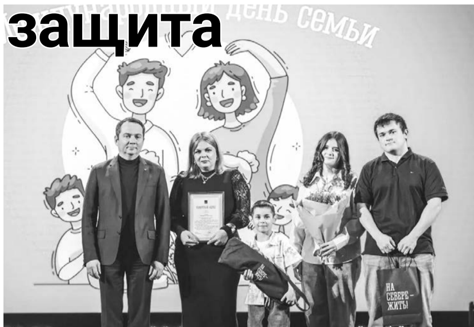
Губернатор Андрей Чибис вручил памятный адрес семье Асваровых.

Наталья СТОЛЯРОВА.