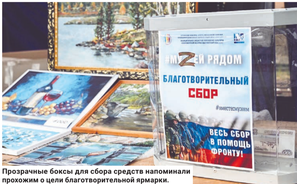
Прозрачные боксы для сбора средств напоминали прохожим о цели благотворительной ярмарки.