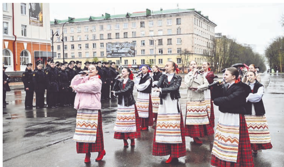
Образцовый детский вокально-хореографический ансамбль «Родничок».