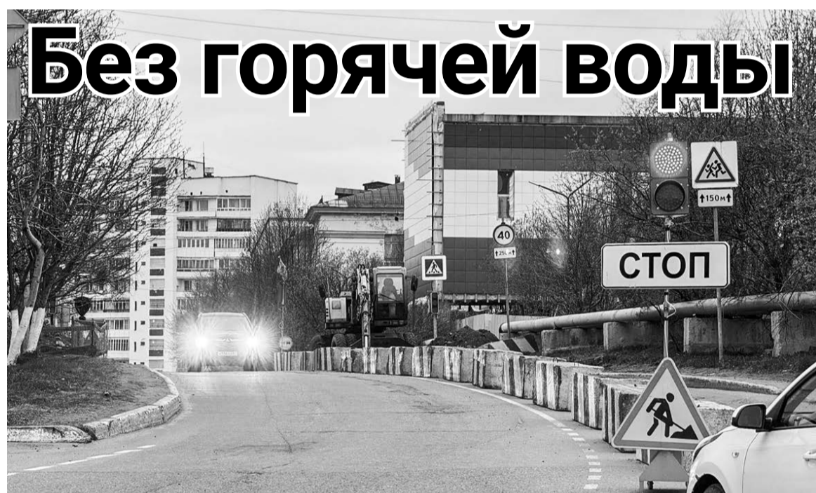
На ул. Сгибнева организовано реверсивное движение. Подрядчик проводит замену участка тепловой сети. Установлен светофор, временные дорожные знаки и ограждения.

В Североморске продолжают работы по капитальному ремонту тепловых сетей в рамках программы реновации ЗАТО. В связи с этим летние отключения для двух тепловых районов — «9-й микрорайон» и «Верхняя Ваенга» — будут превышать обычные две недели.