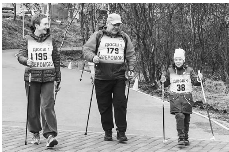
Вместе по Аллее спорта шагали взрослые и дети, разница была лишь в количестве кругов.

В городском парке состоялось традиционное первенство ЗАТО по северной ходьбе. Оно объединило более 30 детей и взрослых от 8 до 65 лет и старше из Североморска и Мурманска.