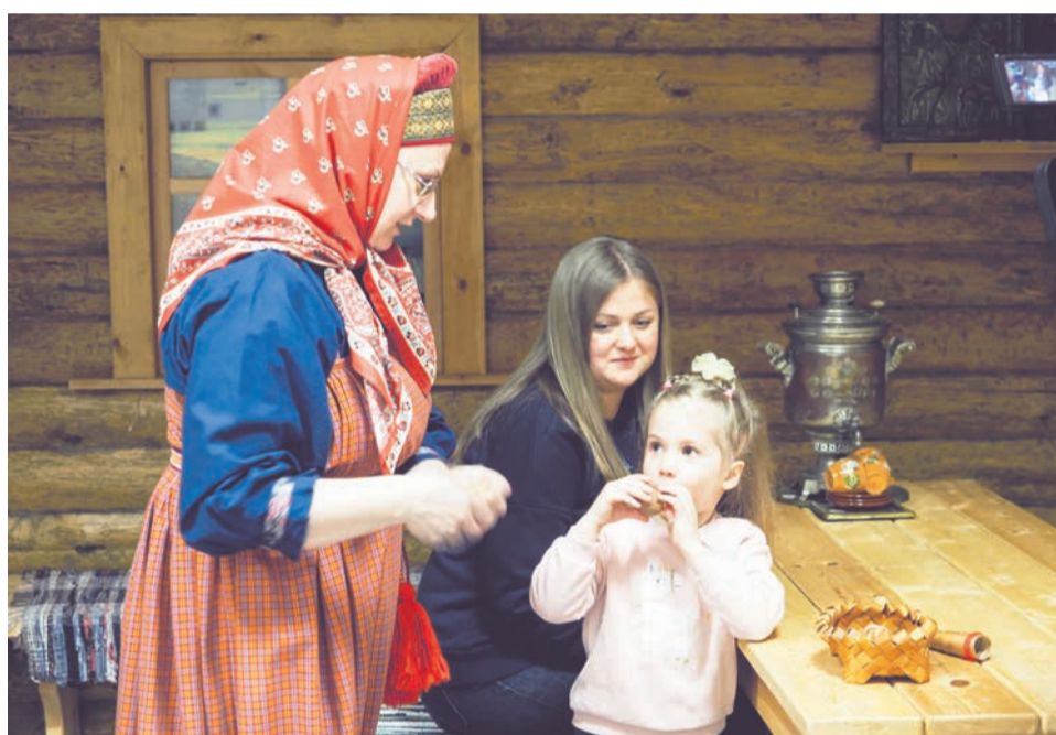
Одними из самых любознательных посетителей «Поморской избы» были дети.