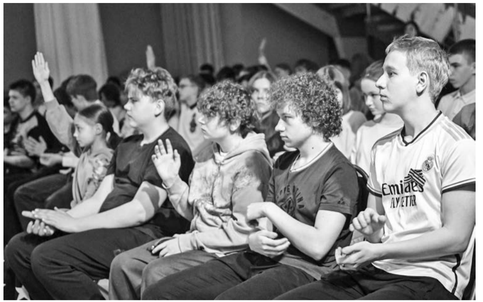
Североморских школьников интересует многое: что было раньше, что будет завтра, как текущие события повлияют на их жизнь.