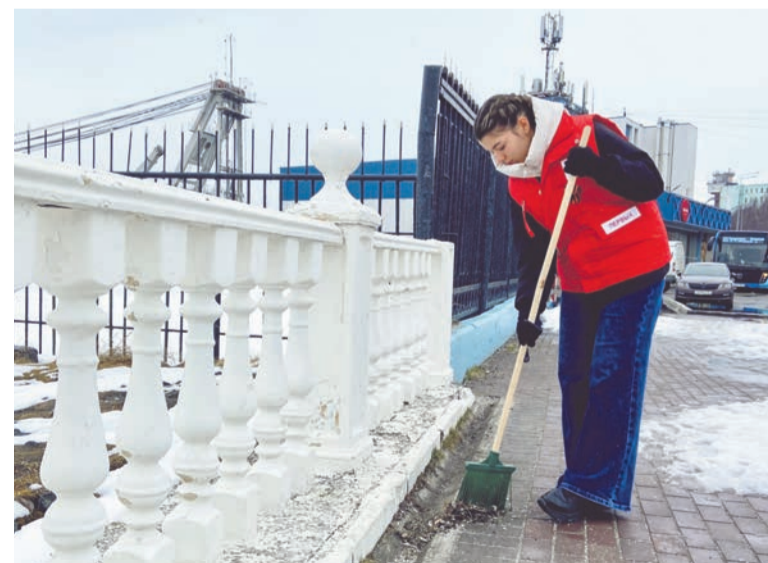
Настало время «привести в порядок свою планету».

И. Марченко. И читая годы жизни, удивляются, как молоды были те, кто садился за штурвал самолета.