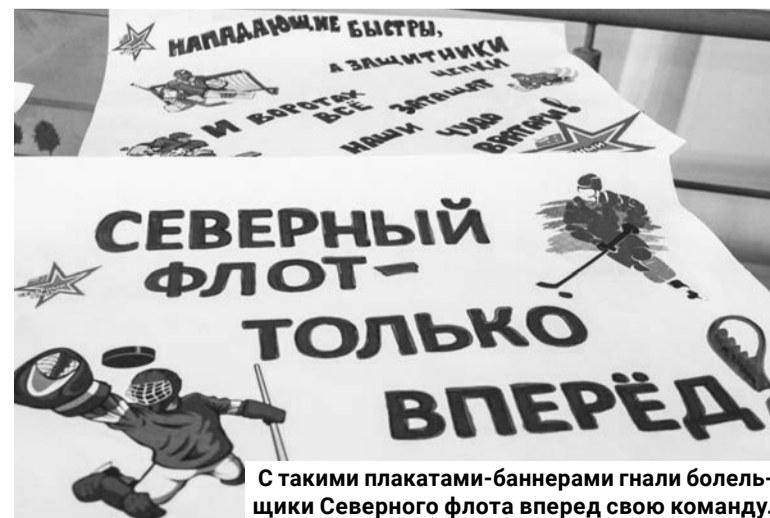
С такими плакатами-баннерами гнали болельщики Северного флота вперед свою команду.