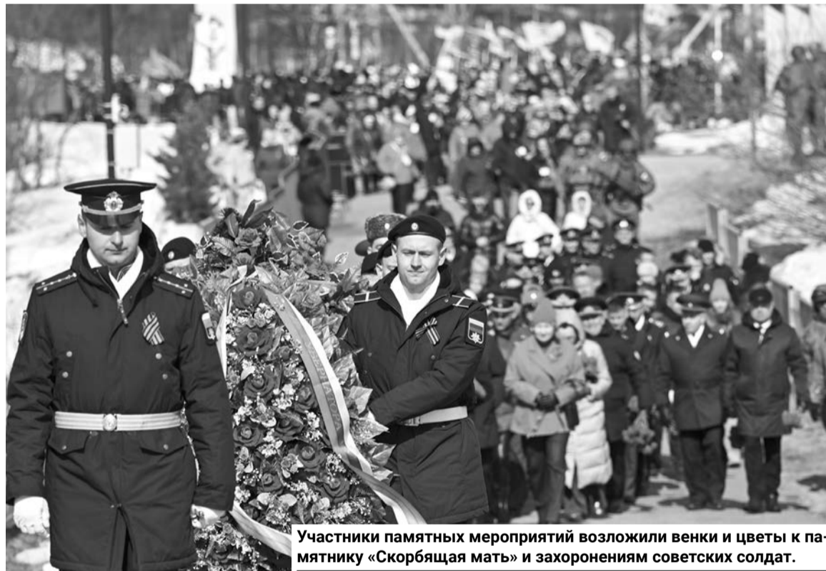
Участники памятных мероприятий возложили венки и цветы к памятнику «Скорбящая мать» и захоронениям советских солдат.

Подготовила Яна АРБУЗОВА