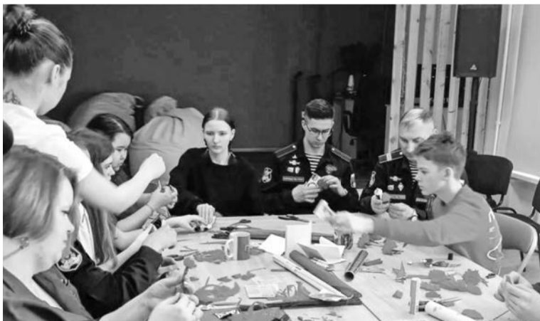
Праздничные открытки, изготовленные с любовью, дополняют подарки к годовщине Великой Победы для ветеранов.