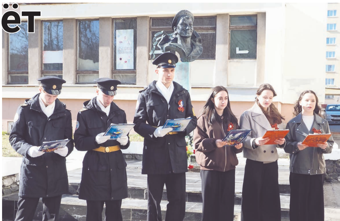
Участники акции напомнили североморцам, какой дорогой ценой была завоевана победа.

— На точки нашего маршрута приглашены школьники. Мы считаем, что это важно — рассказывать о Великой Отечественной