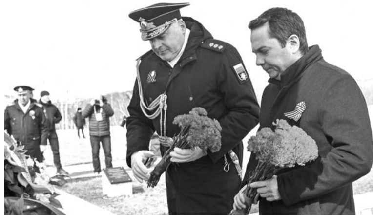
В торжественной церемонии приняли участие губернатор Мурманской области Андрей Чибис и командующий Северным флотом Константин Кабанцов.

У Дворца культуры имени С. М. Кирова в Мурманске, а также в Североморске будут органи-