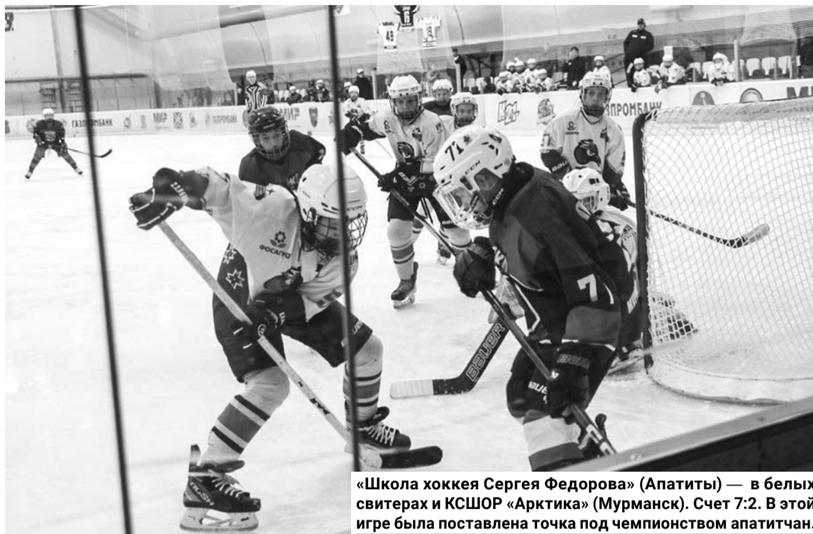
«Школа хоккея Сергея Федорова» (Апатиты) — в белых свитерах и КСШОР «Арктика» (Мурманск). Счет 7:2. В этой игре была поставлена точка под чемпионством апатитчан.

С 1 по 3 мая в Североморске, в преддверии Дня Победы, прошел турнир детских команд (ребята 2014–16 г.р.) под названием «Кубок северных городов». За трофеем отправились аж семь команд: помимо местной, это коллективы из Мурманска, Оленегорска, Кировска, Апатитов, а также Дудинки (Таймыр, Красноярский край).