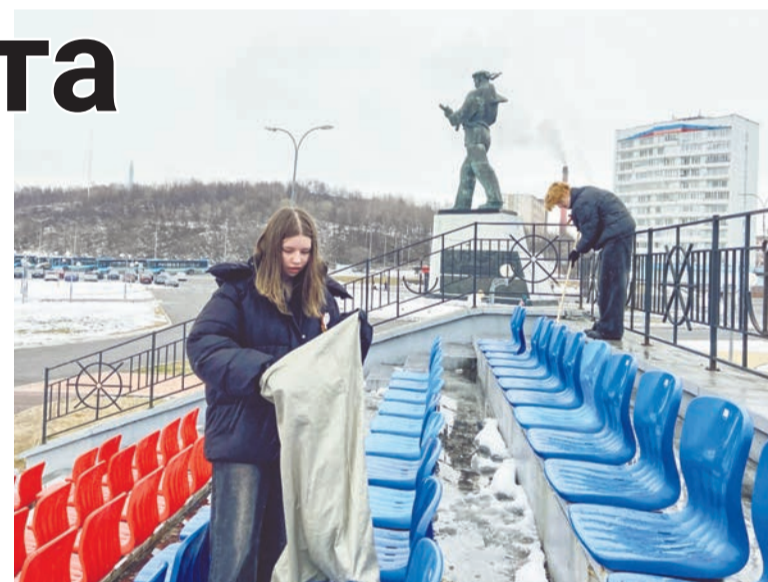
Первомай — праздник Весны и Труда. А также чистоты и порядка.