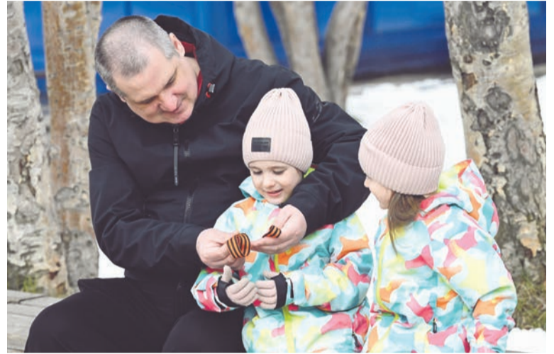
Георгиевская лента — как эстафетная палочка истории, которая передается от поколения к поколению.

жается, напоминая: пока мы помним прошлое, у страны есть будущее.