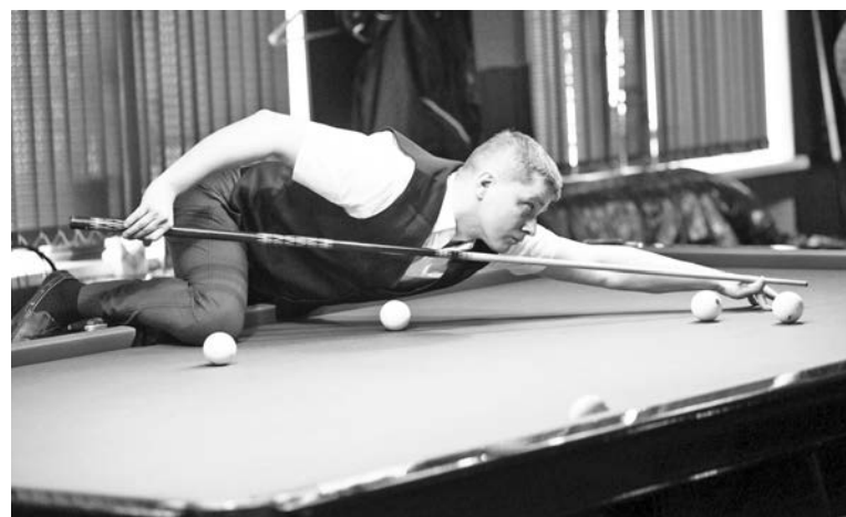
Кто-то за победой шел в обход, а кто-то – напралом.