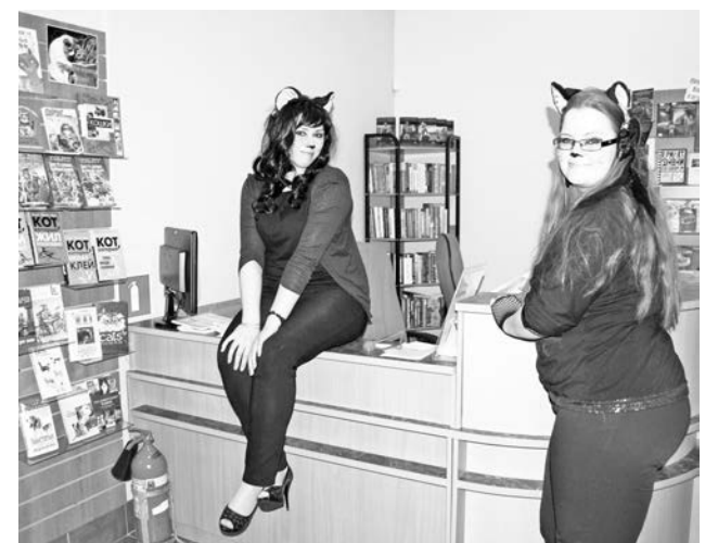
Библиокошки не бездельничали: представляют тематическую подборку о себе, любимых, и вели конкурсы.