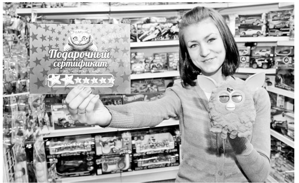
Подарите ребенку сертификат – а игрушку он выберет сам!

Дошколятам будут полезны всевозможные прописи-раскраски и тесты в картинках для подготовки к школе, настолько интересные и яркие, что ребенок просто не заметит, что занят вполне серьезным делом. Все они разной направленности: на развитие речи, памяти, мышления, логики. Также для подарка подойдут пазлы: крупные – для малышей, а для взрослых – панорамные, светящиеся в темноте, фактурные, объемные 3D-пазлы. А также модели танков, кораблей и самолетов – все для развития мелкой мо-