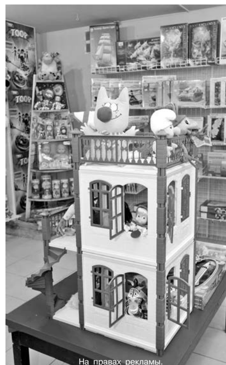
На правах рекламы.

Начнем с самых маленьких. Вариантов для, казалось бы, такого непритязательного возраста, как груднички, здесь найдется немало: от традиционных, но очень красивых и, главное, качественных погремушек «Hasbro» и «Fisher price» до развивающих наборов, позволяющих начать процесс обучения ма-