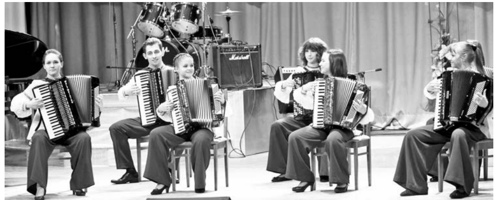
«Коллаж» блестяще выступает на любых концертных площадках.