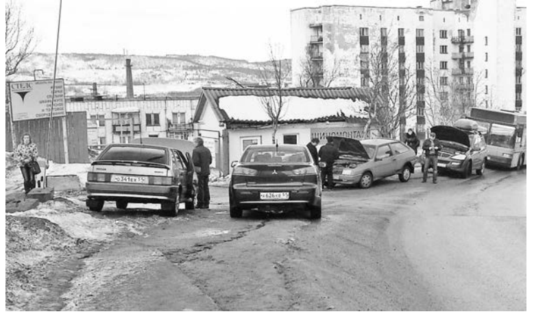
На ул.Падорина, напротив Госавтоинспекции, правила остановки автотранспорта нарушаются среди бела дня.

«Мало того что автолюбители постоянно паркуются в пешеходной зоне, так теперь еще и техосмотр проходят в пешеходной зоне прямо у ГАИ, - пи-