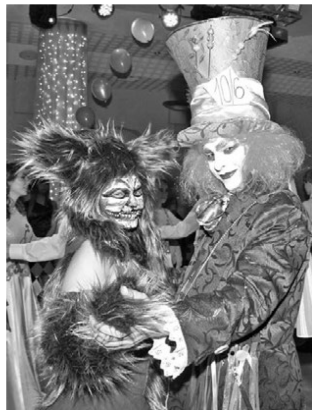
Ну где еще увидишь танцующих Кота и Шляпника?!