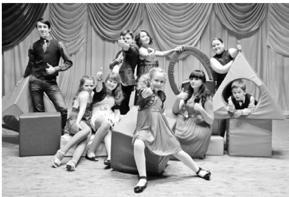
В этом творческом сезоне юные актеры «Поиска» впервые выступили в ампуле ведущих концерта.