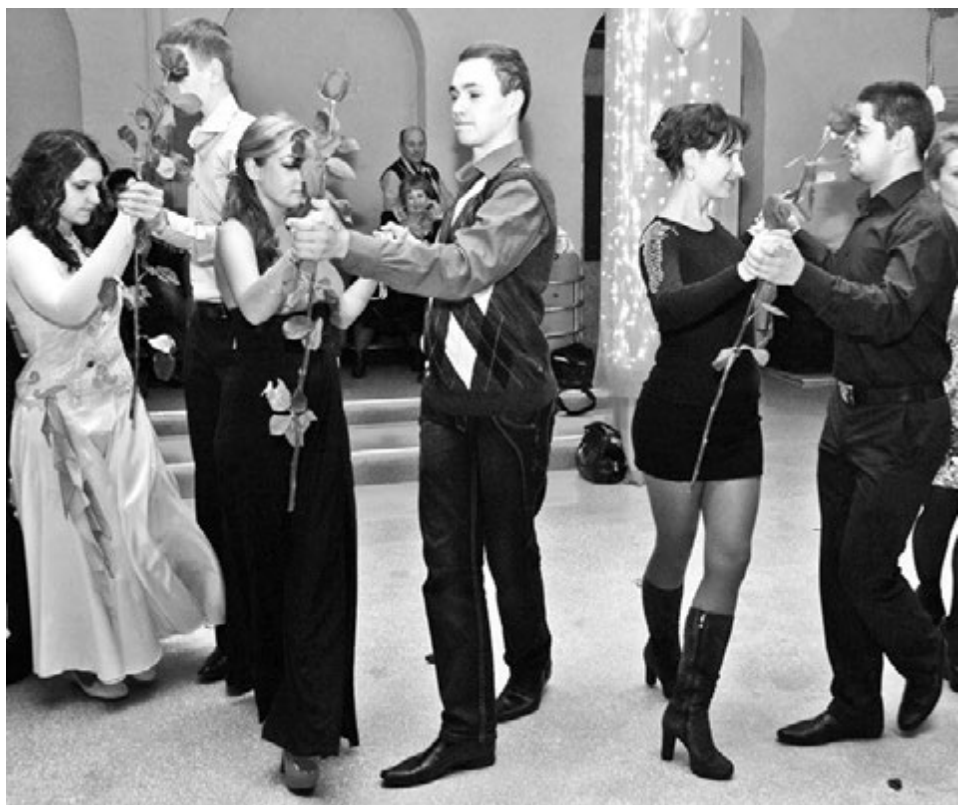
Вы пришли без пары? Это не беда - на балу у Красной Королевы партнер обязательно найдется.