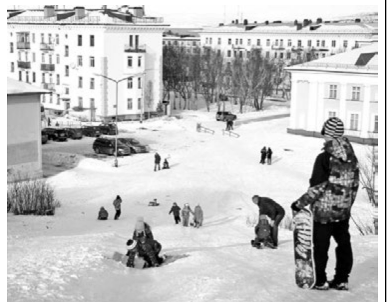
Горка возле ДОФа всегда была популярной среди детей. Мало того, в 60-х на ней проводили праздник «Проводы зимы».