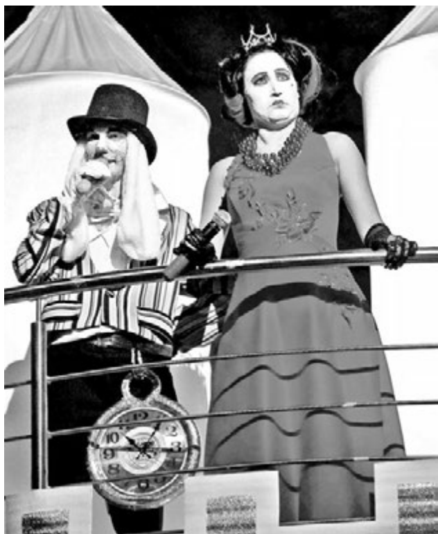
Герои бала будто сошли с киноафиши «Алисы в Стране Чудес».

Такие взрослые, а верят в чудеса... Но как в них не поверить, когда рядом мурлычет огромный Чеширский Кот, Гусеница предлагает чаю, а какая-то безумная особа норовит отрубить тебе голову?!