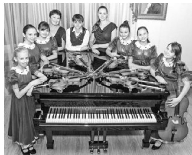
Ансамбль скрипачей «Каприччио».