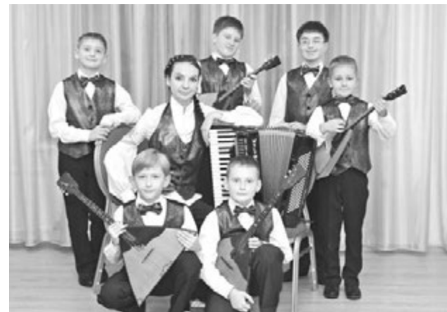
Ансамбль балалаечников «Искорки».

Благодаря вниманию и поддержке со стороны городских властей школа имеет возможность приобретать мастерские музыкальные инструменты,