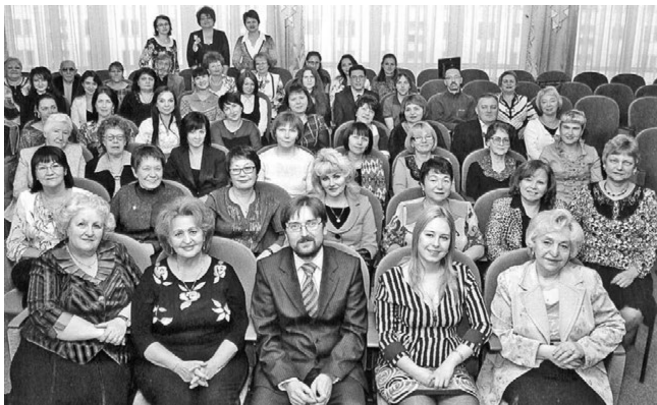
Большой творческий коллектив музыкальной школы на педагогическом совете.