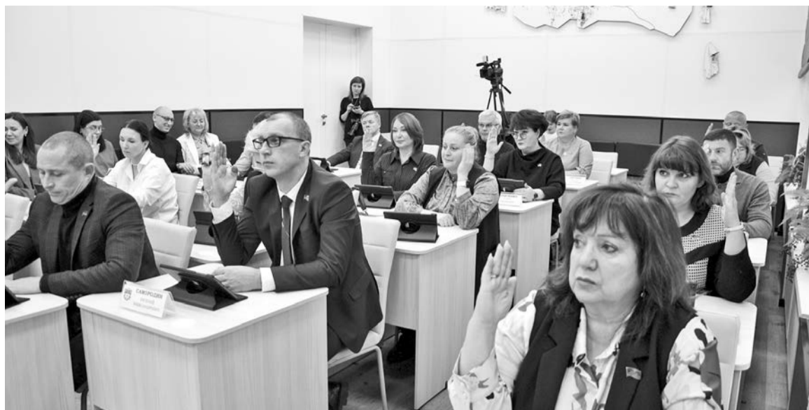
Североморские депутаты работают над бюджетами уходящего и грядущего годов: проводят публичные и бюджетные слушания, заседания рабочих групп.