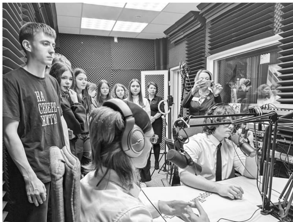
Каково это, когда твой голос звучит на весь город, почувствовали ребята в радиостудии «Север-ФМ».

На днях старшеклассники школы №7 посетили три редакции «Североморского информационно-аналитического центра». Корреспонденты, монтажеры, операторы и редакторы газеты «Североморские вести», Североморского телевизионного канала и радио «Север-ФМ» поделились секретами производства печатных и эфирных новостей, ответили на вопросы ребят.