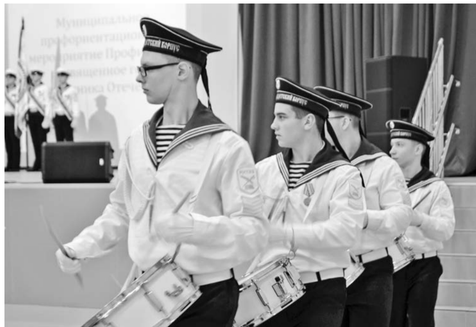
Барабанщики из Североморского кадетского корпуса буквально «оглушили» гостей своим мастерством.