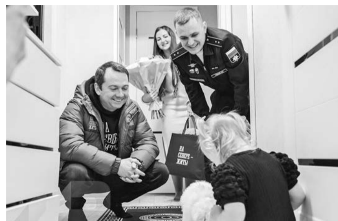
Андрей Чибис отметил, что ради таких моментов хочется работать еще больше.

Удивительные находки, творческие эксперименты и захватывающие истории — именно так теперь выглядит библиотечная жизнь в Североморске и окрестностях благодаря программе «Пушкинская карта».