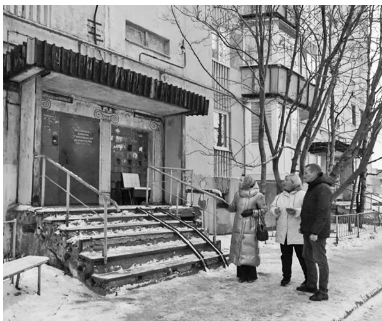
В первую очередь участники рейда обращали внимание на чистоту и безопасность крылец и тротуаров.