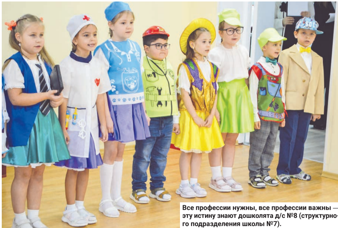
Все профессии нужны, все профессии важны — эту истину знают дошколята д/с №8 (структурно-подразделения школы №7).

18 ноября в Комплексном центре социального обслуживания населения ЗАТО Североморск состоялся концерт в честь старшего поколения североморцев, отдавших несколько десятилетий на благо Мурманской области и России.