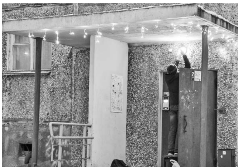
Сотрудники управляющих компаний на ул. Комсомольская уже создают для жителей праздничное настроение.

Анна ЛИПИНА.