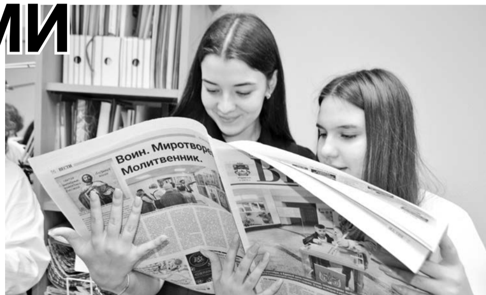
Газета в руках молодежи сегодня редкость, но тем интереснее читать новости и разглядывать фотографии, находя знакомых и друзей.

А интересовало юных североморцев многое: достаточно ли для корреспондента журналистского образования или нужен талант, что делать, если респондент отвечает односложно, где искать героев публикаций и эфиров, и даже как опубликовать собственные произведения.