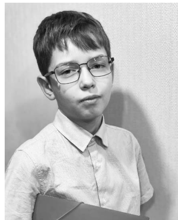
Это первая большая победа юного североморца.

Людмила РОМАНОВА.