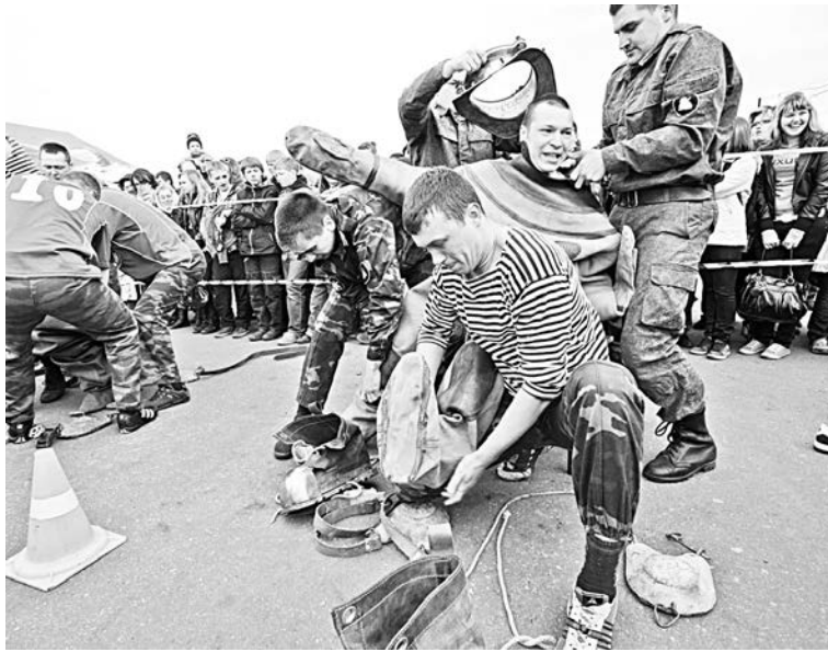
Вес обувки - 24 кг, еще 10 кг весит рубаха, в общей сложности костюм водолаза тянет на 90 кг. Надеть его в одиночку не под силу даже богатырю.

Во второй части турнира команды ожидали разные задания, в зависимости от набранных баллов. Занявшим с 5-го по 8-е места предстояло участвовать в перетягивании каната - у водолазов это называется «сдвинь бот, лежащий на грунте». Бот - команда сопер-