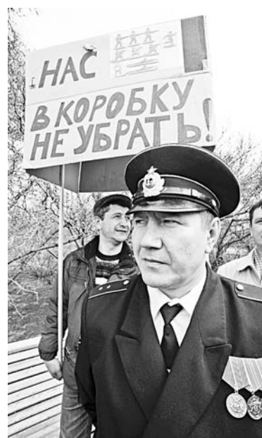
Военнослужащие уверены: «Мы 20 лет выполняли приказы. Правительство обязано выполнить хотя бы одно обещание».