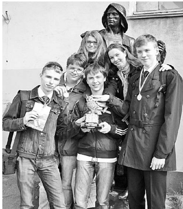
Отправиться на каникулы, победив принципиального соперника, – залог хорошего настроения на все лето.

Анна ВИХРОВА. Фото из альбома команды «Легион».