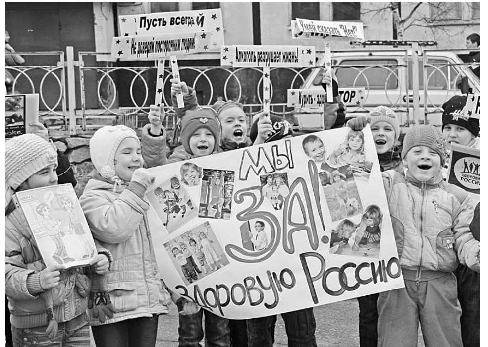
Плакаты и рисунки антитабачной направленности дети подготовили вместе с воспитателями.