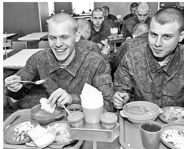
Дефицит массы тела устраняется вкусными полторными, а то и двойными порциями.