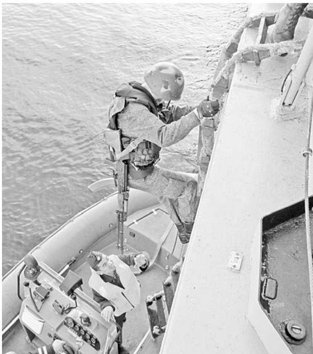
Освобождение гражданского судна от вооруженных экстремистов - один из самых зрелищных моментов учений.

В течение пяти дней союзники отработывали совместные действия в Арктическом регионе. Помимо артиллерийских стрельб по целям в воздухе и на воде выполнили освобождение условной нефтяной платформы и гражданского судна от вооруженных экстремистов, спасение потерпевших бедствие.