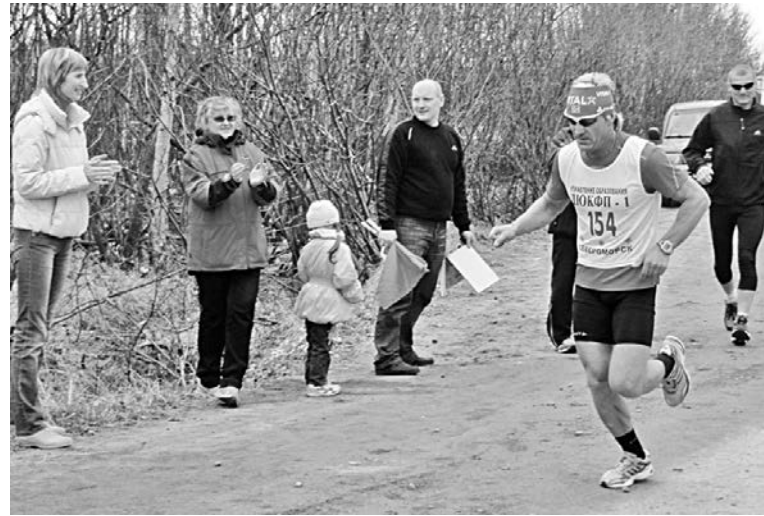
Участники соревнований признались, что полностью преодолеть дистанцию им помогла поддержка зрителей.

135 человек - 99 мужчин и 36 женщин - из Североморска, Мурманска, Мончегорска, Колы, Апатитов, Полярных Зорь собрались 22 мая у центрального входа в загородный парк, чтобы выявить лучшего в ежегодном первенстве Мурманской области по бегу на шоссе.