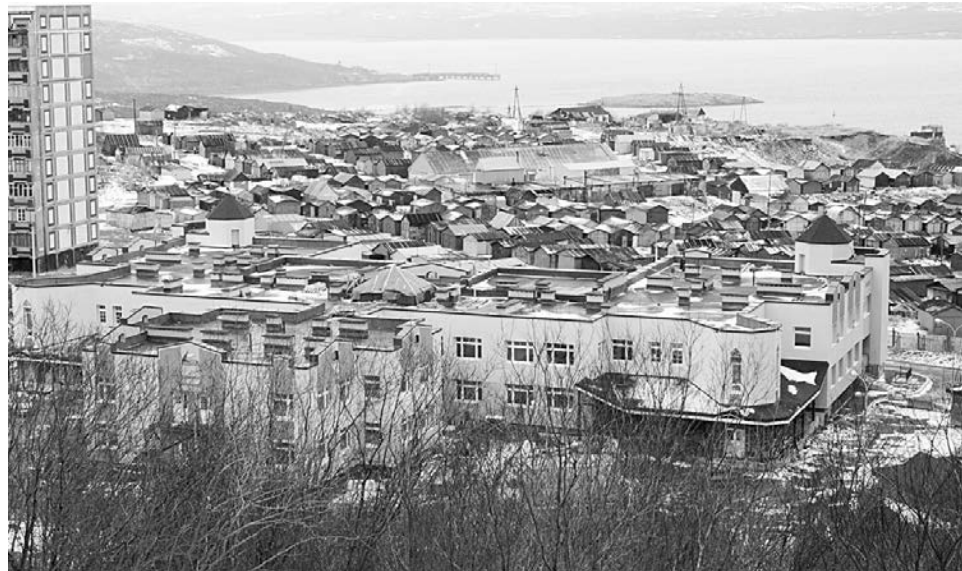
Сейчас идет комплектование нового детского сада на ул.Чабаненко детьми и сотрудниками – требуются дипломированные специалисты дошкольного образования.

– Спасибо за беседу! Записала Ирина ПАЛАМАРЧУК.