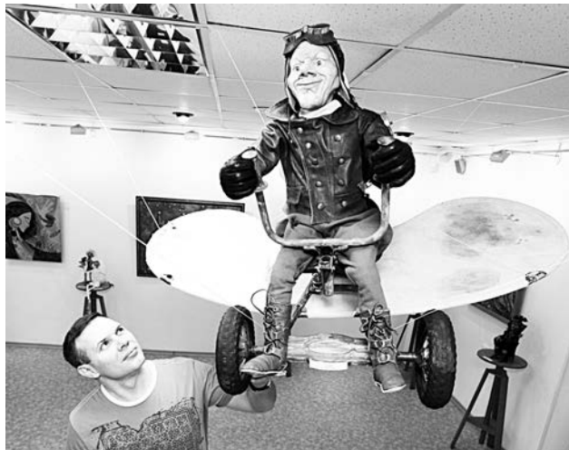
Летчик, творение рук Светланы Абариной, стал одним из самых популярных персонажей выставки.

таны костюмы, на лицах видна каждая морщинка, хитрая ухмылка или ямочки на щеках от доброй улыбки. Именно естественность в облике каждого подкупает больше всего. А дополнением к основной кукольной экспозиции стали картины, написанные все теми же авторами и гармонично вплетенные в канву выставки.