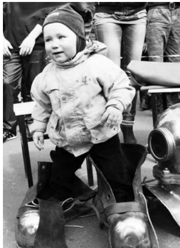
Олегу Иванову 1,5 года, но водолазные галоши пришлось впору. Жаль только, что одна такая весом - как юный герой.

В столице Заполярья впервые состоялось празднование Дня водолаза. До этого года оно дважды проходило в нашем ЗАТО. Почетным гостем праздника стал Герой России Анатолий Храмов, бывший начальник Управления 40-го ГосНИИ аварийно-спасательного дела, водолазных и глубоководных работ Минобороны РФ капитан 2 ранга запаса, покоривший 500-метровую глубину.