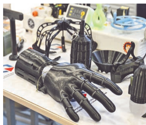
Чего только не распечатывают на современном 3D-принтере!