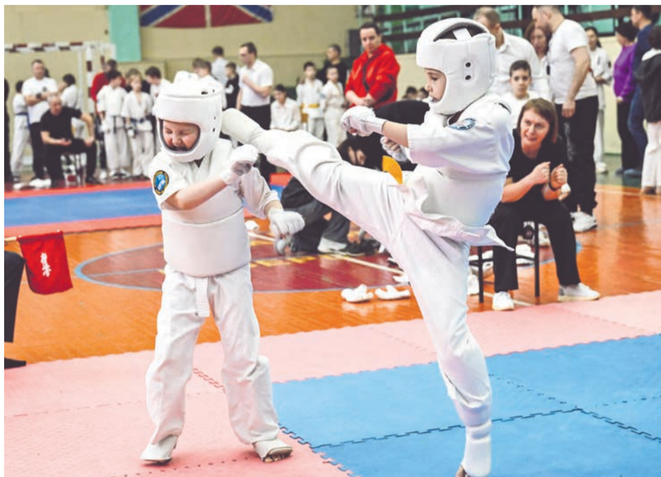
От удара соперника каратистов спасает защитная амуниция.

Зрелище собрало немало зрителей. Напомним, стиль киокусинкай был создан в противовес множеству