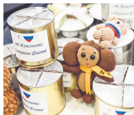
Посылка в зону СВО с сердечком от Женсовета Северного флота.