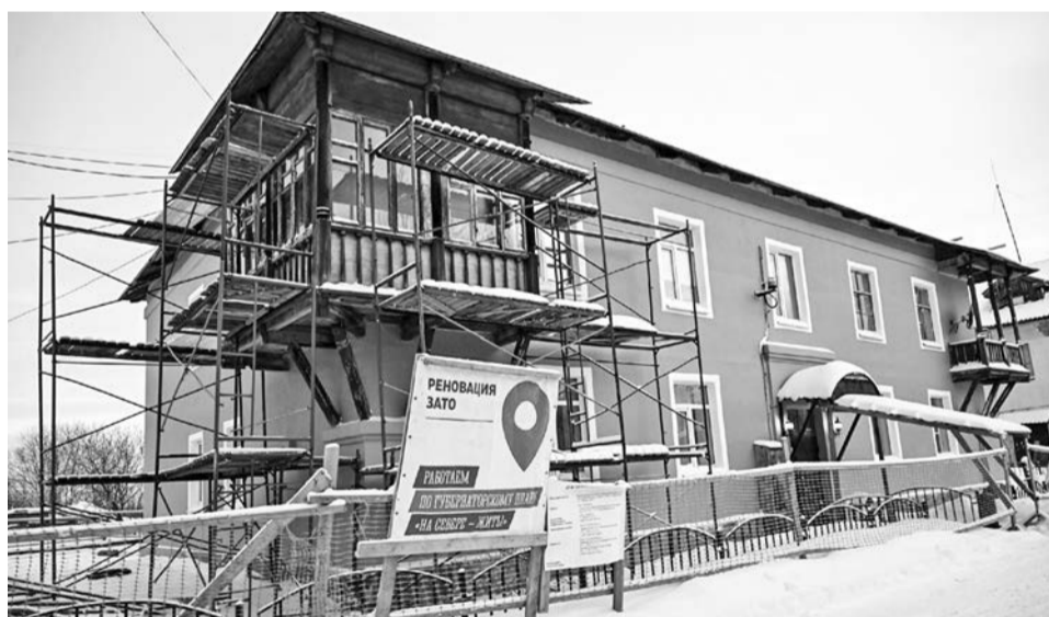
Две старейшие улицы Североморска — Северная и Советская — обновляются.

форте; снести 9 аварийных домов и благоустроить 10 дворов, чтобы наши города становились уютнее; построить инженерные коммуникации — центр питания в Североморске, чтобы снять целый набор ограничений для развития города. И конечно, по тем изменениям, которые я вижу, приезжая в эти населенные пункты, по позитивной обратной связи от жителей мы понимаем, что программа работает эффективно. Спасибо за поддержку Президенту, — сказал губернатор.