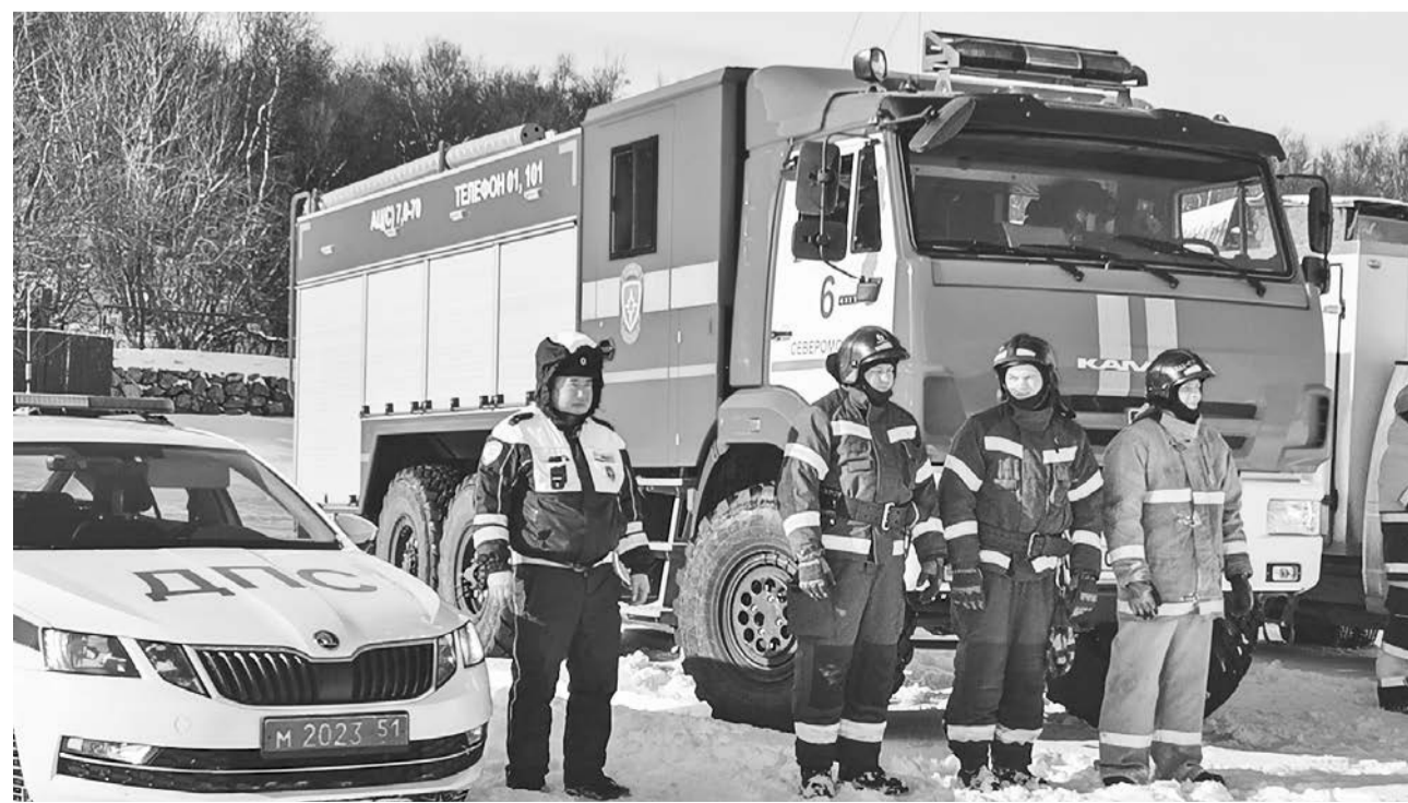
Слаженная работа сотрудников ДПС и службы пожаротушения отрабатывается на регулярных тренировках.

Наталья СТОЛЯРОВА.