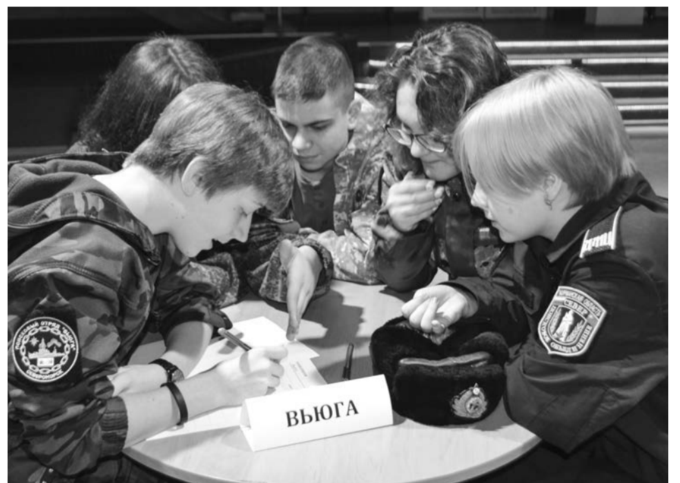
Победители викторины — команда «Вьюга» Детского морского центра им. В. Пикуля.