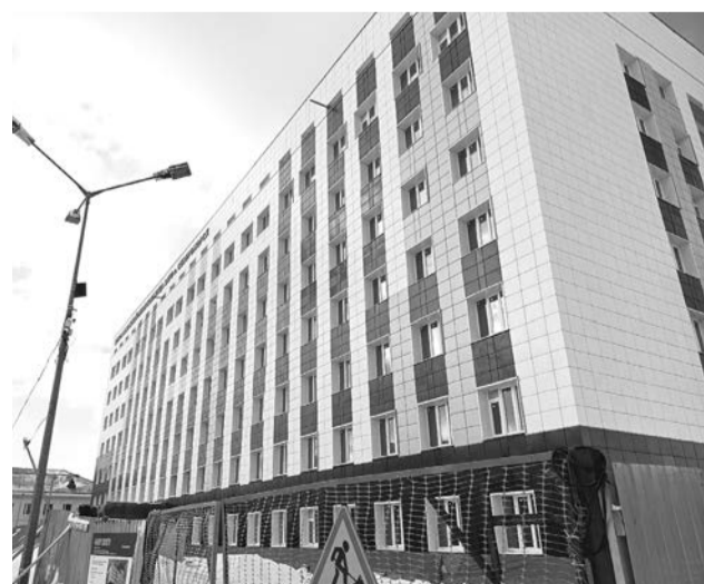
Фасад ЦРБ уже приобрел современный вид.

Строительство садов в текущем году начнется в Печенге, Корзуново, Гаджиево, Ви-