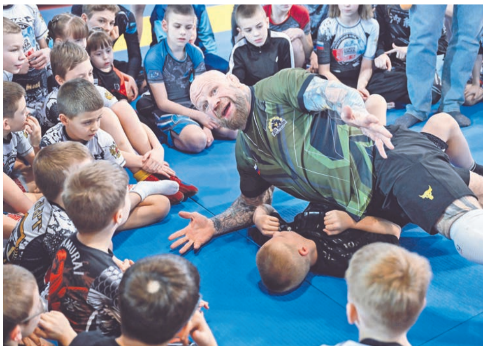
Джефф Монсон наглядно продемонстрировал, как правильно выполнять приемы, ребята впервые столкнулись со звездой столь высокого ранга.

мастер-классы всегда проходят весело. Обожаю эти занятия.