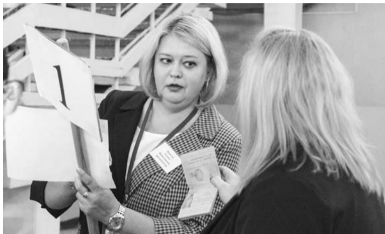
На пробных экзаменах было всё по-взрослому, паспорт пришлось предъявить даже директору школы.