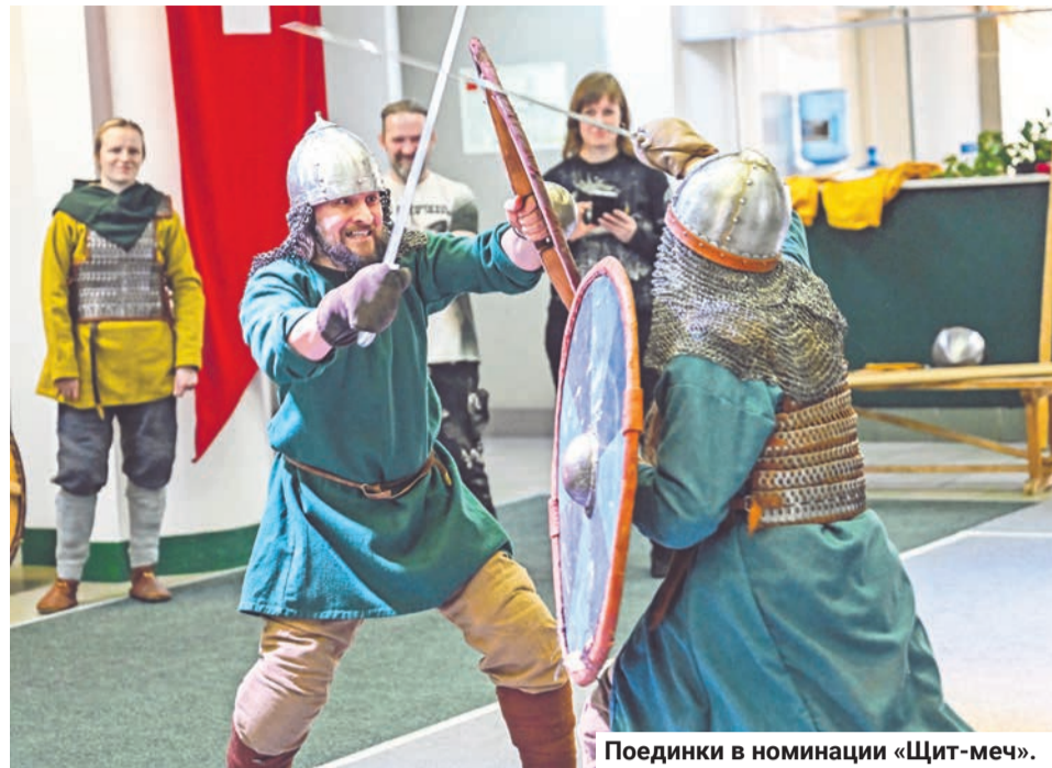
Поединки в номинации «Щит-меч».

Она призналась, что от мужчин не ждет поблажек. Ей интересно проверить свои силы на ристалище в противо-