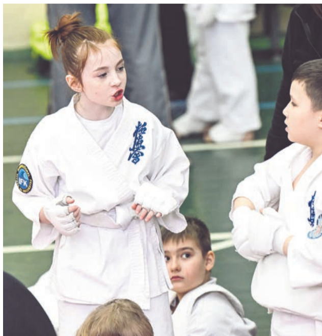
Киокусинкай с удовольствием занимаются не только мальчишки, но и девчонки.

16 марта в спорткомплексе «Богатырь» уже в 20-й раз прошло открытое первенство и чемпионат Североморска по киокусинкай, посвященное памяти Героя России, заслуженного военного летчика Тимура Апакидзе. (6+).