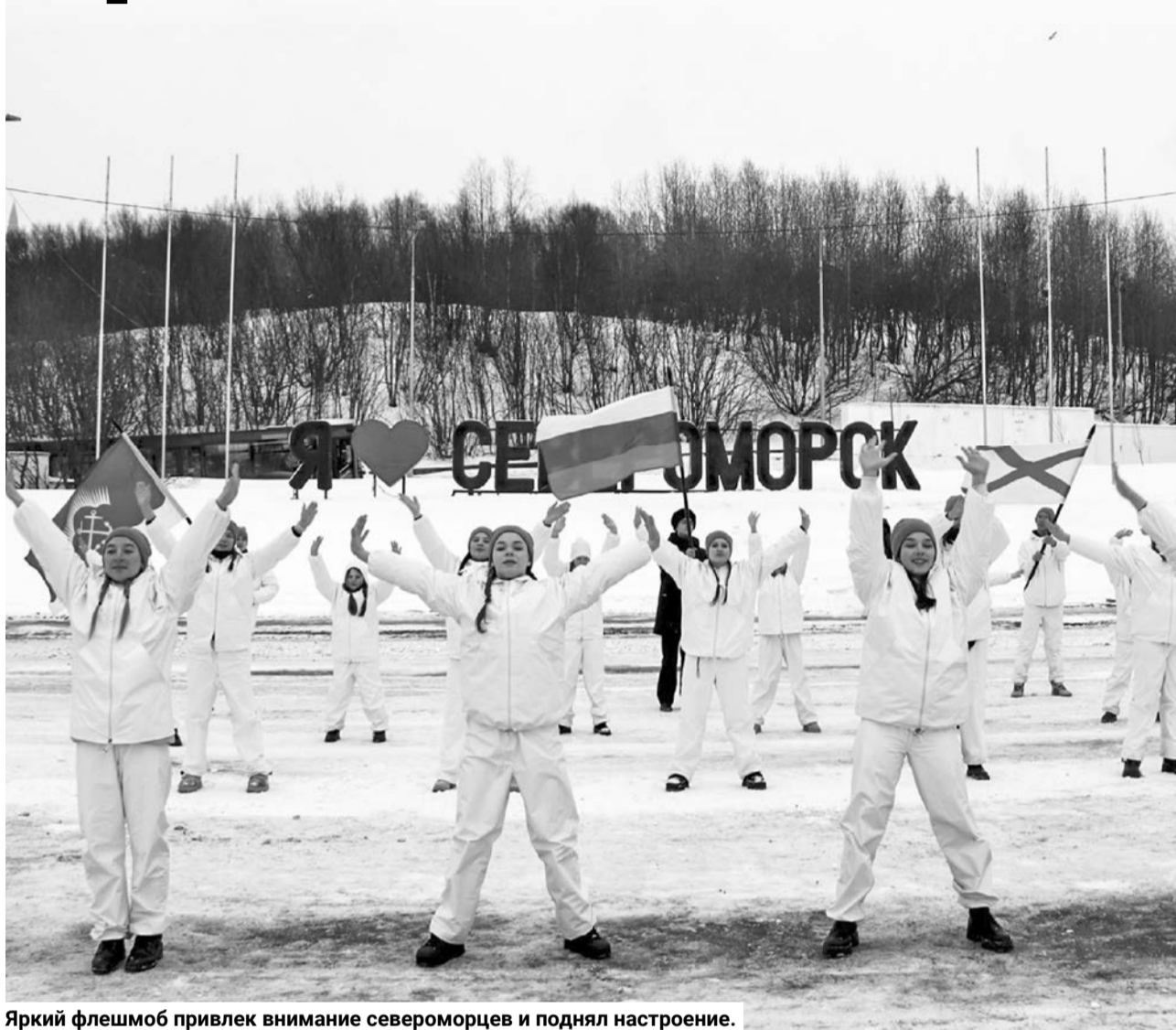
Яркий флешмоб привлек внимание североморцев и поднял настроение.

18–19 марта в Мурманской области проходили командно-штабные учения, призванные скоординировать действия сил и средств муниципалитетов при возникновении чрезвычайных ситуаций.