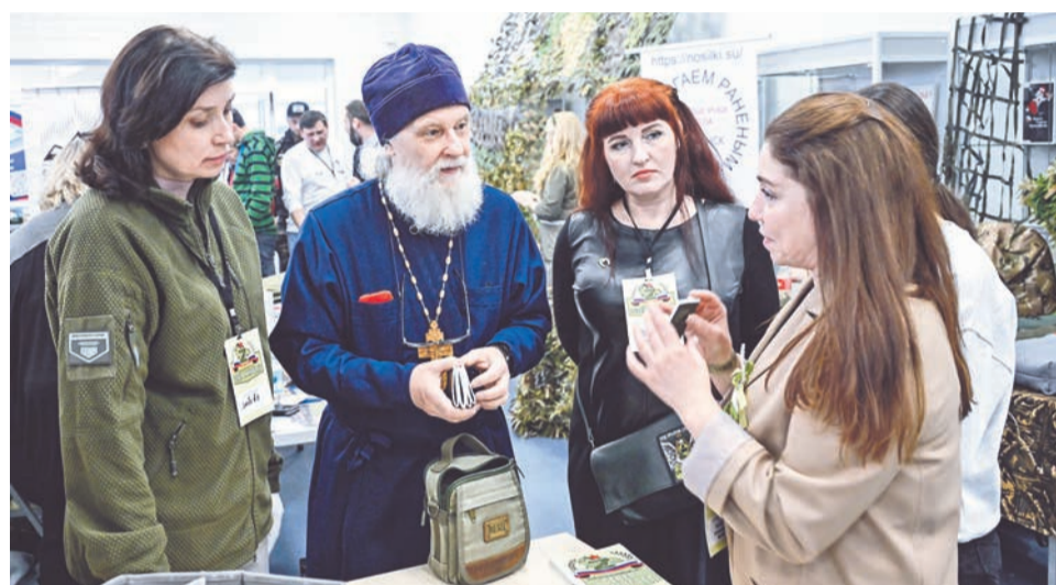
Православные священнослужители зачастую и сами выступают в роли добровольцев.