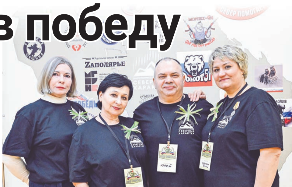
Волонтерский форум помог собрать вместе единых по духу людей.