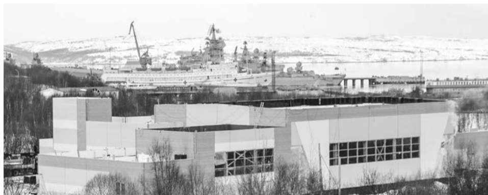
Долгожданный новый плавательный бассейн распахнет свои двери для североморцев уже летом этого года.