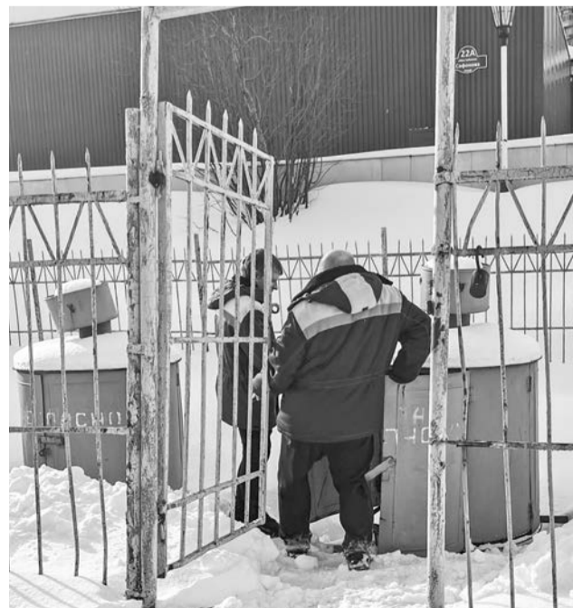
Газовая служба провела свои работы на газгольдерах — резервуарах для хранения и подачи газа, расположенных во дворе подтопленного дома.