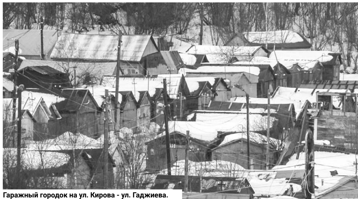
Гаражный городок на ул. Кирова - ул. Гаджиева.