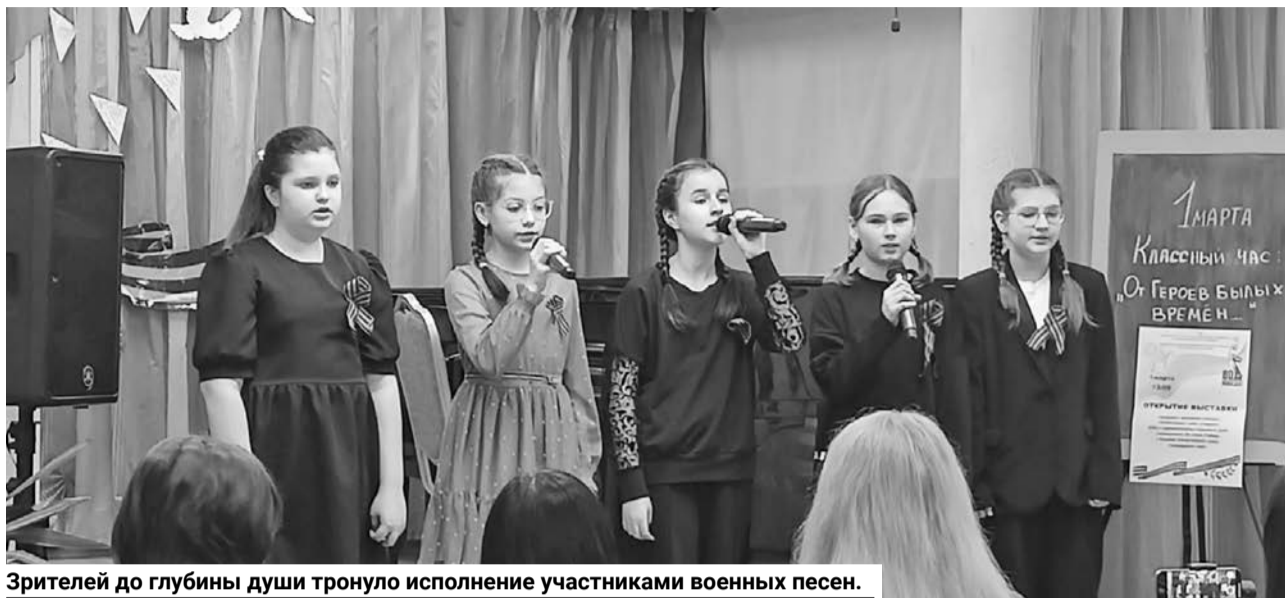
Зрителей до глубины души тронуло исполнение участниками военных песен.