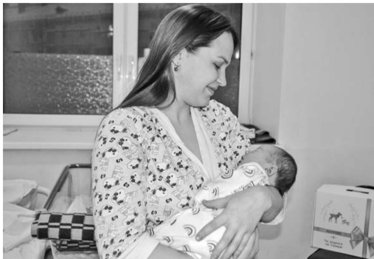
Благодаря новому проекту семьи получают поддержку и на этапе планирования ребенка, и в процессе ожидания малыша, и после его появления на свет.

— Для семей, которые заключили брак, будет доступен «Сертификат молодоженов», включающий комплексное обследование репродуктивного здоровья, консультации врачей и психологов, скрининговые программы. Это будет не просто сертификат, а «зеленый свет» в медучреждениях, чтобы молодые люди могли