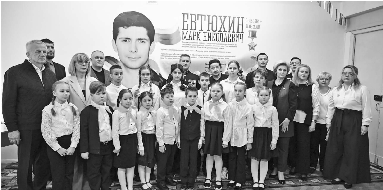
Появившийся в школе мурал — еще одно напоминание о том, на кого нужно равняться, когда мы говорим о примере истинного патриотизма.

Анна ВИХРОВА, Лина ДЫМОВА.