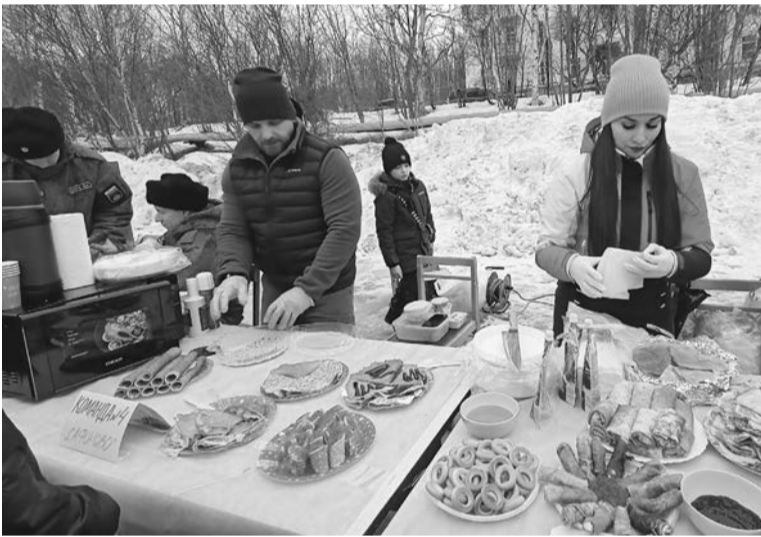
В поселке Сафоново гостей порадовала насыщенная программа и обширное блинное меню.