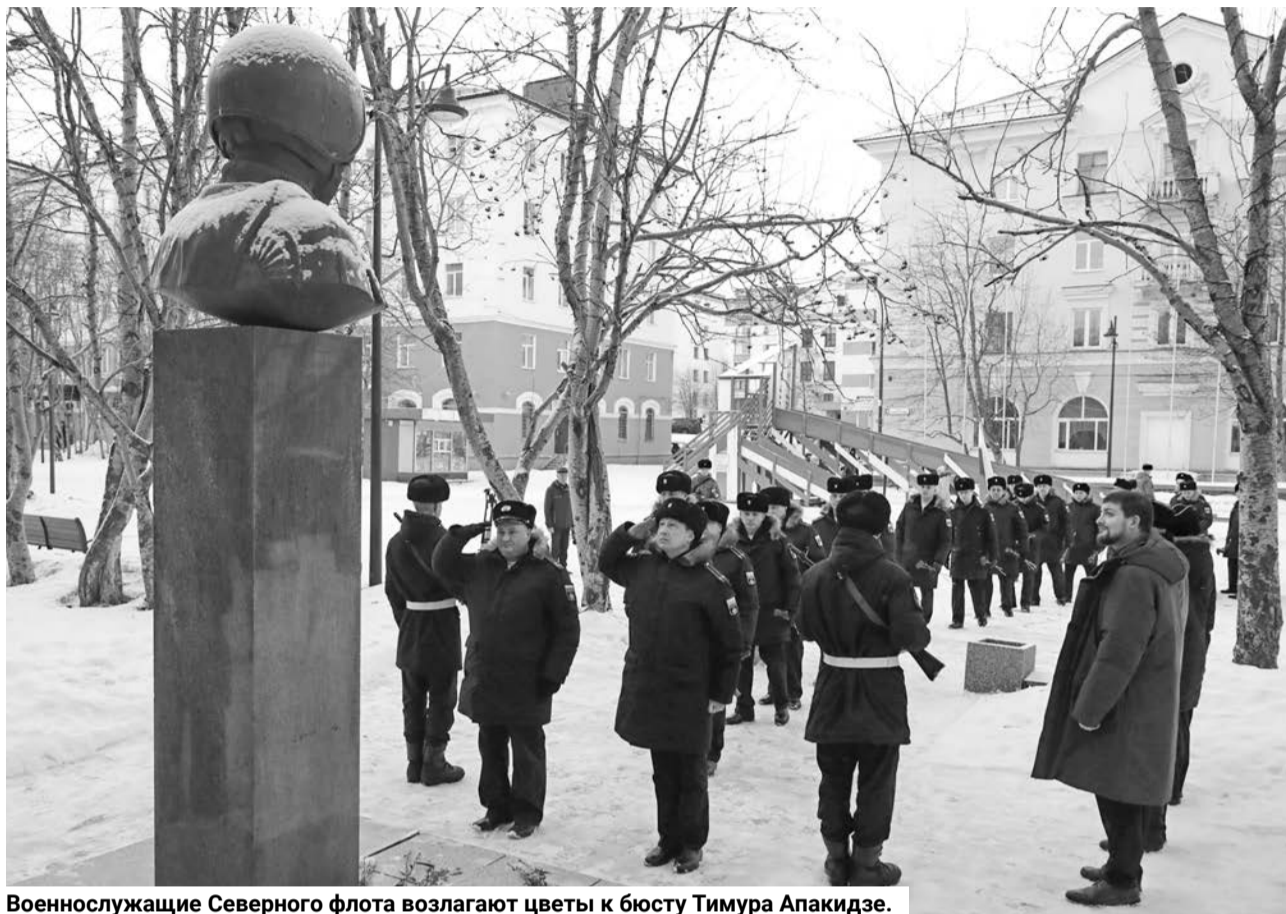
Военнослужащие Северного флота возлагают цветы к бюсту Тимура Апакидзе.

Автандилович трагически погиб во время показательного выступления на празднике, посвященном 85-летию создания морской авиации ВМФ России в городе Остров Псковской обла-