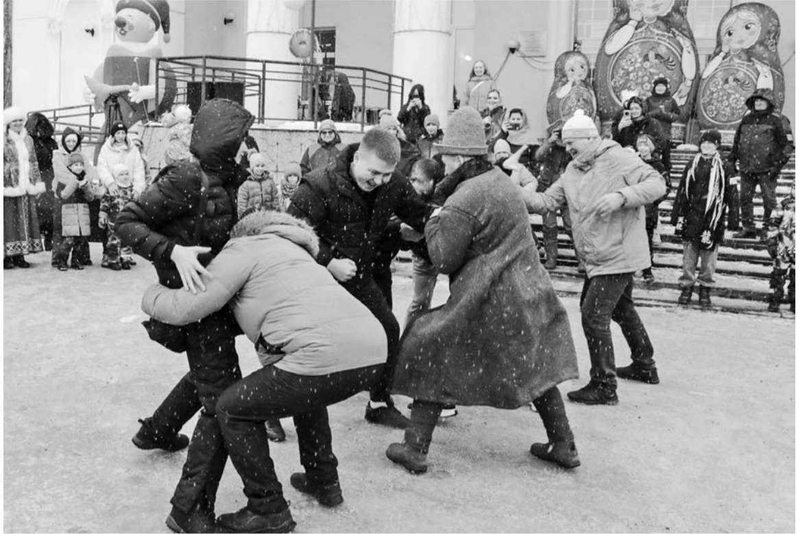
Кулачные бои перед Центром досуга молодежи были немногочисленными, но веселыми и зрелищными.