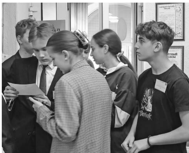
На каждой станции командам нужно было быстро справиться с заданиями.

В Центральной городской библиотеке продолжается просветительский проект «Правовой ликбез». Старшеклассники с интересом постигают юридические тонкости, о которых не расскажут на школьных уроках.