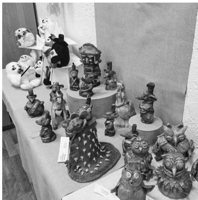
В фойе гости фестиваля могли ознакомиться с выставкой конкурсных работ.

В Детской школе искусств п. Сафоново прошел городской фестиваль-конкурс коллективных работ «Калейдоскоп идей». В зале гостеприимной ДШИ собрались не только ее воспитанники, но и учащиеся художественной школы и школы искусств Североморска-3.