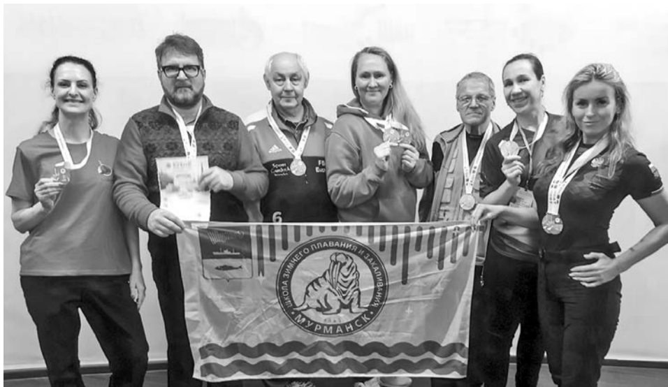
Североморские моржи — участники соревнований «Кубок Большой Невы».

во льду Гребного канала Невы, готовить его начали еще в начале февраля. В отличие от крытого бассейна, здесь иная подводная навигация. Где-то на глубине полутора метров под водой были натянута шнур — по центру каждой дорожки и за два метра до края бассейна. Пловцы могли плыть быстро, ориентируясь на эти шнуры, и не поднимать голову, чтобы не потерять высокой скорости.