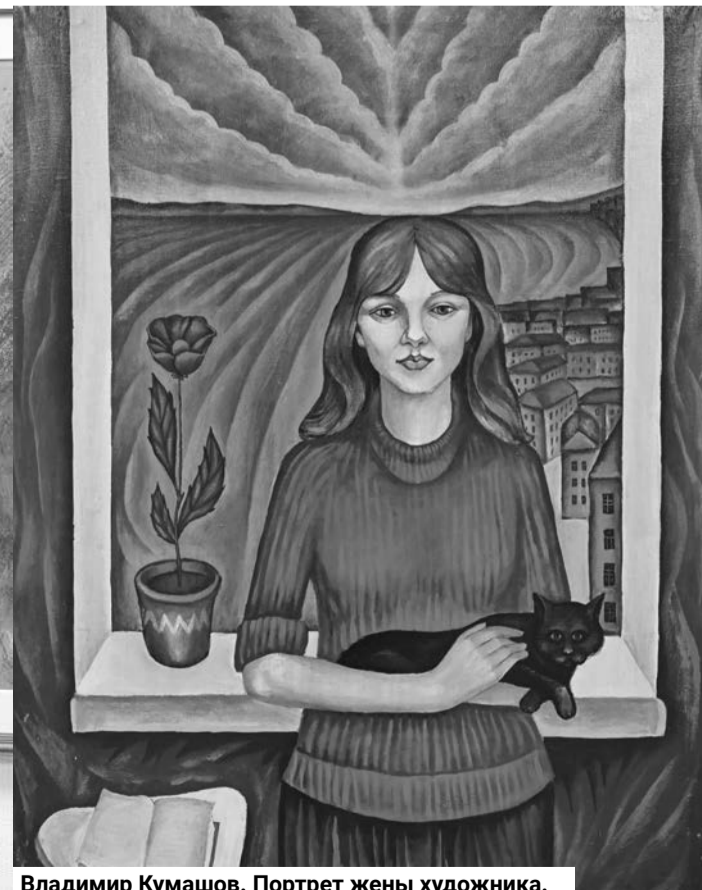
Владимир Кумашов. Портрет жены художника.