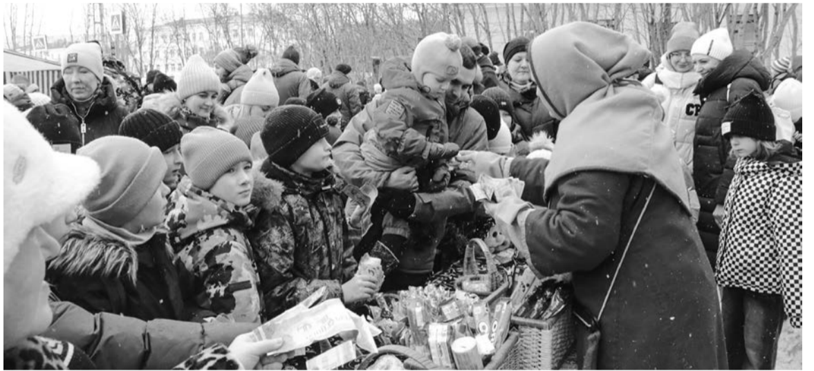
Заработав «рубли» за участие в конкурсах, люди спешили к менялам получить за «валюту» вкусности и сувениры.