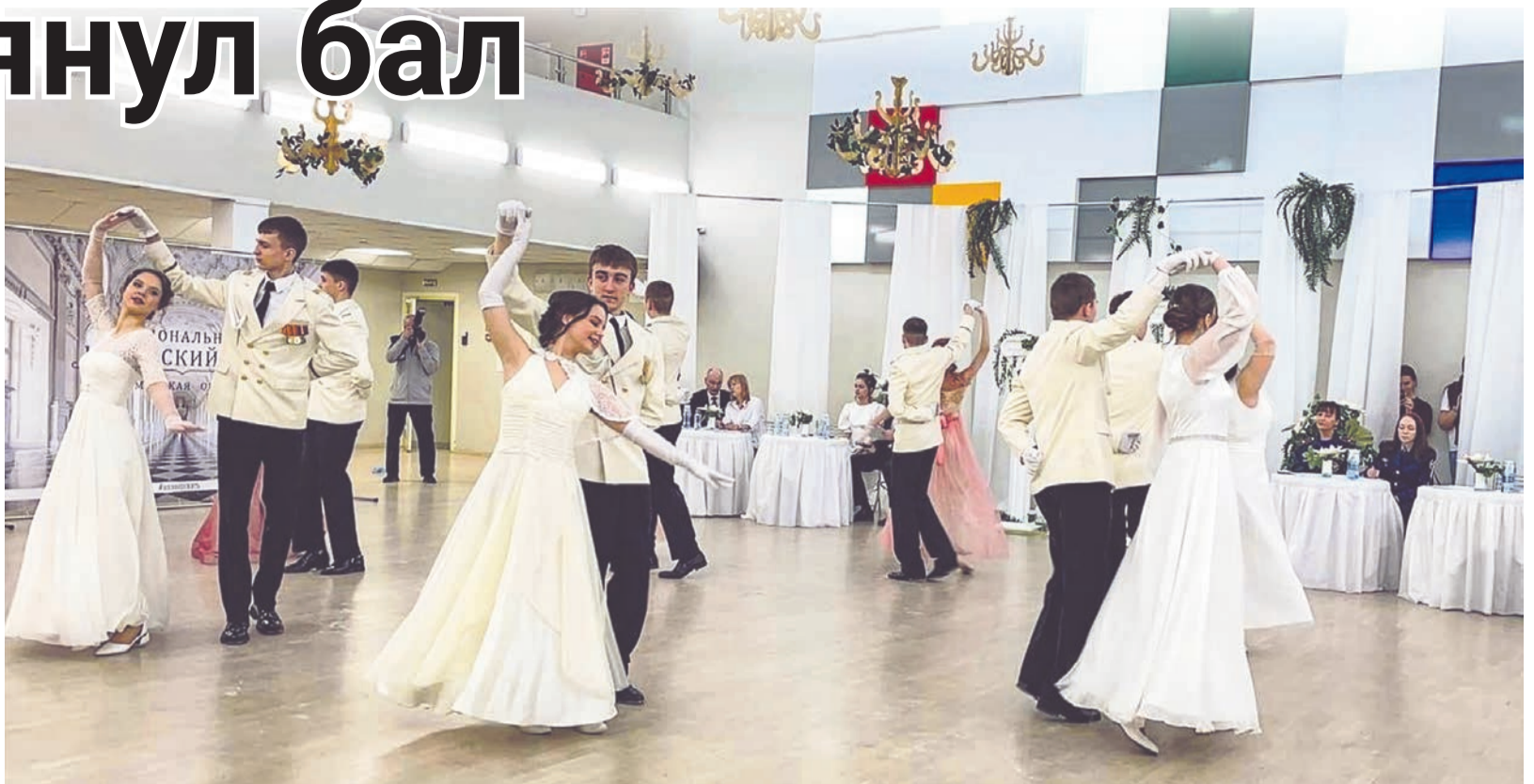
Чеканить шаг и кружиться в вальсе у североморских кадет получается одинаково хорошо. Не без помощи прекрасных девушек из танцевального коллектива «Аллегро».

Юноши и девушки исполнили полонез, фигурный вальс, кадрили. Жюри выбирало лучшие танцевальные ансамбли, приму и премьеру. В состав членов жюри вошли специалисты в области хореографического искусства и пред-