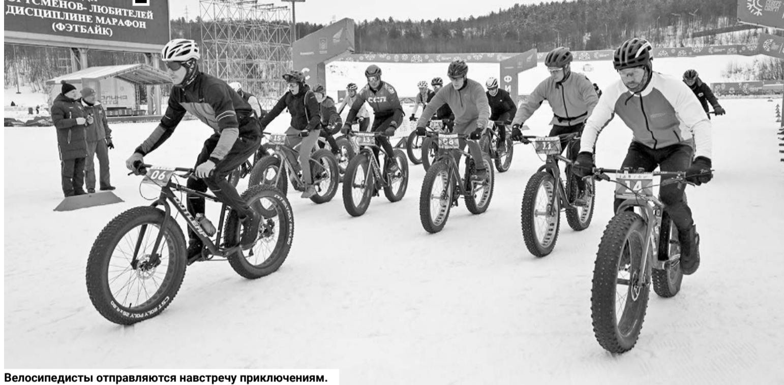
Велосипедисты отправляются навстречу приключениям.

То, что на велосипеде можно ездить в любое время года, в очередной раз доказали заполярные спортсмены. 1 марта в Мурманске впервые состоялся чемпионат России по велосипедному спорту среди спортсменов-любителей в дисциплине «фэтбайк-марафон». Он открыл программу 90-го Праздника Севера.