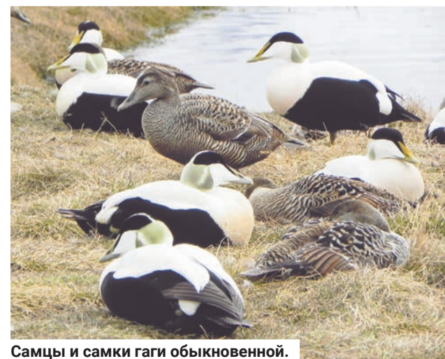
Самцы и самки гаги обыкновенной.