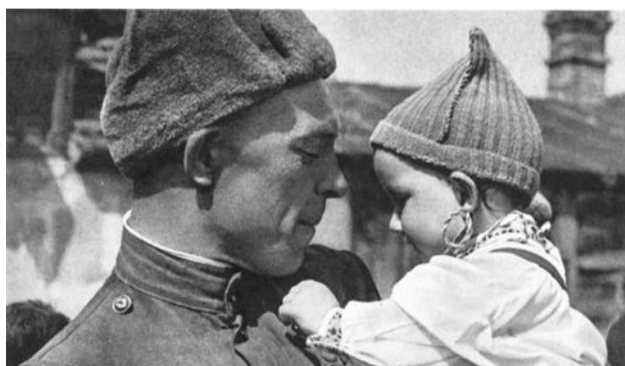
Советский солдат с чешским ребенком на руках. Май 1945 года. А. Голубова.