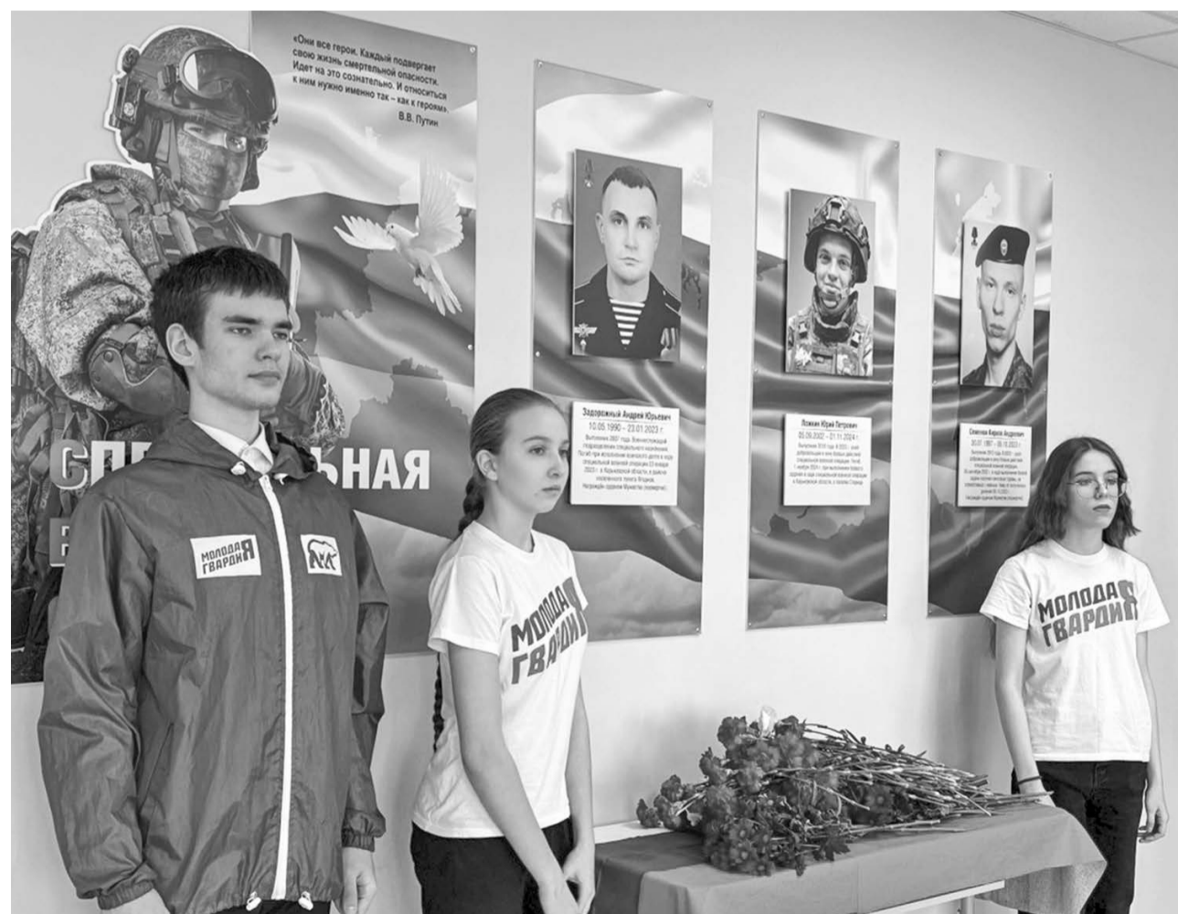
Ученикам школы №12 есть на кого равняться — в зале Боевой славы всегда перед глазами герои прошлого и нынешнего веков.