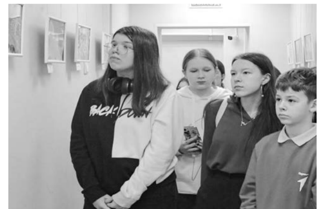
Частые гости «Сопок» первыми ознакомились с новой экспозицией.