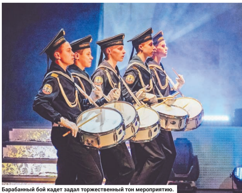
Барабанный бой кадет задал торжественный тон мероприятию.

Анна ЛИПИНА.