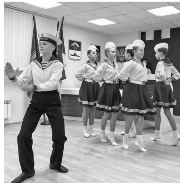
Выступление артистов Детской студии Ансамбля песни и пляски СФ на церемонии вручения паспортов постепенно становится традицией.