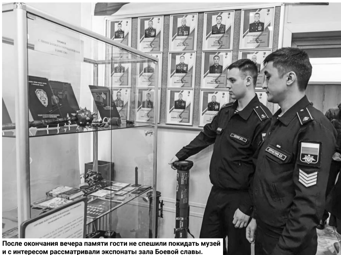
После окончания вечера памяти гости не спешили покидать музей и с интересом рассматривали экспонаты зала Боевой славы.

и о важности проведения встреч с участниками специальной военной операции, и увековечении памяти тех, кто не вернулся домой, и о том, чем каждый из нас может помочь фронту.