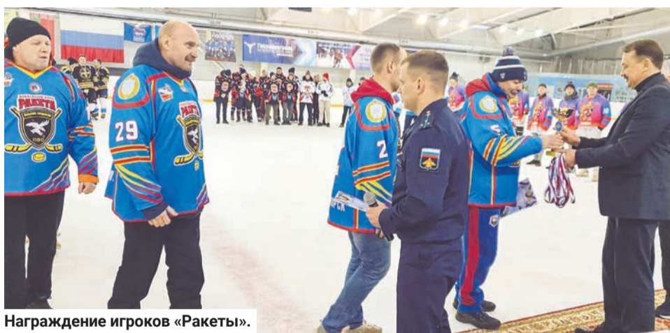
Награждение игроков «Ракеты».

Команда «Ракета», входящая в СВХЛ, недавно приняла участие в VIII чемпионате по хоккею с шайбой Ленинградского Краснознаменного ордена Жукова объединения, который был посвящен 80-й годовщине Победы в Великой Отечественной войне.