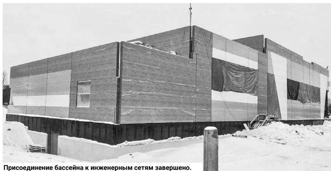
Присоединение бассейна к инженерным сетям завершено.