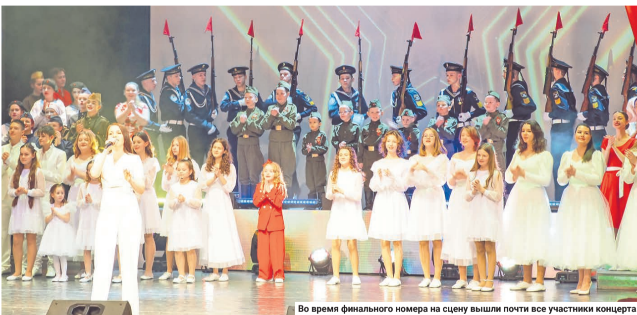
Во время финального номера на сцену вышли почти все участники концерта.