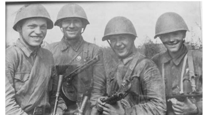
Группа красноармейцев, захвативших штабную машину противника с ценными документами.