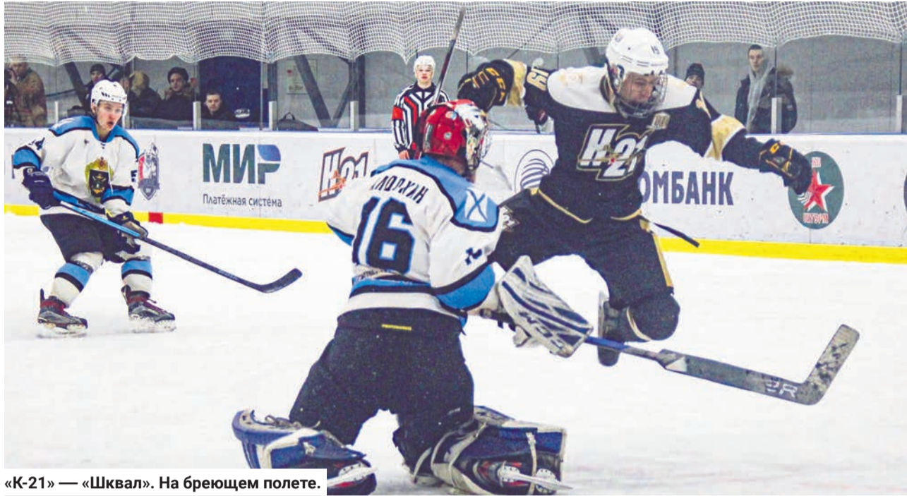
«К-21» — «Шквал». На бремсштанге.