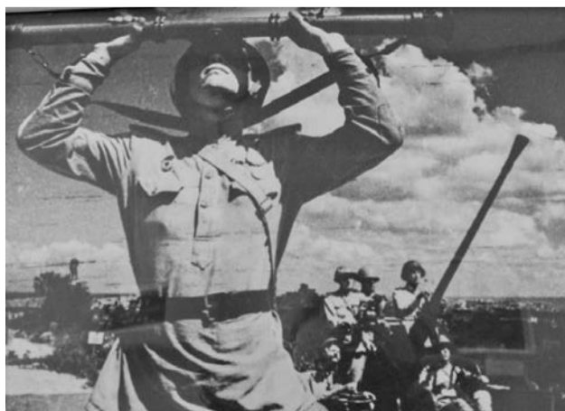
Артиллеристы. Севастополь. 1944 год. Евгений Халдей.