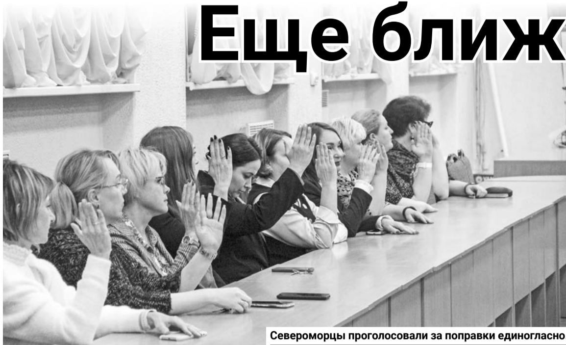
Североморцы проголосовали за поправки единогласно.