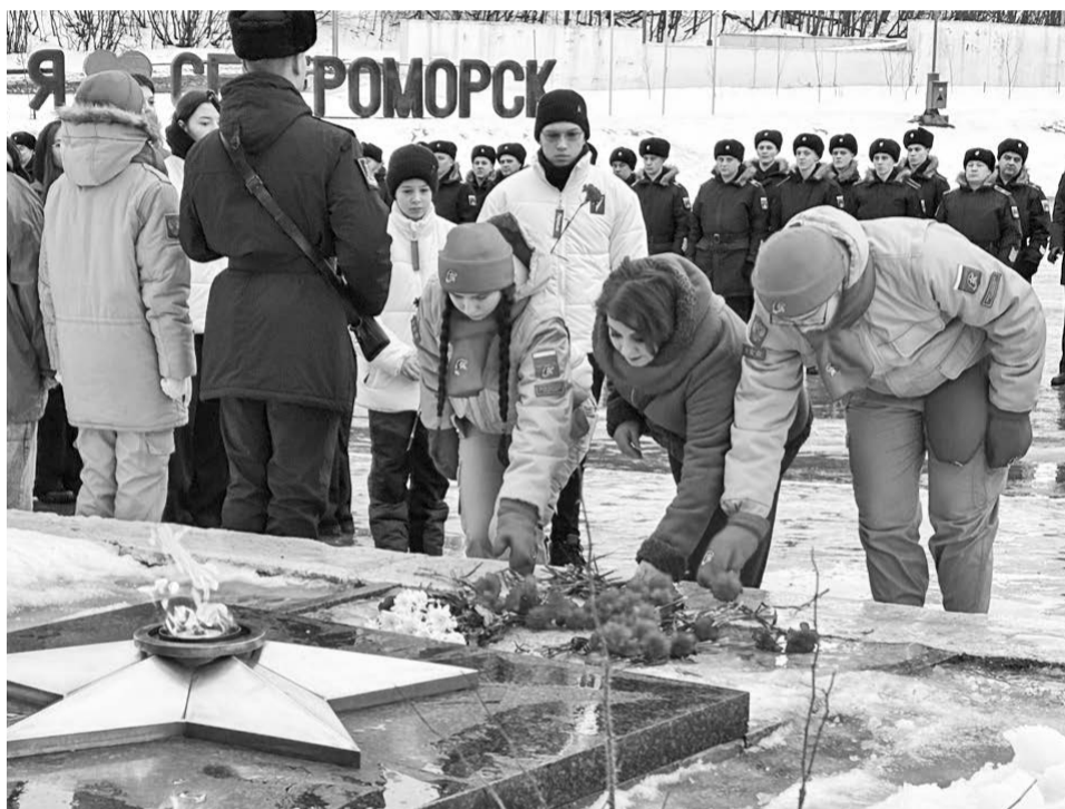
Цветы к Огню Памяти возложили представители всех молодежных организаций — «Юнармии», «Движения Первых», «Волонтеров Победы».

Наталья СТОЛЯРОВА. Фото автора и из архива редакции.