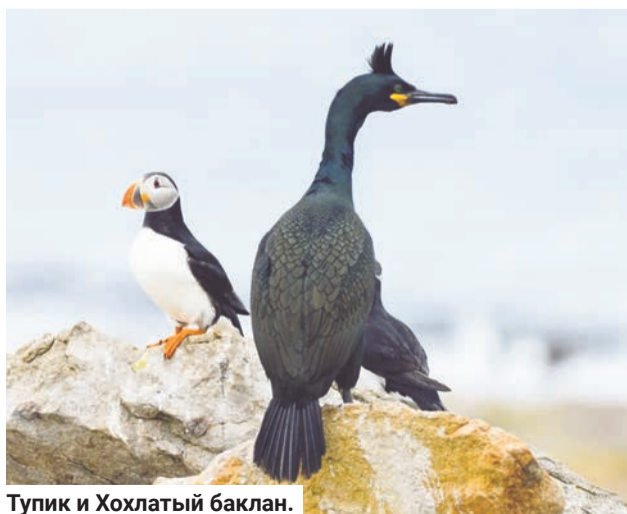
Тупик и Хохлатый баклан.