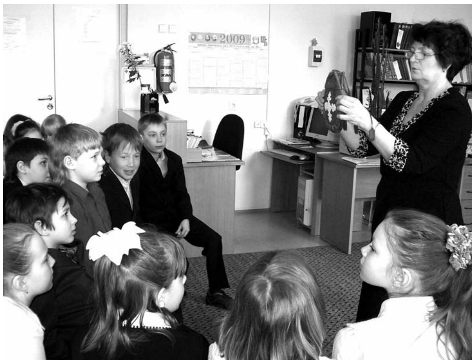
Ребята с интересом рассматривали иллюстрации к книгам на саамском языке, фотографии и предметы быта.