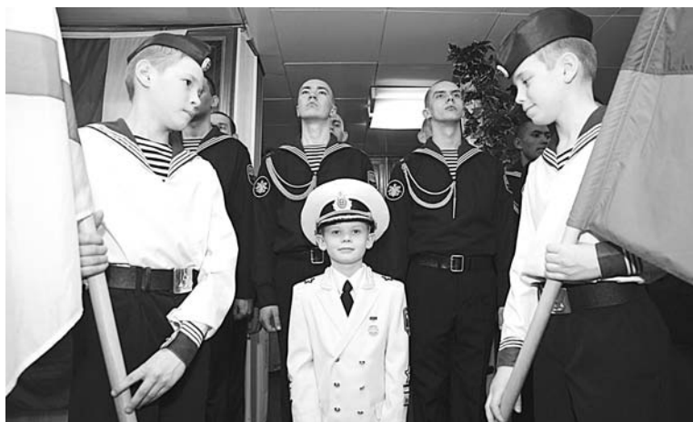
Праздничное настроение поддержали матросы ТАРКР «Петр Великий», кадеты школы-интерната и юные артисты Дома творчества.