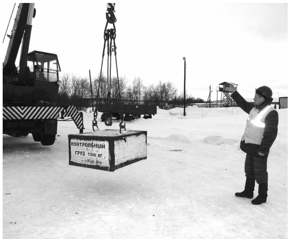
Стропальщик, как дирижер, подает команды взмахом руки.

Управиться с многотонным грузом не так-то легко. Иногда груз нужно установить с точностью до нескольких сантиметров. Приходится быть предельно внимательным, чтобы избежать несчастных случаев. Во всем этом крановщику помогает стропальщик, который не только правильно закреп-