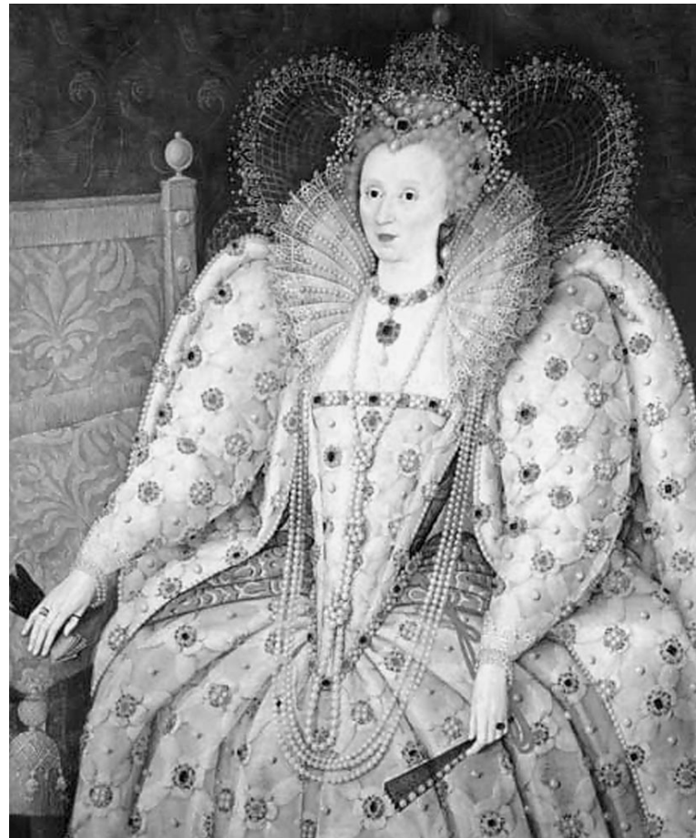
Кружевной воротник Елизаветы I - достояние империи XVI века.

Во времена, когда один грамм кружева приравнивался по цене к одному грамму золота, страсть к кружевам превратилась в настоящую манию, на их покупку тратились огромные деньги. Сам Людовик XIV не устоял перед натиском своих дочерей и истратил на их «кружевные прихоти» из казны более полумиллиона франков. В 1660 году первый министр Франции кардинал Мазарини, чтобы положить конец этой разорительной склонности соотечественников, даже издал эдикт «Правила против излишней роскоши в одежде». То же самое пытались сделать короли Англии и Испании. Однако законы не достигли цели. И следующие два века продолжали «утопать в кружевах». Их бережно хранили и передавали по наследству подобно фамильным драгоценностям.