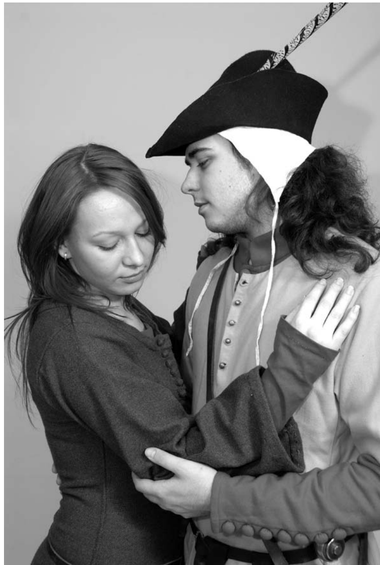
Изучая историю костюма, просто нельзя не проникнуться романтикой той эпохи.

турнира «Стальной фьорд» (г.Североморск, 2009 г.).