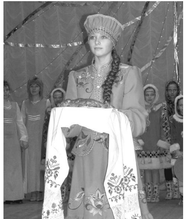
Гостей фестиваля встречали по русскому обычаю хлебом-солью.