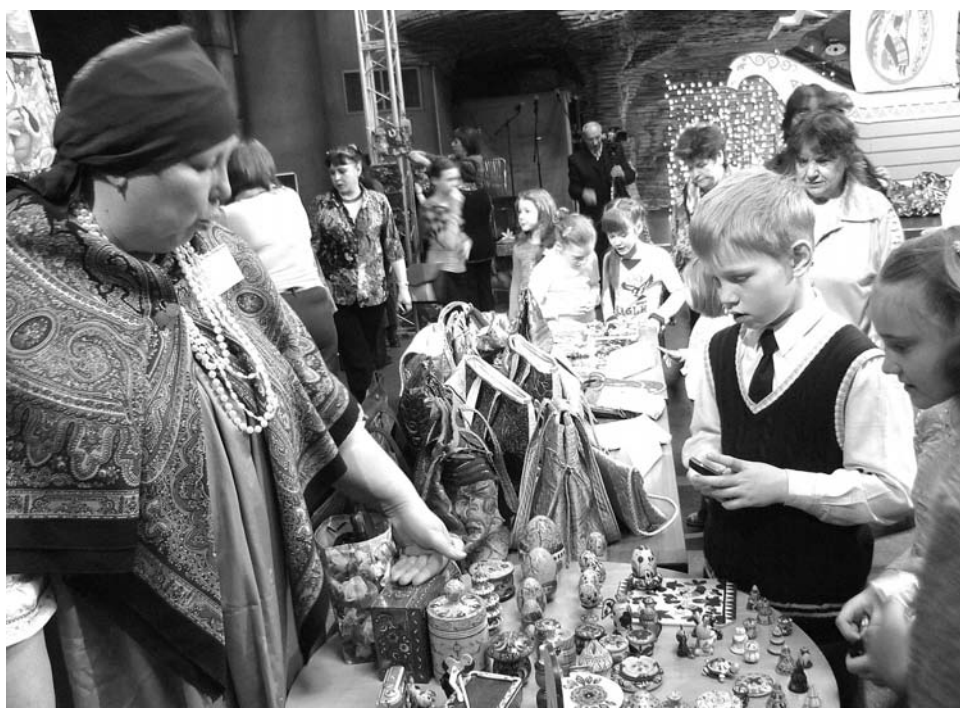
Разглядывая товары народного промысла, дети засыпали мастеров вопросами.