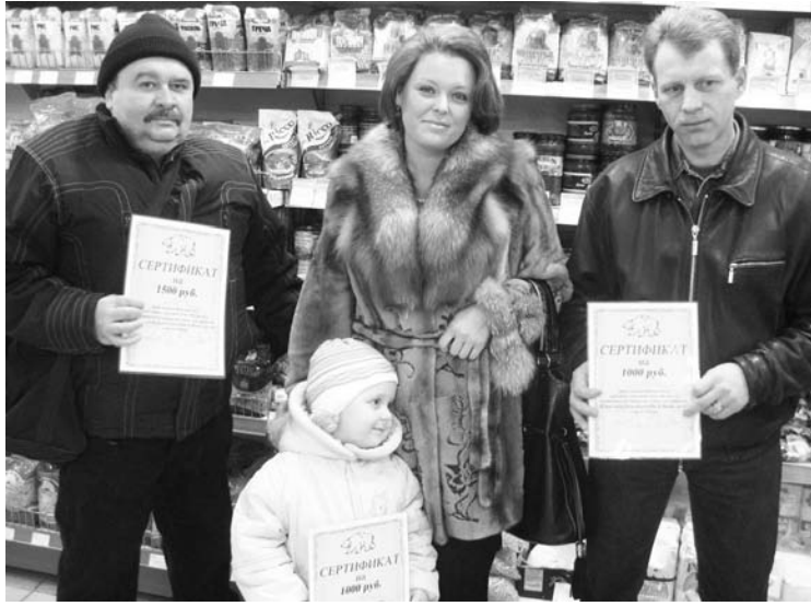
Самые преданные покупатели получили свои награды.