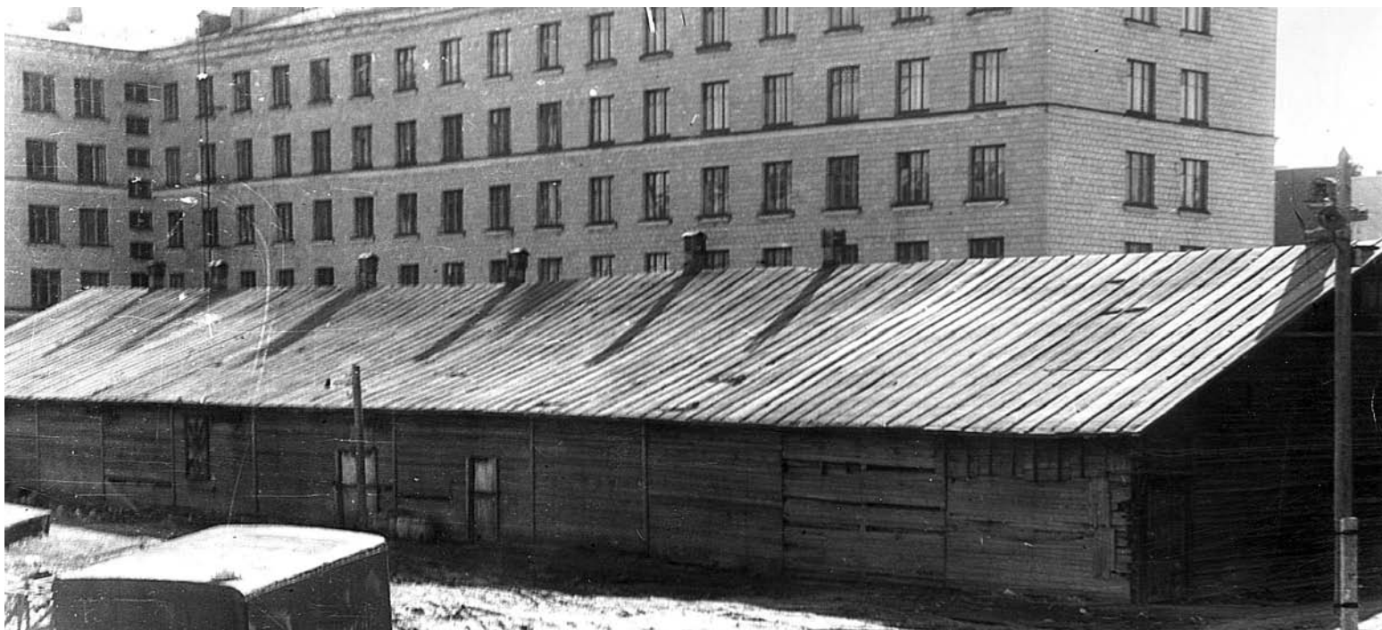
Во второй половине 30-х годов в барাকে во дворе дома №18 по ул.Сафонова располагался первый в Ваенге клуб, а в 60-х (на снимке) - склад старой мебели ОМИСа.