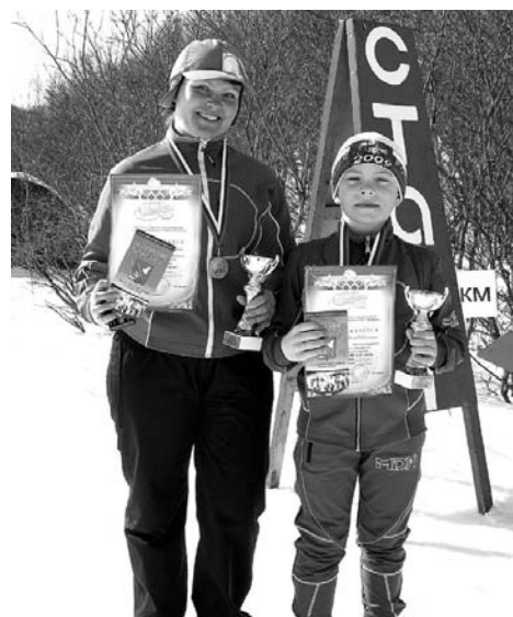
Мама и сын Волошины: вот какие молодцы – по кубку у каждого.

Алексей ИЛЬЧЕНКО. Фото из альбома ДЮСШ-1.