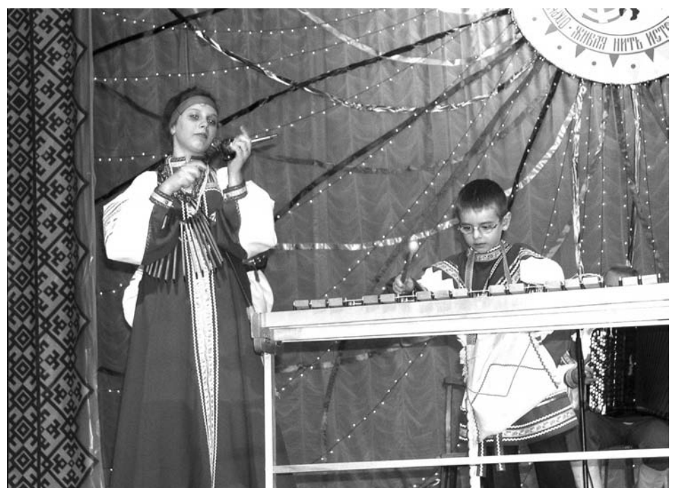
«Русские потешки» потешили зрителей юморными и задорными русскими песнями.