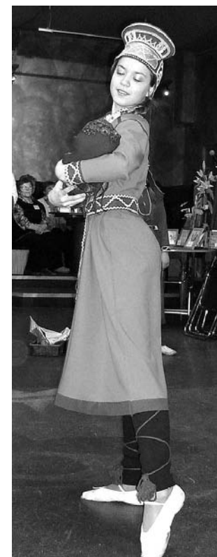
Саамский танец и костюмы к нему подготовили коллективы СШ №10.