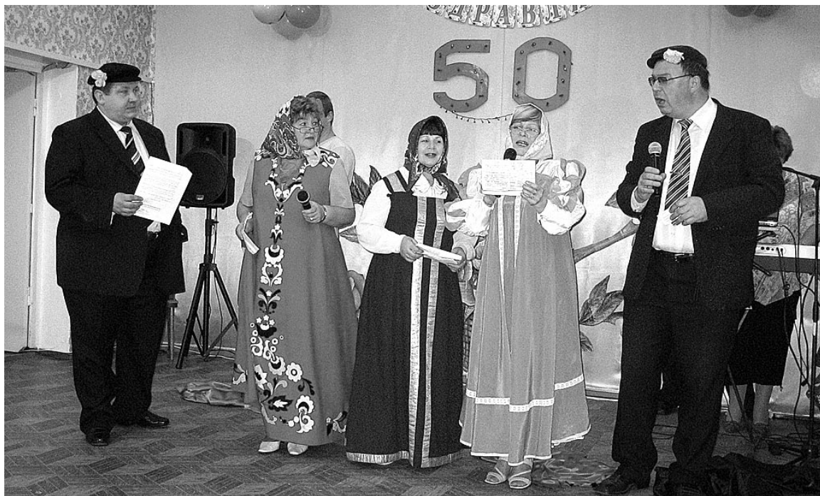
Актерское амплуа в первом североморском ДОФе ВВС примеряют все члены коллектива: от завхоза до начальника.

Сегодня ДОФ гарнизона Североморск-1 не может похвастаться такой популярностью среди населения и заезжих «звезд». Есть тому объективные причины: во флотской столице появилось немало современных культурно-досуговых учреждений. Особенно трудные времена настали для ДОФа семь лет назад, когда коллектив выехал из обветшалого здания. Временное пристанище в казарме едва ли отвечает духу прекрасного – созидать среди обшарпанных стен непросто. Но 20 энтузиастов, преданных своему делу, гарнизонный корабль культуры не покидают. Своими силами поддерживают чистоту и