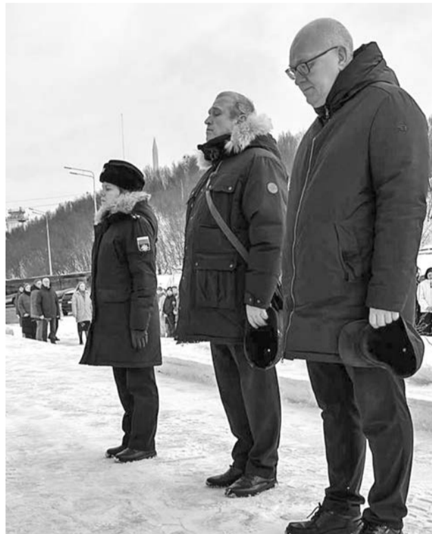
Память погибших жителей блокадного Ленинграда почтили минутой молчания.