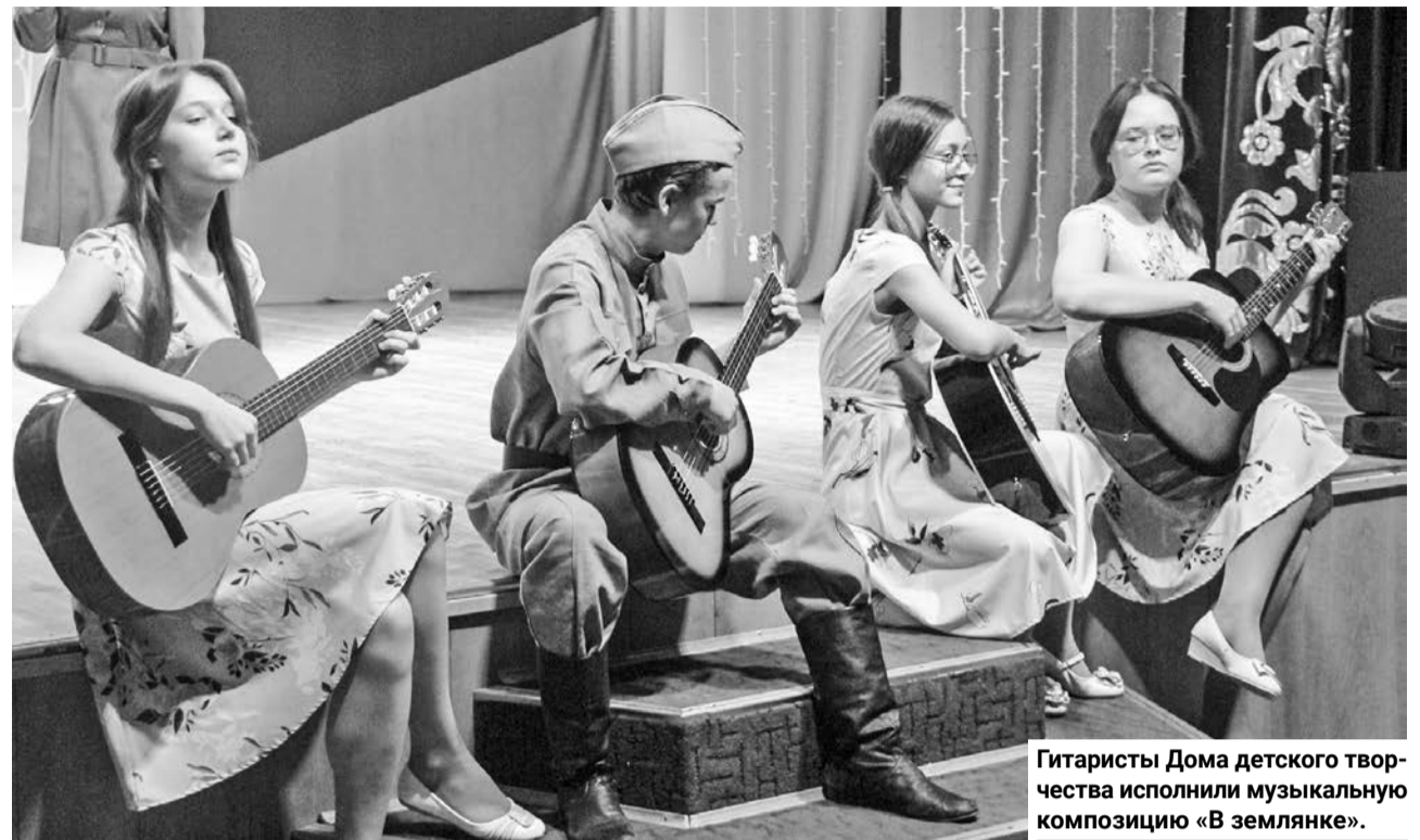
Гитаристы Дома детского творчества исполнили музыкальную композицию «В землянке».

ший, что жизнь продолжается, а быстрые «шаги» метронома оповещали жителей о приближающейся атаке немецких самолетов.