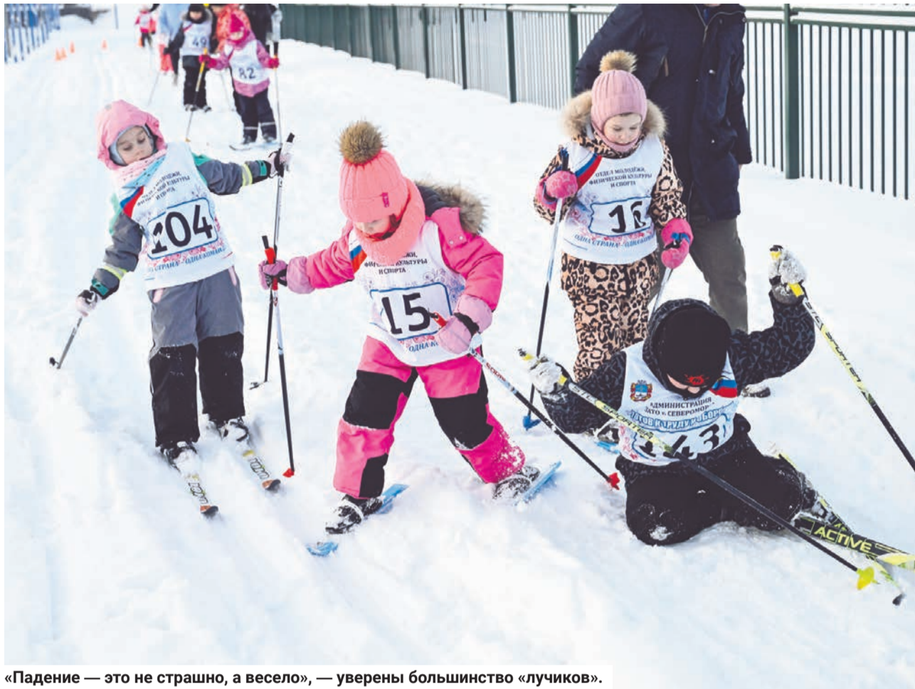
«Падение — это не страшно, а весело», — уверены большинство «лучиков».

— Падать в сугроб можно, а падать духом нельзя. Главное — просто прийти к финишу. И тогда вы — победители! — напутствовал своих детишек-лыжников папа перед первым в наступившем году стартом проекта «Солнечные лучики».