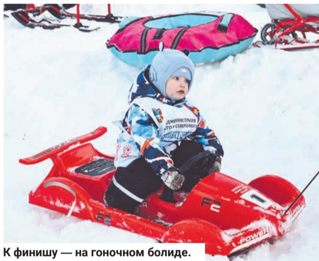
К финишу — на гоночном болиде.