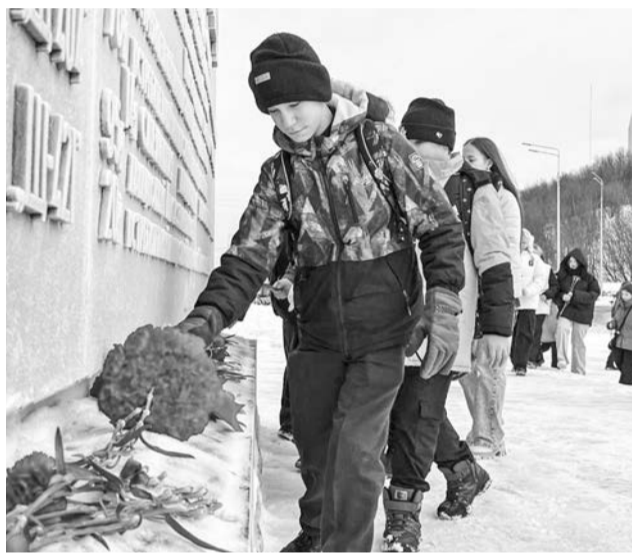
Возложение цветов к памятнику.

27 января исполнился 81 год со дня полного освобождения Ленинграда от фашистской блокады. В честь мужества ленинградцев на Приморской площади в Североморске состоялся памятный митинг. Среди собравшихся — представители власти, Северного флота и активная молодежь.