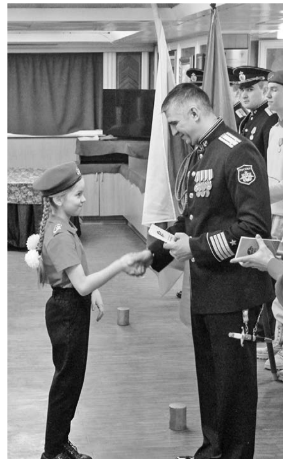
Получение книжки юнармейца — важный и ответственный момент.