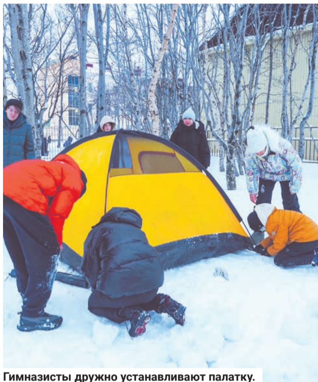
Гимназисты дружно устанавливают палатку.