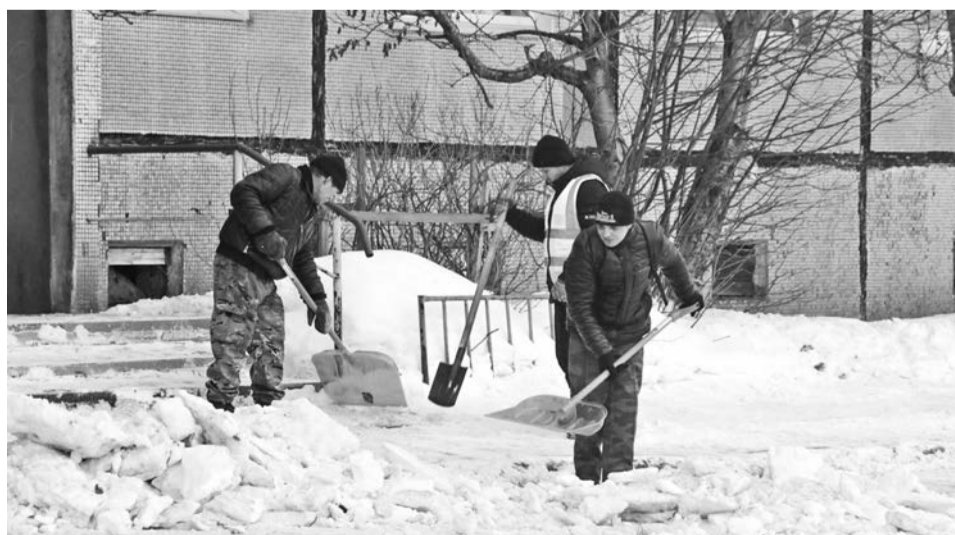
Бригада сотрудников УК «Чистый город» работает на Кирова, 5, после механизированной уборки.

28 января представитель муниципального контроля провели рейд, в ходе которого проверили, как управляющие компании борются со снежной кашей. По определенным дворам, состояние которых к вечеру 28 января все же признано неудовлетворительным, управляющим компаниям направлены требования.