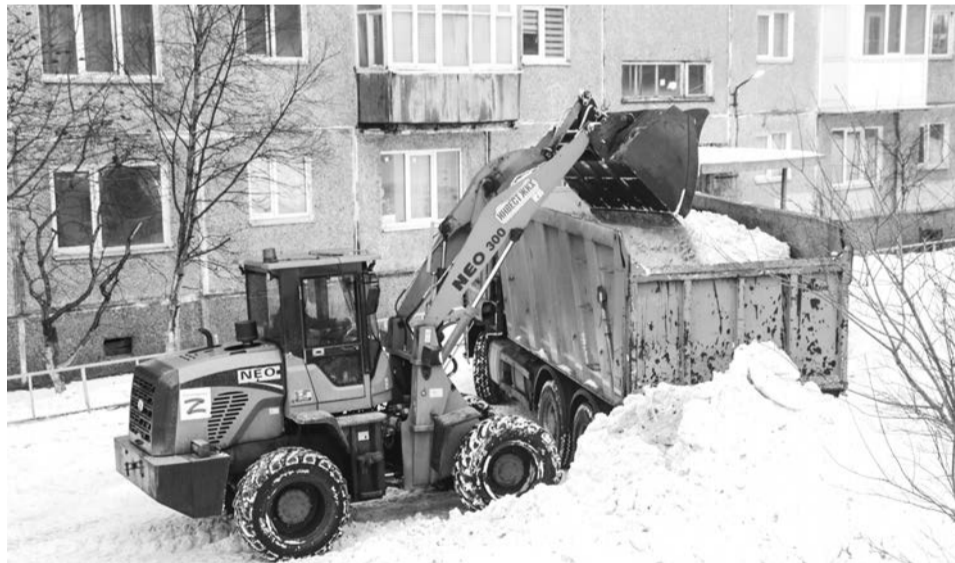
Уборку снега на Инженерной, 5, проводит «Инвест-ЖКХ».

На этой неделе все управляющие компании запланировали механизированные уборки во дворах. Объявления с просьбой на время освободить двор от личного автотранспорта появились на информационных досках домов.