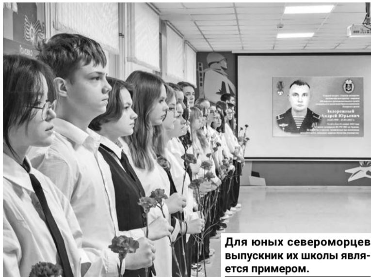
Для юных североморцев выпускник их школы является примером.