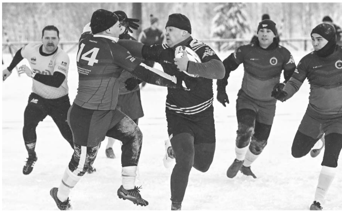
Зимнее регби, как и другие разновидности этого вида спорта, весьма контактно, его называют «спортом для джентльменов, но не для неженек».