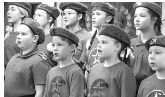
На торжественной церемонии новобранцы движения исполнили Гимн РФ.

Пока новобранцы юнармейского движения — в счастливом предвкушении событий, частью которых они смогут быть в новом статусе. В ближайшее время их ждут встречи с военнослужащими, занятия по ряду военных дисциплин, в дальнейшем — участие в памятных и торжественных мероприятиях.