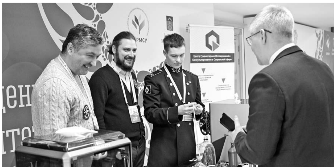
На одной из площадок свои разработки представили североморцы. В их числе инициаторы проекта «Самые северные умельцы — фронту».

Подготовила Анна ВИННИЦКАЯ.