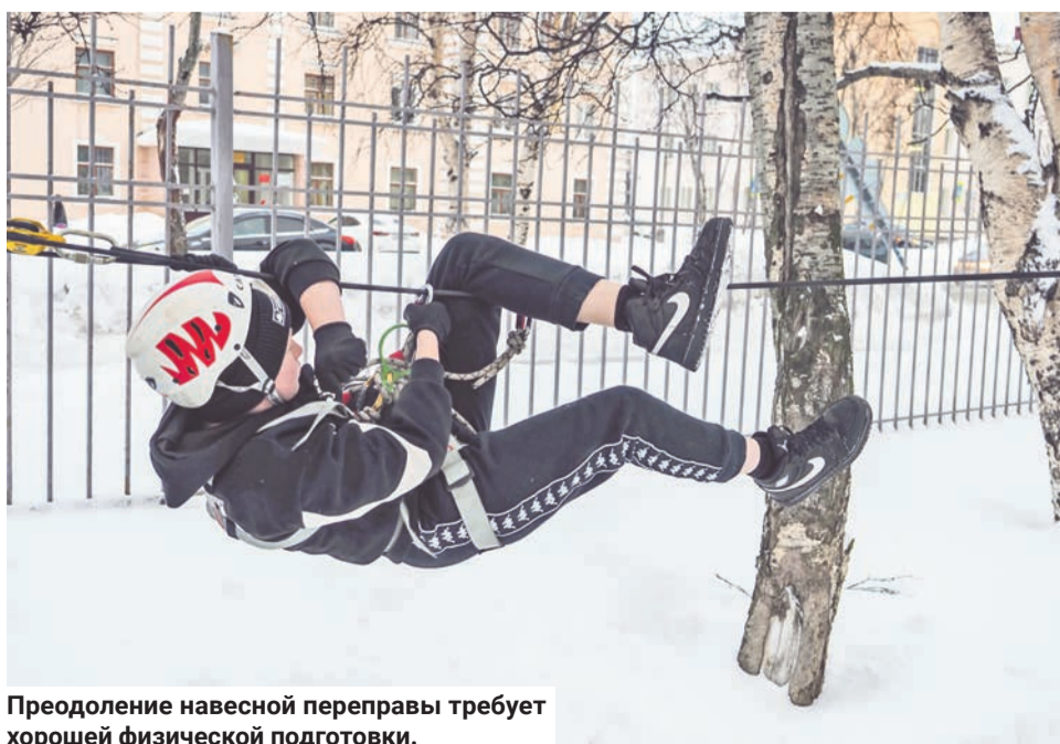
Преодоление навесной переправы требует хорошей физической подготовки.