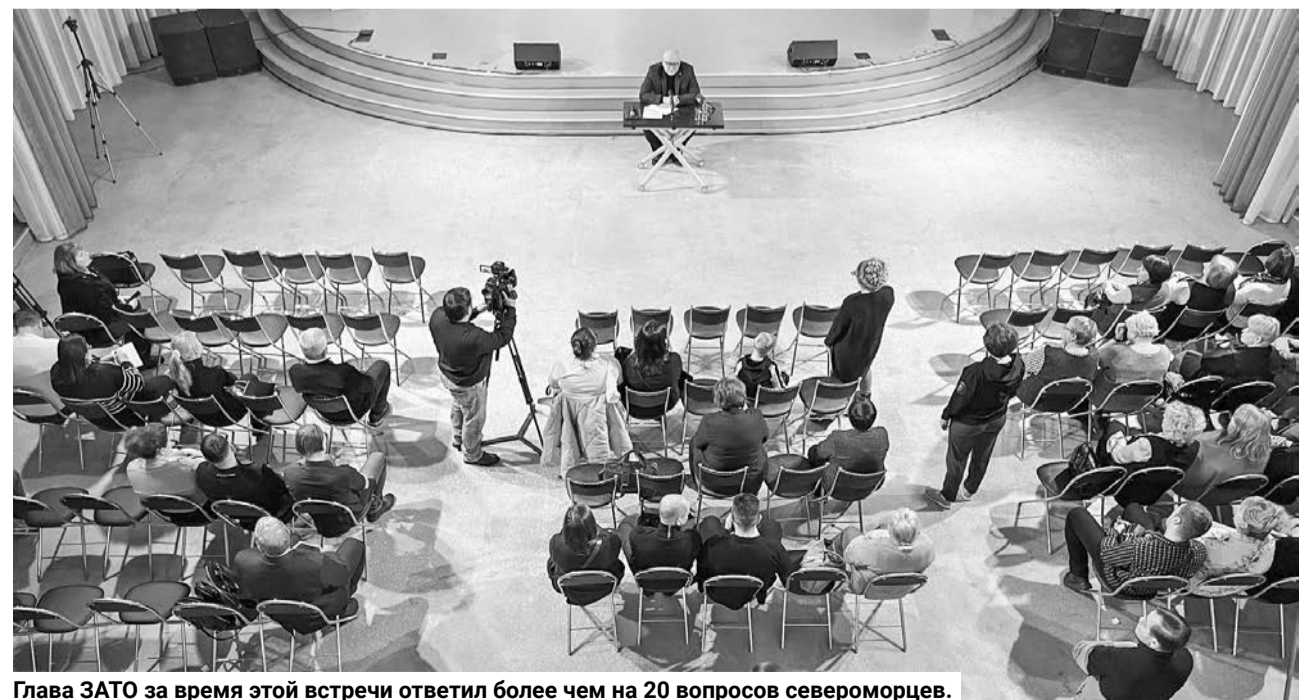
Глава ЗАТО за время этой встречи ответил более чем на 20 вопросов североморцев.

Наталья СТОЛЯРОВА.