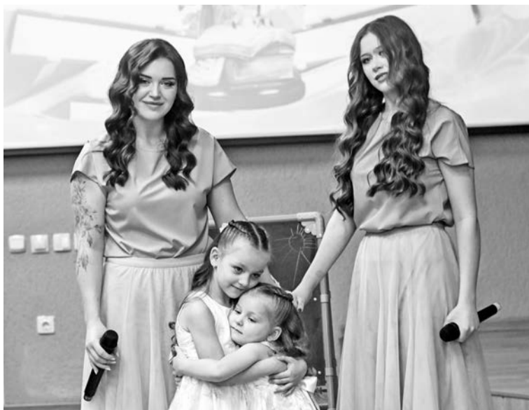
Артисты ЦДМ подарили гостям церемонии трогательное выступление.

цова в Санкт-Петербурге, служит на Тихоокеанском флоте. Участвовал в специальной военной операции, был тяжело ранен, награжден медалью «За отвагу».