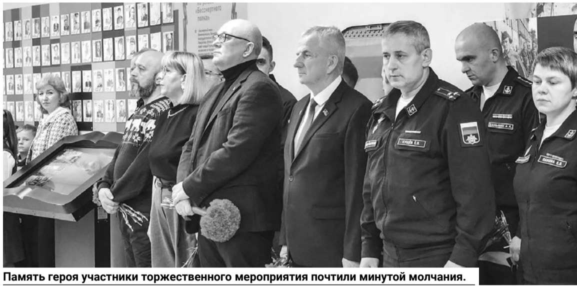
Память героя участники торжественного мероприятия почтили минутой молчания.