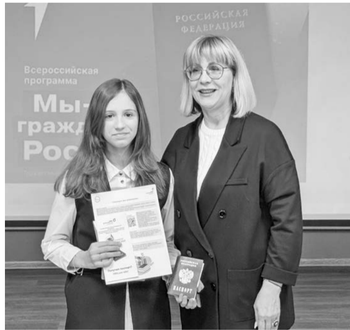
Паспорта ребятам вручала начальник Управления образования Юлия Гладских.