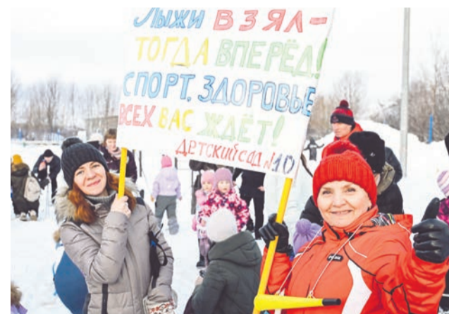
В этих стартах с радостью приняли участие воспитанники д/с №10 пгт Сафонове при поддержке педагогов.

Организаторы отмечают, что «Солнечные лучики» —