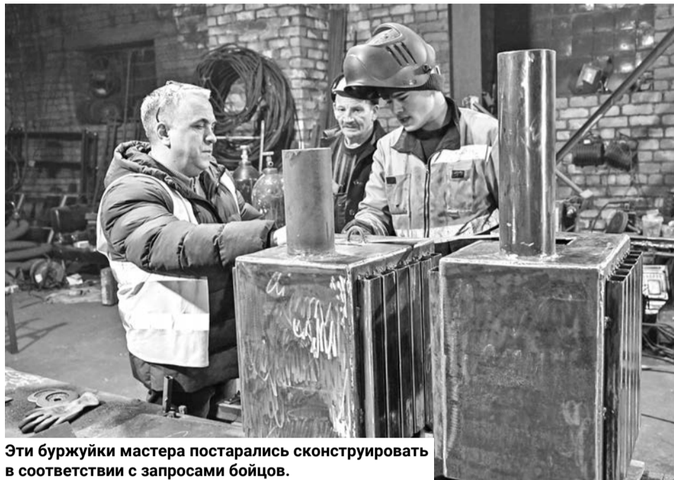
Эти буржуйки мастера постарались сконструировать в соответствии с запросами бойцов.

скому телевидению о помощи бойцам, а у них с мужем есть цех, где они сделали две печи, но не знают, как их переправить на фронт.