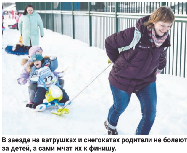
В заезде на ватрушках и снегокатах родители не болеют за детей, а сами мчат их к финишу.