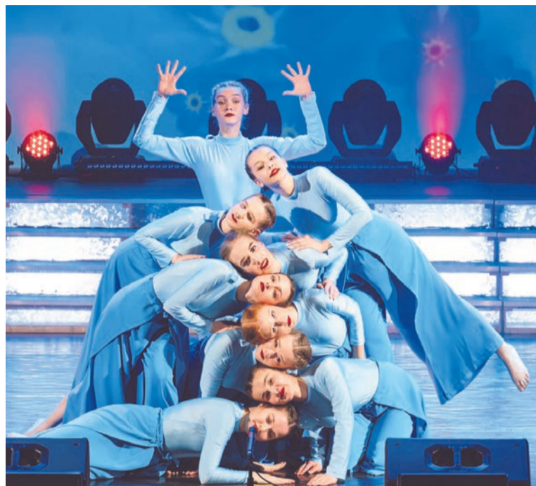
Юбилейный концерт порадовал зрителей интересными, яркими, динамичными номерами.

На сцене Дворца культуры «Строитель» — калейдоскоп танцев: образцовому самодеятельному коллективу ансамбля эстрадного танца «Non stop» — 25, и в минувшую субботу коллектив собрал всех своих друзей, родителей и поклонников.