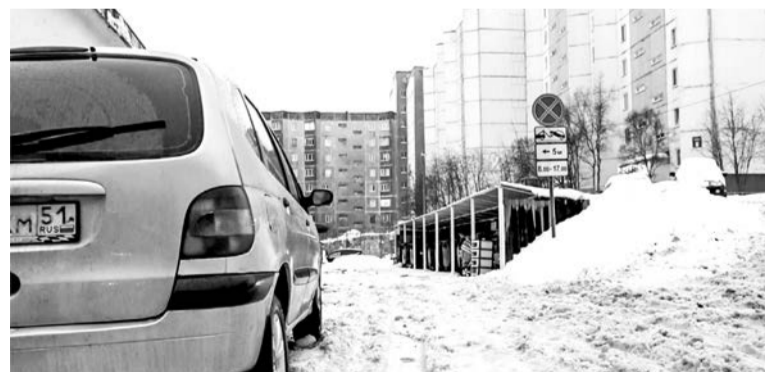
Дорожные знаки, запрещающие в определенные часы остановку транспорта возле контейнерной площадки, видимо, не всем указ.

— Мне не нравятся отмены или переносы дворовых уборок, когда