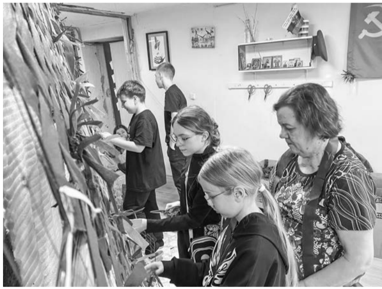
В пункте плетения сетей трудятся неравнодушные североморцы всех возрастов.

— Я здесь ради ребят. Надеюсь, мой труд им чем-то поможет. Пусть другие волонтеры приходят, будем работать вместе.