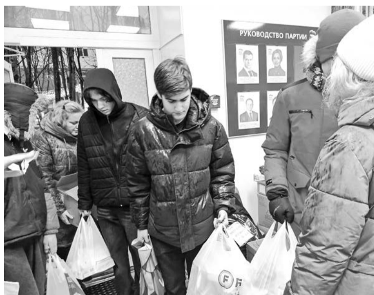
Оказать посильную помощь бойцам стремятся североморцы всех возрастов.

В приемной партии «Единая Россия» в Североморске продолжается сбор помощи для наших ребят, выполняющих задачи специальной военной операции.