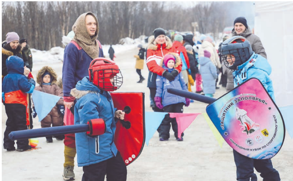
Клуб исторической реконструкции «Фьорд» организовал для детишек сражение на спортивных мечах.

18 января на площадке у корта по ул. Преображенского было шумно и многолюдно — массовым гуляньем отметить святки собрались военнослужащие авиационного корпуса Северного флота, члены их семей и местные жители.