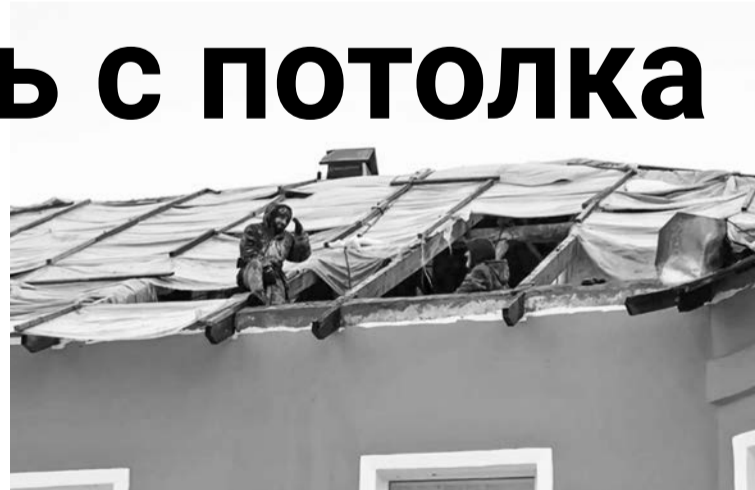
Рабочие устраняют протечку, возникшую после январского дождя.

— Тогда выяснилось, что заливание сильное и после него временно в этих квартирах жить сложно, поэтому мы связались с подрядчиком, — отметил глава муниципалитета. — Надо отдать должное подрядчику, который откликнулся, не стал отнекиваться и выразил готовность возместить ущерб, помочь людям. Поэтому мы на время ремонта предложили жильцам на выбор несколько вариантов квартир. Жилотдел в субботу оперативно