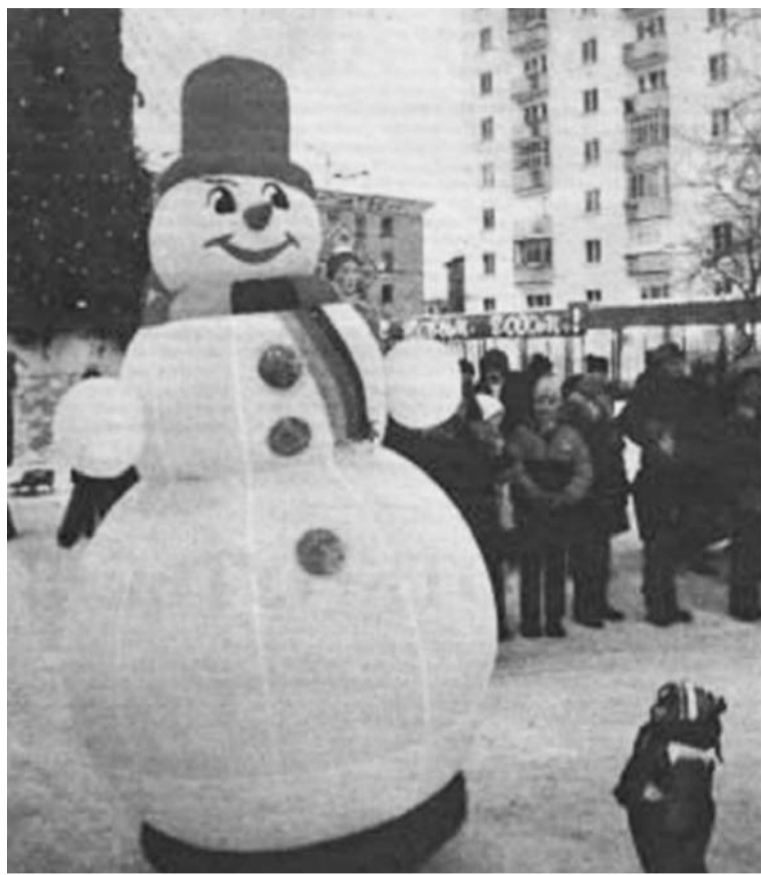
23 декабря на площади Сафонова загорелась гирляндами центральная городская ёлка. 2002 г.

Насыщен спортивный календарь каникул. Работает городской бассейн, каток, открыты двери школьных спортивных залов. Немало лю-