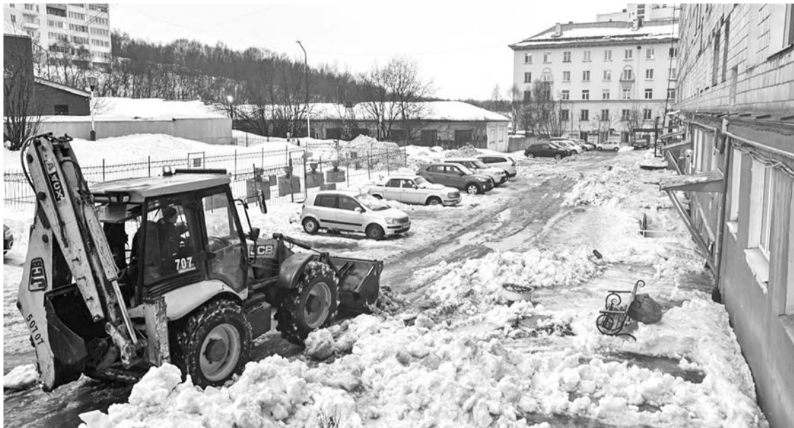
Непаханное снежное поле на ул. Сафонова, 22, наконец очищено. Дебютная уборка случилась только благодаря режиму повышенной готовности, позволяющему привлекать технику муниципалитета, подрядных организаций.

ных площадках, где фиксировалось перенакопление мусора.