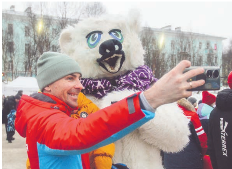
Фотосессия с ростовыми фигурами давно стала неизменным атрибутом больших праздников.

Танцевальный батл, снежный боулинг, угадывание песен, зимняя эстафета, перетягивание каната, катание на лошадке: в пгт Сафоново прошли святочные народные гулянья.