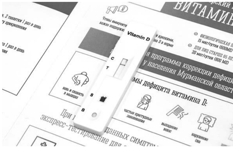
Всего пара минут — и экспресс-тест покажет уровень витамина D.

В 2024 году дефицит «солнечного» витамина был выявлен у более 80 процентов жителей, пришедших на обследование, им было выдано поч-