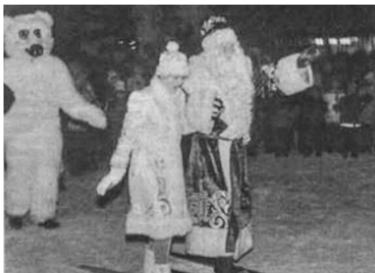
Дед Мороз и Снегурочка доставляют в Североморск волшебную палочку. 2001 г.

бителей собрала в эти дни загородная лыжня.