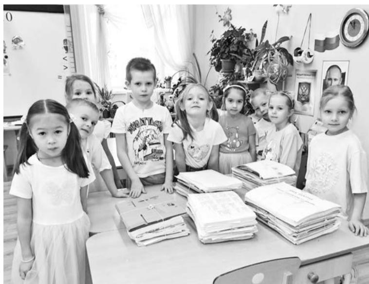
Ребята из детского сада №10 славно потрудились — вместе с родителями и воспитателями собрали 199 кг макулатуры.

У акции есть не только экологическая, но и благотворительная направленность. Вырученные от сдачи макулатуры средства — более 12 тысяч рублей — организаторы перевели в копилку группы гуманитарной помощи участникам СВО «За наших!».