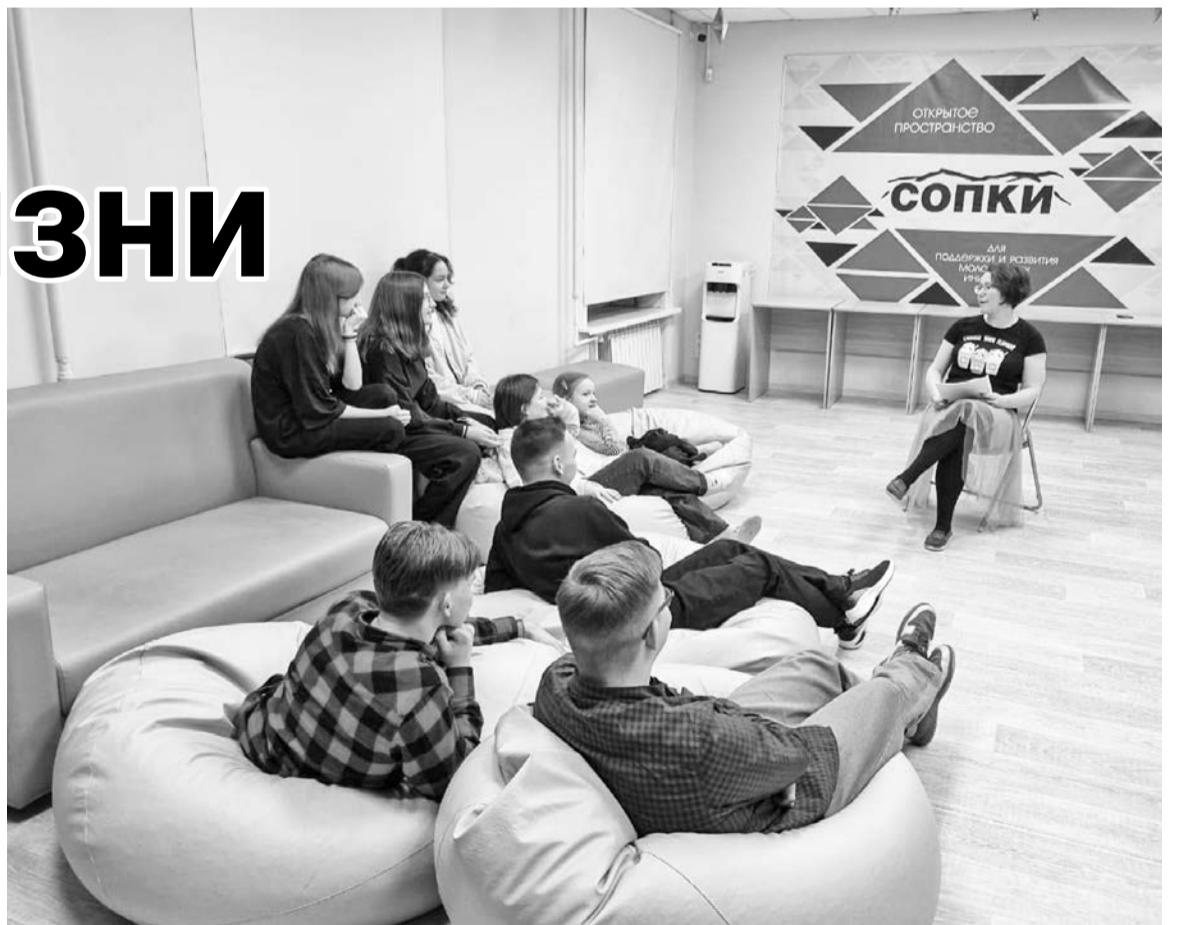
В заключительный день профилактической кампании в «Сопках» прошел час вопросов и ответов «Цена зависимости — жизнь».

На встречах в формате «вопрос-ответ» ребята поговорили о мифах, связанных с наркоманией. Главные