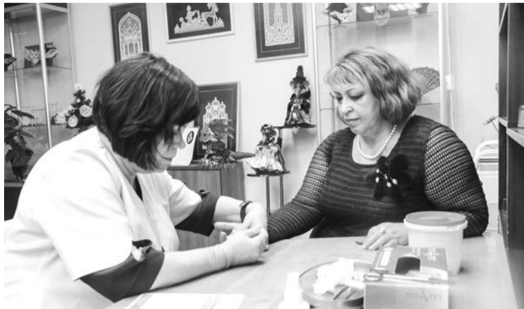
Североморцы рады, что пункт витаминизации продолжил свою работу на базе ЦГБ им. Л. Крейна.

Солнце постепенно возвращается в нашу область, при этом дефицит «солнечного» витамина жителям Заполярья оно сможет восполнить нескоро. Но хорошая новость для северян в том, что проект «Витаминизация» продолжается. Причем те, кто проверил уровень витамина D в прошлом году, теперь могут повторить процедуру.