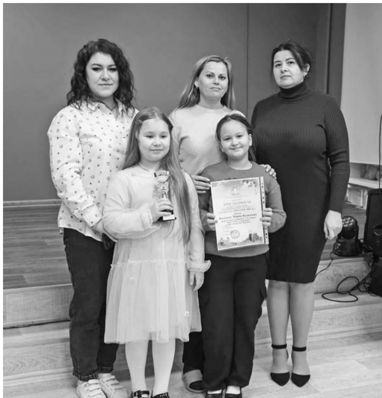
Дружная команда 2 «А» «десятки» установила рекорд акции и получила заслуженную награду.

По статистике, переработка тонны макулатуры позволяет сэкономить 20 тысяч литров воды, тысячу киловатт электричества, предотвратить выброс в атмосферу 1 700 кг углекислого газа, а 100 кг переработанной бумаги сохраняют одно взрослое дерево. Северяне заботятся об экологии города и планеты: собирают старые газеты, журналы, бумагу, картон, участвуют в экологических акциях и сдают макулатуру на переработку.