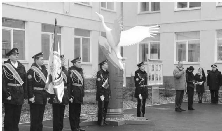
По программе «Арктическая школа» в Северноморском кадетском корпусе была открыта Аллея Славы...