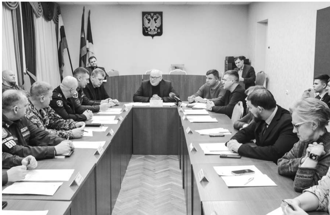
Несмотря на то, что вопрос о проведении купания остается открытым практически до кануна Крещенской ночи, подготовка идет основательная.