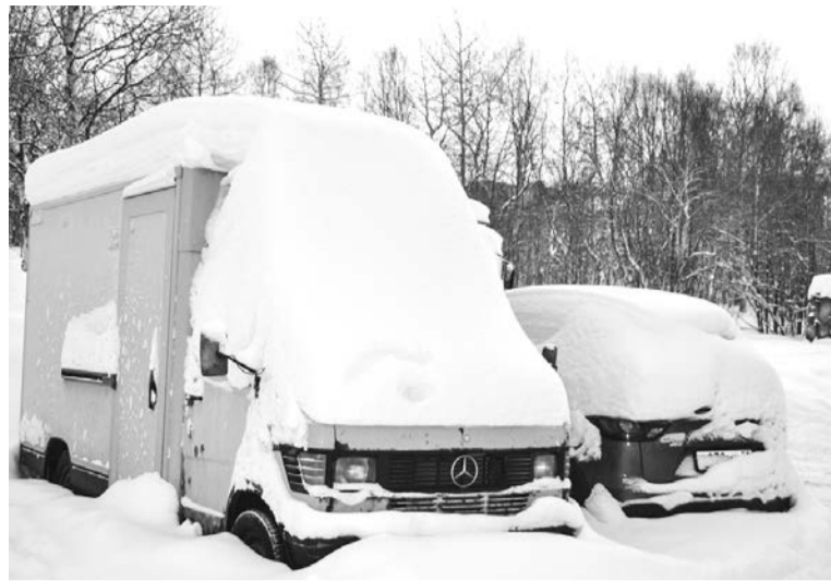
Двор дома №6 по ул. Преображенского не будет почищен идеально, и не по вине УК.

2025-й год начался с того, чем закончился 2024-й — с уборки снега со дворов и улиц. Усложняют и без того нелегкий труд коммунальщиков снегопады и тепло — спрессованные снежные массы труднее сдвинуть с места.