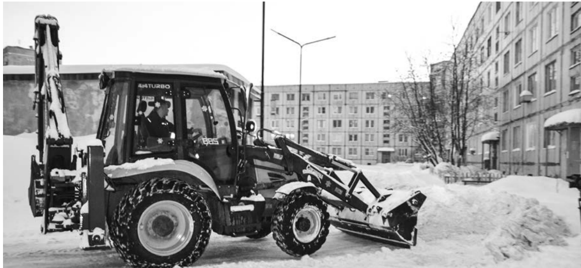
Небольшой угловой двор двух пятиэтажек чистится около четырех часов. А припаркованные автомобили значительно увеличивают это время.