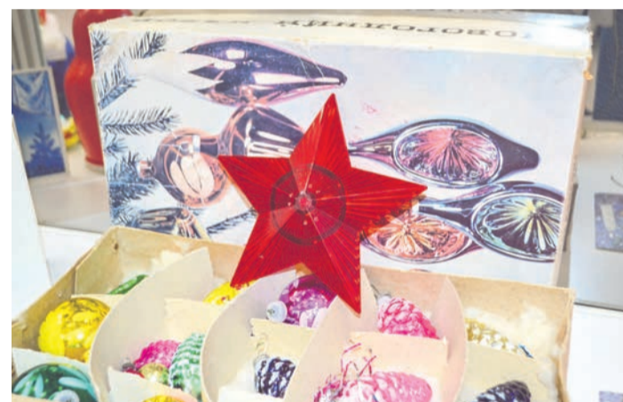
Стеклянные ёлочные игрушки в оригинальной упаковке и звезда-макушка — настоящее богатство.

— Эта выставка стала возможной благодаря североморцам, которые бережно хранят свои детские игрушки, новогодние украшения, открытки, календарики, журналы, книжки, настольные игры, пластинки, — рассказывает Наталья Токарева, заведующая выставочным сектором СМВК. — К Новому году у нас собралась приличная коллекция: что-то нам передали в дар, что-то дали на время.