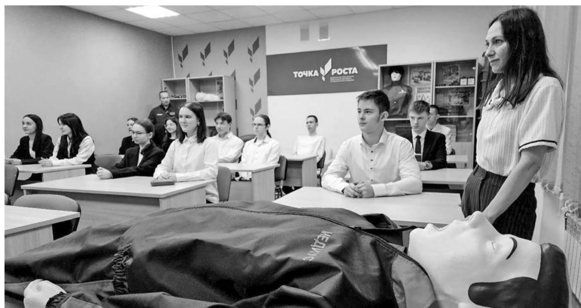
С появления «Точки роста» в школе №8 гарнизона авиаторов начались преобразования образовательного учреждения.