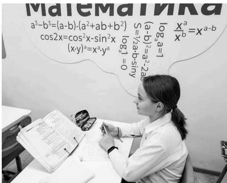
Отремонтированный кабинет математики в школе №1 радует учеников.