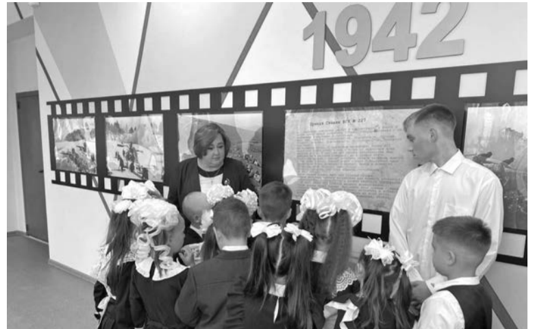
...а в школе №2 — современное музейное пространство.