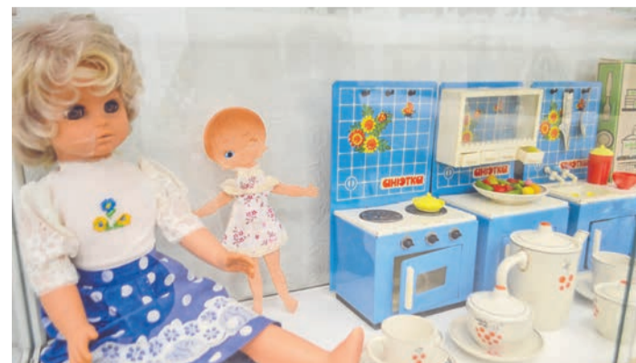
С дошкольного возраста девочки учились быть хозяйками.

С выставочных витрин на посетителей смотрят куклы, неваляшки, пусики, Чебурашки, лошадки, солдатики. Интересно разглядывать мини-автопарк, наборы игрушечной посуды, целый кухонный уголок для юных хозяйшек. Можно даже поиграть в настольные игры, которые наверняка стали прототипами современных пазлов, развивающих игр, конструкторов.