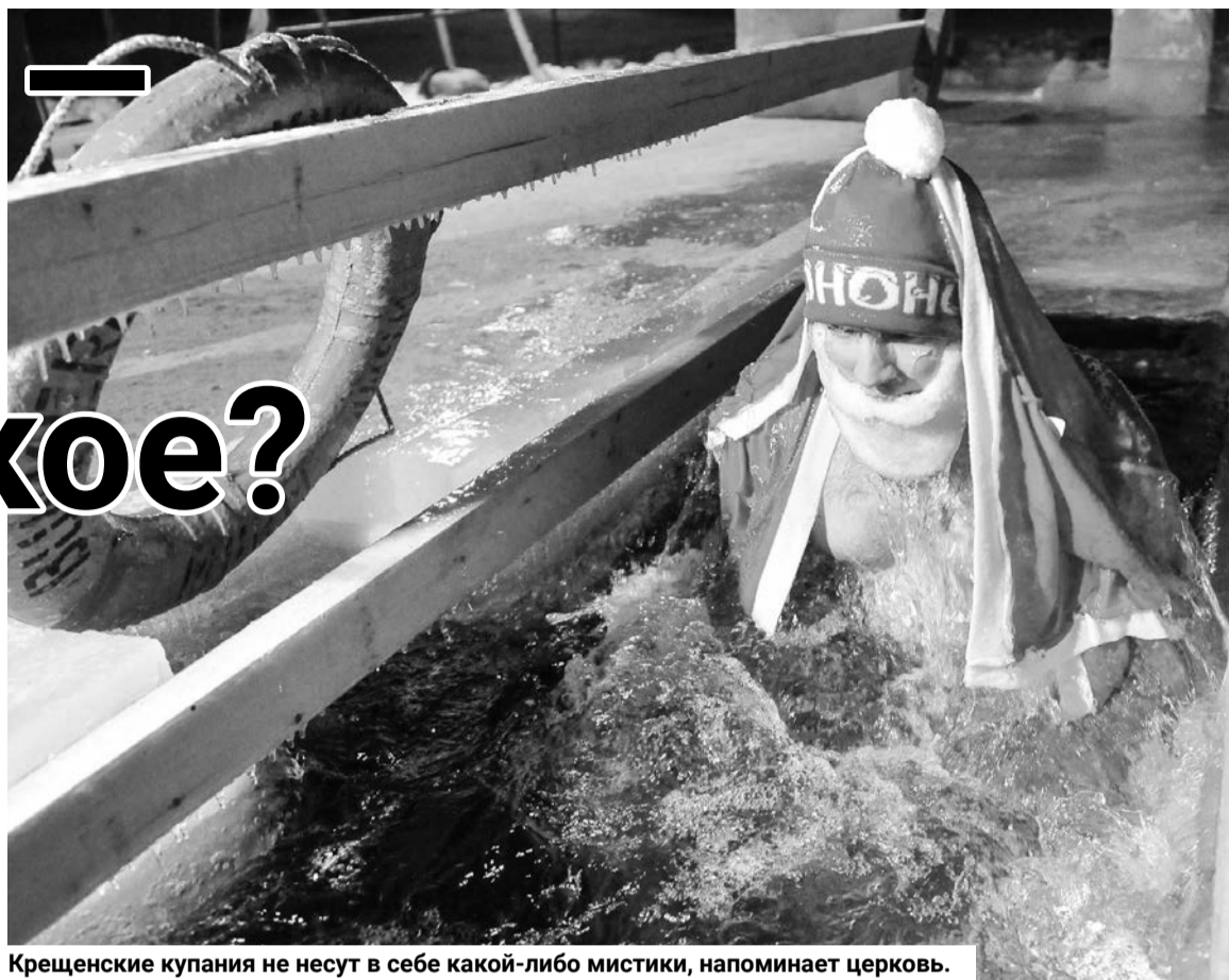
Крещенские купания не несут в себе какой-либо мистики, напоминает церковь.

— Если говорить про фото, то, к примеру, я сам делаю селфи во время крестного хода, чтобы показать локацию и то, как все красиво сделано, подготовлено. Но когда человек позирует в купальнике