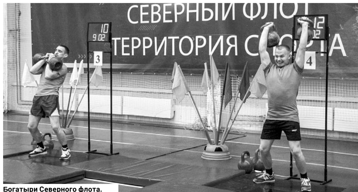
Богатыри Северного флота.