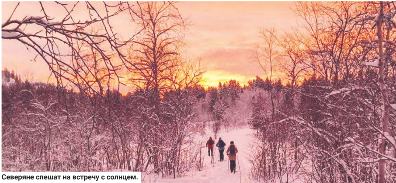
Северяне спешат на встречу с солнцем.