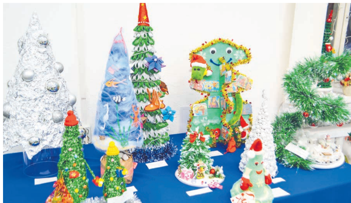
Ежегодно жюри, помимо победителей в заявленных номинациях, определяет лидеров спецноминаций.