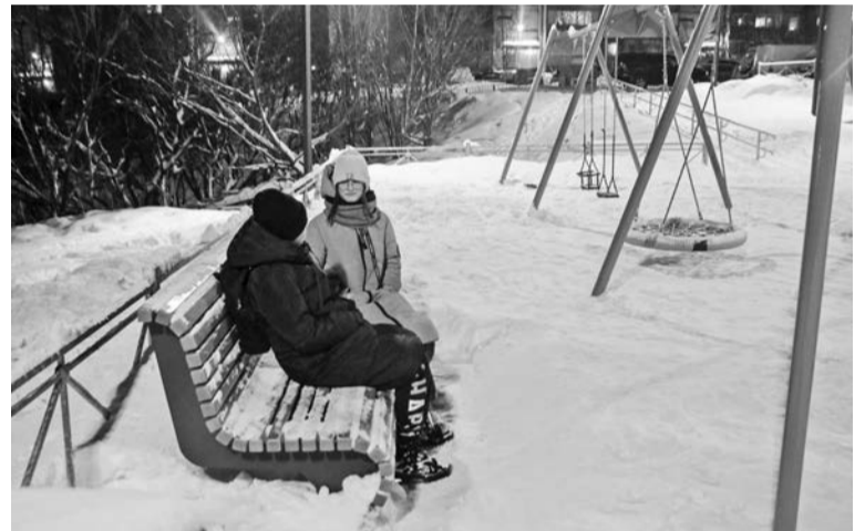
На детской площадке по ул. Корабельная, 22, комфортно и уютно.

том РФ Владимиром Путиным, запланированы работы по капитальному ремонту в 48 многоквартирных домах в Северноморске и поселках. В ряде домов работы уже завершены. В Сафоново-1 и Щукозере снесены четыре аварийных дома.