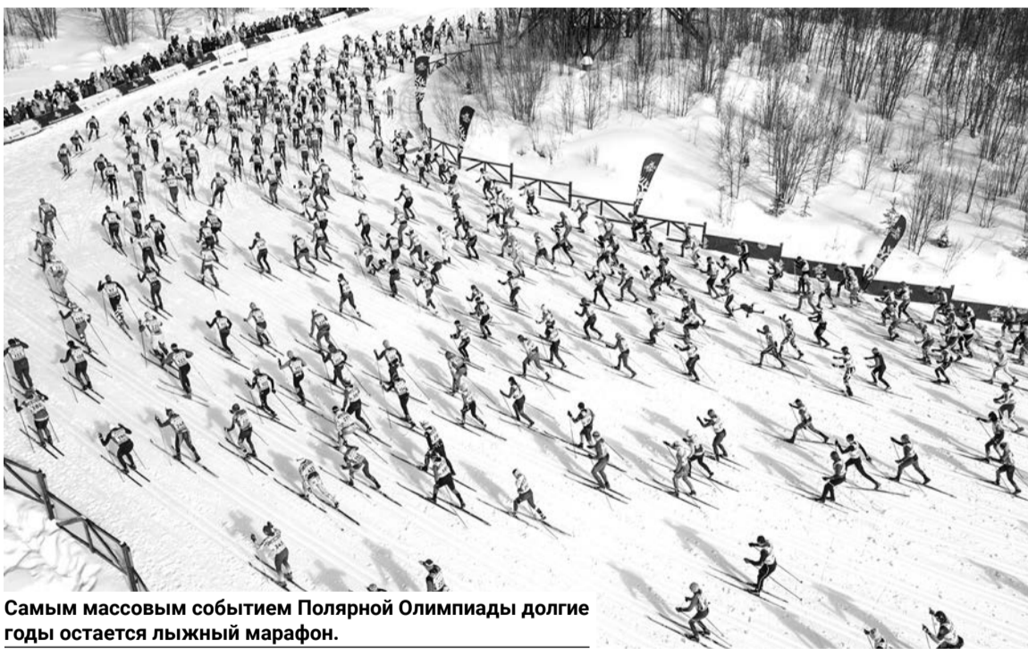
Самым массовым событием Полярной Олимпиады долгие годы остается лыжный марафон.