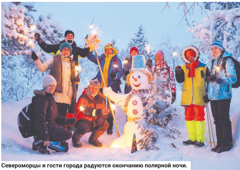
Североморцы и гости города радуются окончанию полярной ночи.

ска отправились навстречу светилу в сопки над озером Сердечко.