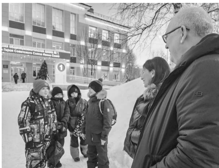
Ученики школы №1 рассказали, как им нравится обновленное школьное пространство.