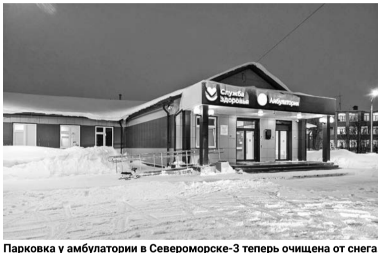
Парковка у амбулатории в Северноморске-3 теперь очищена от снега.