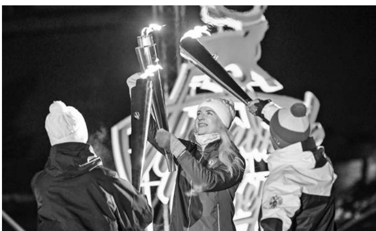
Церемония открытия Праздника Севера всегда проходит ярко и зрелищно.

тые спортсмены вручат ребятам памятные медали и подарки.