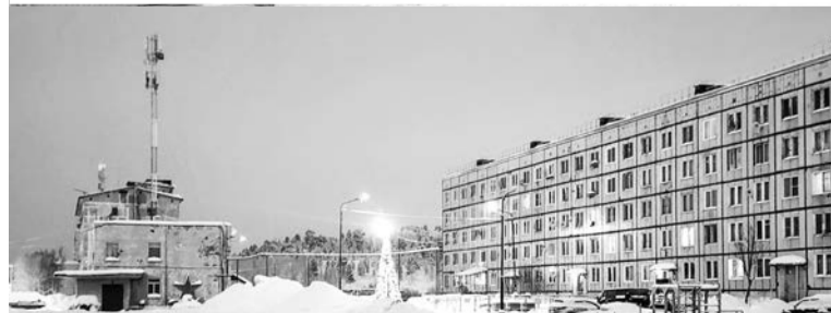
Освободившаяся территория на месте снесенного дома №5 по ул. Агеева в Щукозере находится в центре поселка, рядом с жилым домом №7 и автобусной остановкой.