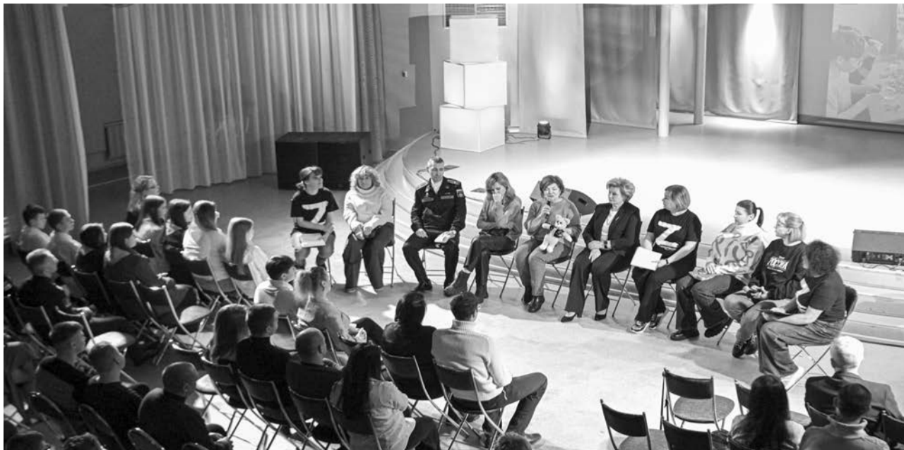
Волонтеры рассказали о своих организациях, обменялись опытом, договорились о сотрудничестве и ответили на вопросы североморцев.