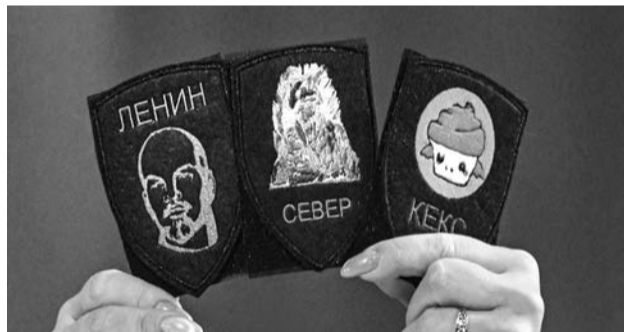
Представители «Семейного очага» изготовили шевроны для бойцов с их позывными.