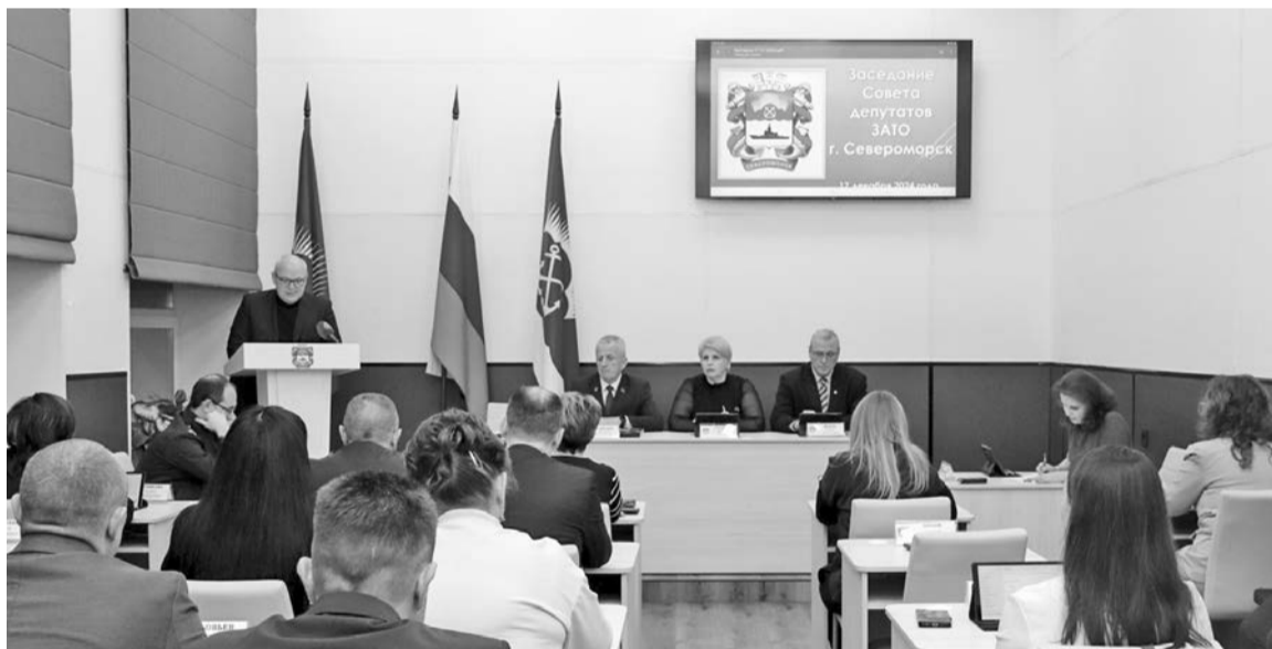
Работа в Совете депутатов в предновогодние дни особенно напряженная - уходящий год, как и наступающий, требуют принятия знаковых решений.