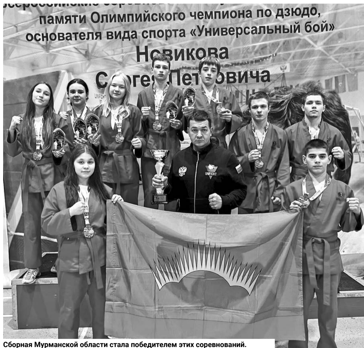
Сборная Мурманской области стала победителем этих соревнований.

Среди мужских команд благодаря усилению тремя североморскими спортсменами первое место занял «Альбатрос» (г. Полярный), второе — команда Кольского района, бронза — у МГАТП (г. Мурманск).