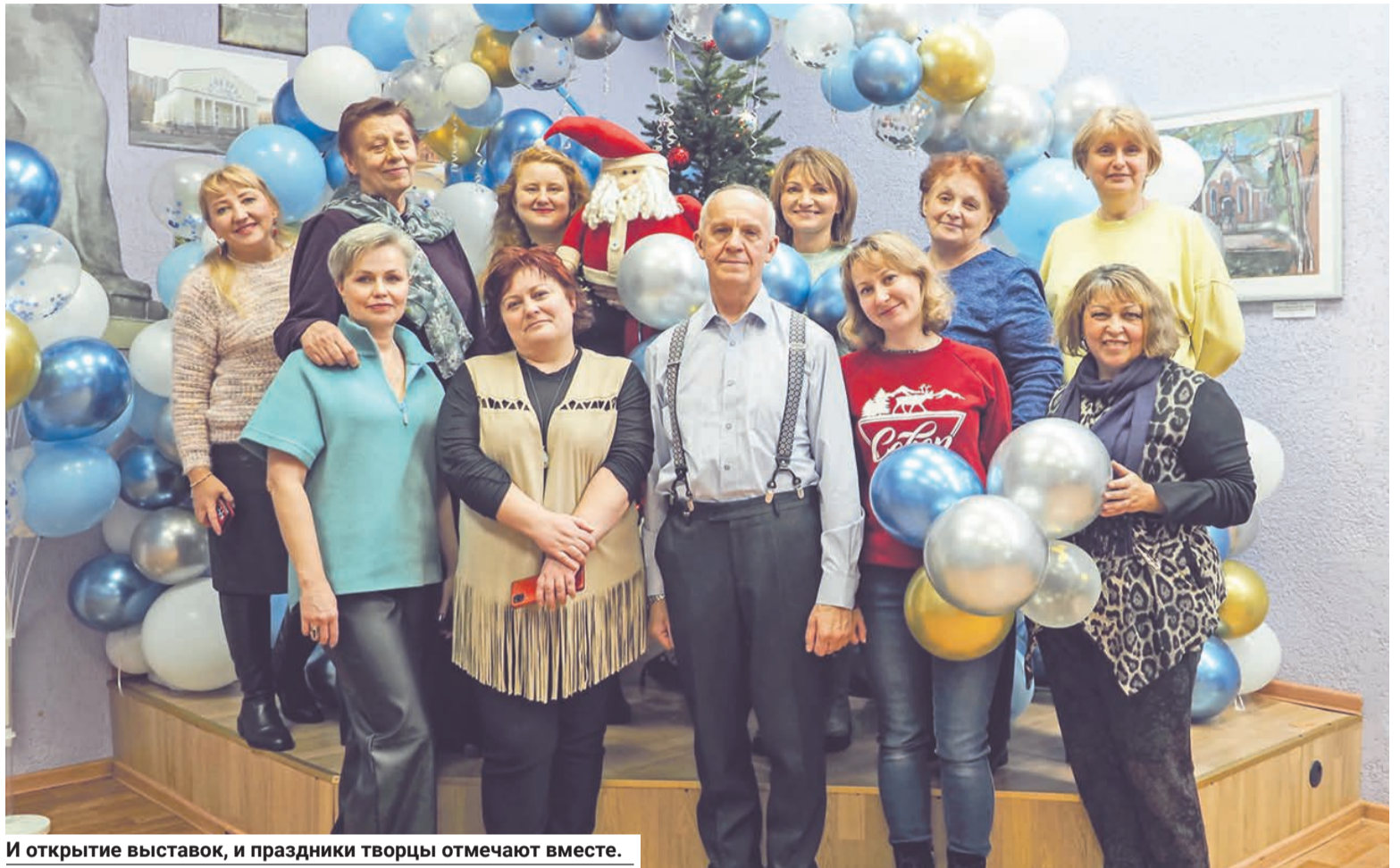
И открытие выставок, и праздники творцы отмечают вместе.

— Фильм снимался на мобильный телефон. Он должен был стать частью альманаха, посвященного женщинам Арктики. Авторы из разных стран — Швеции, Финляндии, России — снимали пятиминутные истории, которые мы хотели объединить. Среди героинь были геолог, дворник, художница. В связи с событиями 2022 года проект остановился. У меня был отснят материал. Я решила, что дать ему умереть в моем компьютере бу-