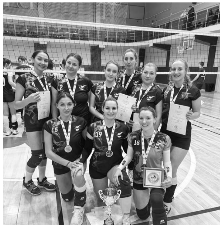
Болельщики, наблюдающие за игрой «Североморочки», говорят, что их серебро — с золотым отливом.