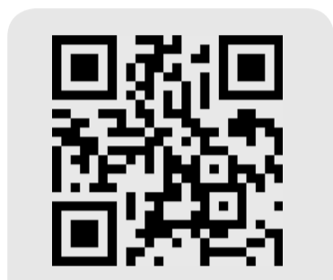
QR-код для перехода на сервис «Социальный навигатор».

Одной из тем оперативного совещания стала реализация стратегического плана «На Севере — жить» в сфере социального развития в 2024 году. Губернатор Андрей Чибис подчеркнул, что этот год Президент России Владимир Путин объявил Годом семьи, и особенно отметил выполнение нашим регионом прямых поручений главы государства.