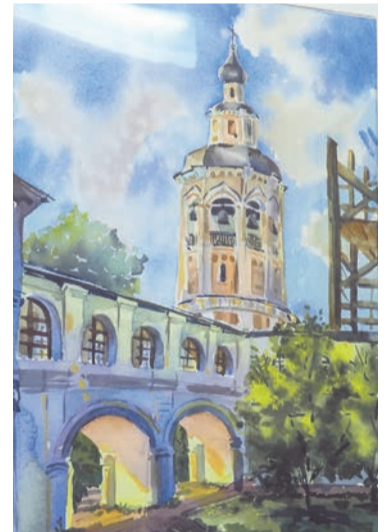
Зоммерс К., «Спасо-Прилуцкий монастырь», бумага, акварель, г. Вологда, 2024 г.

дет неправильно, и сделала из него отдельный фильм. В прошлом году отправила на «Северный характер», его показывали в рубрике «Наш современник», — рассказала Лада Карицкая.