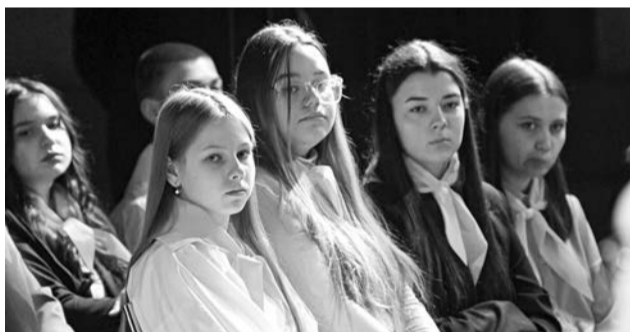
Ребята из школы №7 — активные участники благотворительных и патриотических акций.