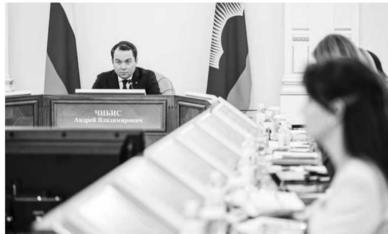
Андрей Чибис рассказал о сфере соцразвития в рамках реализации плана «На Севере — жить».

В «навигаторе» есть строка поиска: если вы уже знаете, какую конкретную меру поддержки ищете, просто введите часть названия — и система мгновенно отфильтрует подходящие варианты, предоста-