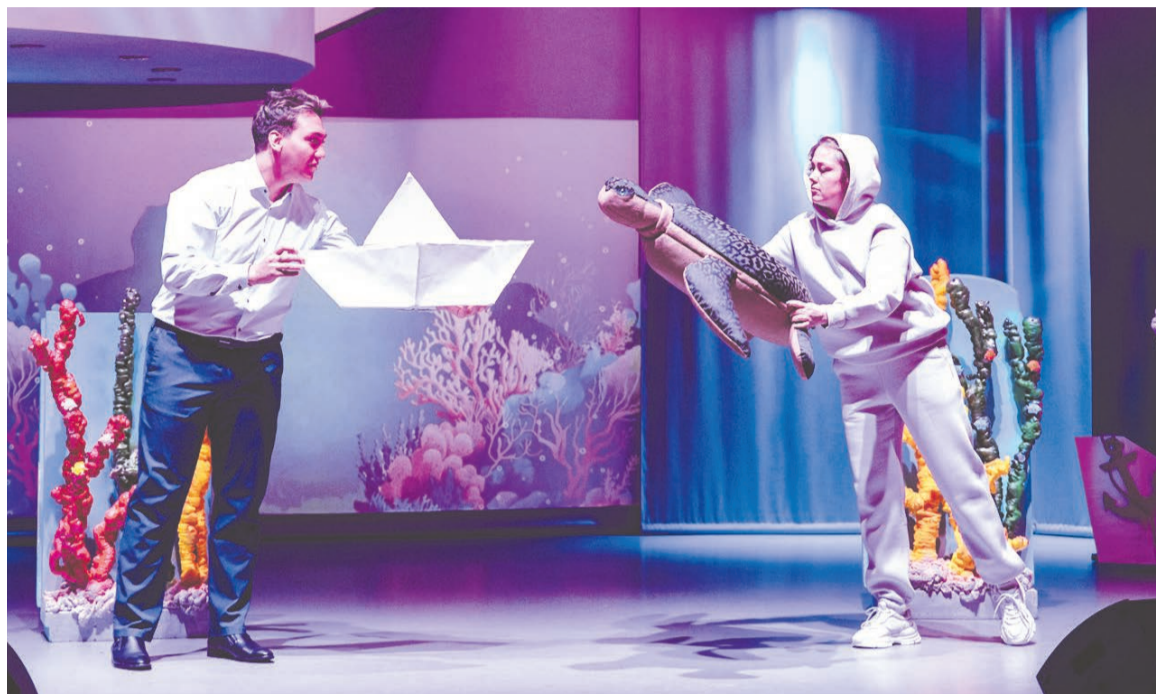
Ты не одинок, рядом всегда есть большой и мудрый помощник, он подскажет, как выбраться из шторма.

спектакля ребята вместе с мастерами ЦДМ и волонтерами сами совершали маленькие чудеса — и теперь новогодние киты и рамки для фотографий или зеркал украсят их комнаты, напоминая о замечательном дне. И в этом инклюзия, в возможности рука в руку что-то смастерить, пофотографироваться, пообщаться.