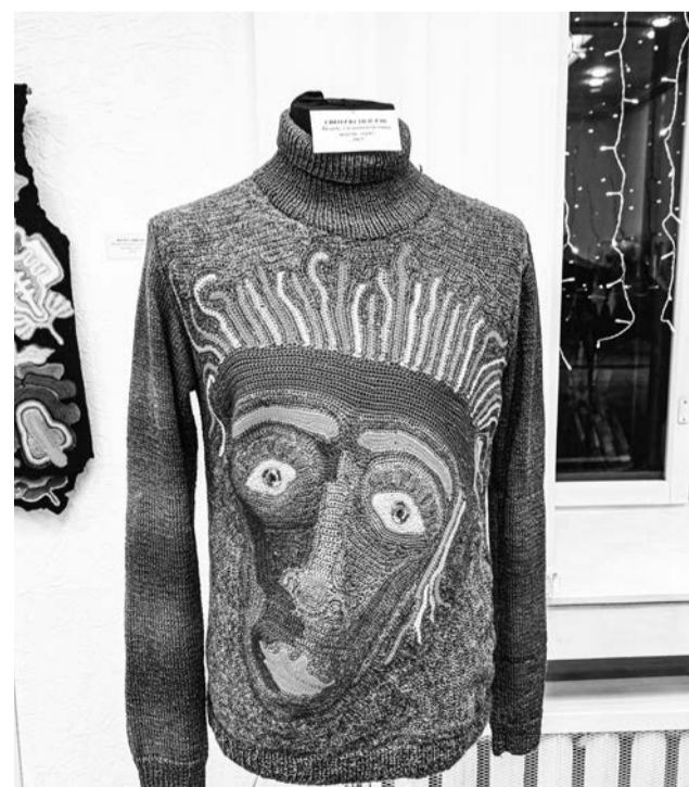
Свитер в стиле рэп. Вязание, смешанная техника, шерсть, акрил, 2015 г.