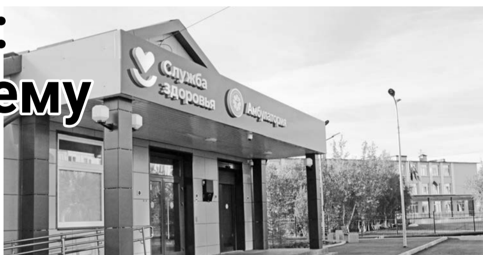
Амбулатория в Североморске-3 была построена в рамках стратегического плана «На Севере — жить» и введена в строй в 2023 году.

Андрей Чибис также сообщил, что с 2019 года более 6 млрд рублей направлено на ремонты медучреждений в рамках плана «На Севере