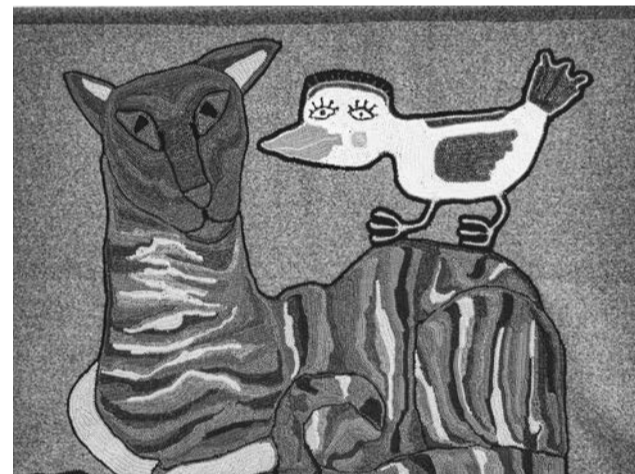
«Друзья». Вязание крючком, смешанная техника, акрил, хлопок, шерсть, 2014-2024 г.