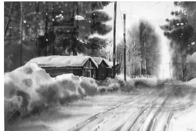
«Снежный вечер. Умба». Акварель, бумага, 2023 г.

Гости экспозиции в Выставочном зале могут увидеть живописные виды Терского берега, сельские и урбанистические пейзажи, у каждого из которых есть свое настроение. На вернисаже побывали североморские авторы, председатель Со-