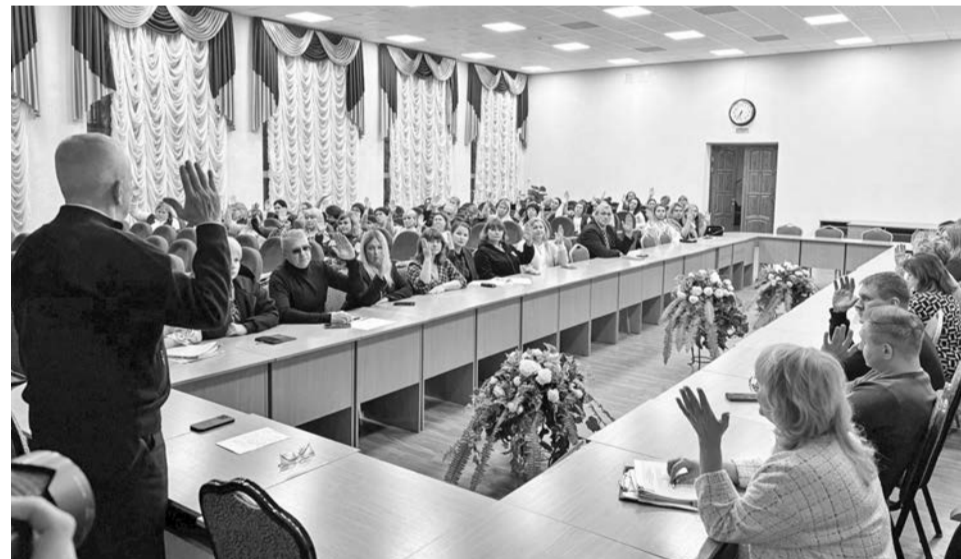
Изменения в бюджете и Устав ЗАТО участники публичных слушаний приняли единогласно.

— Бюджетная политика на 2025 год и плановый период 2026 и 2027 годов сохраняет направленность и будет ориентирована в первую очередь на обеспечение социальной и финансовой стабильности ЗАТО Североморск, — отметила в своем докладе начальник Управления финансов ад-