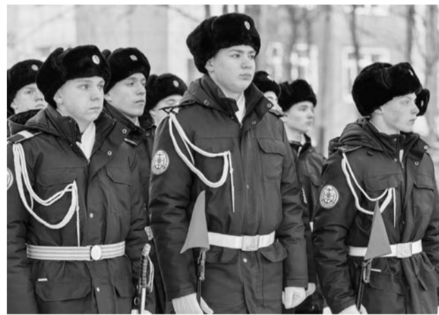
Торжественные мероприятия начались с построения личного состава на плацу корпуса.

29 ноября Североморский кадетский корпус отметил 60-летие основания школы-интерната и 10-летие со дня образования кадетского корпуса.