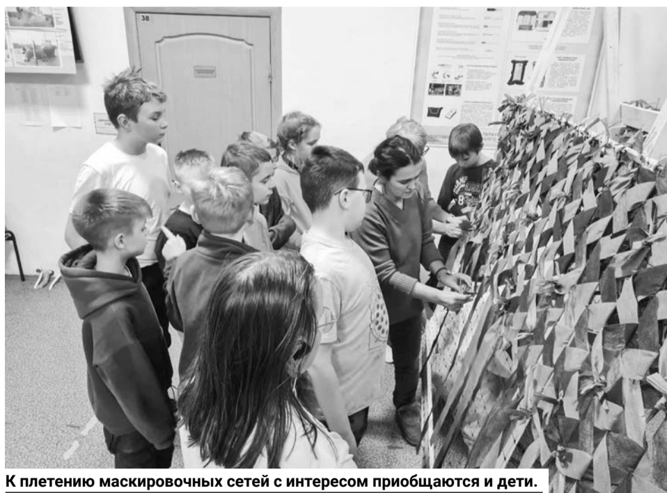
К плетению маскировочных сетей с интересом приобщаются и дети.

ных сетей. Но, как они выражаются, и с «осенью» не попрощались.