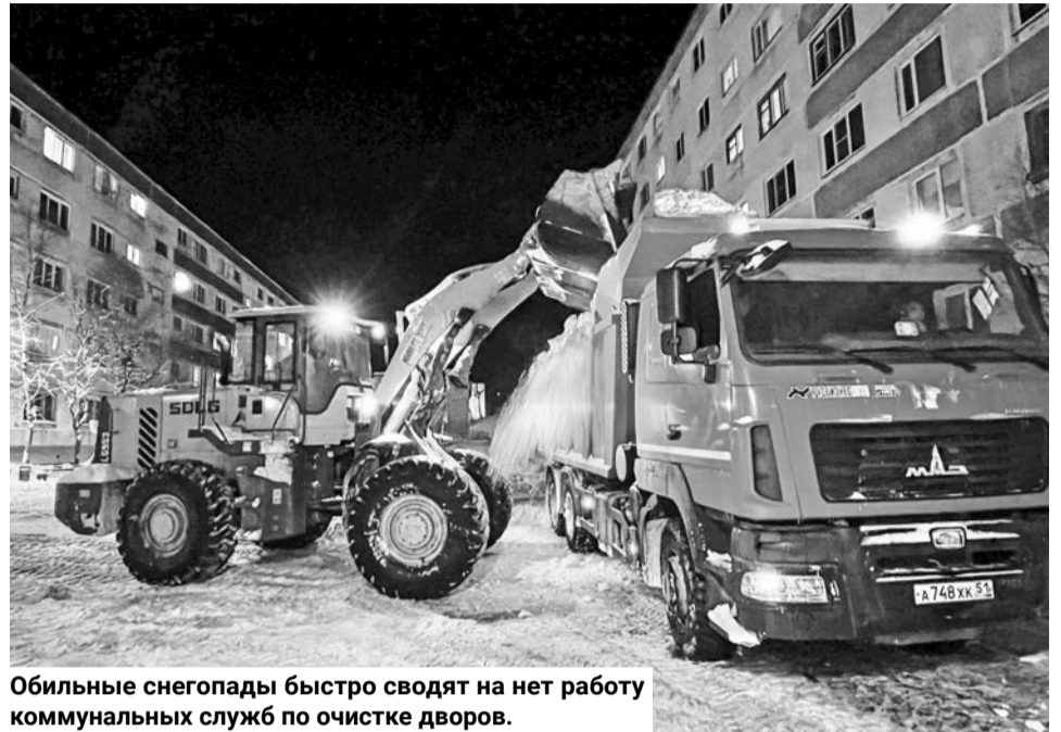
Обильные снегопады быстро сводят на нет работу коммунальных служб по очистке дворов.

У обслуживающих организаций, в отличие от муниципального подрядчика, техники не так много. Однако механизированная уборка ведется и на придомовых территориях.