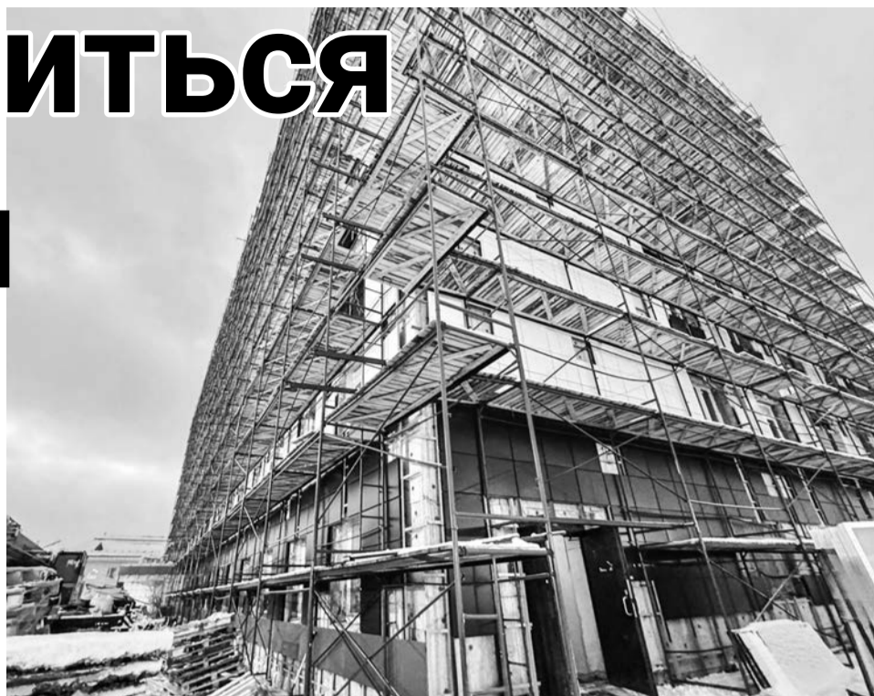
Хирургический корпус Североморской ЦРБ уже не узнать.