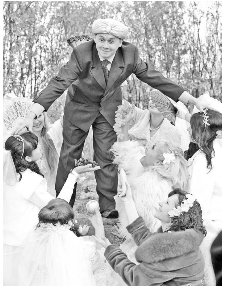
Это только в песне «на десять девчонок по статистике девять ребят». На фотосессии Праздника невест на 25 девушек оказался всего один жених.