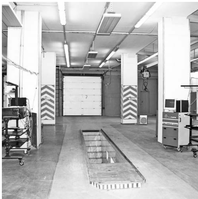
Линия обслуживания грузовых автомобилей открылась в Североморске впервые.