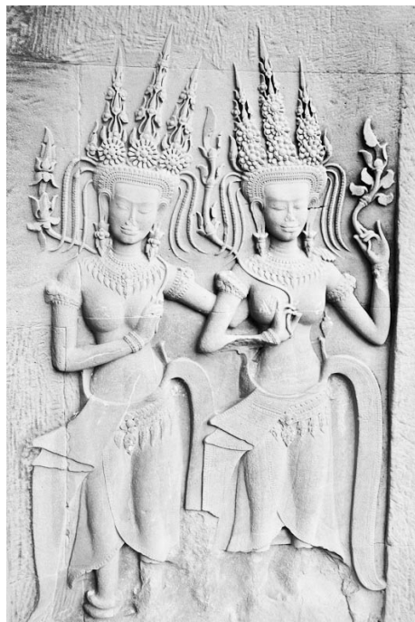
На панно храмового комплекса изображены индуистские мифологические сцены, в частности, пляски небесных нимф.

В Сиам Рипе стоит сразу взять такси до отеля. Если не успели определиться с гостиницей заранее, таксист предложит вариант. Шикарные отели особой популяр-