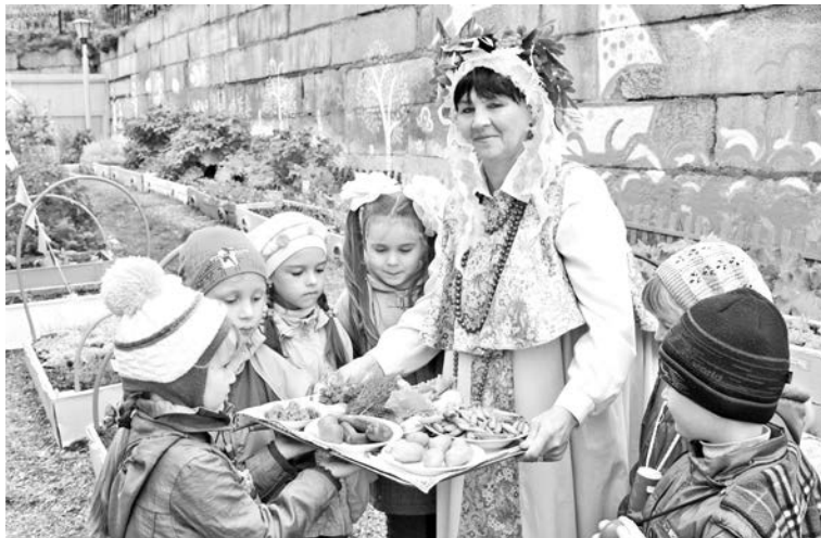
Тетушка Осень всегда щедра к тем, кто хорошо потрудился.