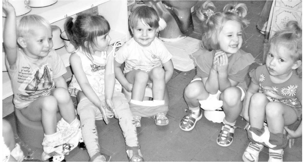
Общаться, смеяться, играть детишки продолжали даже сидя на горшках.

После завтрака по плану занятие. Сегодня это рисование. Но сначала ребят пришлось разделить на две группы: с одной остаюсь я, чтобы играть с малышами, в то время как с другой занимается воспитатель. Затем группы меняются местами. Здесь, на мой взгляд, просто необходимо отметить огромный, кропотливый труд педагога. Ведь для занятия нужно было сделать 15 заготовок домика и колобка. Детям оставалось нарисовать дорожку при помощи пары линий, испачкав при этом краской себя, стол и соседа. Но вот юные художники смывают акварель со своих ладо-