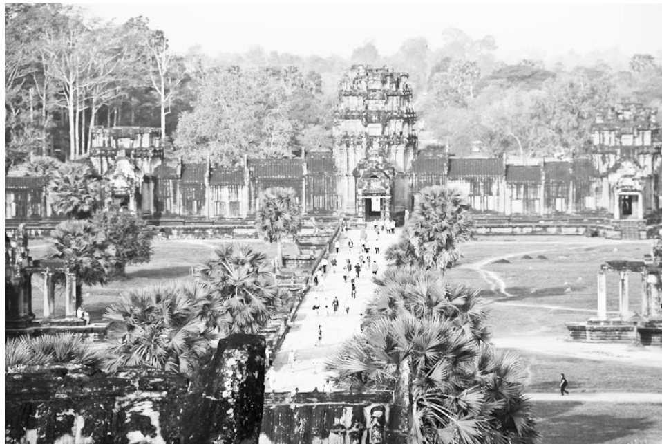
Ангкор-Ват дословно означает город-храм - точнее не скажешь.