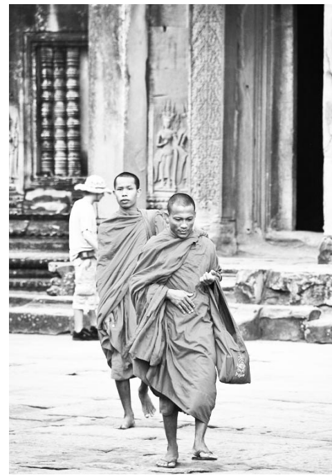
Буддийские монахи продолжают жить в Ангкор Вате, проводить службы и поддерживать порядок.