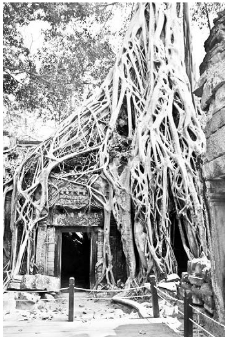
Деревья не просто оплетают древние храмы, а буквально растут из руин - такое увидишь только в Камбодже.

ностью не пользуются, потому что большинство туристов приезжают на два дня и в номерах только ночуют. Таксист, который вас привез, предложит быть гидом на следующий день. Не спешите отказываться – экскурсия начинается до восхода солнца, найти свободного водителя в это время сложно. Кроме того, храмовый комплекс занимает значительную площадь – пешком не обойти. Правда, за 20 долларов можно нанять на день тук-тук – мотоцикл с коляской. Будьте готовы к тому, что гид из водителя получится никудышный, так что запаситесь подробным путеводителем.