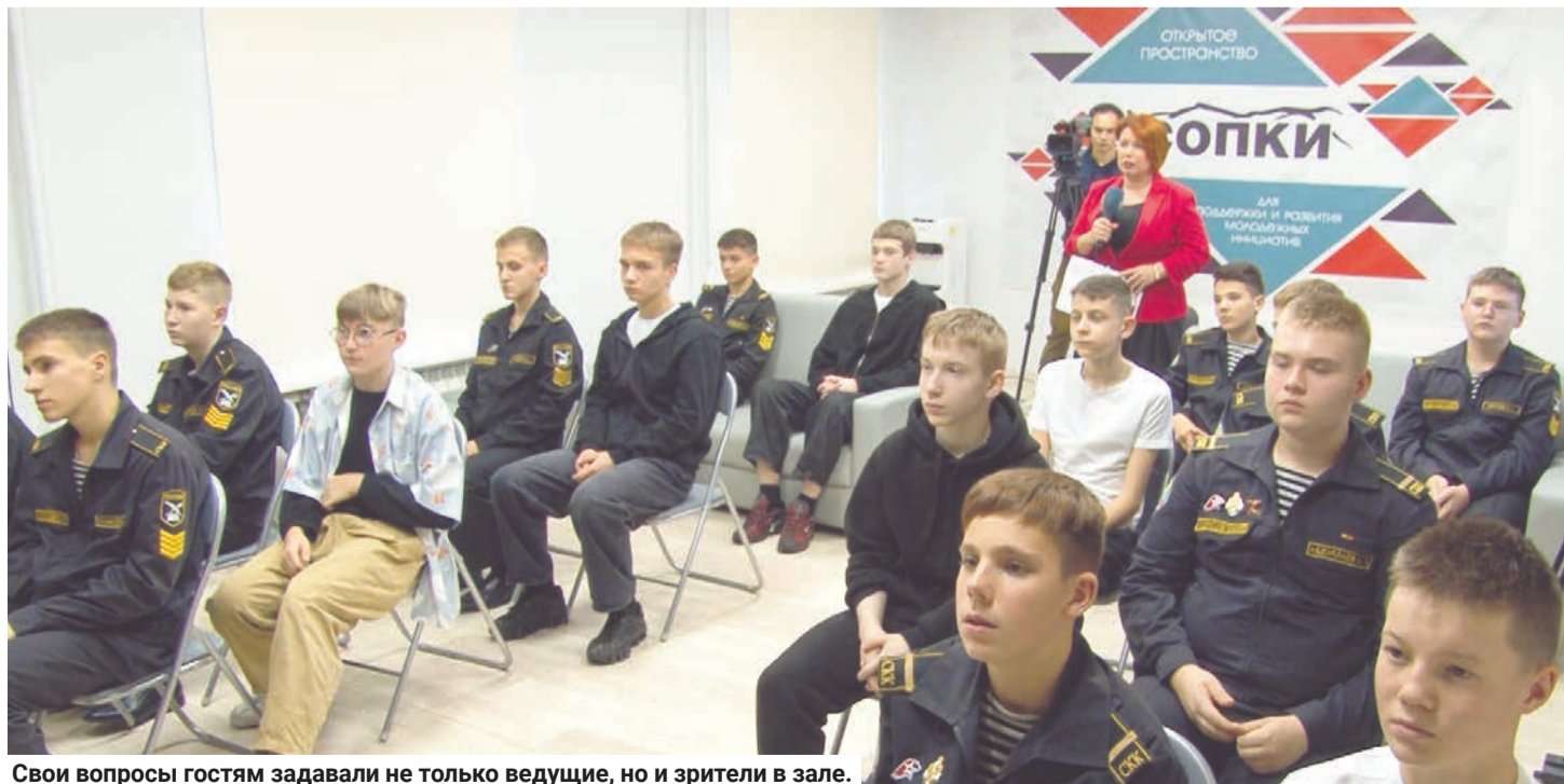
Свои вопросы гостям задавали не только ведущие, но и зрители в зале.

Нам Бог посылает обстоятельства жизни, выше головы прыгать не надо. Но действовать можно не только если станешь президентом, великим политиком, полководцем. Начать борьбу можно уже сейчас. Если мы будем стремиться жить в дружбе, стараться уважать друг друга, защищать слабых, любить свою Родину, то и через 50 лет эти ценности не изменятся. Это тот фундамент, который закладывается здесь и сейчас. Важно то, что у меня в сердце, в душе, то, что