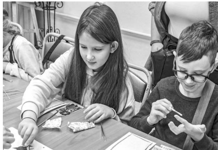
Работать с таким хрупким материалом, как цветочные лепестки, не просто, но очень интересно.