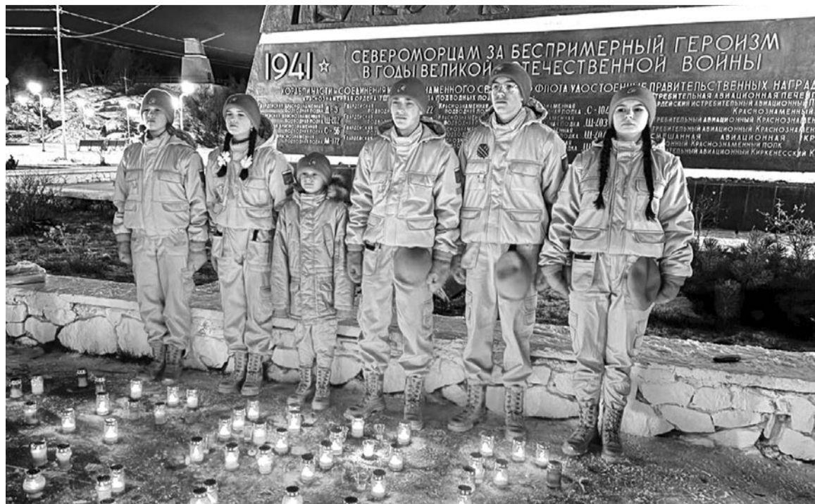
Североморские юнармейцы приняли участие во всех мероприятиях, приуроченных к 80-летию разгрома немецко-фашистских войск в Заполярье.