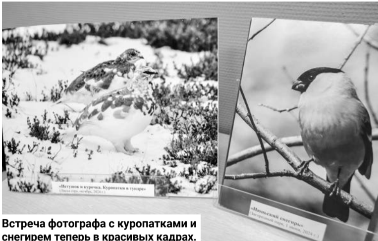
Встреча фотографа с куропатками и снегирем теперь в красивых кадрах.

В дни школьных каникул в Центральной детской библиотеке им. С. Михалкова проходила череда разноплановых мероприятий: просмотр фестивальных мультфильмов и кинофильмов, интеллектуальные квизы, литературные вечера, познавательно-игровые программы, презентации книжных и фотовыставок и многое другое.