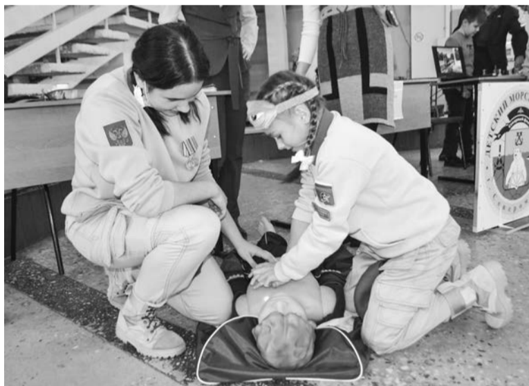
Юнармейцы умеют действовать в критических ситуациях и вас научат.