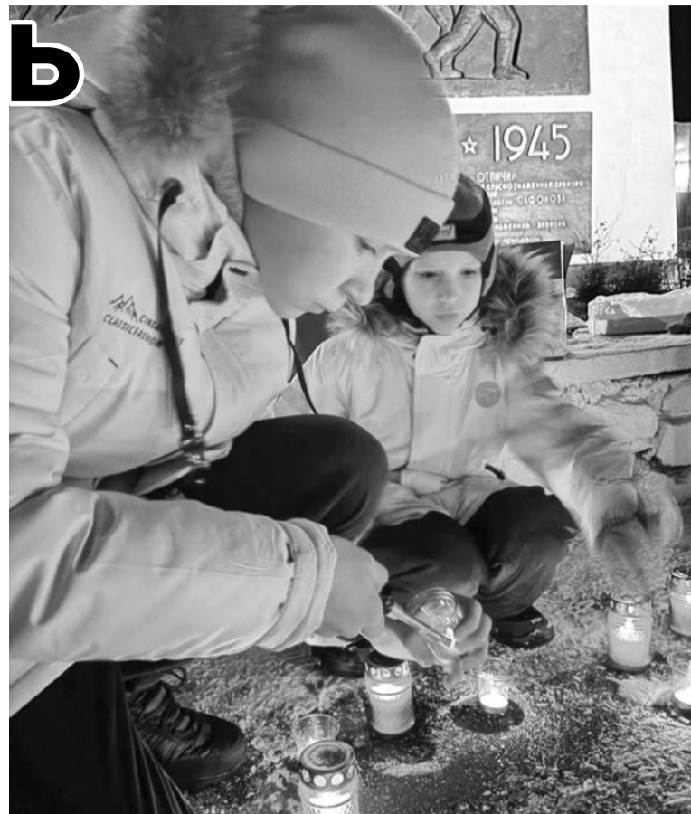
Память о подвигах советских воинов, отстоявших нашу страну в 1941-1945-х годах, передается из поколения в поколение.

На минувшей неделе на территории нашего региона состоялась областная патриотическая акция «Огненные картины», посвященная 80-летию разгрома немецко-фашистских войск в Советском Заполярье.