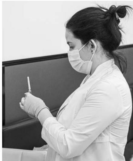
Медики могут провести вакцинацию и на выезде — при получении заявки от трудовых коллективов.

Губернаторская программа «Витаминизация», в рамках которой жители Мурманской области могут бесплатно пройти экспресс-