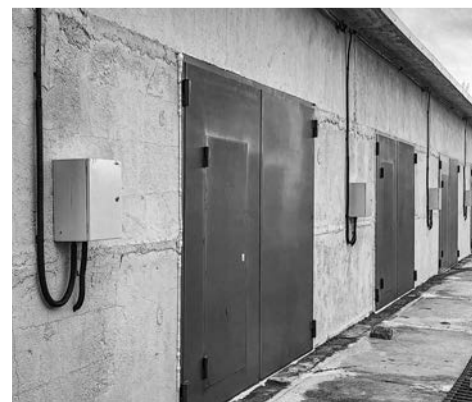
Новые боксы могут использоваться и как гаражи, и как складские помещения.