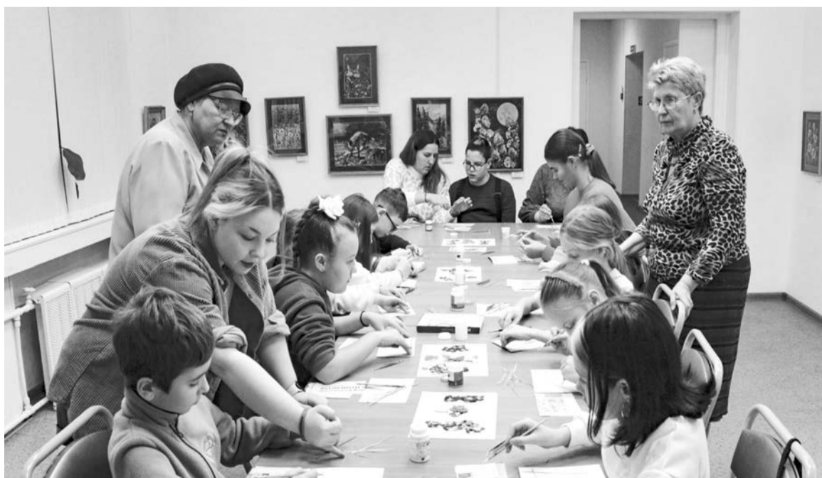
В окружении работ участников клуба флористики «Орхидея» гости Отдела ремесел сами создавали красоту.