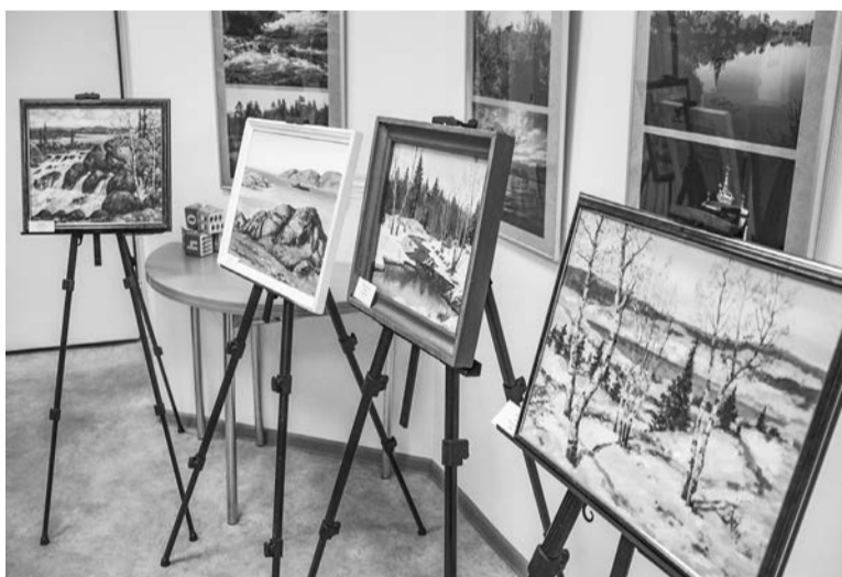
Картины, средства от продажи которых будут направлены бойцам, принимающим участие в СВО.

Анна ВИХРОВА. Игорь ГЛУЦКИЙ.