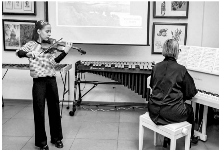
«Музыкальные картины» в исполнении учеников и педагогов Североморской ДМШ.