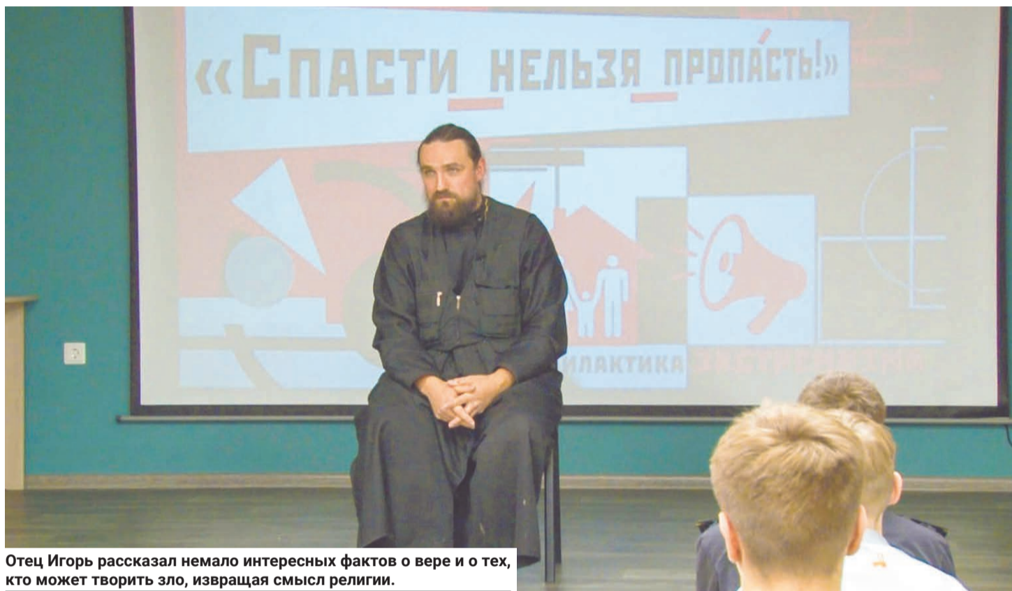
Отец Игорь рассказал немало интересных фактов о вере и о тех, кто может творить зло, извращая смысл религии.

— Мы можем с вами где-то «наковырять» религиозные культы, в которых предусмотрены какие-то страшные вещи. Но если говорить про мировые религии, то надо очень постараться, чтобы исказить, найти нечто, что призвало бы творить зло. Религия призывает человека ко всякому добру. Если ты любишь Бога, то любишь ближнего, ты его не обидишь, ты его не осудишь, ты его не предашь, не ударишь, ты защитишь слабого, ты будешь хорошим другом и так далее. Всё из любви. Что касается творения всякого зла, беззакония, мы в истории много знаем примеров, когда люди, прикрываясь, как сейчас