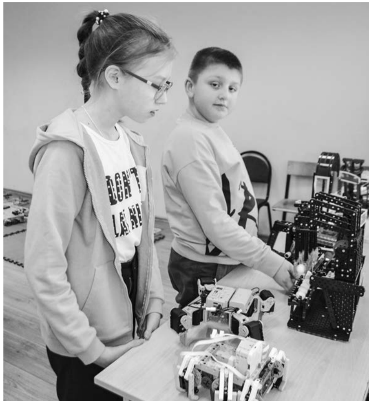
В Квантолабе юные робототехники создают машины и учат их приносить пользу.

Каждые каникулы в Учебном центре в рамках недельного цикла мероприятий «В мире профессий» проходят экскурсии для школьников. Ребята узнают, азам каких профессий могут их научить педагоги Центра.