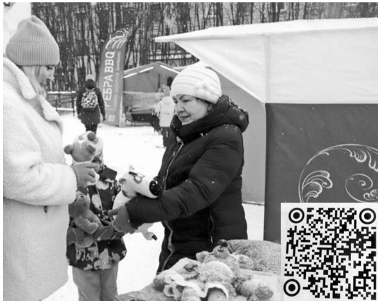
На вырученные в рамках благотворительного марафона средства участники организации хотят приобрести свою палатку-шатер для участия в городских праздниках, ярмарках.