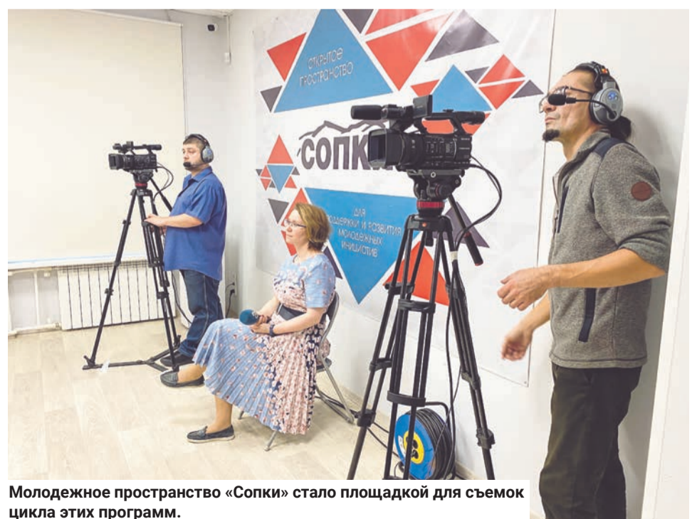
Молодежное пространство «Сопки» стало площадкой для съемок цикла этих программ.