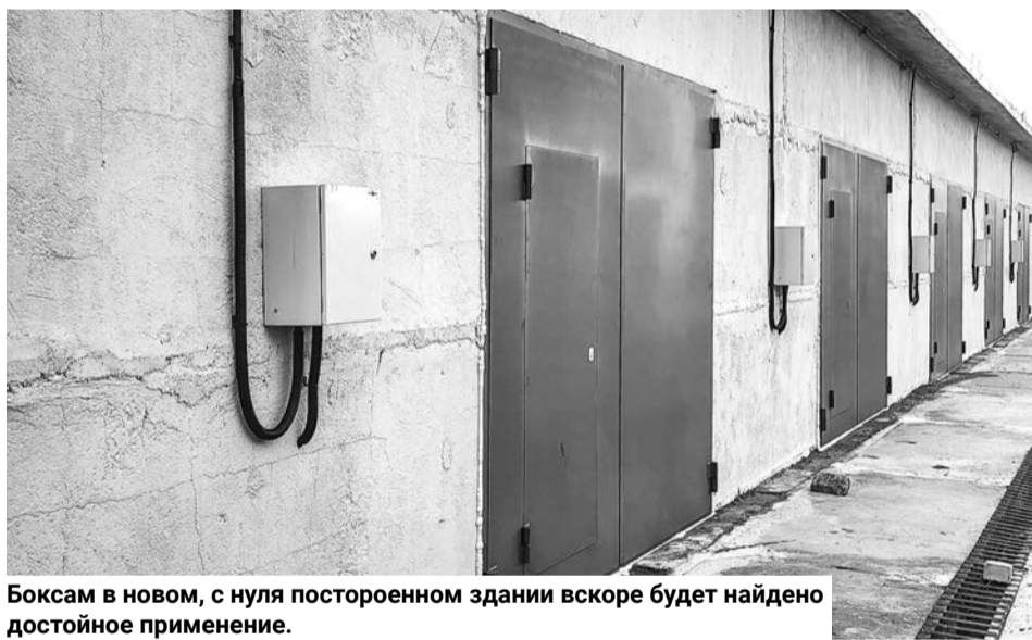
Боксам в новом, с нуля построенном здании вскоре будет найдено достойное применение.

Подробнее о различных мерах резидентам Арктической