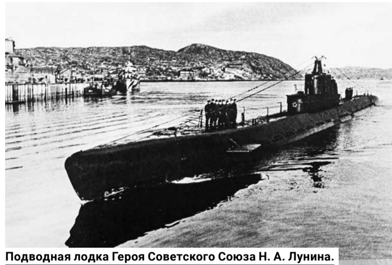
Подводная лодка Героя Советского Союза Н. А. Лунина.