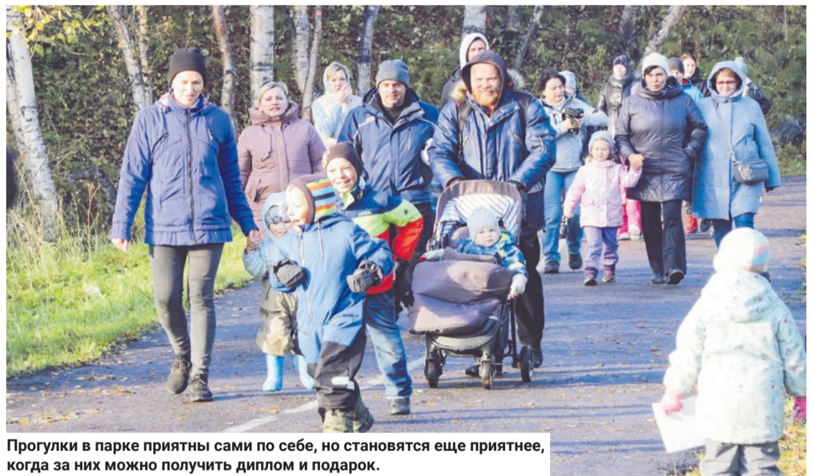
Прогулки в парке приятны сами по себе, но становятся еще приятнее, когда за них можно получить диплом и подарок.