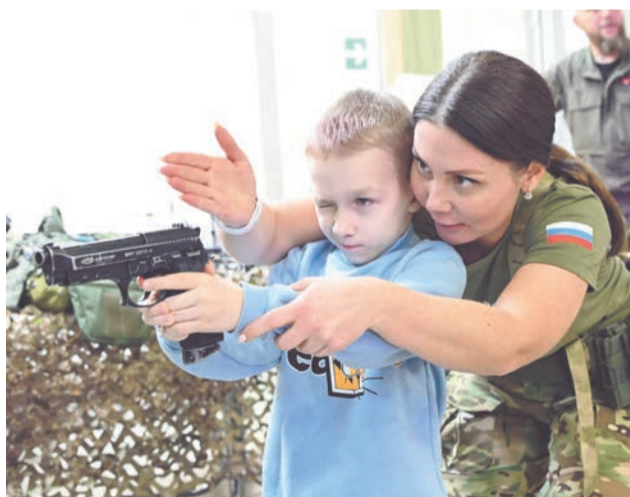
На площадке центра «Воин» мальчишки радовались возможности подержать в руках современное оружие.

го времени, принять участие в занятии по тактической медицине.