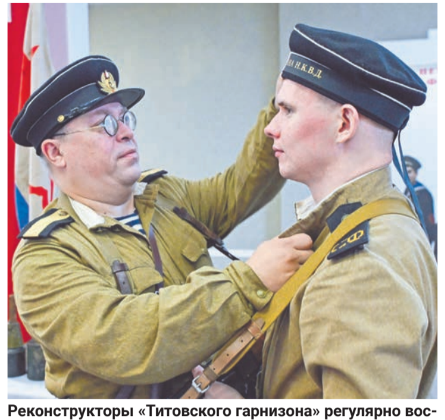
Реконструкторы «Титовского гарнизона» регулярно воссоздают события времен Великой Отечественной войны.