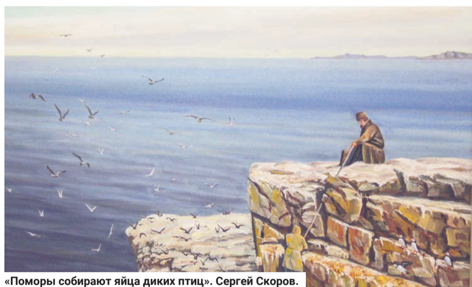
«Поморы собирают яйца диких птиц». Сергей Скоров.