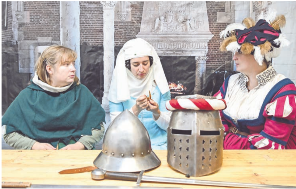
Средневековые танцы и костюмы — специализация участников студии «Пустошь».