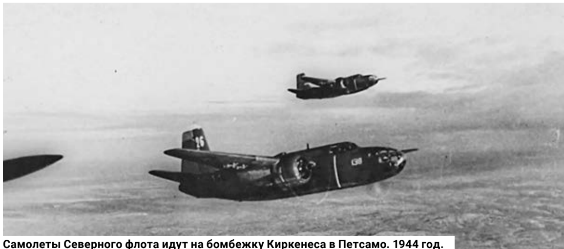
Самолеты Северного флота идут на бомбежку Киркенеса в Петсамо. 1944 год.