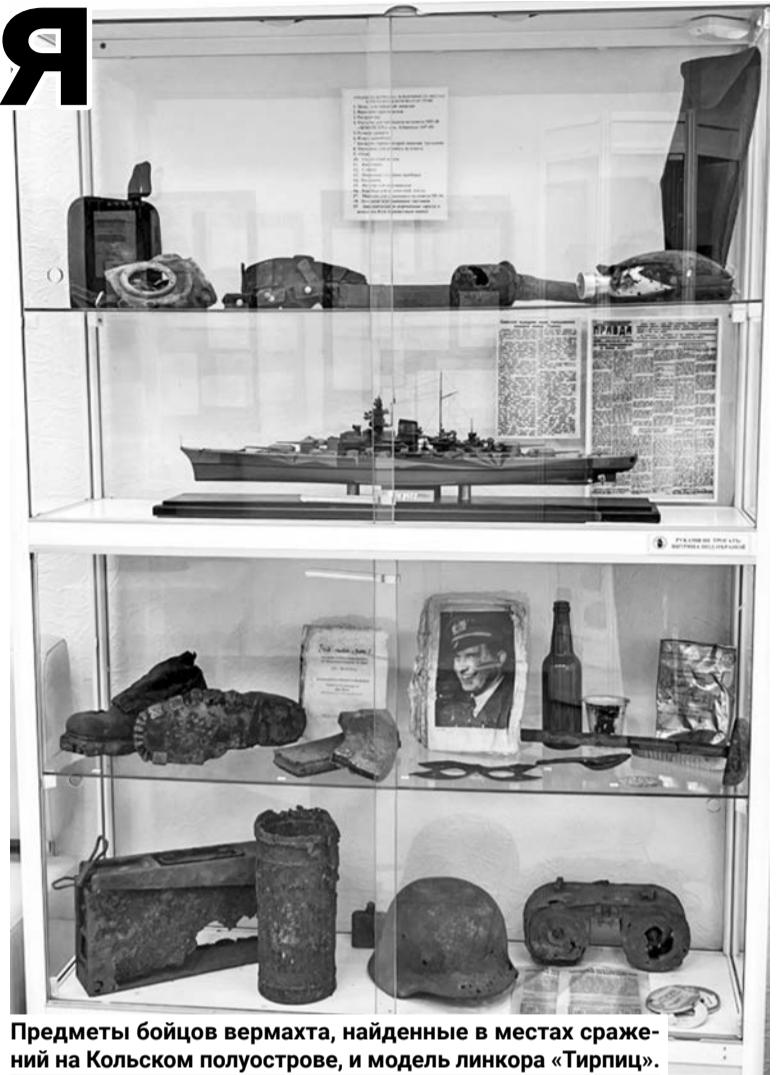
Предметы бойцов вермахта, найденные в местах сражений на Кольском полуострове, и модель линкора «Тирпиц».