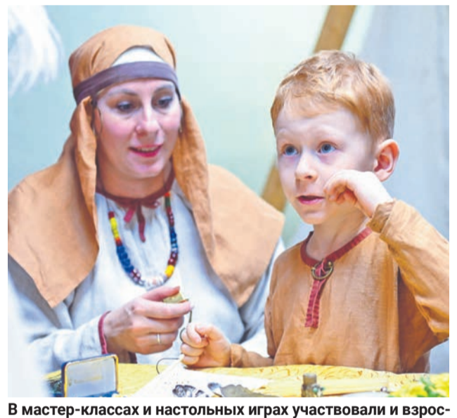
В мастер-классах и настольных играх участвовали и взрослые, и дети.