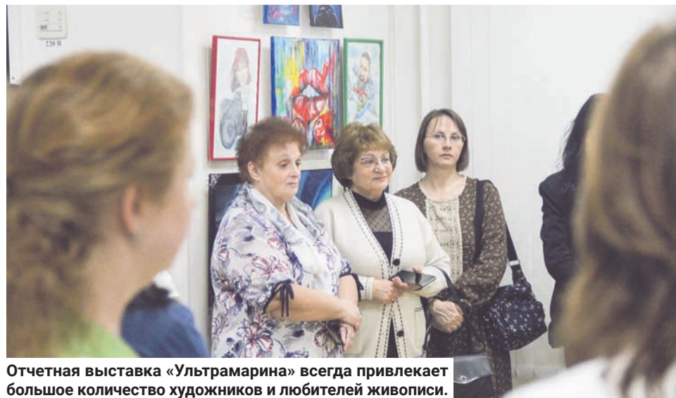
Отчетная выставка «Ультрамарины» всегда привлекает большое количество художников и любителей живописи.