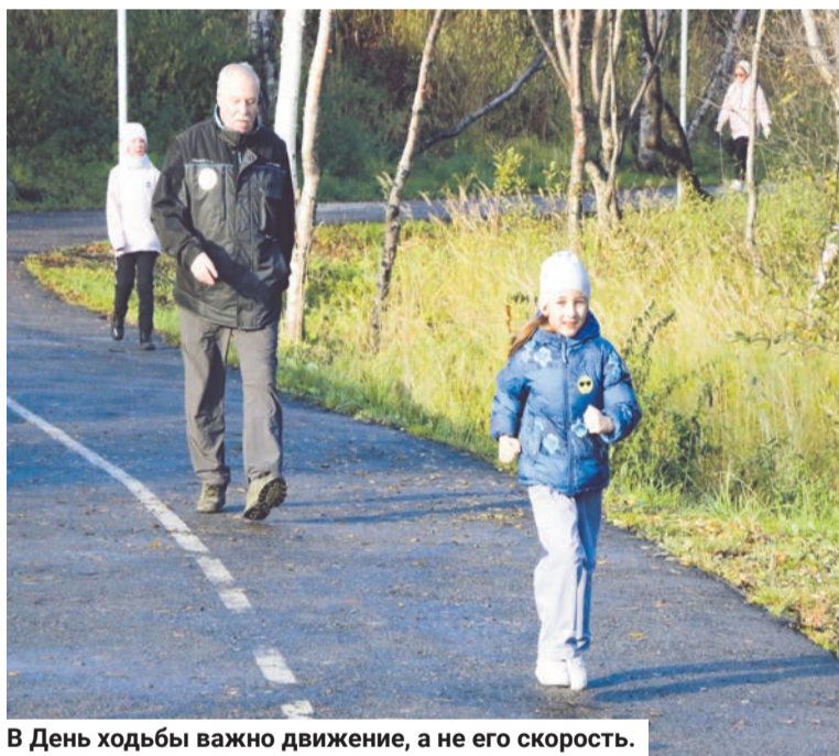
В День ходьбы важно движение, а не его скорость.