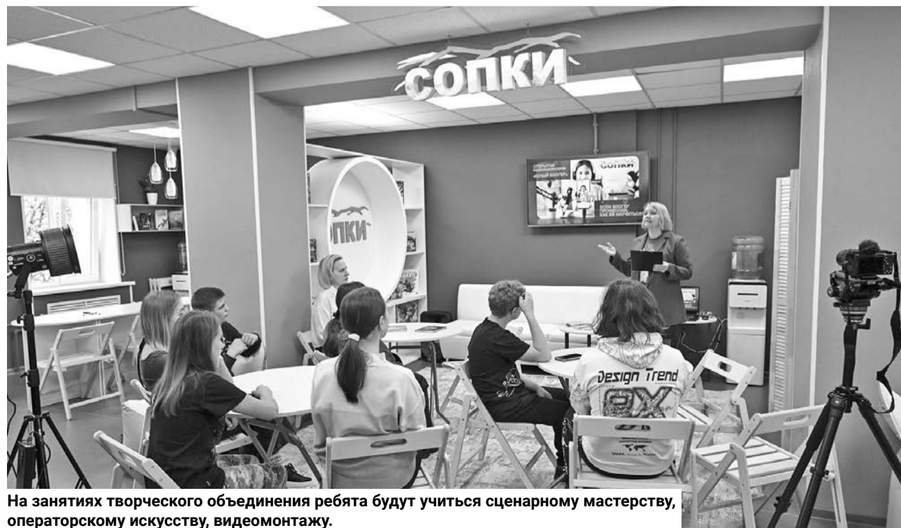
На занятиях творческого объединения ребята будут учиться сценарному мастерству, операторскому искусству, видеомонтажу.