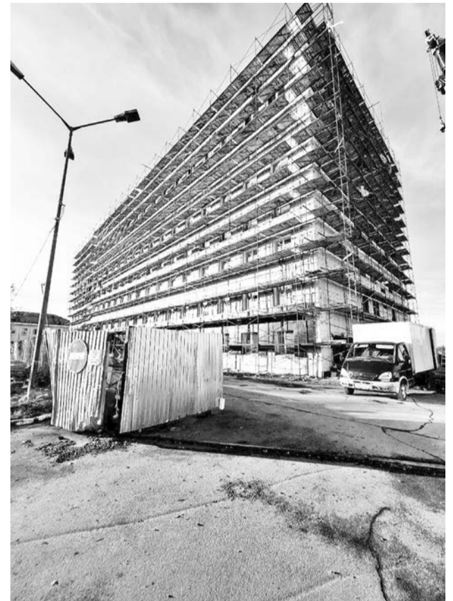
Североморскую ЦРБ в строительных лесах не узнать.

тральной районной больницы по программе реновации ЗАТО. В рамках его реализации предусмотрены капитальный ремонт крыши, фасада и технического этажа хирур-