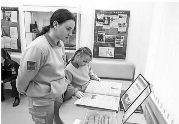
Полистав подшивку газеты «Краснофлотец» за 1941 год, юнармейцы смогли буквально прикоснуться к истории.