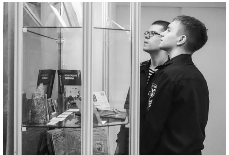
Кадеты рассматривают подшивку газеты «Североморец» (1944 г.).