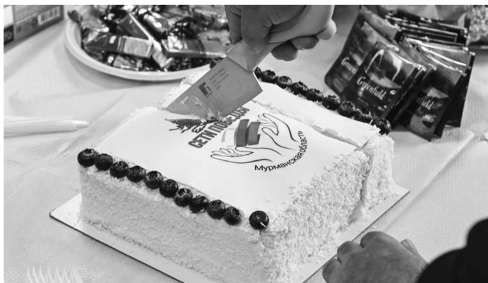
Волонтеры отмечают первую годовщину североморской организации «Сети Победы» и заверяют, что будут работать до самой победы.

сотни человек. Многие приходили, пробовали, при этом остались далеко не все, однако образовался активный костяк — человек 15–20. Это люди, на которых уже точно можно положиться.