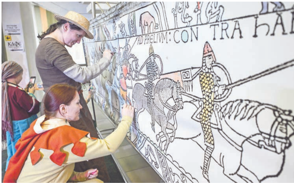
«Ковер из Байо» — полотно, которому мог добавить красок каждый участник фестиваля.