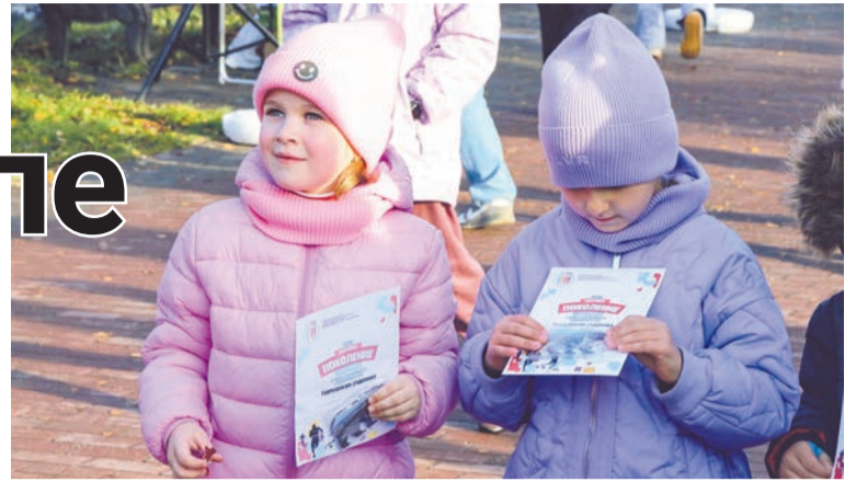
Для многих юных участников акции этот диплом стал первым в жизни.