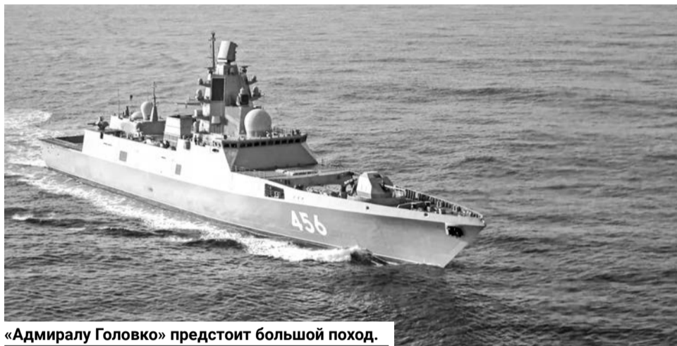
«Адмиралу Головкин» предстоит большой поход.

— Корабль к бою и походу приготовить! Съемка со швартовых — в 10 часов 00 минут. Управление с ходового командного пункта, — на новейшем серийном фрегате «Адмирал Головкин» такие команды звучат все чаще: экипаж регулярно проводит тренировки для подготовки к первому для этого корабля дальнему походу.