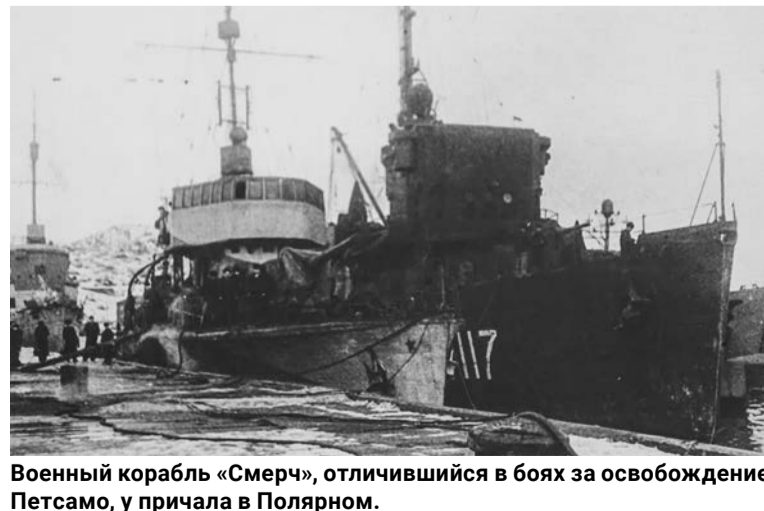
Военный корабль «Смерч», отличившийся в боях за освобождение Петсамо, у причала в Полярном.