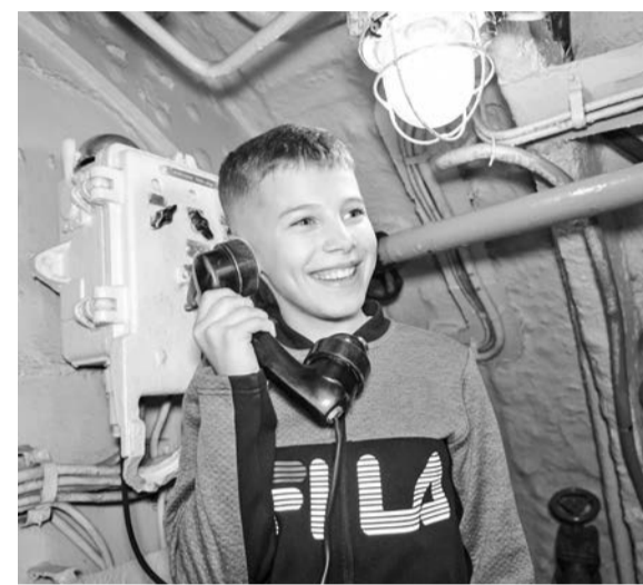
Посещение музея подлодки К-21 произвело на ребят большое впечатление.

Североморский Музейно-выставочный комплекс приглашает северян на новую однодневную экскурсионную программу для подростков и молодежи «Заякорись».