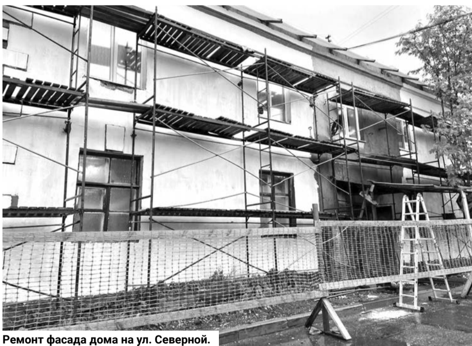
Ремонт фасада дома на ул. Северной.

Кроме того, капитально отремонтированы 124 внутри-