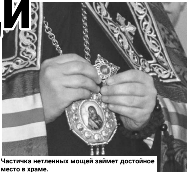
Частица нетленных мощей займет достойное место в храме.