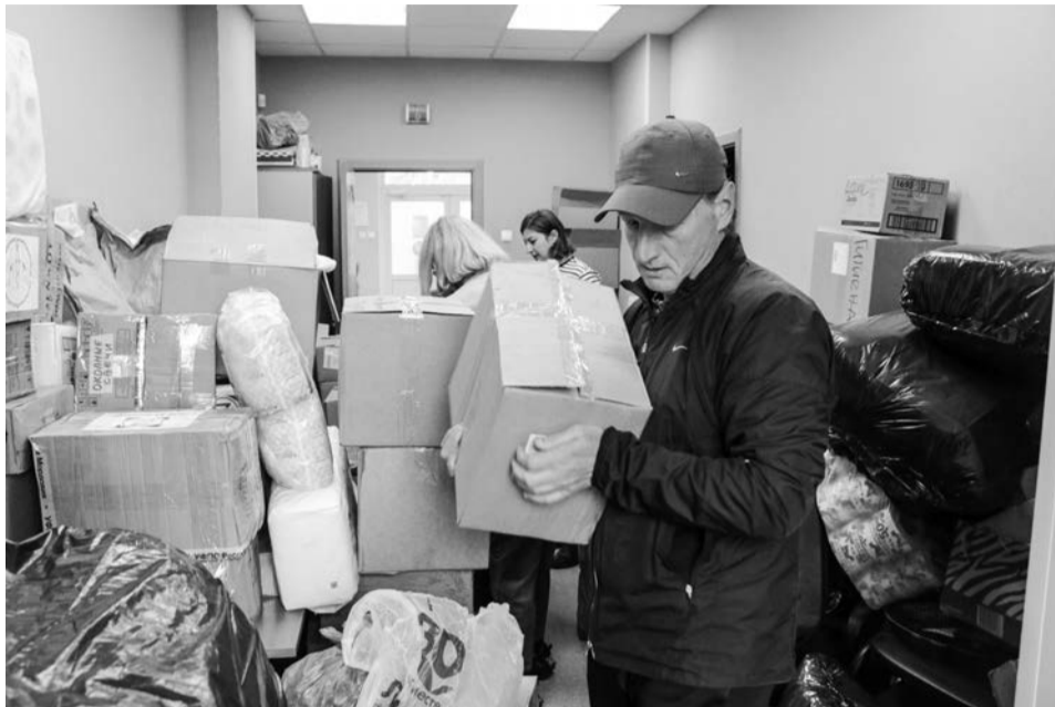
Подготовка к отправке очередного гуманитарного груза для бойцов от североморцев.

Единовременная материальная помощь в размере 400 тысяч рублей установлена для граждан, призванных на военную службу по мобилизации, военнослужащим,