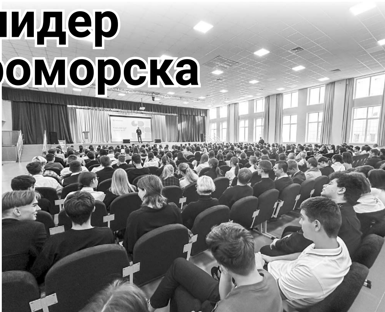
Североморские старшеклассники воспользовались возможностью узнать о работе «ВКонтакте» из первых уст, задать гостю интересные вопросы и получить ценные советы.