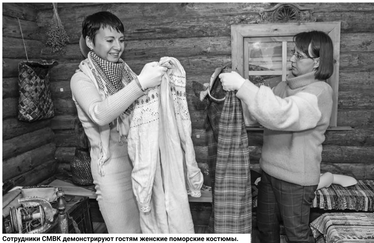
Сотрудники СМВК демонстрируют гостям женские поморские костюмы.