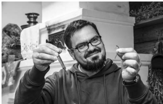
Участники фольклорной экспедиции с интересом изучали предметы рыболовного промысла.

Подготовила Анна ТВЕРДОВА.