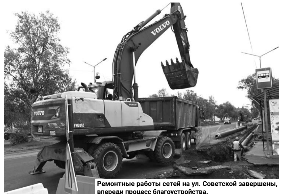
Ремонтные работы сетей на ул. Советской завершены, впереди процесс благоустройства.