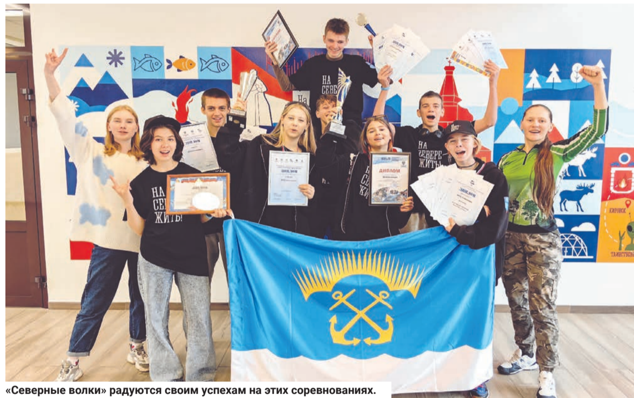
«Северные волки» радуются своим успехам на этих соревнованиях.