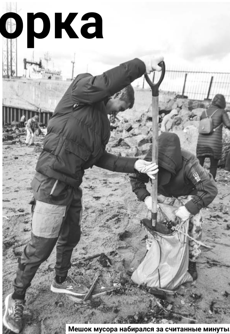
Мешок мусора набирался за считанные минуты.

В 2024 году, как и в предыдущие годы, приоритетными объектами для проведения субботника стали парки, скверы, зеленые зоны вблизи водоемов. Североморцы выбрали для работы береговую линию на Приморской площади и 20 сентября провели экологический субботник.