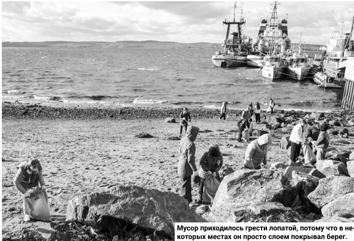
Мусор приходилось грести лопатой, потому что в некоторых местах он просто слоем покрывал берег.

Практически весь сентябрь на территории Мурманской области проходили мероприятия в рамках акции Всероссийский экологический субботник «Зеленая Россия».