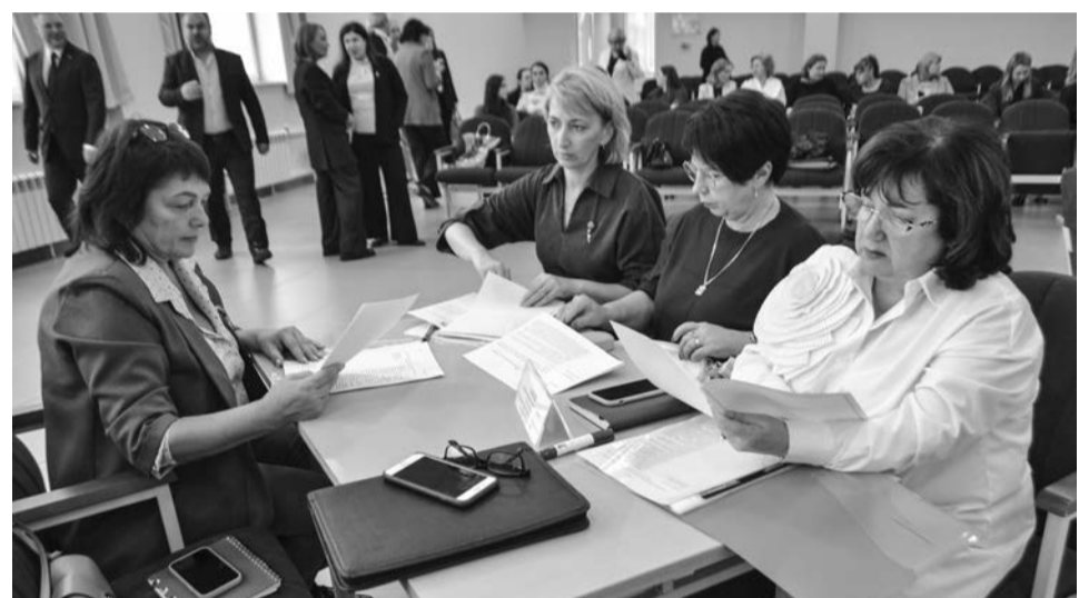
Работа в смешанных группах (воспитатели детских садов, школьные педагоги, педагоги дообразования) помогает разрабатывать профориентационные проекты, применимые на разных ступенях образования.