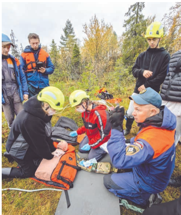
Ребята продемонстрировали навыки оказания первой помощи в полевых условиях.