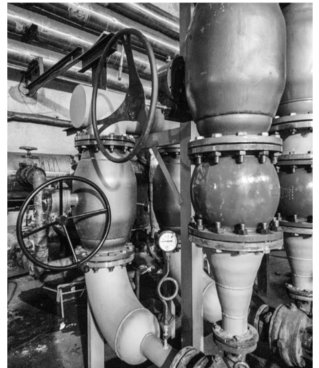
Обновленное оборудование на центральном тепловом пункте.