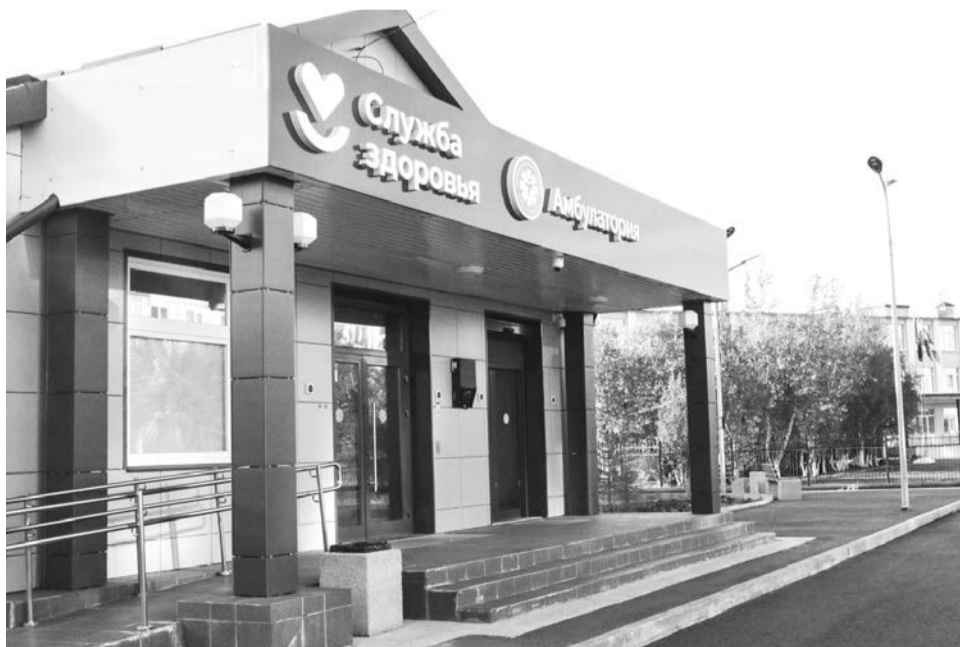
Благоустройство территории перед амбулаторией — первый из шести проектов, реализованных в нашем ЗАТО в этом году.