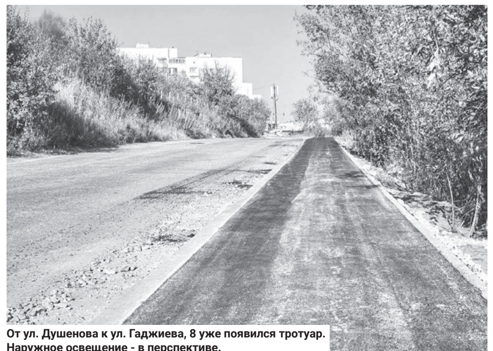
От ул. Душенова к ул. Гаджиева, 8 уже появился тротуар. Наружное освещение - в перспективе.