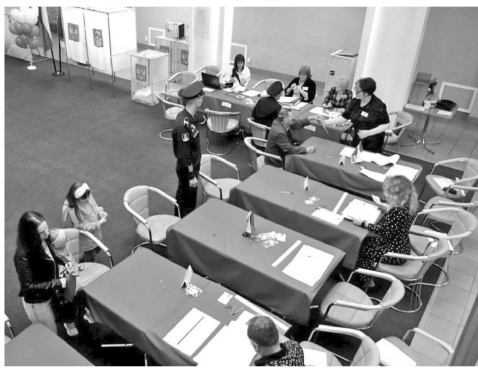
Всего на участках в ЗАТО Североморск проголосовали 14999 человек.