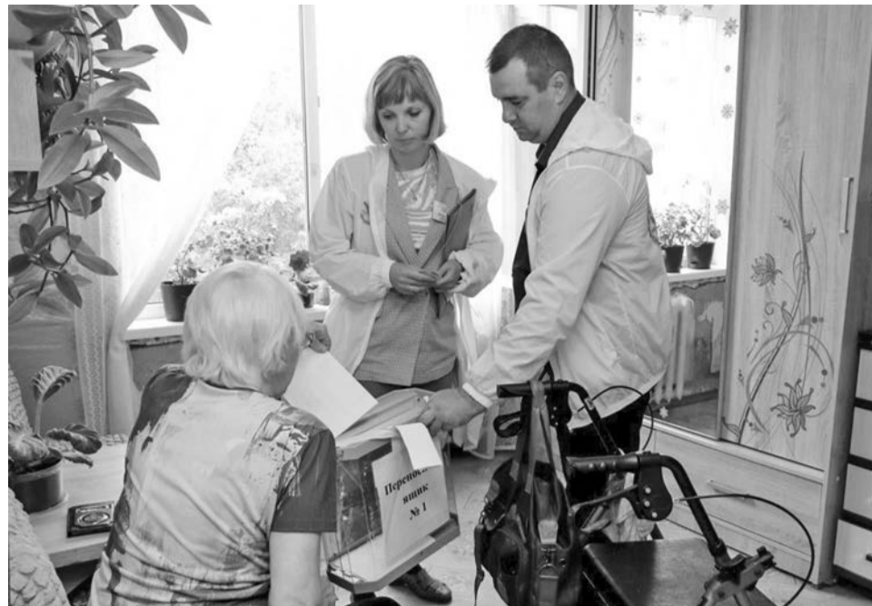
Выезд участников УИК с переносным ящиком для голосования вне участка к североморцам, которые по состоянию здоровья голосуют дома.

— Явка избирателей составила 41,59%. Победителем является действующий губернатор Мурманской области Андрей Владимирович Чибис, которого поддер-