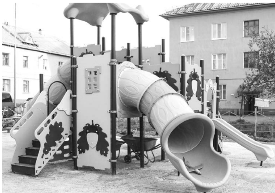
Новая площадка точно порадует детвору, вернувшуюся из отпусков.