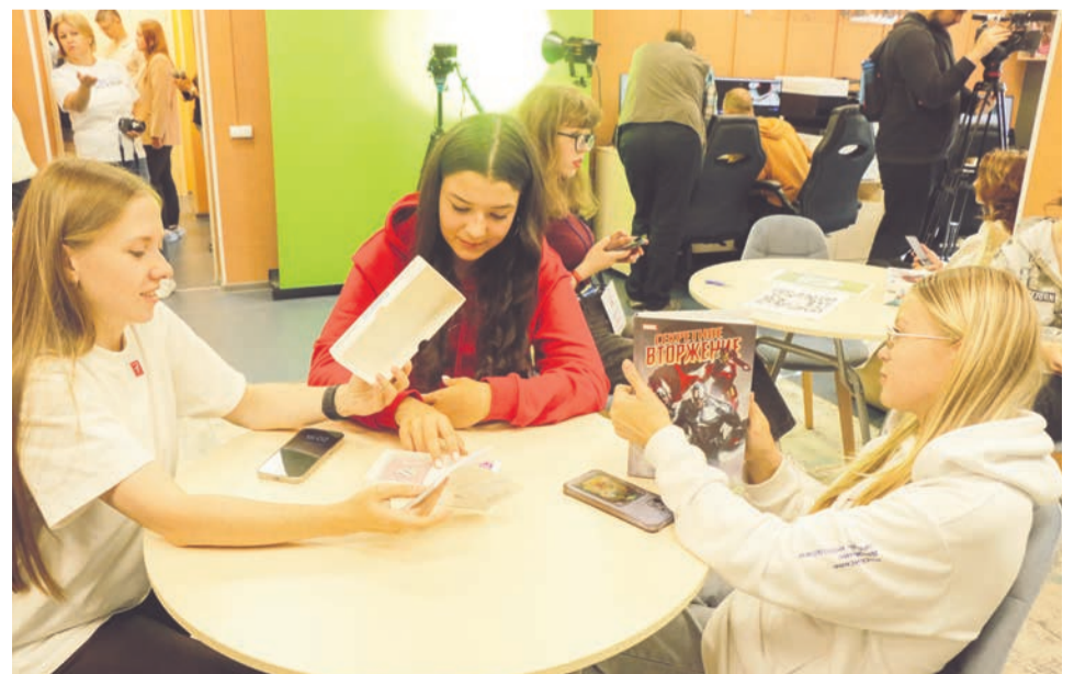
В этих «Сопках» большое разнообразие настольных игр.