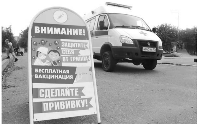
Пока сезон простуд еще не наступил, медики призывают североморцев защитить себя от гриппа в поликлинике или передвижном пункте.

— Ничего себе — сходил за хлебушком, — шутя, говорили североморцы, выходявшие из мобильного прививочного пункта, который по выходным уже две недели подряд дежурит в городе с 11.00 до 15.00: по субботам — на ул. Сафонова перед зданием администрации, по воскресеньям — неподалеку от храма Веры, Надежды, Любви и матери их Софии.