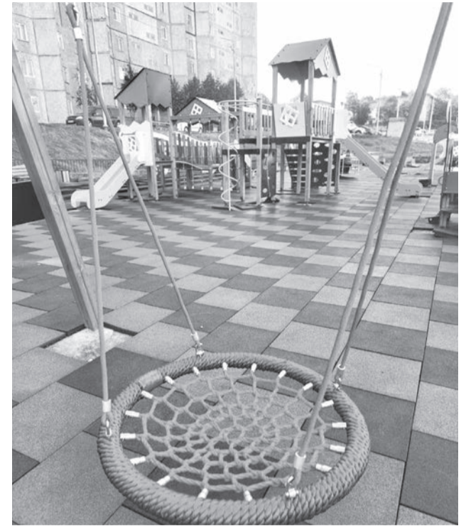
На детской площадке на Морской осталось лишь завершить установку специального покрытия.