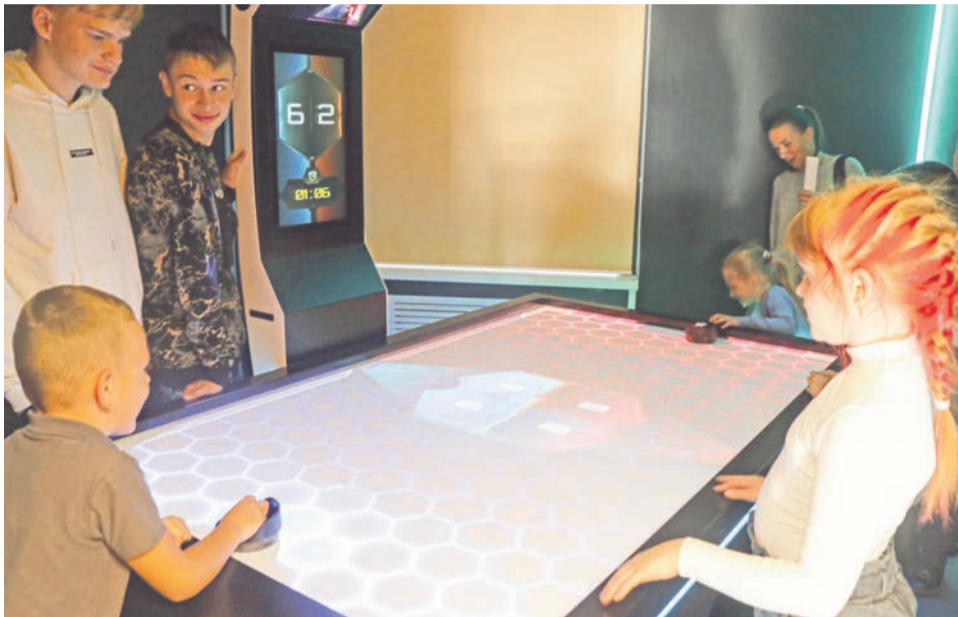
Аэрохоккей — развлечение, которое пришлось по душе всем гостям в «Сопках».

Уютно, красиво, стильно, интересно — характеристики молодежному пространству «Сопки», открывшемуся на базе библиотеки в поселке Сафоново, все его гости дают только положительные.