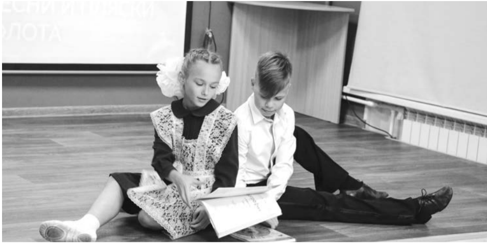
Творческий подарок от артистов детской студии Ансамбля песни и пляски СФ.