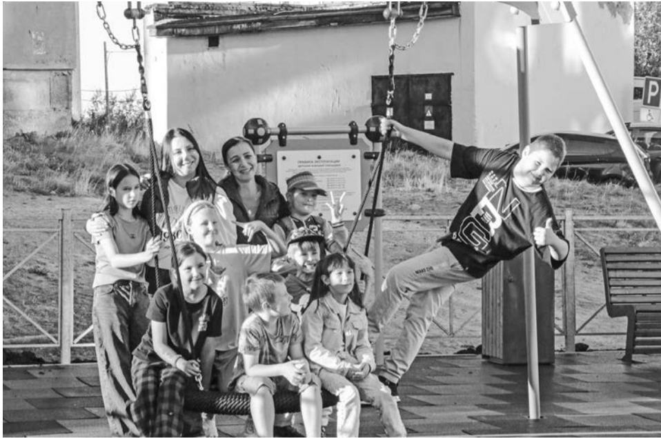
Улыбки детей — лучшая оценка проделанной работы.