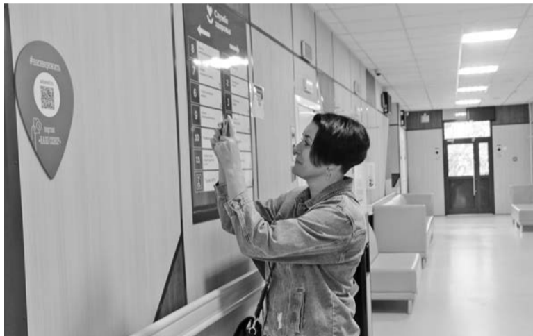
Ожидание своей очереди к врачу может стать интереснее, если отсканировать геометку.

Современные детские и спортивные площадки, преобразованные пространства в учреждениях образования, «Сопки», учреждения здравоохранения, новая коммунальная техника — вот далеко не все проекты, реализованные в рамках губернаторского плана «На Севере — жить» на территории ЗАТО Североморск. Подробнее об уже осуществленных инициативах можно узнать на портале «Наш Север».