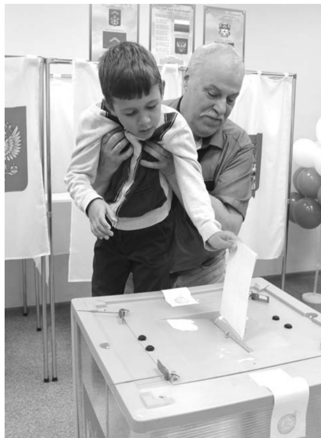
Юные североморцы, которые пока не могут голосовать, по-своему участвовали в выборах.

жали 73,99% избирателей. Это рекордный результат с момента восстановления института выборов губернаторов, — отметил Антон Богомолов.