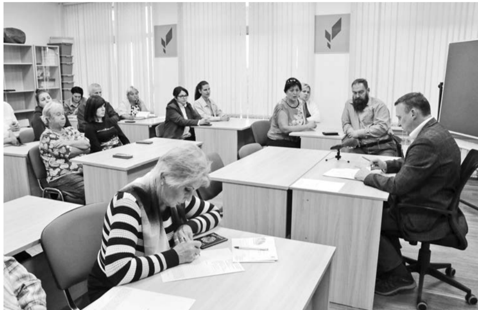
На встречу с главой ЗАТО пришли активные жители гарнизона.