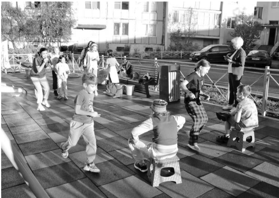
На площадке много игровых и спортивных элементов, а еще достаточно места для подвижных игр.