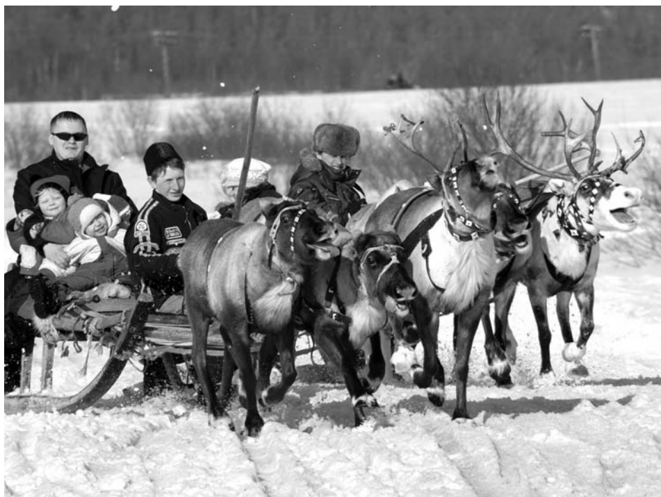
За отдельную плату пассажиром такого экипажа может стать каждый.