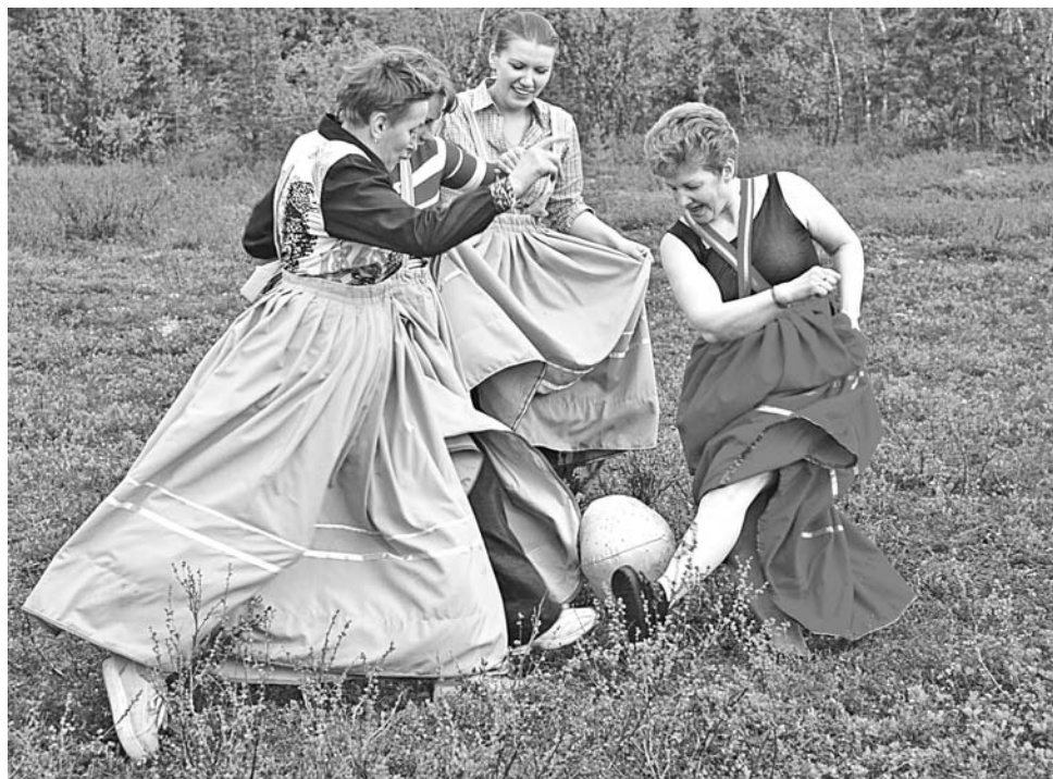
Национальный саамский футбол – игра исключительно женская.