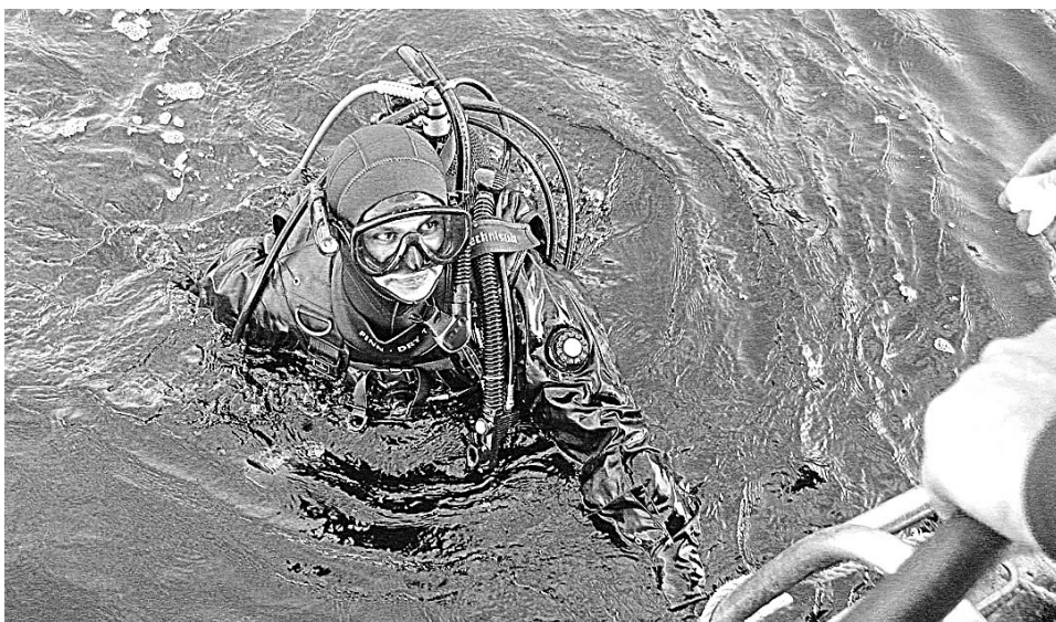
Снаряжение для погружений весит более 20 килограммов. Может поэтому, среди дайверов мало женщин.