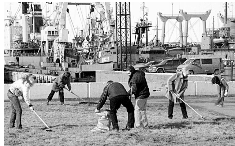
22 апреля - первый день благоустройства в городе. На Приморской площади - начало большой уборки.