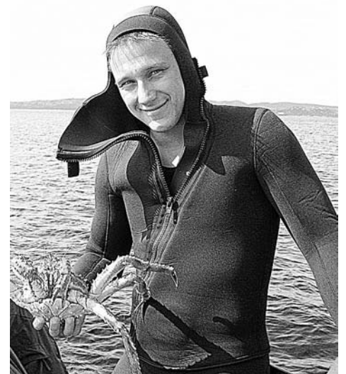
Костюм для дайвинга надежно защищает ныряльщиков от низких температур.

Дно Баренцева моря тоже очень интересно. И порой удивляет дайверов: то кровать утонувшую найдут, то шинель –