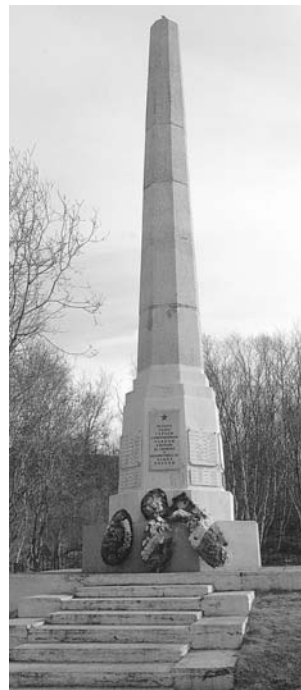
У обелиска на мемориальном кладбище часто проходят торжественные мероприятия.

Подготовила Елена ЯКУНИНА. Редакция газеты благодарит за помощь в создании материала архивный отдел администрации города и коллег из газеты «На страже Заполярья».