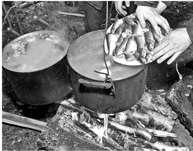
В Ловозере можно отведать тройную уху – из трех видов рыбы.