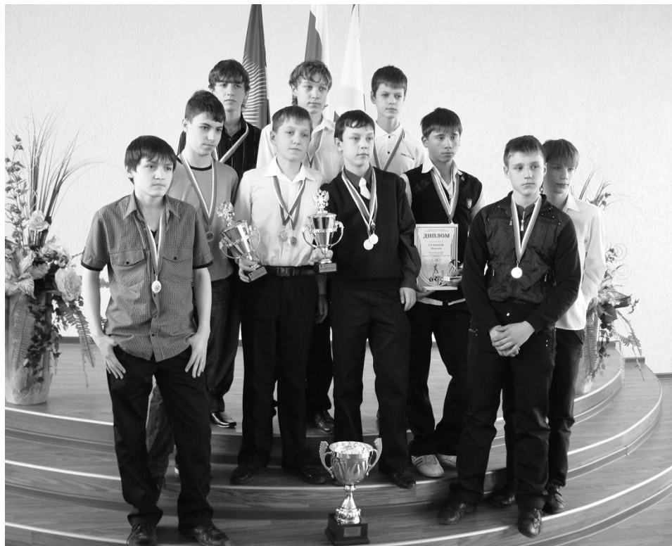
Победила молодость и сила - на пьедестале почета команда «Юность-1».