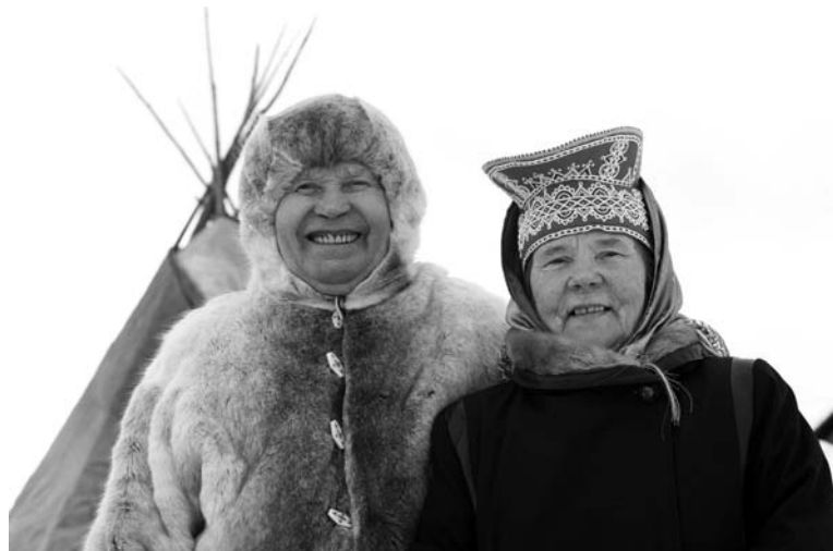
Жители Ловозера с удовольствием поведают вам о традициях саамского народа.

Два раза в год Ловозеро становится центром культурной жизни Заполярья – в конце