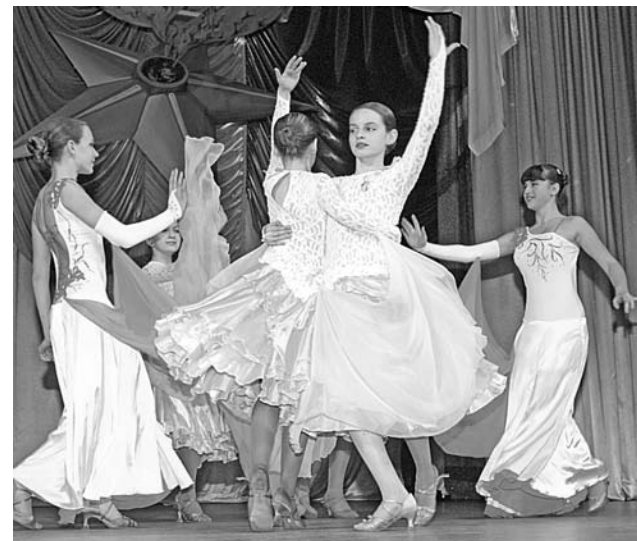
Фигурный вальс в исполнении ансамбля «Альянс-Дэнс» ДК «Строитель».